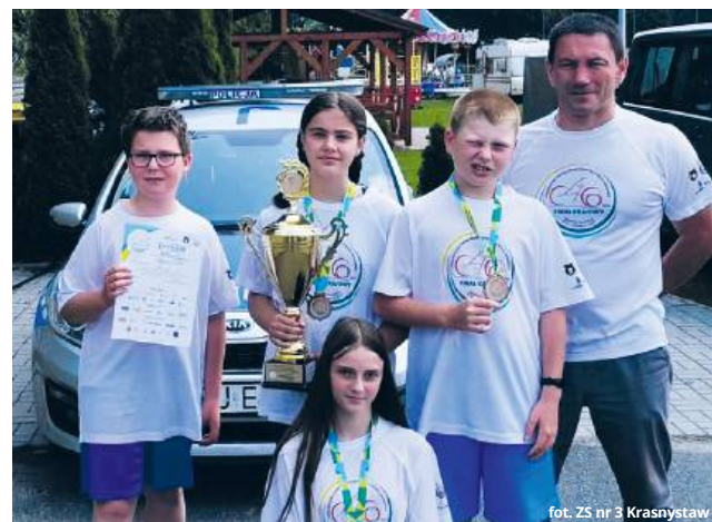
fol. ZS nr 3 Krasnostaw

Gospodarzem finału był Zespół Szkolno-Przedszkolny nr 1 w Kędzierzynie-Koźlu, który zadbał o ciepłe przyjęcie i sprawną organizację wydarzenia. W kategorii młodszej krasnostawska reprezentacja stanęła na podium obok zwycięzców z Publicznej Szkoły Podstawowej nr 18 w Kędzierzynie-Koźlu oraz Zespołu Szkolno-Przedszkolnego „Mała Szkoła” w Szopie, który zajął drugie miejsce. W grupie starszej triumfowała Szkoła Podstawowa w Nowym Kramsku.