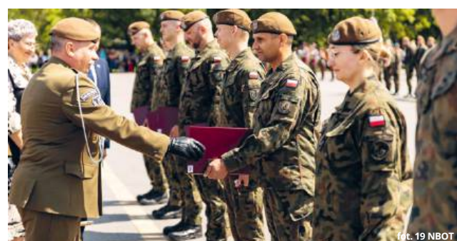
fol. 19 NBOT

19 NBOT, wspierając działania Straży Granicznej, aktywnie uczestniczy w ochronie wschodniej granicy Rzeczypospolitej Polskiej oraz w budowie bezpieczeństwa lokalnego. Jej zna-