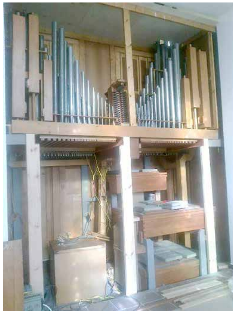
Tylna widoczna zapleczka ściana organów