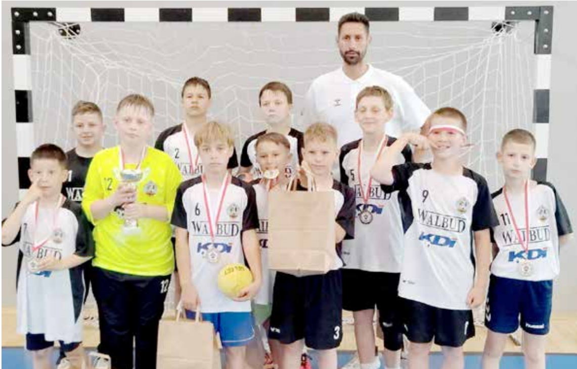
Drużyna po zakończeniu rywalizacji otrzymała puchar i medale