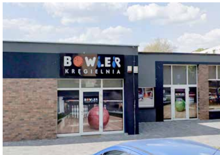
psa Kręgielnia Bowler mieści się przy ul. Kościelnej

Zamknięcie Bowlera oznacza, że na mapie Nowogardu zostanie już tylko jedna kręgielnia, która przypomnijmy otwarta została również przed czterema laty.