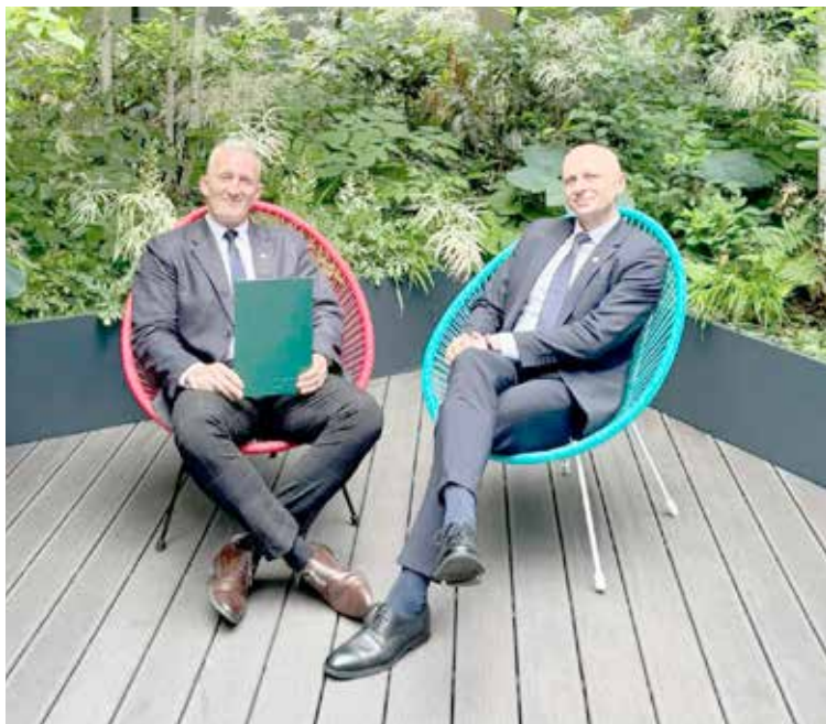
Zasłużony odpoczynek po wyjeździe do Warszawy celem złożenie podpisu - nawet ja unikający świadomie nowinek cyfrowych podpisuje obecnie ważne dokumenty profilem zaufanym.... no, ale efektu, czyli zdjęcia z Warszawy, które można wrzucić na fejsa i zrobić nim piorunujące wrażenie - niestety nie mam...

ryczna” data - 13 kwietnia czy 10 czerwca - jest bardziej „historyczna”, skoro obydwie mają to samo w treści? Wydaje się jednak w tym kontekście, że