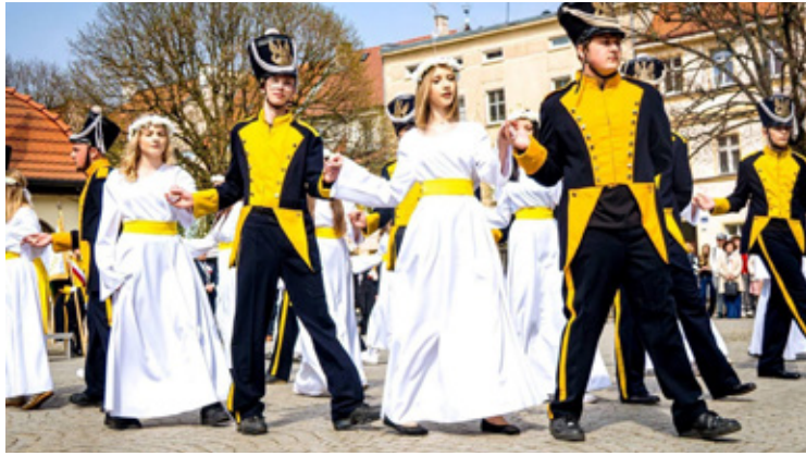
Fot. Hubert Łukaszewski