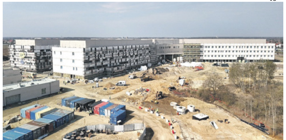
Budowa Nowego Szpitala Onkologicznego idzie pełną parą