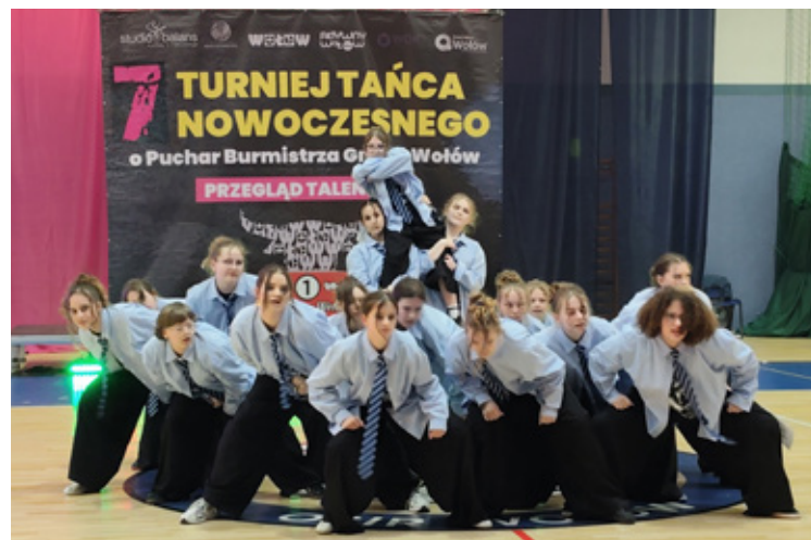
7. Turniej Tańca Nowoczesnego.

Turniej sprzed tygodnia na długo zostanie w pamięci uczestników i publiczności. Wydarzenie stało pod znakiem ogromnych emocji i zdrowej rywalizacji. Każdy występ na scenie był unikalny, a tancerze pokazali nie tylko świetne przygotowanie techniczne, ale przede wszystkim ogromne zaangażowanie i pasję do tańca. Rywalizacja odbywała się w kategoriach solo, duetów oraz formacji, z podziałem na grupy wiekowe i stopień zaawansowania.