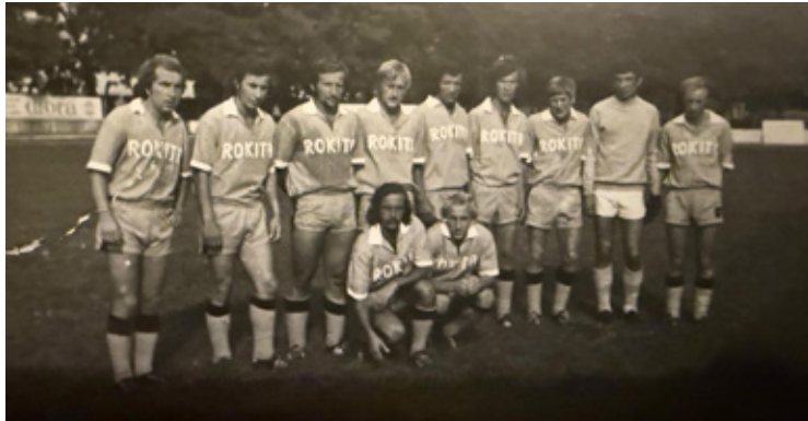
Zawodnicy Rokity - zdjęcie archiwalne z prywatnego albumu Jana Ringarta.

Już 23 maja Stadion Miejski w Brzegu Dolnym stanie się sercem sportowych emocji i rodzinnej zabawy. Nasz lokalny klub, KS Rokita 1946 Brzeg Dolny, obchodzi wyjątkowy jubileusz 80-lecia istnienia. Z tej okazji organizatorzy przygotowali huczne obchody, które połączono z radosnym świętowaniem Dnia Dziecka. To wydarzenie, którego nie może przegapić żaden mieszkaniec!