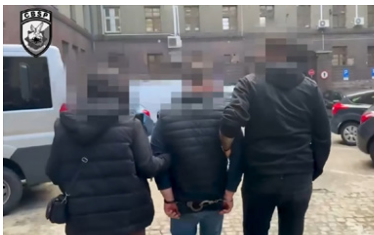
Zatrzymanie jednego z poszukiwanych.

Ich zadania obejmują: lokalizowanie osób poszukiwanych