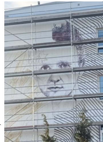
Praca nad obecnym murem trwa.

czystym płótnem dla kolejnego projektu. Tym razem, podobnie jak poprzednio, motywem przewodnim jest postać patronki