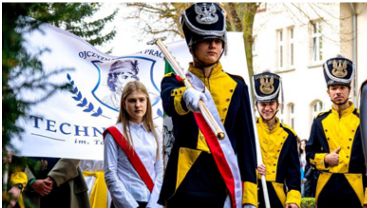
Fot. Hubert Łukaszewski