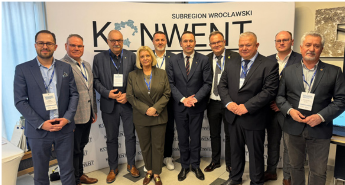
Samorząd to nie rywalizacja, to współpraca - przekonywali włodarze.