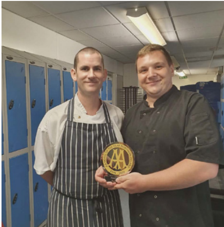
Nagroda AA z pobytu w Belfaście. Nagroda Rosette Award - jedno z najbardziej rozpoznawalnych wyróżnień dla restauracji i kucharzy w Wielkiej Brytanii.

– Stawiam na partnerstwo i szacunek. Dzieciaki naprawdę chcą pomagać i być sprawcze, tylko my, dorośli, często je wyręczamy. U mnie same przygotowują posiłki od A do Z. Największą nagrodą jest dla nich moment degustacji własnego dzieła. Co ciekawe, na warsztatach chętniej próbują nowych smaków, których nie znają z domów. Kuchnia uczy ich też dyscypliny i porządku, ale bez