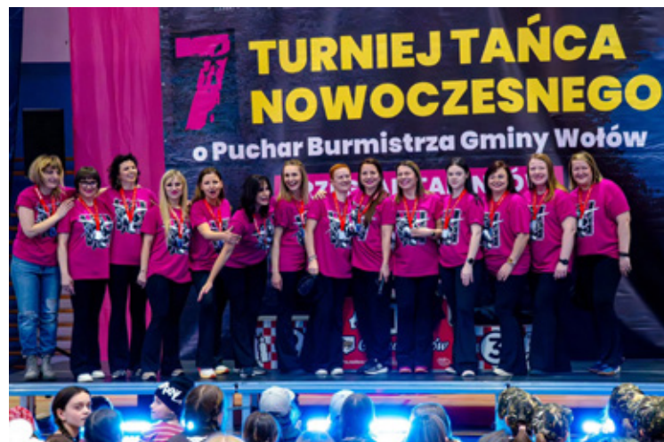
Studio Balans w natarciu.

Organizatorzy pogratulowali wszystkim uczestnikom odwagi i pasji, zapraszając już dziś na kolejne edycje tanecznych zmagania.