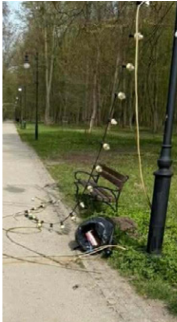
Wandale nie oszczędzili nawet oświetlenia.

Smutny widok powitał mieszkańców Brzegu Dolnego spacerujących alejkami naszych parków. Zamiast cieszyć się wiosenną aurą i budzącą się do życia przyrodą, musimy patrzeć na zdewastowaną infrastrukturę: powalone latarnie, powyrywane kosze na śmieci