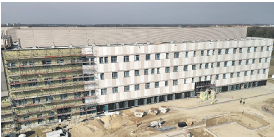
Budynki szpitala z zewnątrz będą ukończone już za chwilę