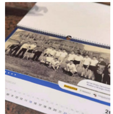
Z okazji Jubileuszu wydano limitowany kalendarz ze zdjęciami działaczy i zawodników Rokity.