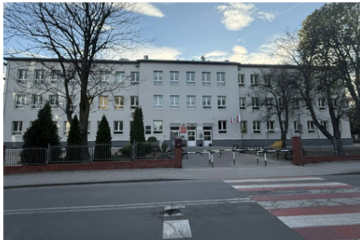
Szkoła Podstawowa nr 5.

Mieszkańcy Brzegu Dolnego doskonale pamiętają rok 2019,