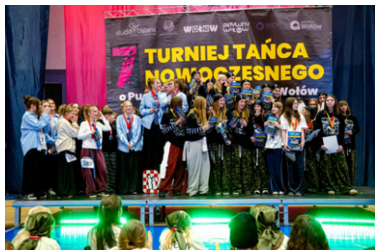
Radość i łyż u tancerzy. Emocje były duże.