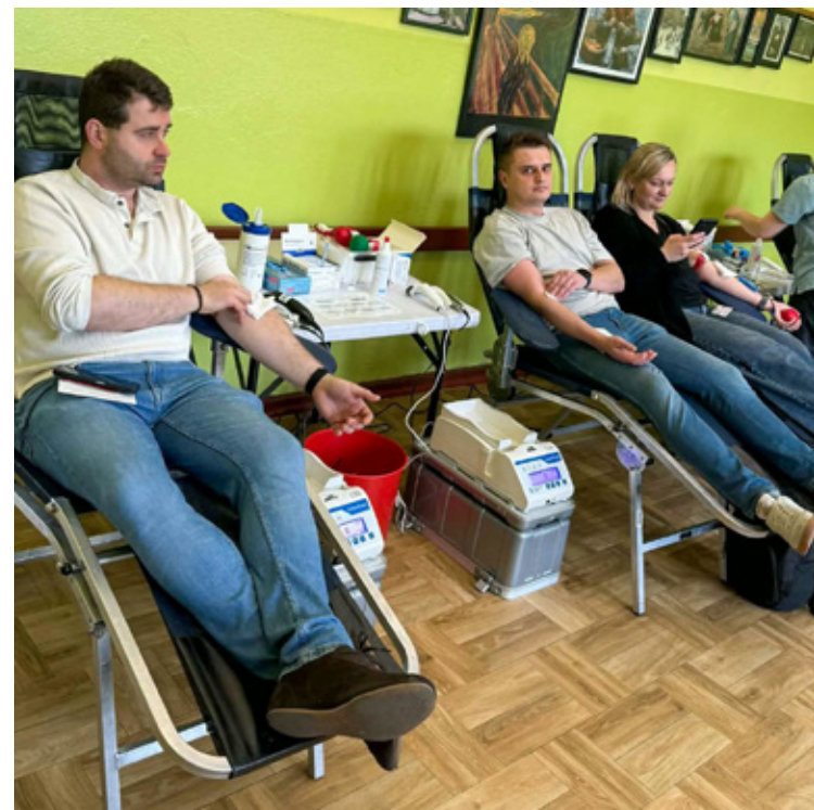
Akcja krwiodawstwa i jej uczestnicy.

Statystyki z tego dnia napawają optymizmem. Do punktu pobrań zgłosiło się 40 ochotników. Po przejściu weryfikacji medycznej i wstępnych badaniach, ostatecznie krew mogły oddać 33 osoby. Dzięki ich zaangażowaniu udało się pozyskać dokładnie 14,85 litra życiodajnego płynu. Warto zaznaczyć, że każda donacja to szansa na uratowanie