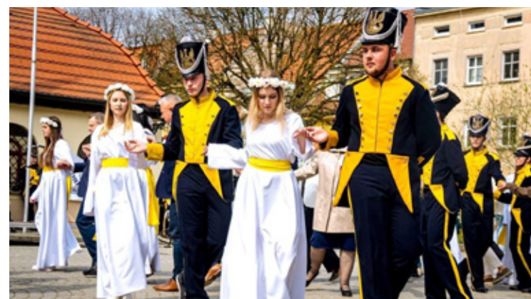
Fot. Hubert Łukaszewski