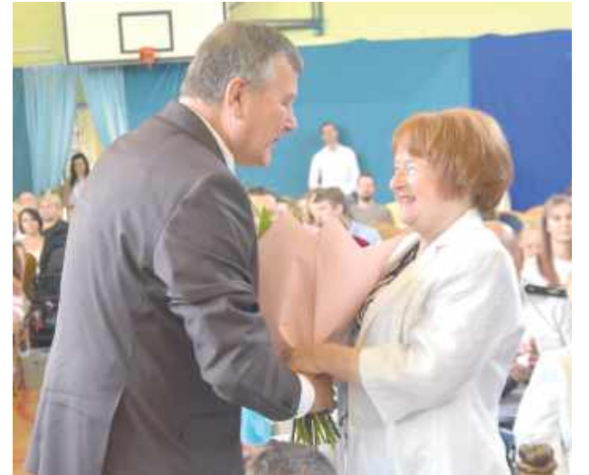
Patronka pojawiła się osobiście i została uhonorowana kwiatami