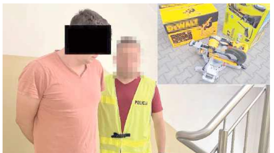
Wszystkie skradzione przedmioty udało się odzyskać. 28-latek usłyszał już zarzuty kradzieży mienia o łącznej wartości około 10 tysięcy złotych

- Dzięki szybkim działaniom funkcjonariuszy udało się ustalić tożsamość sprawcy. Okazał się nim 28-letni mieszkaniec