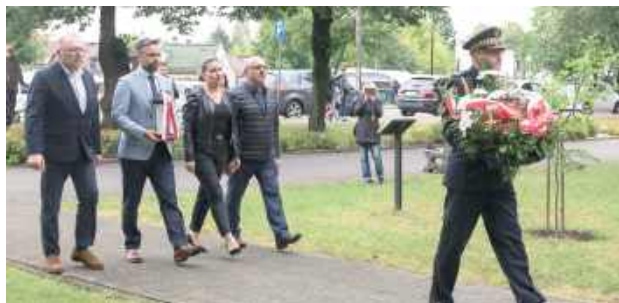
Składanie kwiatów pod Pomnikiem Sybiraków

Przypomniano, że w latach 1939–1946 nacjonaliści ukraińscy z Organizacji Ukraińskich Nacjonalistów (OUN), Ukraiń- skiej Powstańczej Armii (UPA) oraz innych ukraińskich formacji