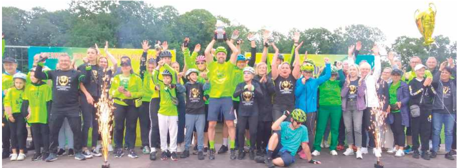
Superpuchar poszedł w górę, ognie też strzeliły

Paradę prowadzili solidnie hałasujący bębniści wieżeni w rowerowych riksach.