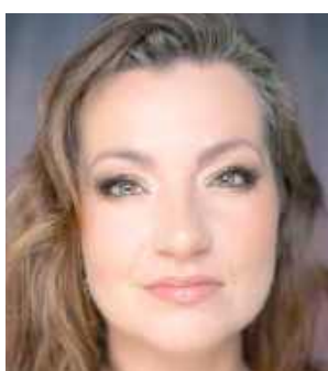
Paul rzeczniczka Czystej Gminy Janów Podlaski STOP Biogazowni

Wielu janowian nie chce przykrych zapachów z biogazowni, niszczenia dróg i uciążliwego przemysłu. Kiedy nie były skuteczne petycje z 3125 podpisami o odstąpienie od wizji budowy biometanowni, protestujący zauważyli, że