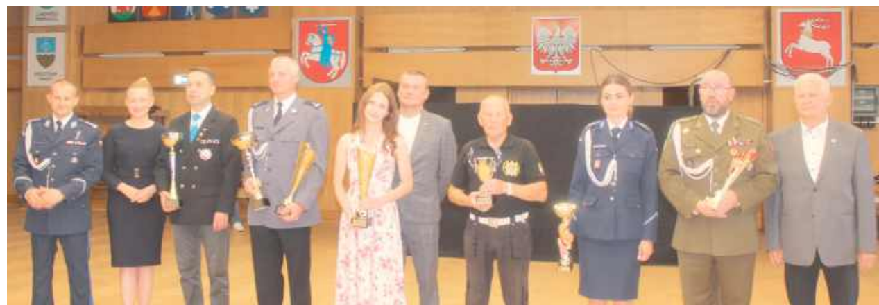
Zwycięcy Turnieju Strzeleckiego z pucharami oraz organizatorami zawodów

iż w 2024 roku dzięki wsparciu finansowemu m.in. samorządów powiatowych i gminnych było możliwe zakupienie aż pięciu nowych samochodów i nowego sprzętu.