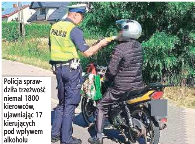
Policja sprawdziła trzeźwość niemal 1800 kierowców, ujawniając 17 kierujących pod wpływem alkoholu

Biała Podlaska: Pijana 48-latka, która jechała z trzeźwym pasażerem czy 34-latek na „podwójnym gazie” kierujący motocyklem, który nie był zarejestrowany ani ubezpieczony - to niektóre przypadki kierowców zatrzymanych do kontroli podczas akcji „Trzeźwość”.