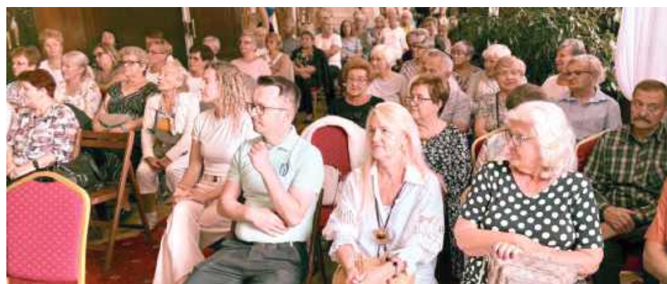
Wydarzenie cieszyło się dużym zainteresowaniem

Nagrodę przyznaje Ogólnopolski Głos Seniora. Podczas wydarzenia zaprezentowano