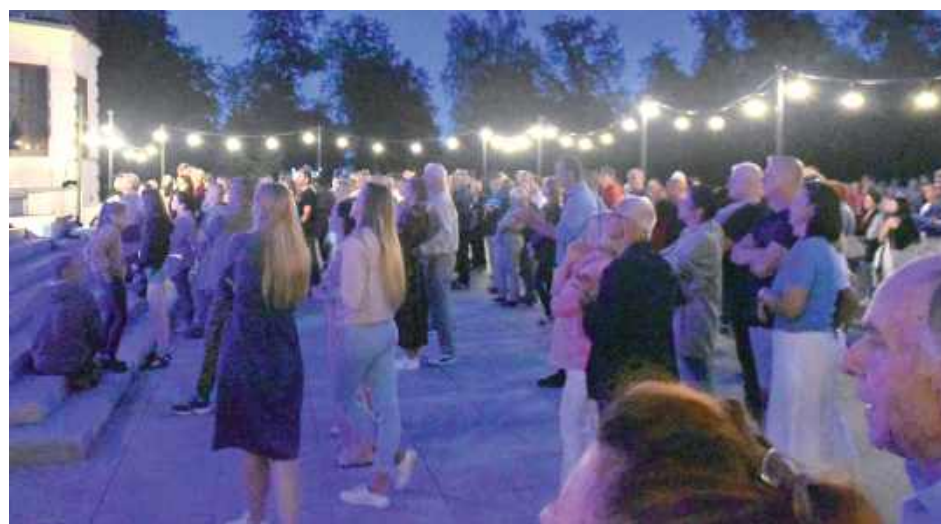
Mieszkańcy chętnie brali udział w potańcówce

Międzyrzec Podlaski: Sobota i niedziela upłynęły pod znakiem szampańskiej zabawy z okazji Dni Międzyrzecza 2025.