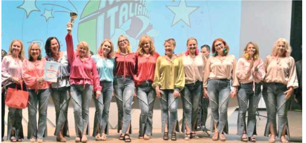
„Chwilka na Szpilkach” w siódmym niebie, czyli z pierwszą nagrodą w Rimini

Wyjazd do Włoch był możliwy dzięki wsparciu głównie