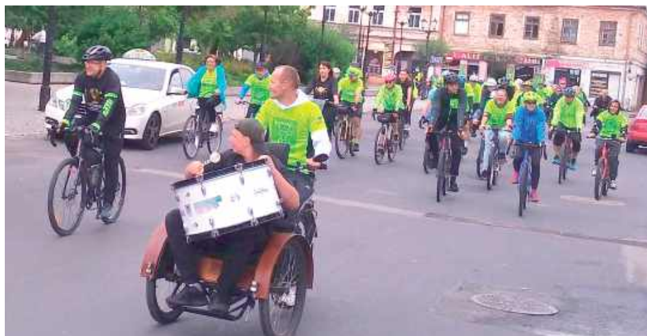
Rowerowa parada mistrzów i bębniastów