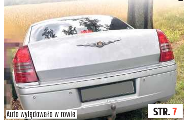
Auto wylądowało w rowie