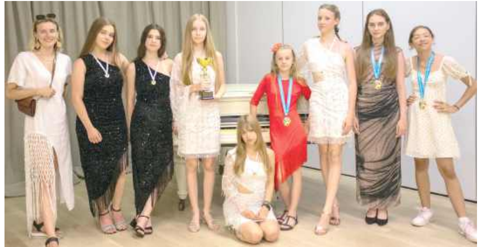
Nagrodzone wokalistki z „Chwilki”