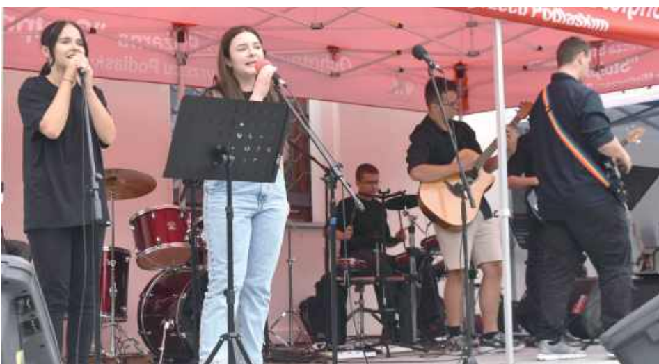
Zespół Deep Desire wprowadził mieszkańców w muzyczny nastrój

Krew oddaję pierwszy raz. Pragnę pomóc, chcę się nią podzielić z tymi, którzy potrzebują jej, by przeżyć. Najbardziej motywuje mnie właśnie chęć pomocy. Nie jestem zresztą sama, razem ze mną po raz pierwszy w akcji udział bierze mój mąż. Bardzo się cieszę, że w Międzyrzeczu można skorzystać z takiej okazji. Nastawiamy się, że to nie ostatni raz.