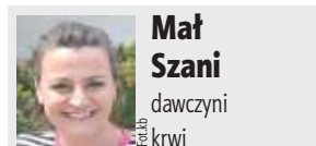
Mał Szani dawczyni krwi