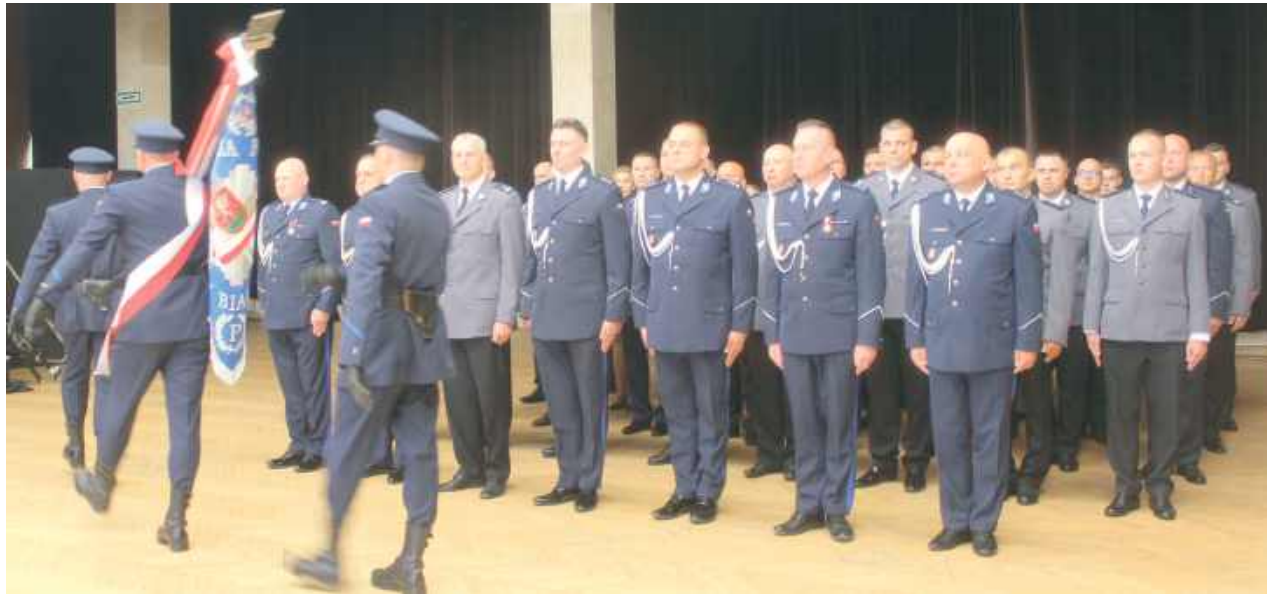
Podczas uroczystości duża grupa policjantów otrzymała nominacje

Gratulował odznaczonym i awansowanym. Szczególnie dziękował współpracującym z policją służbom, instytucjom oraz samorządom. Zaznaczył,