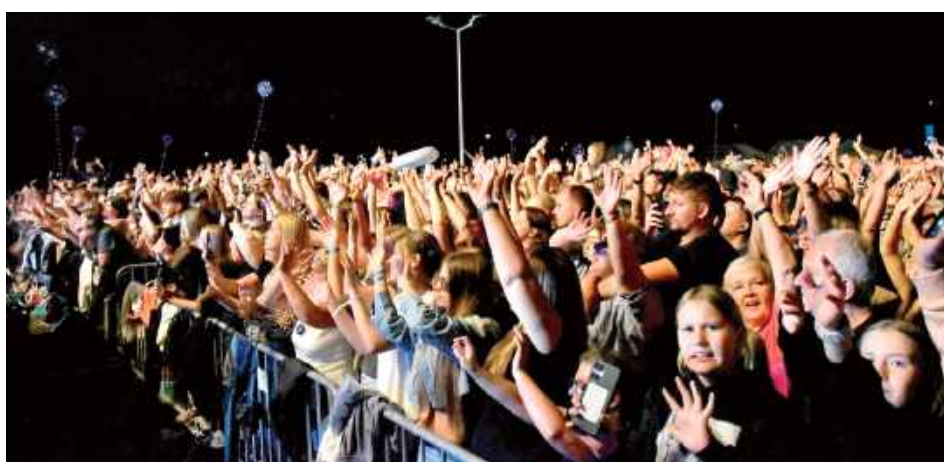
Część koncertowa przyciągnęła wielu widzów z Międzyrzecza i okolic

W niedzielę o godz. 9.45 rozpoczął się Turniej Siatkówki