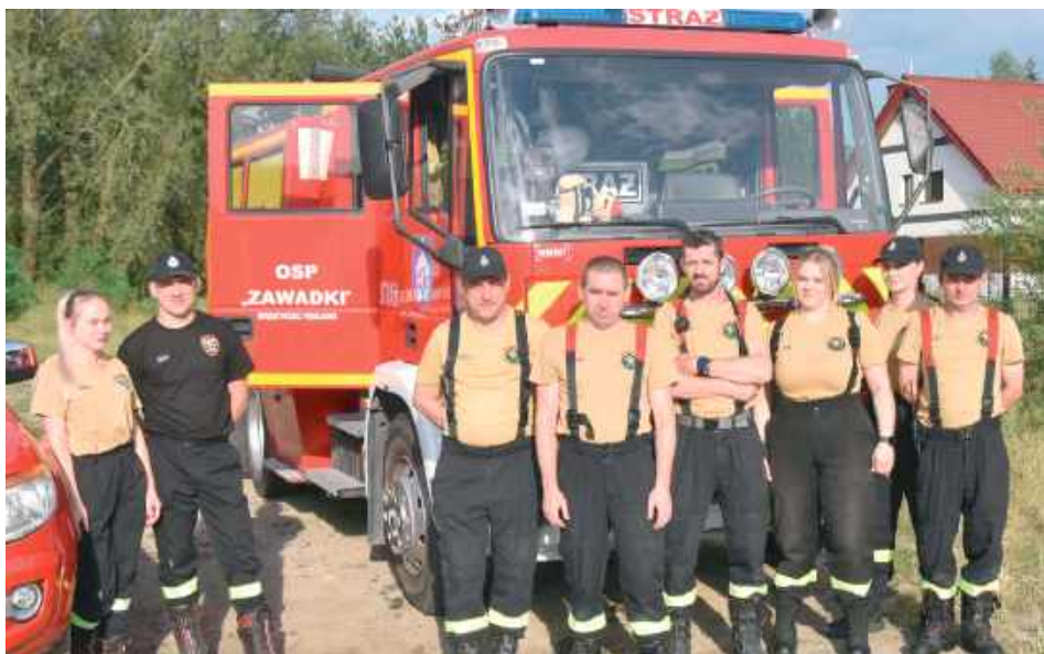
Wydarzenie zabezpieczali niezawodni strażacy z lokalnych OSP