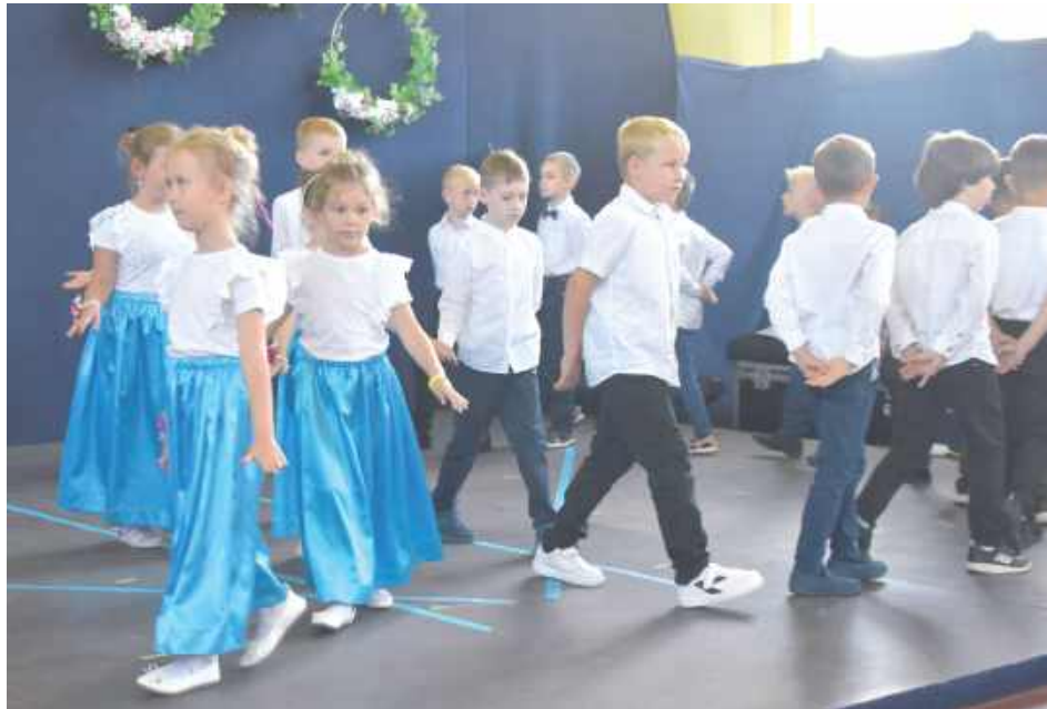
Przedszkolaki chętnie występowały przed patronką