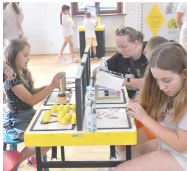
Wystawa „O matmo!” zachęca do samodzielnego poznawania tajników matematyki