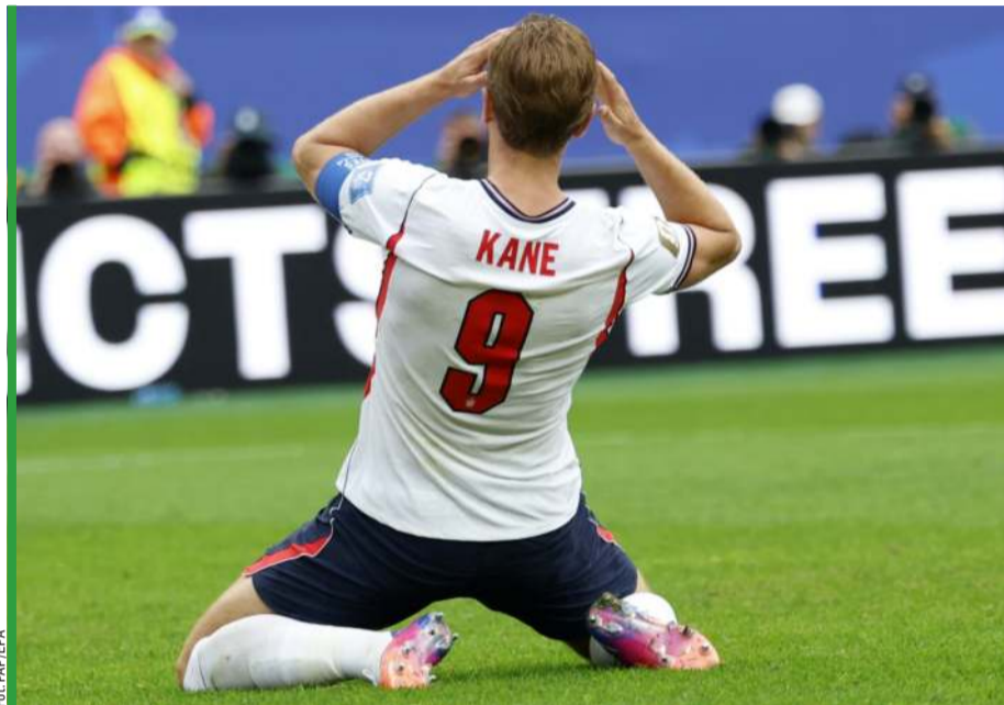
To nie jest radość Henry'ego Kane'a. To jego rozpacz po setce zmarnowanej w meczu z Ghaną.

Sęk w tym, że trzeba mieć na skrzydłach graczy takich jak Michael Olise i Luis Diaz, obsługujących perfekcyjnie Kane'a. Tuchel wierzył