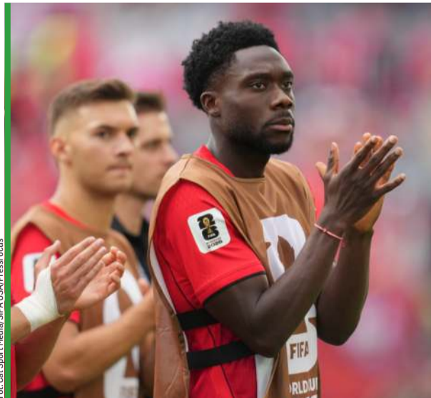
Tym razem Davies ma być gotowy do gry! Przynajmniej według oficjalnych doniesień...

Kanada w fazie play off chce użyć swojej tajnej broni, jaką jest Alphonso Davies. Nie wiadomo jednak, czy jej selekcjoner... znowu nie ściemnia!