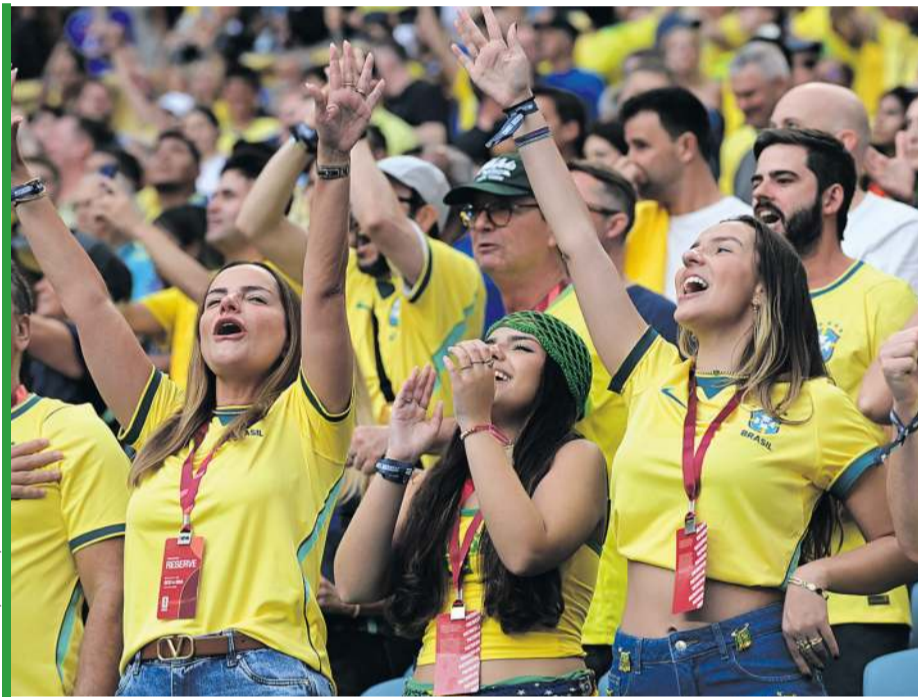
Brazylijskie fanki wierzyć będą w tę drużynę zawsze.

- Kto jak nie on? Po długo prowadzącym Brazylię Tito drużyna narodowa miała w krótkim okresie aż trzech szkoleniowców, którzy nie dali rady - Ramona Menezesa, Ramona Diniza i Dorivala Juniora. Ancelotti? Ewidentnie wie co robi. Praca w Brazylii dała mu nowe perspektywy, w futbolu klubowym osiągnął przecież wszystko. Charakterystyczne, że od początku pracy w Brazylii przetestował wielu piłkarzy, na mundial zabrał jednak aż 15 zawodników, którzy grali na poprzednich nieudanych dla Brazylii mistrzostwach. To o czymś świadczy. Ancelotti ceni doświadczenie,