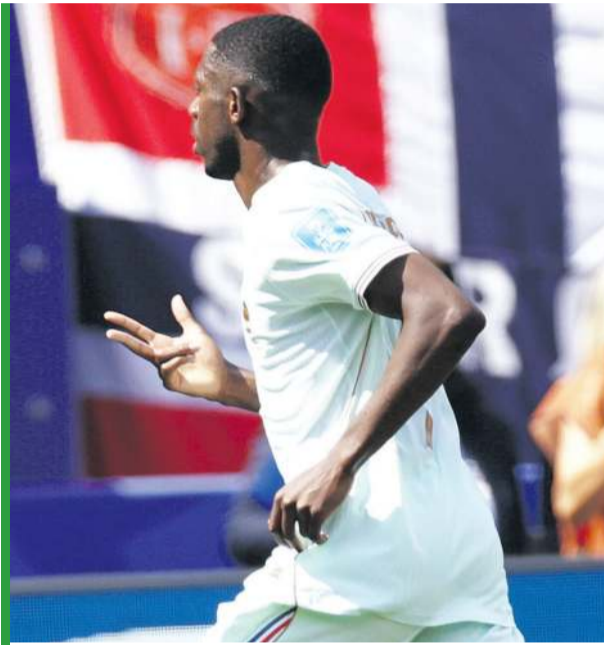
Ousmane Dembele na palcach pokazuje ile bramek strzelił Norwegom.

Wracając na boisko - mogliśmy być świadkami najszybszego gola na XXIII MŚ, ale piłka po strzale Kyliana Mbappe wylądowała na poprzeczce... Była 23 sekunda. Francuzi z miejsca przejęli inicjatywę, atak sunął za atakiem, a stosunek posiadania piłki wynosił 80 do 20. Stąd nic dziwnego, że po kilku minutach było 1:0. Na listę strzelców wpisał się Ousmane Dembele po zna-