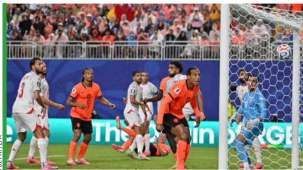
Bramka Jana Paula van Hecke (leży) pieczętuje zwycięstwo Holandii z Tunezją.

W 1/16 finału podopieczni Ronalda Koemana zmierzą się z Marokiem. - Chciałoby się ro-