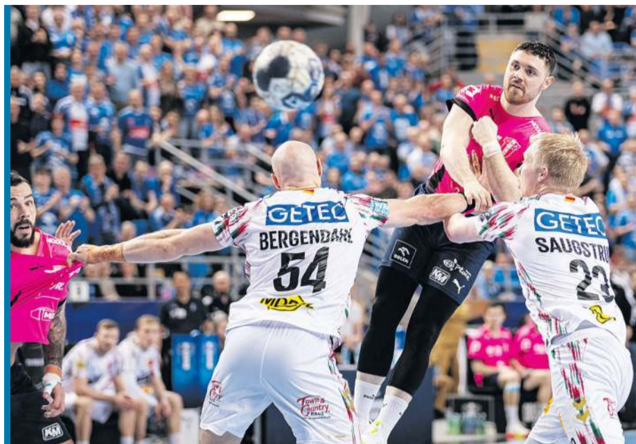
Silni przeciwnicy to ucztą da kibiców - tak można powiedzieć o rywalach mistrza i wicemistrza Polski w kolejnej edycji EHF Champions League.