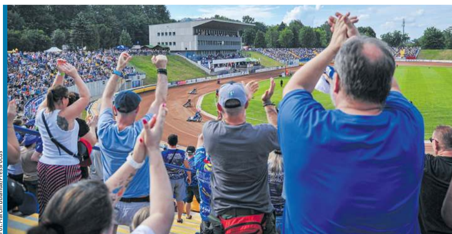
Apetyt kibiców w Świętochłowicach urósł....