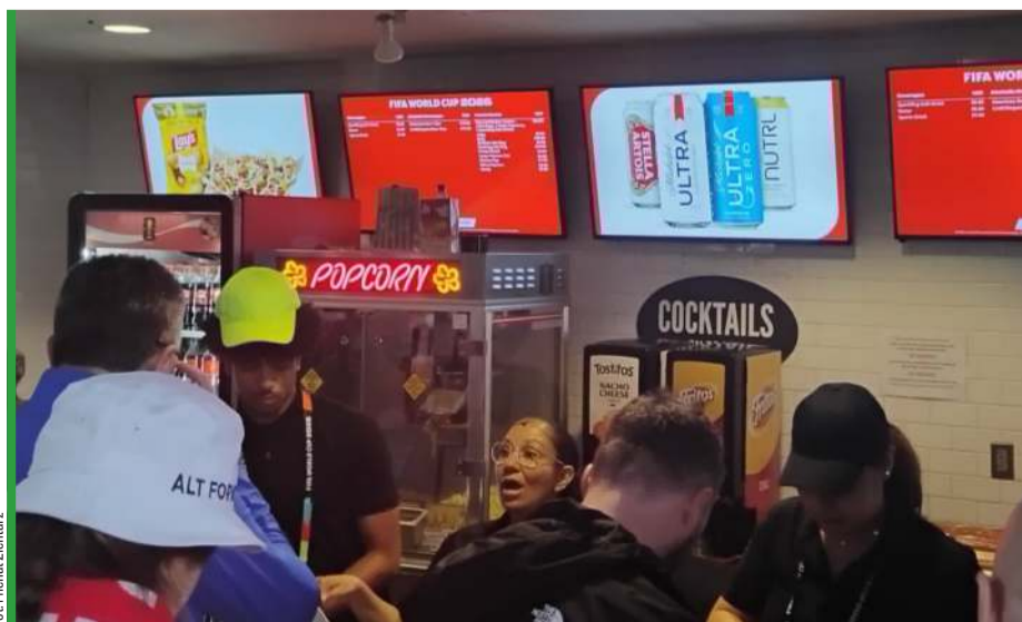
Drogo, ale jeść trzeba. Kibice zostawiają tu tysiące dolarów.