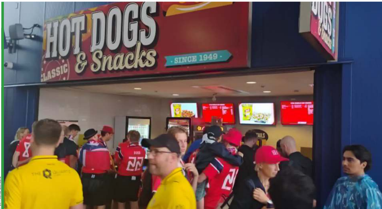
Hot dogi po 50 złotych? Takie są ceny na stadionach w Ameryce.