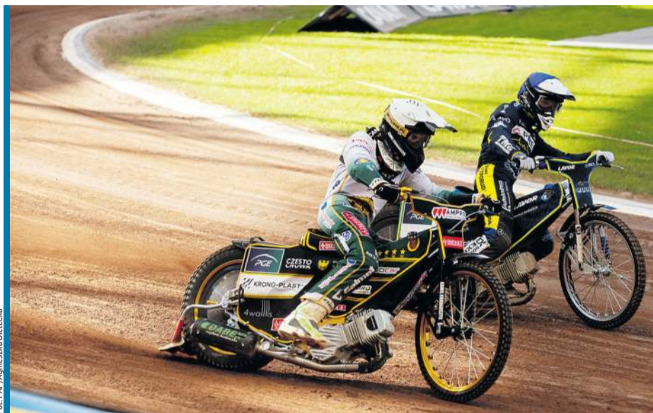
Włókniarz został pozbawiony złudzeń.