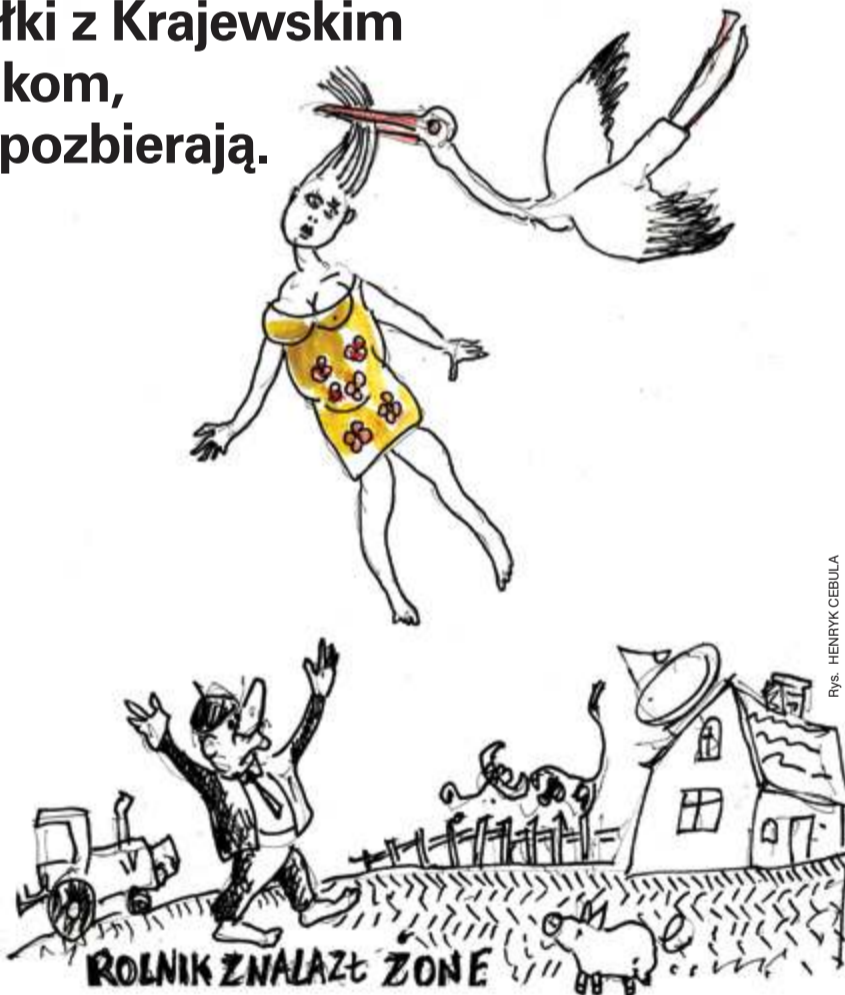
Rys. HENRYK CEBULA

W kraju nad Wisłą brakuje systemowych mechanizmów chroniących