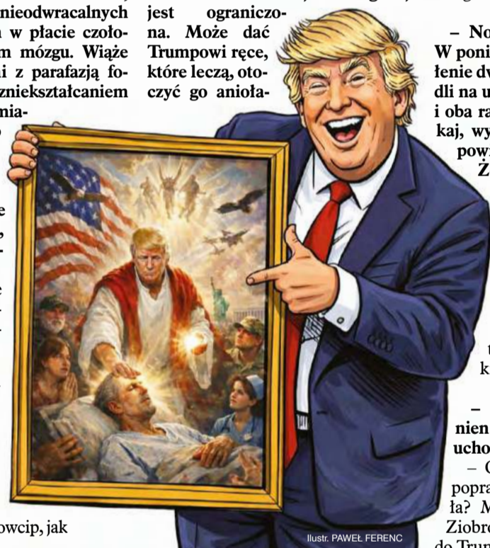
ilustr. PAWEŁ FERENC