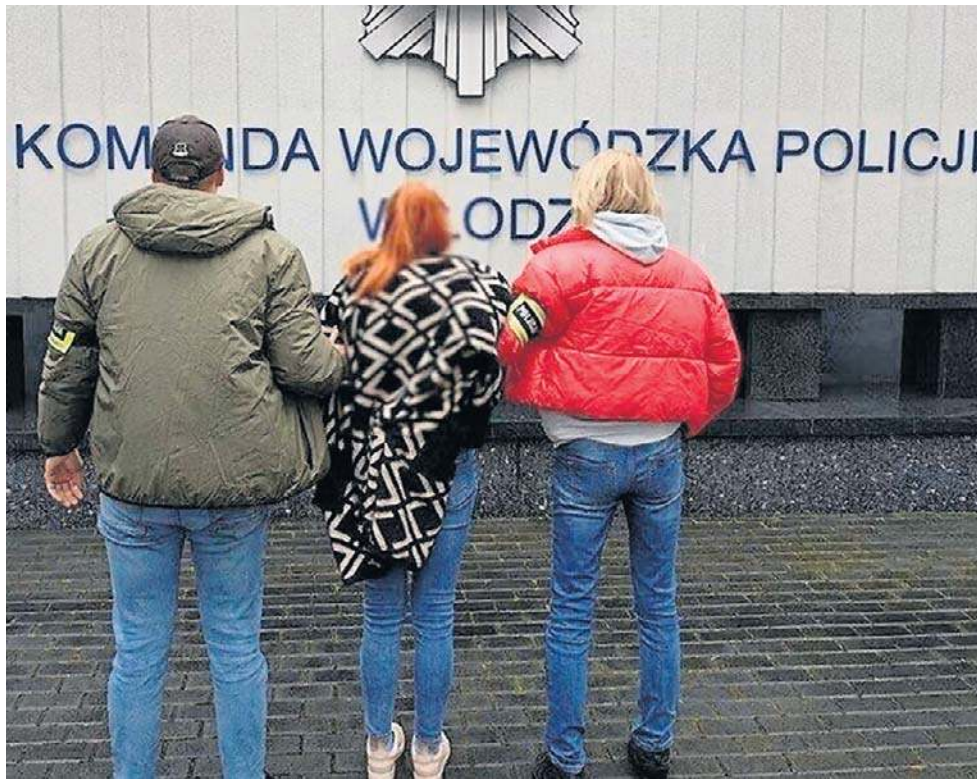
Sprawa ujrzała światło dzienne, gdy łódzka policja poinformowała o zatrzymaniu 14 osób

Jak ustaliliśmy, w Legnicy chodzi o nieistniejącą już, niepubliczną szkołę Educross, która działała przy ul. Biskupiej. Reklamowała się jako szkoła dla dorosłych, oferująca m.in. naukę w darmowym, zaocznym liceum oraz policealnej szkole medycznej.