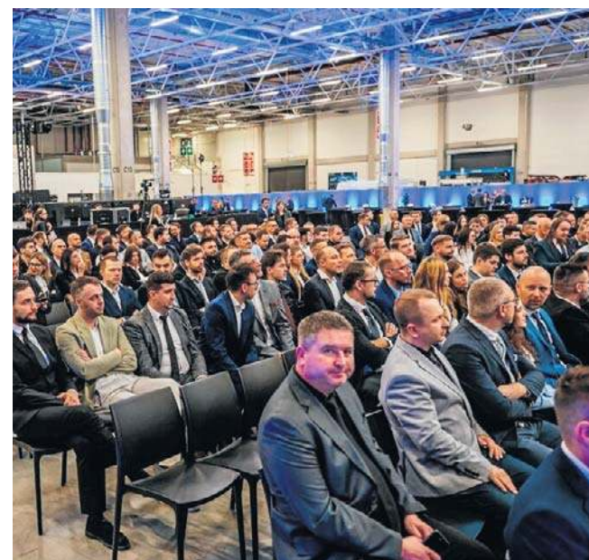
Spotkanie odbyło się 5 listopada

W 2017 r. rozpoczęły się prace budowlane, w 2019 r. zakład rozpoczął produkcję nowoczesnych silników, rok później uruchomił linię montażu