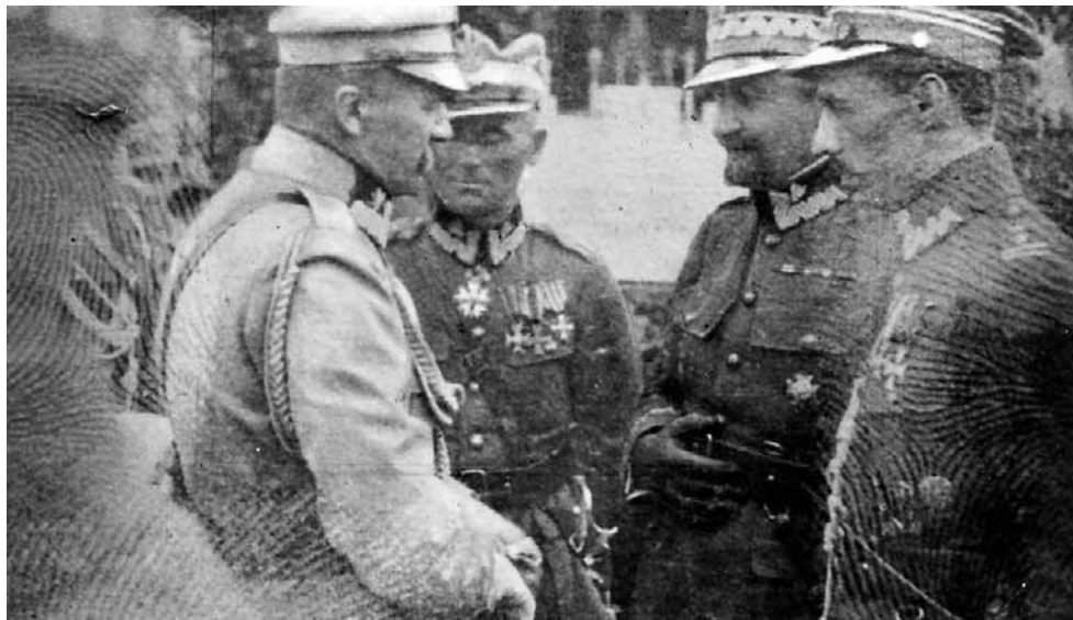
Józef Piłsudski rozmawia z adiutantem ppłk. Bogusławem Miedzińskim (pierwszy z prawej), gen. Tadeuszem Rozwadowskim (w środku) i gen. Edwardem Śmigłym-Rydzem (stojącym obok marszałka). Rok 1922

Amerykańskie podziękowanie za Tadeusza Kościuszkę. 7. Eskadra Myśliwska im. Tadeusza Kościuszki składała się z 21 lotników - ochotników ze Stanów Zjednoczonych oraz kilku lotników polskich. Jej zaczątki sformowano w Krakowie, lotnicy latali na austriackich samolotach myśliwskich Albatros D. III (Oef) i zajmowali się głównie lotami rozpoznawczymi i szturmowymi, w których dali