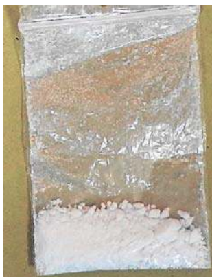
W opalu znaleziono metamfetaminę

- Jak ustalili funkcjonariusze, mężczyzna pojawił się pod komendą, ponieważ... przywiózł ubrania koledze, który wcześniej został zatrzymany za posiadanie narkotyków. Ostatecznie sam dołączył do niego w areszcie - informuje asp. Anna Tersa z legnickiej policji.