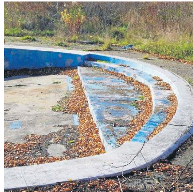
Niecki basenowe są splekane, nie nadają się do eksploatacji