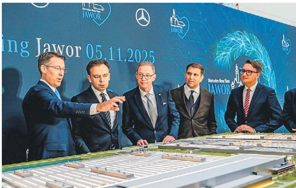
Uroczystość zawieszenia tradycyjnej wiechy była okazją do prezentacji projektu

- Dla nas najważniejsze jest to, że Mercedes-Benz konsekwentnie inwestuje w naszym mieście, nawet w tak wymagającym czasie dla światowej branży motoryzacyjnej. Wie-