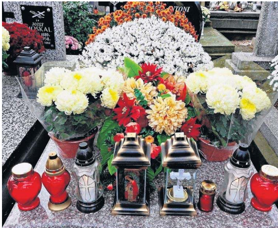
Wiele osób zupełnie nie zdaje sobie sprawy, jakie konsekwencje dla bliskich może mieć brak uregulowania za życia swoich spraw finansowych i spadkowych.

SPISANIE TESTAMENTU I ROZMOWA O FINANSACH OGRANICZY RYZYKO WYZWAŃ, Z KTÓRYMI RODZINA BĘDZIE MUSIAŁA ZMIERZYĆ SIĘ W PRZYSZŁOŚCI.