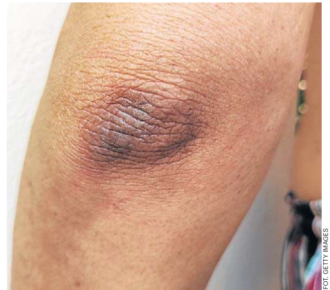
Ciemne plamy na łokciach to często oznaka choroby

Jeszcze droższe są „dwójki” bez łazienki i z łazienką, a najdroższe właśnie „jedyńki”. Obecnie za jeden dzień w pokoju jednoosobowym z łazienką poza sezonem (październik - kwiecień) płaci się 32,60 zł. Za cały trzytygodniowy turnus zapłacisz więc dodatkowo 685 zł. Pokój bez łazienki kosztuje mniej, 24,90 zł, czyli 523 zł za cały turnus.