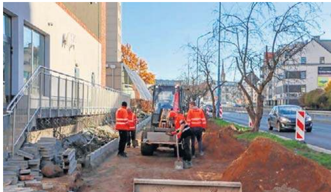
Ścieżka z Kopernika do centrum będzie miała około 920 metrów długości

Inwestycja jest realizowana w formule zaprojektuj i wybuduj. Umowny koszt to ok. 3,4 mln zł. Wykonawca ma 7 miesięcy na realizację zadania.