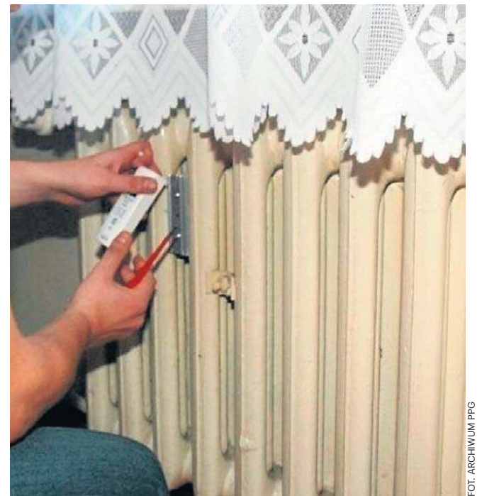
Cena ciepła z WPEC wynoszą dla miasta Legnicy mniej niż 170 zł za 1 GJ energii cieplnej

Mieszkańcy miejscowości w całym kraju, którzy mogą ubiegać się o boni ciepłowniczy, mogą liczyć na wsparcie finansowe w wysokości 500 zł