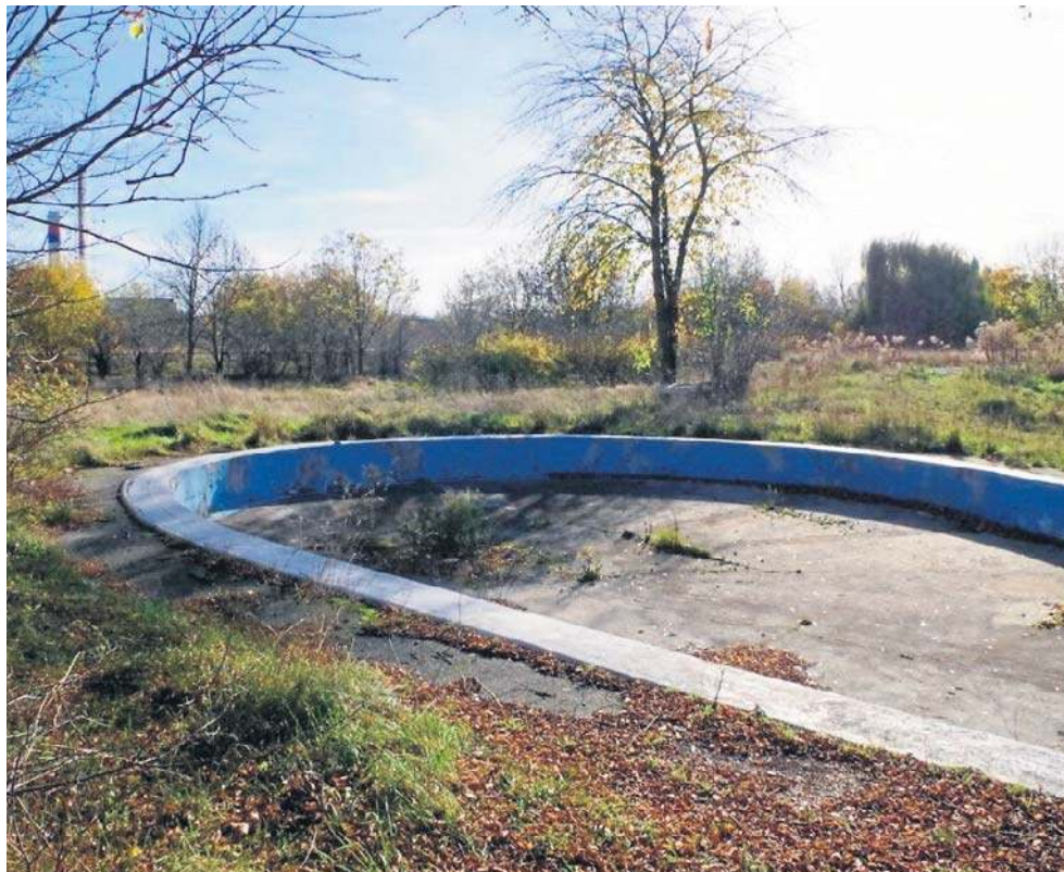
Baseny na ulicy Radosnej stoją zamknięte od 2021 roku, na razie brak decyzji: co dalej

Baseny powstały w latach 80. XX w. Wraz z rozbudową dwóch osiedli - Kopernik oraz Piekary, konieczne było stworzenie miejsca do letniego wypoczynku. Na terenie znajdował się wspomniany duży basen o głębokości 4 m oraz brodzik dla dzieci i młodzieży. Do tego były tam: stanowiska dla ratowników; duży, drewniany plac zabaw; otwarty w sezonie sklepik; boisko do siatkówki plażowej; przebiegające.