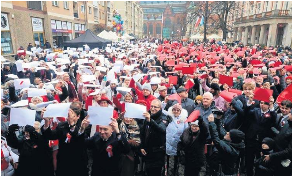
Legniczanie utworzą wielką, biało-czerwoną flagę i zaśpiewają pieśni patriotyczne

Biegi w poszczególnych kategoriach rozpoczną się o godz. 16.30. Bieg główny na dystansie 5 km - o godzinie 18. Trasa: pętla - ulica Najświętszej Marii Panny - rynek i z powrotem (więcej informacji : ww.osir.legnica.eu ).