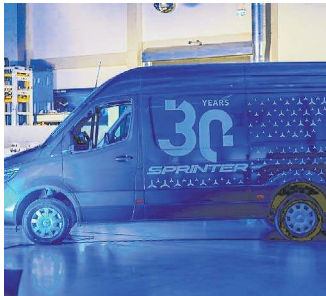
Budowa fabryki vanów ma kosztować ok. 1,5 mld zł

Chodzi np. o dodatkowe programy opieki zdrowotnej, dodatkowe świadczenia na wypoczynek, tworzenie przyzakładowego żłobka lub przedszkola.