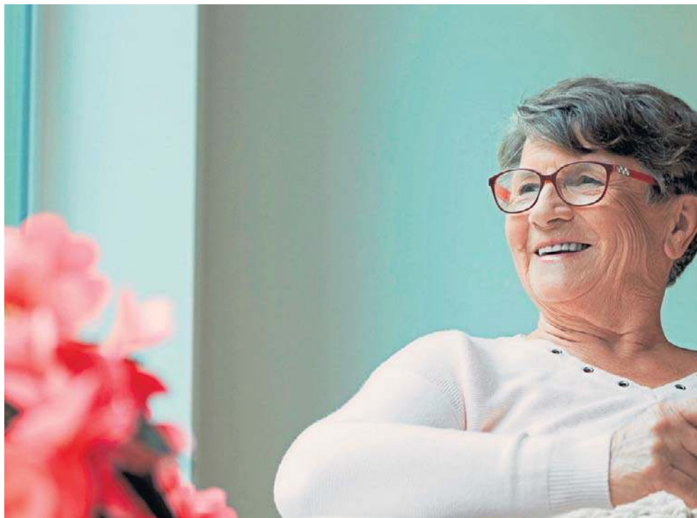
„Jedynka” to marzenie każdego kuracjusza w sanatorium

Leczenie sanatoryjne jest kontynuacją leczenia szpitalnego lub ambulatoryjnego, czyli odbywającego się np. w poradni specjalistycznej. Z sanatorium mogą skorzystać osoby, które po chorobie nie odzyskały sprawności lub z powodu warunków pracy zawodowej wymagają specjalistycznych zabiegów. Mogą tam być kierowani jedynie pacjenci wystarczająco sprawni, by odbyć podróż, samodzielnie, zdolni do samoobsługi i korzystania z zabiegów leczniczych.