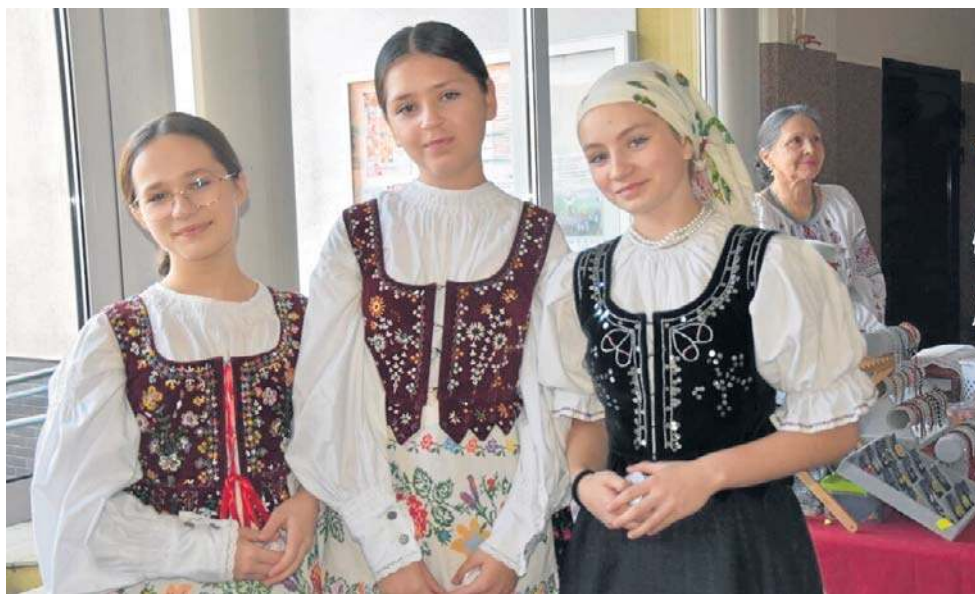
Zespół kultywuje język, pieśni, taniec i tradycję łemkowską

muzykę i dopracowane choreograficznie łemkowskie tańce.