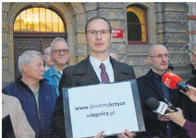
W internecie trwa zbiórka podpisów pod petycją w sprawie krzyża w sali obrad Rady Miejskiej Legnicy

Rady Miejskiej w Legnicy do kradzieży we wrześniu br. krzyża z legnickiej cerkwi grekokatolickiej.