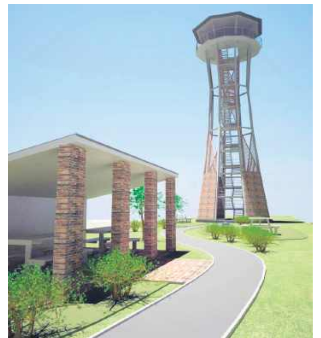
Tak ma wyglądać „Orle Gniazdo”. Wizualizacja UG Komarów-Osada

Oprócz budowy „Orlego Gniazda” samorząd planuje lepsze wykorzystanie terenu po byłej bazie kółka rolniczego w Komarowie-Wsi. W tym przypadku gmina zamierza odnowić i wyposażyć budynek magazynowo-biurowy,