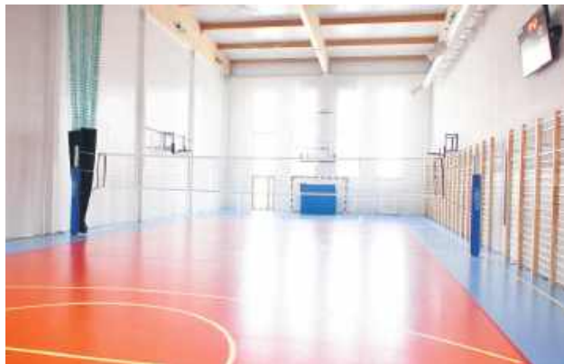
W skład nowoczesnej hali wchodzi sala gimnastyczna, szatnie, sanitariaty oraz pokój dla nauczycieli WF.

Dobiega końca realizacja sportowej inwestycji w Regionalnym Centrum Edukacji Zawodowej w Biłgoraju – rozpoczęły się odbiory końcowe jednego z ważniejszych przedsięwzięć edukacyjnych w regionie. „Elektryk” zyskał bazę treningową, której nie powstydziliby się profesjonalne kluby.