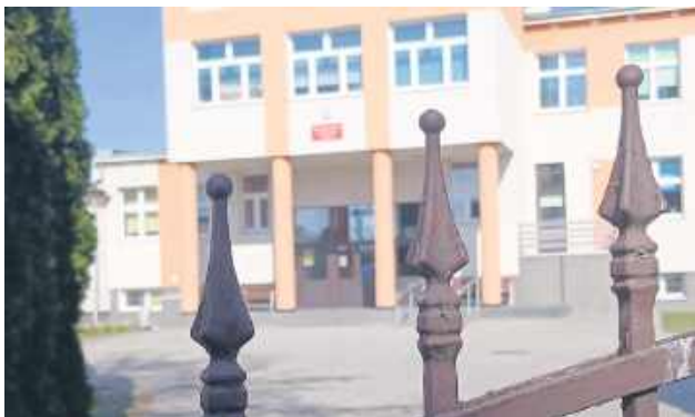
Czy przedszkolaki zostaną przeniesione do Szkoły Podstawowej nr 8?

Największe obawy budzi widmo dwuzmianowości. Rodzice uczniów „Ósemki” alarmują, że ich dzieci mogą „kończyć lekcje