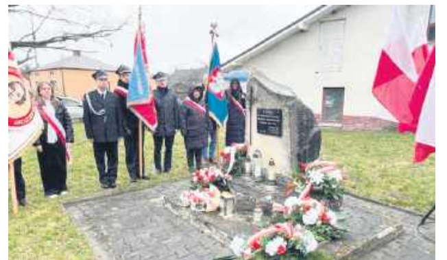
Była modlitwa, patriotyczny program artystyczny i złożenie kwiatów przy pomniku ofiar, który znajduje się przy miejscowej szkole.