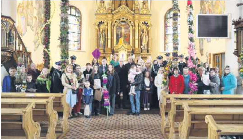
Rozstrzygnięcie konkursu odbyło się po mszy świętej w kościele w Bełczu.