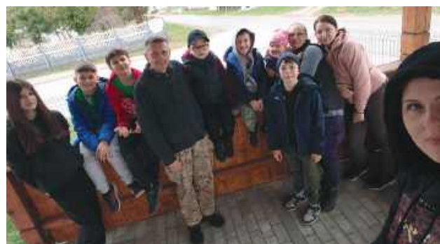
W Żernikach przykład dorosłym dały dzieci.

27 i 28 marca w gminie Bełżec sprzątno w ramach „Operacji Czysta Rzeka”. Inicjatorką tego przedsięwzięcia była Danuta Białek , a do akcji włączyło się kilkudziesięć osób.