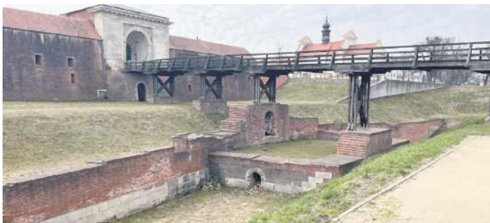
Czy za trzecim razem uda się wyłonić wykonawcę?