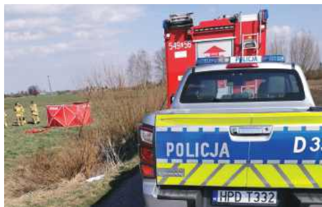
Tragedia w gminie Tyszowce. Mężczyzny nie można było uratować.

Przed południem dyżurny tomaszowskiej policji otrzymał zgłoszenie o prawdopodobnym utonięciu mężczyzny w rowie melioracyjnym. Ze zgłoszenia wynikało, że leży on twarzą zwró-