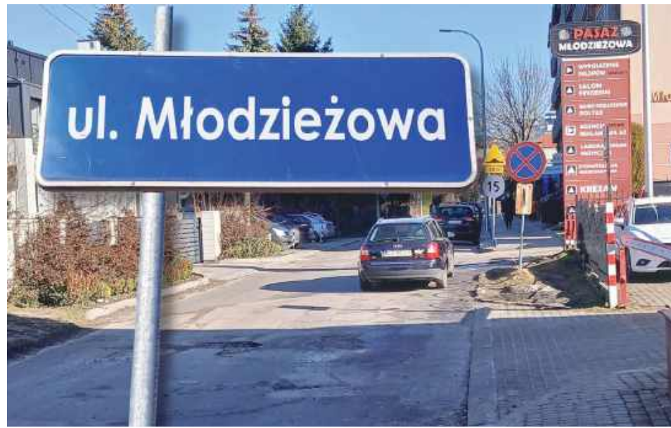
Ulica Młodzieżowa ma być przebudowana, ale organizacja ruchu pozostanie bez zmian.

W 2024 roku do Budżetu Obywatelskiego zgłoszono projekt wymiany nawierzchni ul. Młodzieżowej (wcześniej, w ramach Budżetu Obywatelskiego,