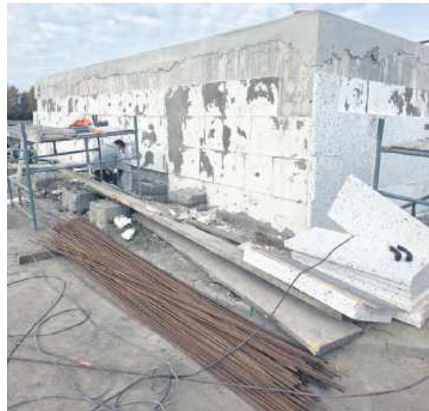
Modernizacja oczyszczalni w Jarczowie.

– Przy środkach z KPO każda złotówka jest oglądana