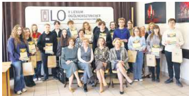
Konkurs Scrabble Challenge w II LO od 15 lat cieszy się nieustannie popularnością.