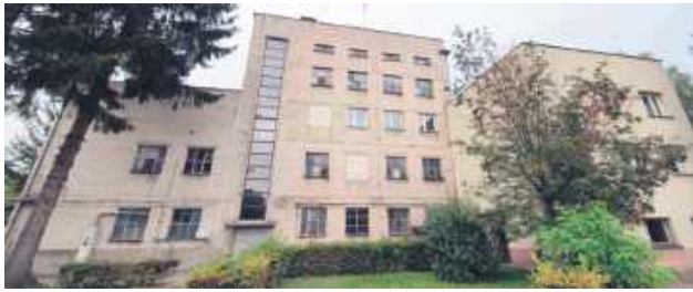
Jeszcze nie tak dawno Zakład Energetyki Ciepłej w Hrubieszowie był w dramatycznej sytuacji finansowej.

Rok 2025 przejdzie do historii zakładu jako czas finansowego oddechu. Przy przychodach netto przekraczających 11,4 mln zł ZEC wygenerował czysty zysk w wysokości 622 349,14 zł. Co taki wynik