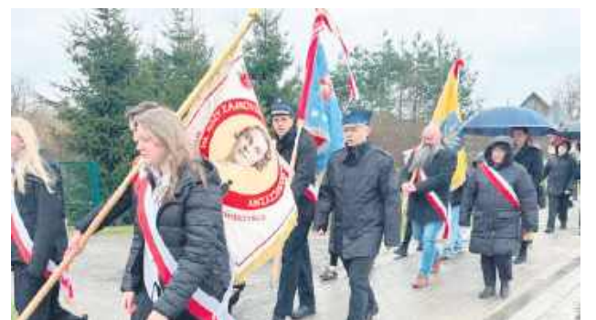
W wydarzeniu brały udział poczty sztandarowe.

Przedstawiciele władz samorządowych, organizacji pozarządowych i instytucji publicznych, młodzież szkolna oraz mieszkańcy gminy Zwierzyniec uczcili 31 marca rocznicę pacyfikacji Wywłoczki.