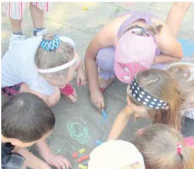
W prowadzonych przez miasto szkołach podstawowych są jeszcze miejsca dla 62 pierwszaków.

W nowym roku szkolnym w klasach pierwszych ośmiu szkół podstawowych przewidziano 495 miejsc. Pierwszaki będą uczyć się w 20 oddziałach – o trzy mniej niż obecnie. Po dwie klasy pierwsze będą w SP 2 i 9, po trzy w SP 3, 4, 6, 7 i 8, a jedna w SP 10. W pierwszym etapie rekrutacji przyjęto 433 dzieci.