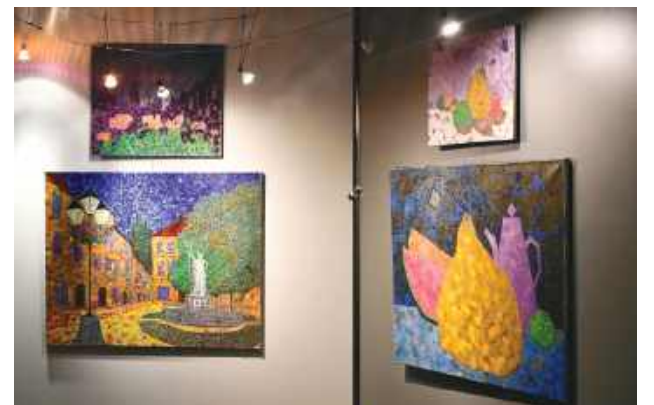
Szczególną uwagę przyciąga technika malarska lwowskiego artysty.

Gdzieś między zapytaniem o obrazy a gratulacjami w Szczepieszynie, w kuluarach padło dyskretne pytanie, dlaczego artysta nie wyjedzie z Ukrainy i nie zamieszka w bezpieczniejszym miejscu, po co ciągle tam wraca? Wybrzmiało zapewne