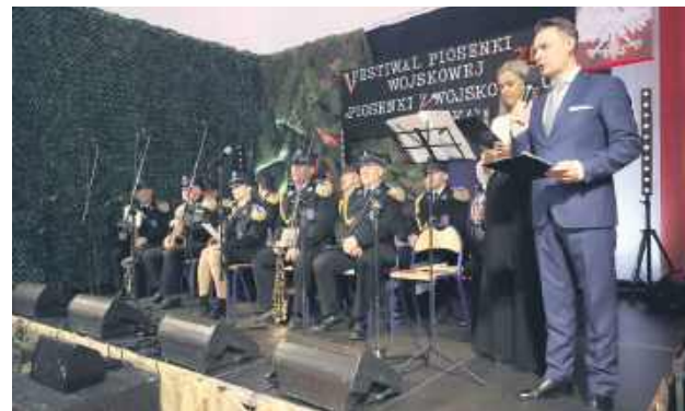
Festiwal ma na celu pielęgnowanie tradycji patriotycznych, rozwijanie talentów muzycznych wśród młodzieży oraz integrację uczniów z terenu gminy Zamość.