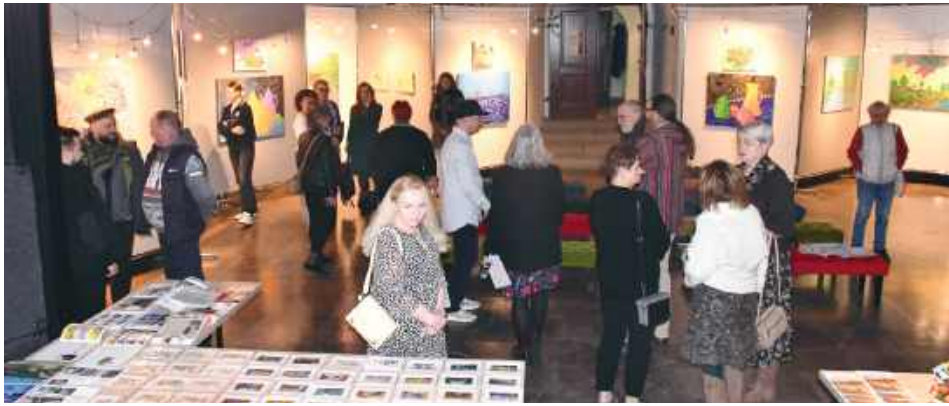
„Inna treść” to opowieść o przetrwaniu kultury w cieniu wojny, odpowiedź na strach i bezsilność, zapis chwil wydartych wojnie. Ta sztuka to świadome „odzaczarowywanie” rzeczywistości kolorem – akt artystycznej niezłomności.