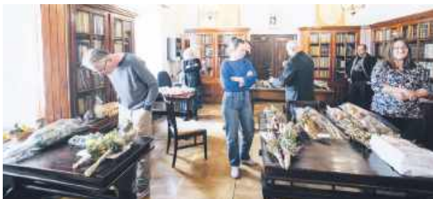
Komisja oceniała prace w dwóch kategoriach – tradycyjnej twórczości ludowej oraz współczesnej twórczości artystycznej nawiązującej do obrzędowości ludowej.