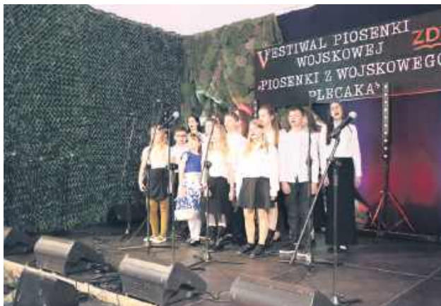
Przygotowania do tego wydarzenia trwały wiele miesięcy.