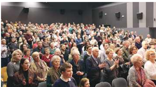
Publiczność była pod wrażeniem i nagrodziła aktorów owacjami na stojąco.

Przedstawienie, inspirowane motywami powieści Henryka Sienkiewicza, opowiadało historię miłości Ligii i Winicjusza na tle brutalnych rządów cesarza Nerona. Twórcy skupili się jednak nie tylko na