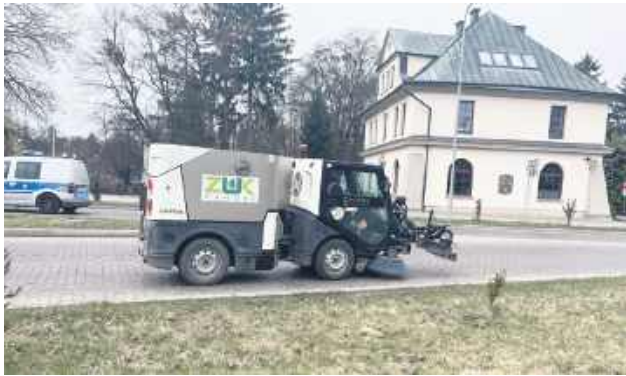
Umowy na utrzymanie miejskiej przestrzeni zostały podpisane w zeszłym tygodniu.

Umowy na utrzymanie miejskiej przestrzeni zostały podpisane kilka dni temu. Co się zmieni? Gruntowną przemianę przejdą ronda. Chodzi o pięć skrzyżowań o ruchu okrężnym zlokalizowanych u zbiegu ulic Hrubieszowskiej i Reja, Hrubieszowskiej i Gminnej, na ul. Partyzantów, Orłat Lwowskich i Odrodzenia (obok II LO), Piłsudskiego, Lubelskiej, Wojska Polskiego i Wiejskiej (przy parafii św. Michała Archanioła), a także na ul. Lubelskiej w pobliżu centrum handlowego. Zaplanowano tam zupełnie nowe nasadzenia.