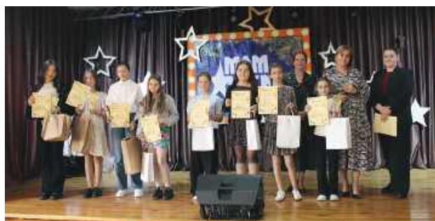
Laureaci konkursu „Mam Talent” w gminie Tomaszów Lubelski w drugiej kategorii wiekowej.

Konkurs „Mam Talent” przeprowadzono w trzech ka-