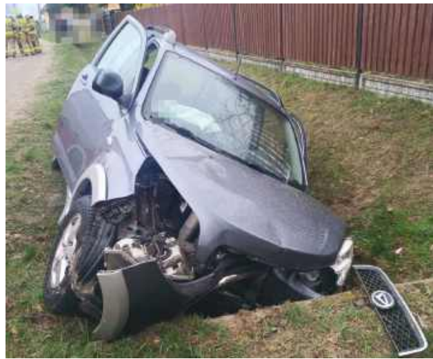
Sledczy sprawdzają obecnie, czy do wypadku przyczyniła się nadmierna prędkość, błąd techniczny pojazdu czy może nagłe pogorszenie stanu zdrowia 71-letniego kierowcy.

Do wypadku doszło 31 marca, około godziny 13.45. Według wstępnych ustaleń policjantów, kierujący samochodem marki Daihatsu 71-latek tuż przed