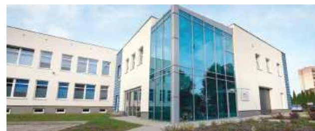
Centrum powstanie w istniejących budynkach dydaktycznych Akademii Zamojskiej.

Dodaje, że nowa placówka pozwoli na kształcenie wysoko wykwalifikowanych specjalistów, lepiej przygotowanych do wymagań współczesnego rynku pracy, a także wzmocni pozycję Akademii Zamojskiej jako nowoczesnego ośrodka edukacyjnego i naukowego. Kluczowe jest