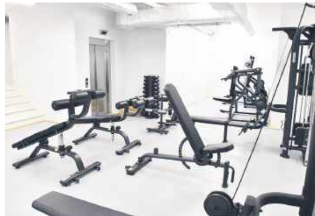
W podpiwniczeniu znajdzie się także siłownia.

Nowy obiekt robi wrażenie nie tylko statystykami, ale również architektonicznym dopasowaniem. Konstrukcja o długości blisko 54 metrów