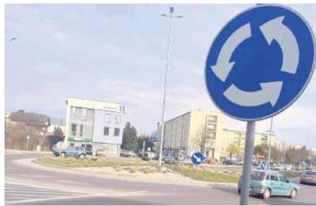
Gruntowną przemianę przejdą ronda.