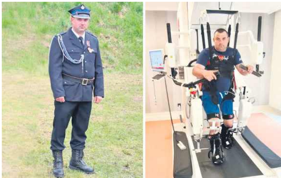
41-latek z gminy Frampol jeszcze niedawno niósł pomoc wszędzie tam, gdzie zawyła strażacka syrena – dziś sam potrzebuje wsparcia.

Przez lata narażał swoje życie jako strażak jednostki OSP w gminie Frampol, niósł pomoc wszędzie tam, gdzie zawyła syrena. Dziś sam toczy najważniejszą walkę – o własną sprawność i powrót do normalnego życia. Po dramatycznym upadku z wysokości i miesiącach spędzonych w szpitalu jedyną szansą na jego przyszłość jest kosztowna rehabilitacja. Rodzina i przyjaciele apelują o wsparcie!