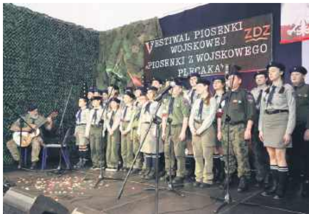
Finał 27 marca był naprawdę imponujący.