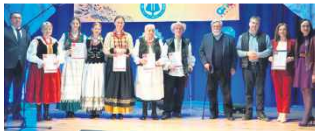
Nominowani do Wojewódzkiego Przeglądu Kapel i Śpiewaków Ludowych.