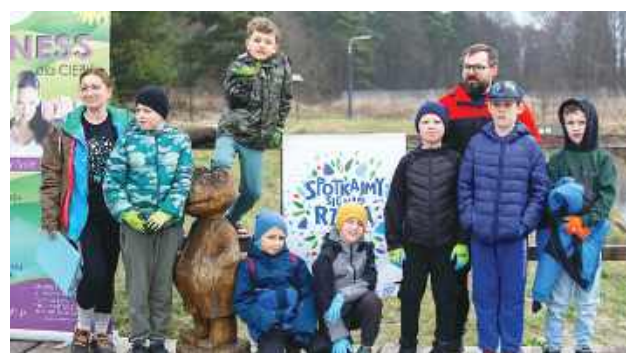
Dzieci i młodzież też pomagali.