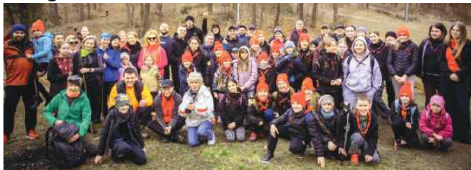
Uczestnicy „Wielkiego Sprzątania Siwej Doliny” wiosną 2026.