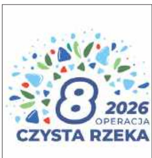
W kraju „Operacja Czysta Rzeka” przeprowadzana jest po raz ósmy, a w Hrubieszowie tamtejsze „Morsy” organizują sprzątanie nabrzeży Huczwy po raz drugi.

„Hrubieszowskie Morsy” po raz drugi w historii miasta zapraszają mieszkańców do wspólnej akcji nad Huczwą! To część ogólnopolskiej inicjatywy „Operacja Czysta Rzeka”, która w całym kraju jednoczy tysiące ludzi w trosce o środowisko naturalne.