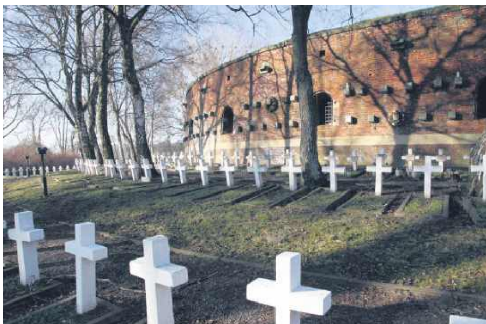
Rotunda Zamojska jest jednym z najważniejszych zabytków miasta.

Realizowany przez Ministerstwo Kultury i Dziedzictwa Narodowego rządowy program „Groby i cmentarze wojenne w kraju” ma na celu pomoc w opiece nad grobami i cmentarzami wojennymi w kraju oraz wsparcie działań naukowych, upowszechniających wiedzę na temat wydarzeń z historii Polski związanych z walką i męczeństwem. Z budżetu resortu finansowane są