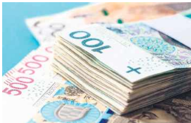
W Hrubieszowie pomoc nie ograniczy się jedynie do gorącego talerza zupy w stołówce – mieszkańcy mogą otrzymać wsparcie w trzech formach: gorący posiłek, świadczenie pieniężne na zakup żywności, a także paczki z produktami spożywczymi.

Gmina Miejska Hrubieszów pozyskała 189 tys. zł dotacji celowej z budżetu państwa, a ponad 47,2 tys. zł