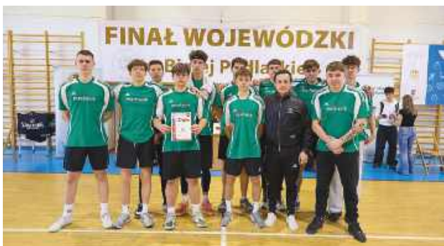
Męska drużyna z Tomaszowa Lubelskiego zajęła 5. miejsce w Finale Wojewódzkim w Koszykówce Chłopców „Liceliada”, który odbył się w Białej Podlaskiej.

Nie wygrali rozgrywek, ale już sam udział to dla nich sukces. Drużyna z Zespołu Szkół Techniczno-Motoryzacyjnych w Tomaszowie Lubelskim zajęła 5. miejsce w Finale Wojewódzkim w Koszykówce Chłopców „Liceliada” w Białej Podlaskiej.