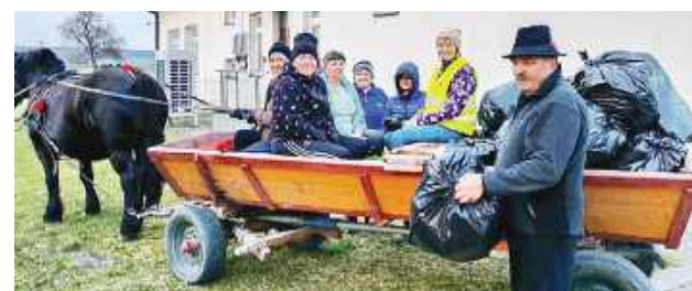
KGW z Przeorska samo wyszło z inicjatywą posprzątania swojej wsi.

To miejsce przyciąga miejscowych, ale i turystów o każdej porze