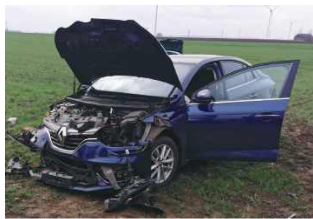
Peugeotem kierował mieszkaniec gminy Mirce, a Renault prowadziła mieszkanka gminy Telatyn. Oboje z obrażeniami ciała trafili do szpitala.