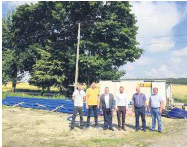
To ubiegłoroczne zdjęcie wykonane w Przewłocze na początku prac. Dziś cały projekt jest zakończony. W ramach umowy wykonawca zrealizował: wodociąg w miejscowości Przewłoka, kanalizację w miejscowości Zawady oraz modernizację oczyszczalni ścieków w Jarczowie.

Chodzi o projekt pod nazwą „Rozwój systemu wodociągowo-kanalizacyjnego w Gminie Jarczów”, na realizację którego 20 maja ubiegłego roku gmina podpisała umowę z firmą z Krasnobrodu. Zadanie kosztowało blisko 5 milionów złotych, z czego 3 miliony 600 tysięcy złotych stanowiło bezzwrotne wsparcie z Programu odbudowy i zwiększenia odporności sektora rolno-spożywczego i obszarów wiejskich w ramach Krajowego Planu Odbudowy (KPO).