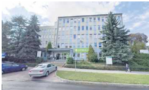
Wprowadzając zmianę w SPZOZ, od 1 września 2026 r. POZ w Hrubieszowie, Teratynie i Mirczu zostanie przekazany prywatnemu podmiotowi wyłonionemu w konkursie.

Przypomnijmy, że zaledwie kilka miesięcy temu radni odrzucili identyczny projekt. Wtedy górną były argumenty o braku