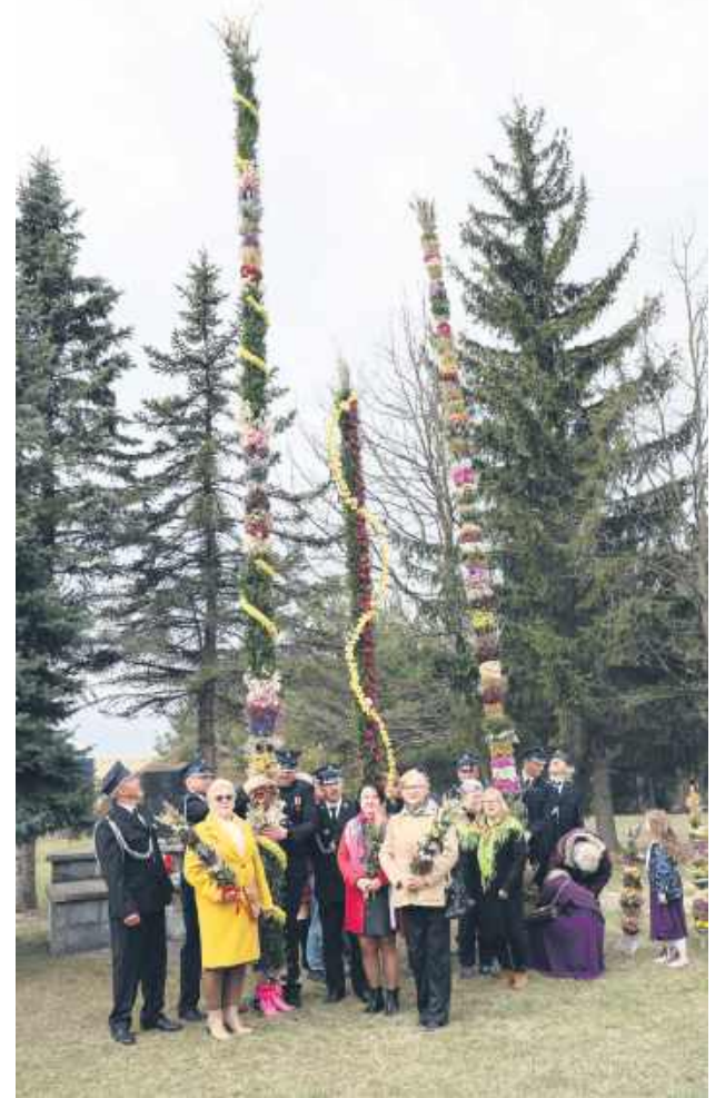
Najwyższe palmy przewyższyły drzewa!