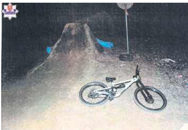
Teren, gdzie doszło do wypadku, jest nieogrodzony i zwyczajowo wykorzystywany przez miłośników wyczynowej jazdy na rowerze lub hulajnodze.

13-latek trenował na rowerowym torze przeszkód na prywatnej posesji w Zamościu. Niestety doszło do wypadku. Chłopak nieprawidłowo wybił się ze skarpy, w wyniku czego spadł na tylne koło, doznając urazu. Załoga Lotniczego Pogotowia Ratunkowego przetransportowała go do szpitala.