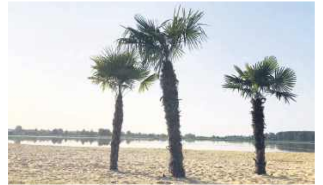
Gdy tylko pogoda pozwoli, nad zalew wrócą palmy.