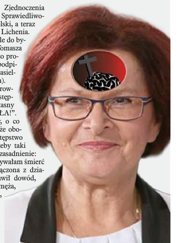
ILUSTR. KRZYSZTOF OLEJNIK

Chciwość, pycha, lenistwo (umyślone), do tego tyle łgarstw, ile się da. Cała Kurowska. Piśowa, dawniej ziobrowa.