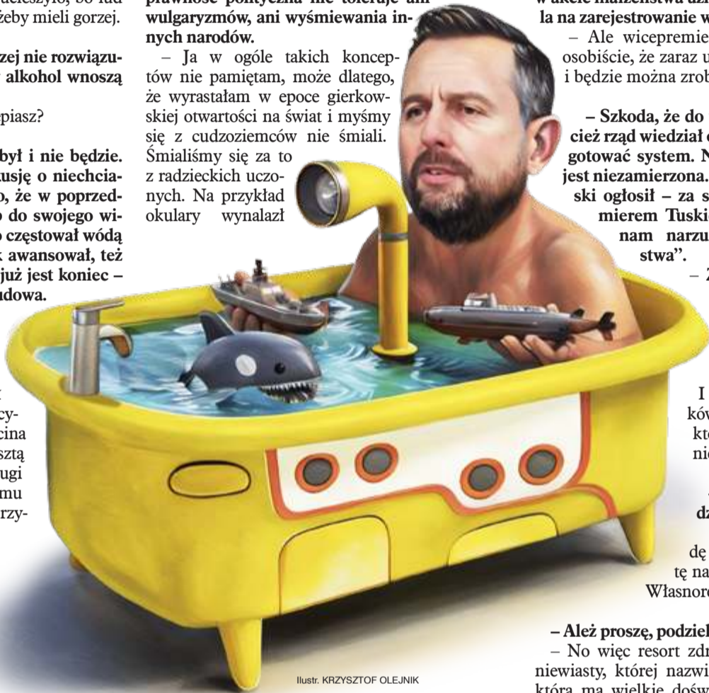
Ilustr. KRZYSZTOF OLEJNIK

– Ja w ogóle takich koncepcji nie pamiętam, może dlatego, że wyrastałam w epoce gierkowskiej otwartości na świat i myśmy się z cudzoziemców nie śmiali. Śmialiśmy się za to z radzieckich uczonych. Na przykład okulary wynalazł