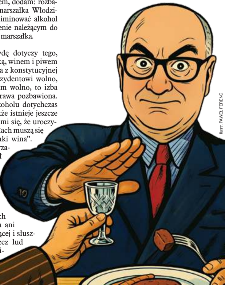
ILUSTR. PAWEŁ FERENC