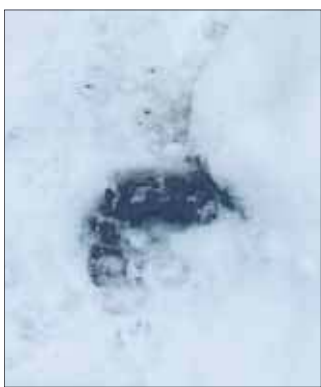
Końskie odchody na trasie w Jeleniu.

Kiedy odchody są świeże, smród na ścieżce jest nie do zniesienia, a strach pomyśleć, co będzie działo się latem w wysokich temperaturach. Wiadomo, że koński nawóz jest naturalny, ale na litość boską – nie na samym środku publicznej ścieżki! Zanieczyszczenia mają wielkość „małych dywanów” i są częściowo przysypane śniegiem. Stadnina najwyraźniej zapomniła o obowiązku sprzątania po swoich zwierzętach w miejscach publicznych. Nie można dopuścić, by wizytówka turystyczna naszej dzielnicy była traktowana jak darmowy szalet.