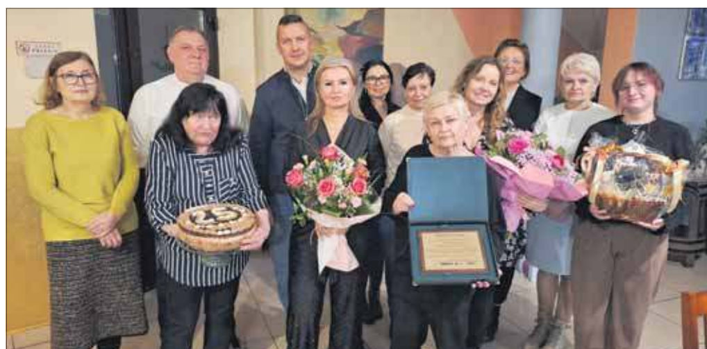
Uczestnicy spotkania jubileuszowego

TOZ stał się symbolem tego, że my jako ludzie potrafimy pomóc tym najmłodszym, najmniejszym naszym braciom,