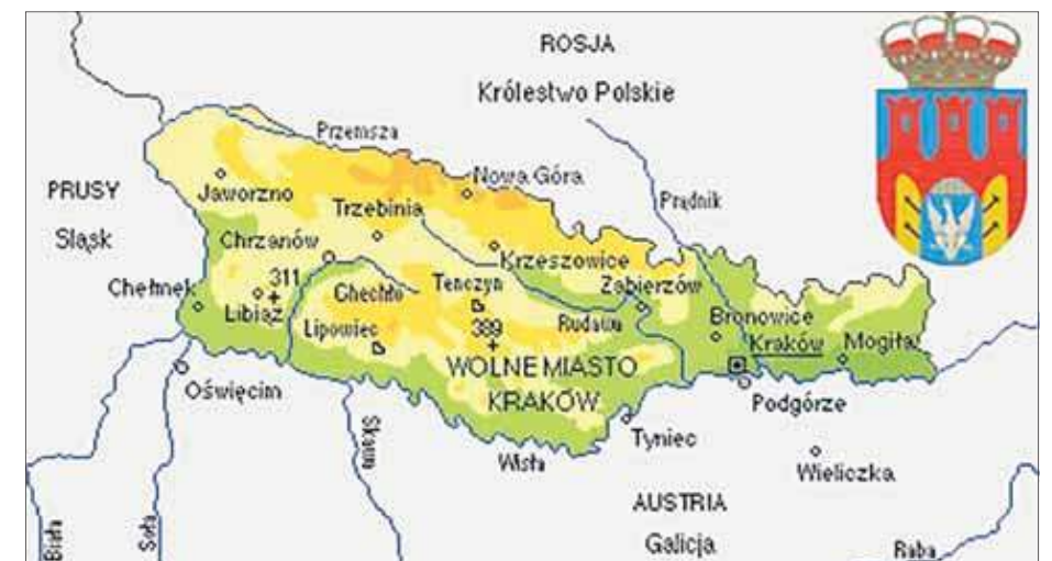
Wolne Miasto Kraków wraz z Okręgiem

Jaworzno. I chodzi tutaj rzecz jasna o Wolne Miasto Kraków. Twór ten obejmował bowiem całkiem spory obszar, sięgając po Białą Przemszą i Przemszą na zachodzie. I chociaż nigdy nie stanowiliśmy części Krakowa sensu stricto to jednak wchodziliśmy w skład Wolnego Miasta Krakowa, co sytuuje nas w dość osobliwym