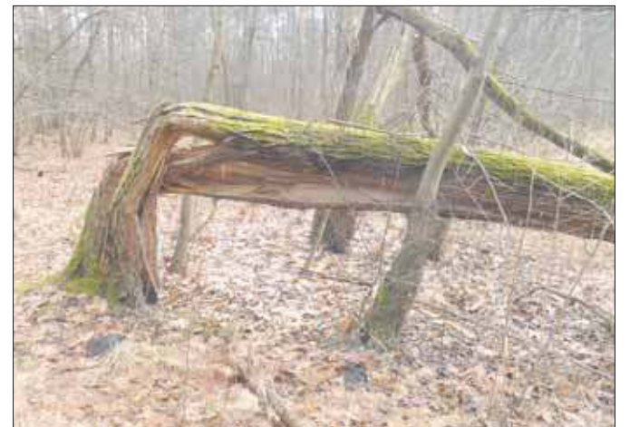
Powalona wierzba krucha

Tym razem zapraszam do dobrze znanego naszym czytelnikom miejsca. Tytułowe źródło znajduje się na obszarze chronionego krajobrazu Dobra – Wilkoszyn. Od zapadliśka przy ulicy Botanicznej prowadzi doń czarna ślalka. Obecnie oznakowanie jest słabo czytelne. Trochę pobłądziliśmy, ale udało się nań trafić. Byliśmy tutaj podczas wycieczki odbytej w dniu 14 lutego. Poza natrafieniem na wodę liczyliśmy na pierwsze kwitnące