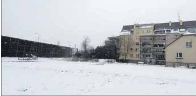
Przepompownia przy ulicy Cegielnianej w Jaworznie

– Mężczyzna był przytomny i w miarę kontaktowy, jednak po kilku próbach nie był w sta-