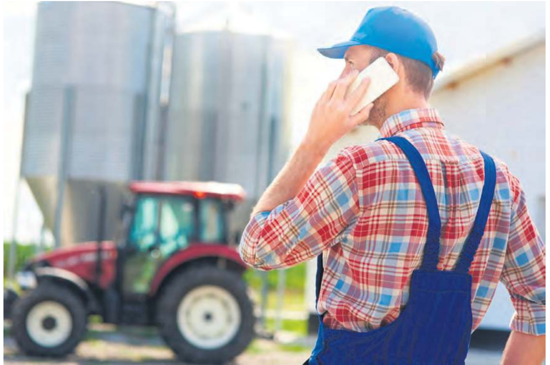
Zgłoszenie wypadku powinno nastąpić bez zbędnej zwłoki, choć ostateczny termin jest wyjątkowo długi – do 6 miesięcy.

Osoba poszkodowana lub inna zgłaszająca zdarzenie powinna przede wszystkim: zabezpieczyć w miarę możliwości miejsce i przedmioty związane z zajściem, udostępnić miejsce i przedmioty z nim związane, wskazać świadków, dostarczyć posiadaną dokumentację leczenia oraz udzielić informacji i wszechstronnej pomocy pracownikowi kasy upoważnionemu przez kierującego KRUS-em do prowadzenia