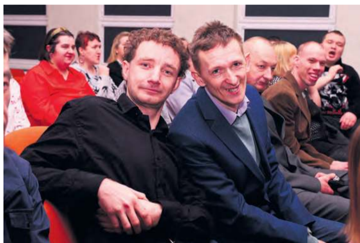
Najważniejsi tego dnia byli podopieczni stowarzyszenia.