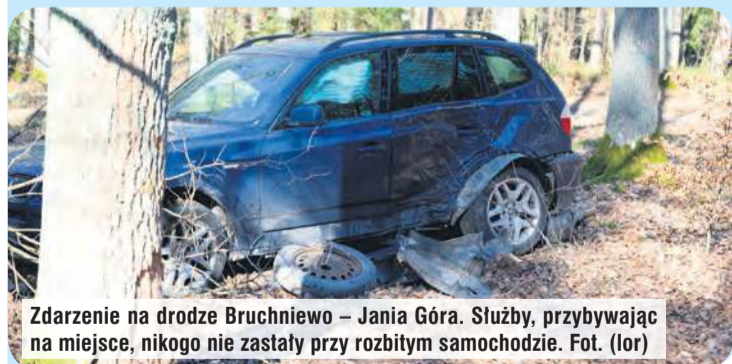
Zdarzenie na drodze Bruchniewo – Jania Góra. Służby, przybywając na miejsce, nikogo nie zastały przy rozbitym samochodzie.

Policji. Na miejscu działała OSP Lubiewo.