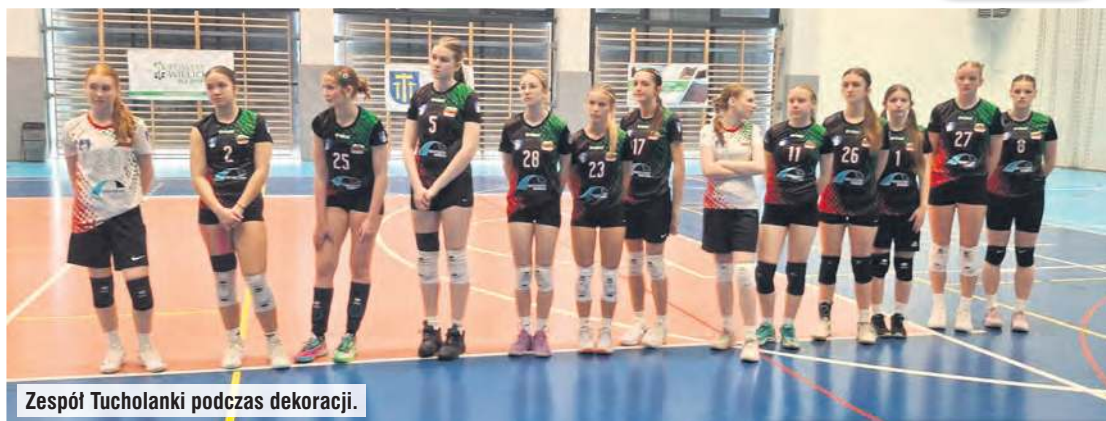
Zespół Tucholanki podczas dekoracji.