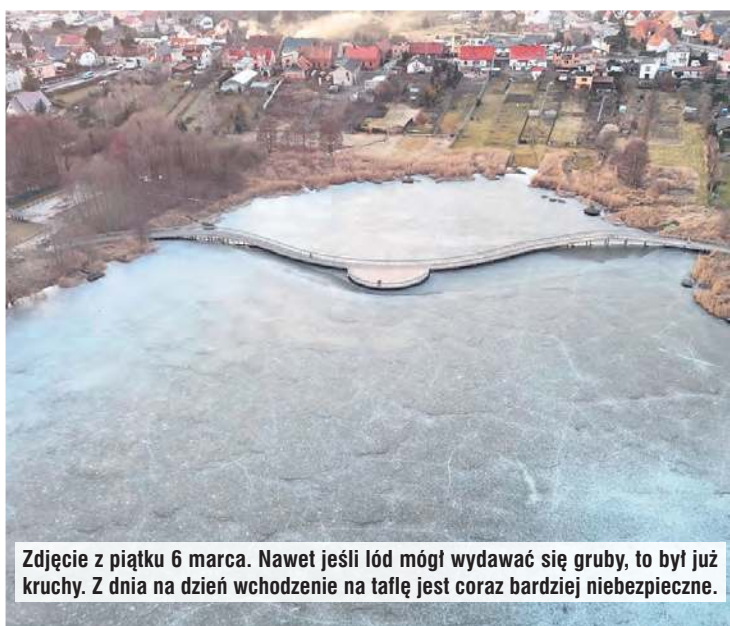
Zdjęcie z piątku 6 marca. Nawet jeśli lód mógł wydawać się gruby, to był już kruchy. Z dnia na dzień wchodzenie na tafle jest coraz bardziej niebezpieczne.

Apelujemy o ostrożność – nie ryzykuj życia! Każdego roku nieodpowiedzialne wchodzenie na lód kończy się tragedią. Nie ignoruj zagrożenia – zadbaj o swoje bezpieczeństwo oraz ostrzeż innych. Pamiętaj, że nawet chwilowa lekkomyślność może mieć nieodwracalne skutki. Udostępnij tę informację, aby zwiększyć świadomość i zapobiec kolejnym wypadkom.