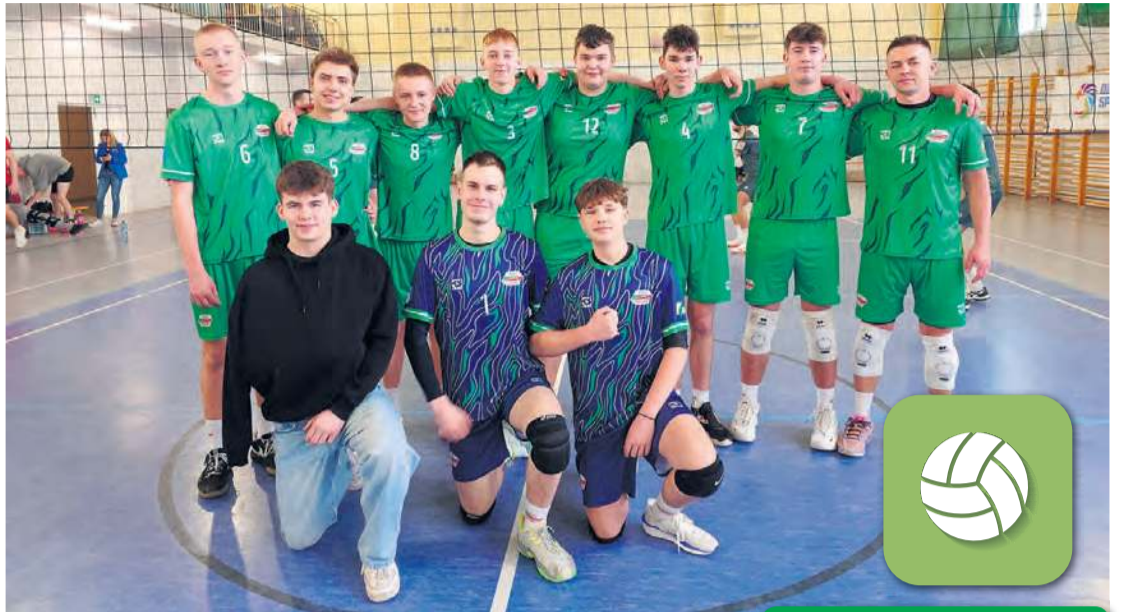
Młodzi siatkarze Tucholanki to także gospodarze Tucholskiej Ligi Siatkówki.