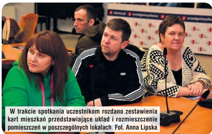
W trakcie spotkania uczestnikom rozdano zestawienia kart mieszkań przedstawiające układ i rozmieszczenie pomieszczeń w poszczególnych lokalach.

Aby zostać najemcą lokalu utworzonego z wykorzystaniem