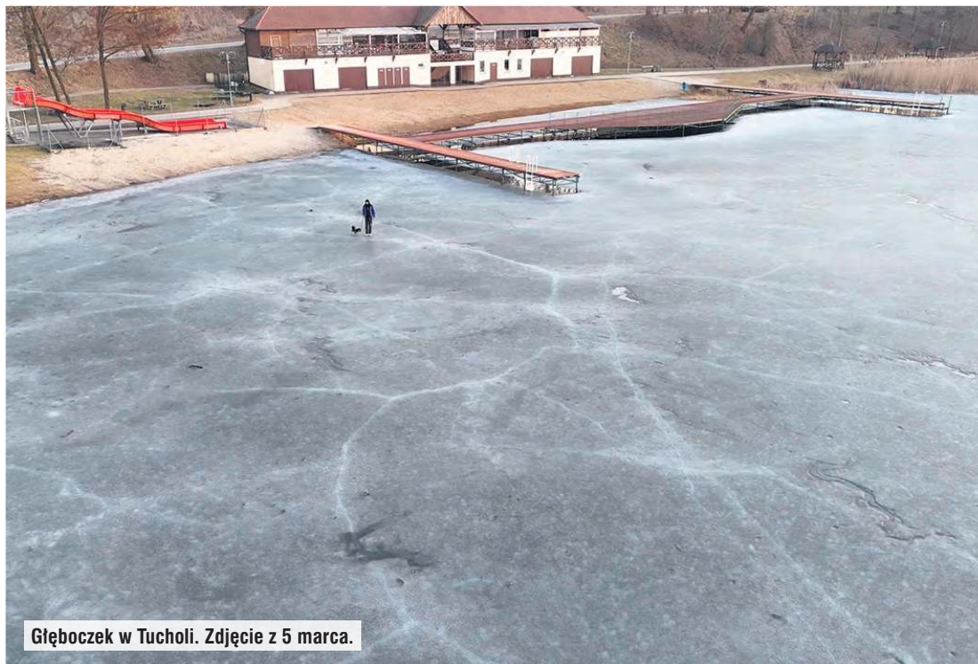
Głębock w Tucholi. Zdjęcie z 5 marca.

– Mimo że lód miejscami jest jeszcze gruby, to jest już kruchy i nieprzewidywalny. Jednego razu