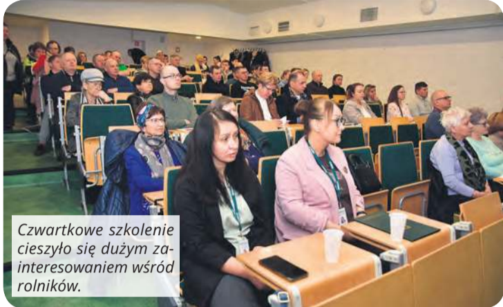
Czwartkowe szkolenie cieszyło się dużym zainteresowaniem wśród rolników.

Rolnicy – podobnie jak inni przedsiębiorcy – muszą przygotować się na wprowadzenie Krajowego Systemu e-Faktur (KSeF). O zmianach w przepisach i nowych obowiązkach od 2026 roku mówiono podczas szkolenia zorganizowanego w Tucholi dla rolników z powiatu tucholskiego przez Urząd Skarbowy w Tucholi oraz Powiatowy Zespół Doradztwa Rolniczego w Tucholi.