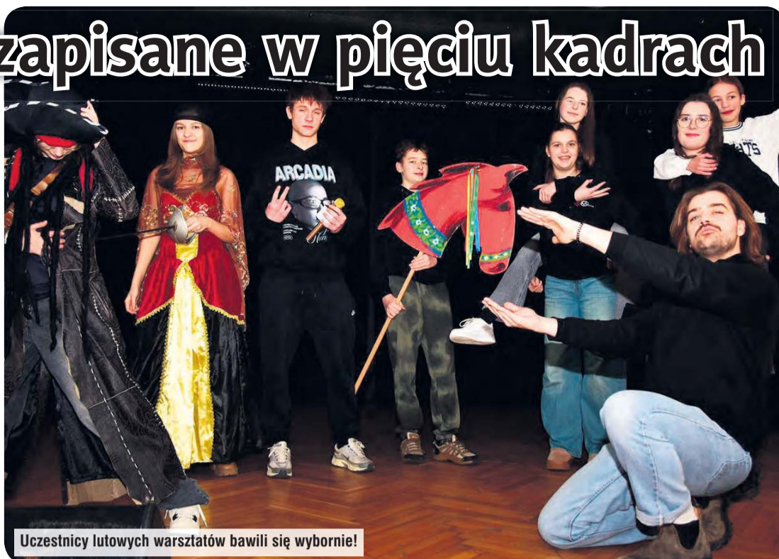
Uczestnicy lutowych warsztatów bawili się wybornie!

Projekt „Kreatywne Gzuby – cykl animacji artystycznych dla dzieci i młodzieży” realizowany jest w gostycyńskim GOK-u dzięki dofinansowaniu z KPO dla kultury. W jego ramach odbyły się warsztaty o różnorodnej tematyce – młodzi uczestnicy wystawili m.in. teatr cieni oraz stworzyli własną grę i słownik gwary borowiackiej. Jednym z elementów projektu były także opisywane w artykule warsztaty