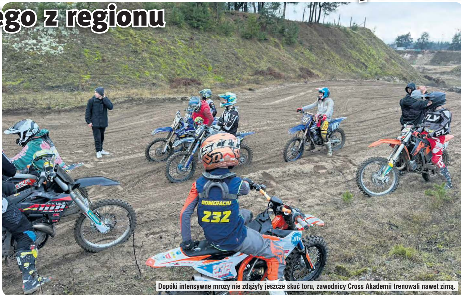
Dopóki intensywne mrozy nie zdążyły jeszcze skuć toru, zawodnicy Cross Akademii trenowali nawet zimą.