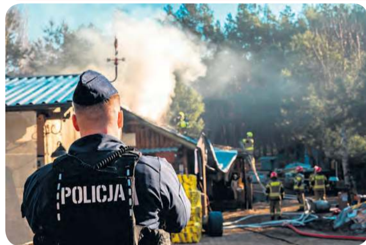
Na miejscu pożaru pojawiła policja. Jej oficer prasowy informuje nas, że właściciel budynku został ukarany mandatem karnym.

nowane zostały również jednostki z dużymi autami z Lubiewa i Legbąda.