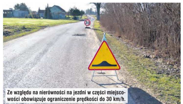
Ze względu na nierówności na jezdni w części miejscowości obowiązuje ograniczenie prędkości do 30 km/h.

dotyczy nie tylko nawierzchni, ale również wewnątrzkonstrukcyjnej podbudowy. Już teraz zaobserwowano, iż przy pierwszych ruchach ciężkiego sprzętu, związanego m.in. z pierwszymi pracami rolnymi, rozpatrywana nawierzchnia asfaltowa pod naciskiem często ponadnormatywnego ciężaru kruszeje w zasadzie każdego dnia. Z tego względu