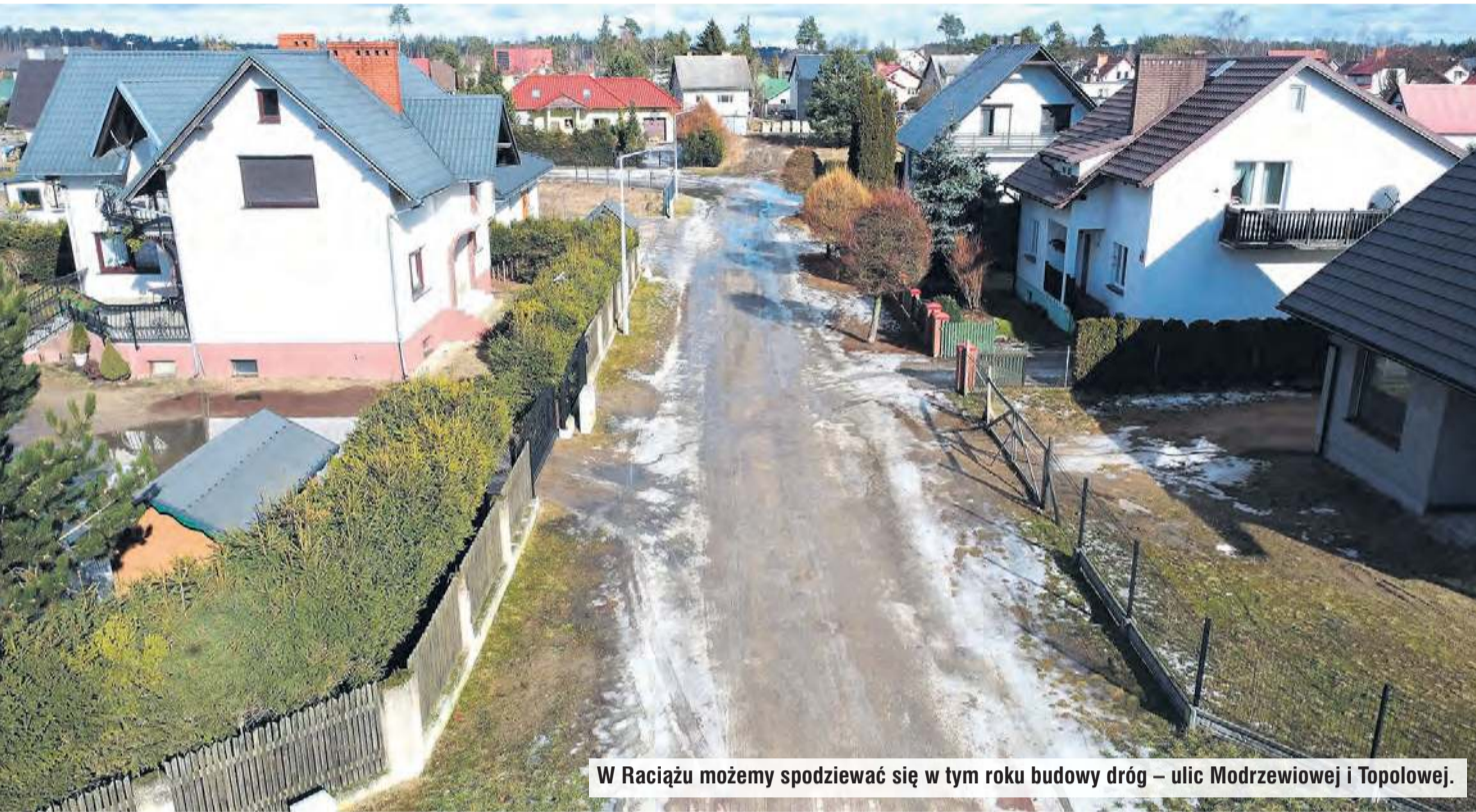
W Raciążu możemy spodziewać się w tym roku budowy dróg – ulic Modrzewiowej i Topolowej.

Chodzi o ulice Modrzewiową i Topolową. Gmina Tuchola uzyskała prawie pół miliona złotych dofinansowania na budowę dróg. Samorząd dołoży prawie drugie tyle.