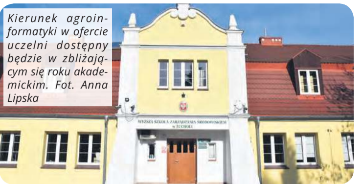
Kierunek agroinformatyki w ofercie uczelni dostępny będzie w zbliżającym się roku akademickim.

szej Szkoły Zarządzania Środowiskiem w Tucholi?