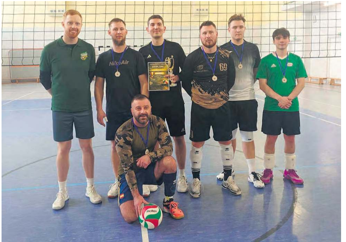
Zespół ze Śliwic okazał się najlepszym teamem w bystawskim turnieju.