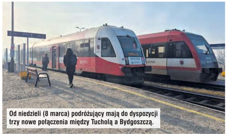
Od niedzieli (8 marca) podróżujący mają do dyspozycji trzy nowe połączenia między Tucholą a Bydgoszczą.