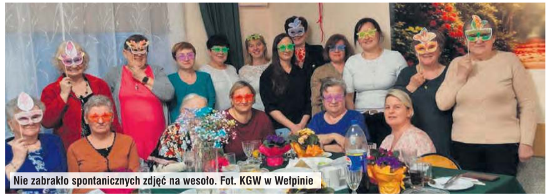
Nie zabrakło spontanicznych zdjęć na wesoło.

Miniony weekend był wyjątkowy, bo w niedzielę (8 marca) swoje święto miały kobiety. Z tej okazji w wielu miejscach odbyły się spotkania i wydarzenia o zabawowym charakterze. Jedno z nich odbyło się w Świetlicy Wiejskiej w Wełpinie.