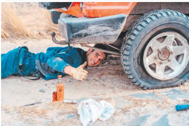
KRUS zwraca uwagę, że do wypadków w gospodarstwach dochodzi podczas pracy przy źle zabezpieczonych maszynach, będących w ruchu albo w trakcie postoju.