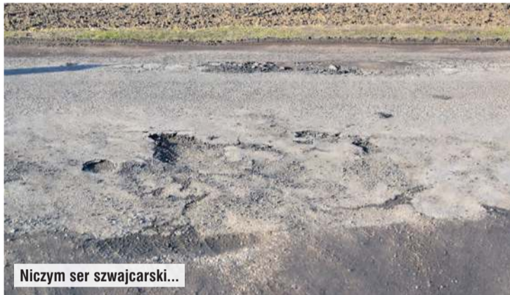
Niczym ser szwajcarski...

Wskazuje ona też, że przez Małą Klonię przejeżdżają ciężarówki, które nie mieszczą się pod wiaduktem w Gostycynie.