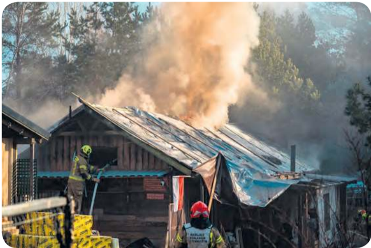
Ogień rozgorzał w okolicach poddasza. To podobna sytuacja do tej, która w tym samym miejscu zaistniała kilka tygodni temu.