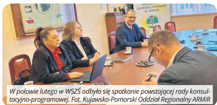
W połowie lutego w WSZS odbyło się spotkanie powstającej rady konsultacyjno-programowej.