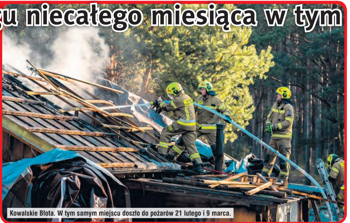
Kowalskie Błota. W tym samym miejscu doszło do pożarów 21 lutego i 9 marca.

relacjonowaliśmy z miejsca zdarzenia na tygodnik.pl. Wówczas na pomoc jako pierwszy ruszył przypadkowy świadek zdarzenia – myśliwy, który akurat przejeżdżał przez okolicę. Akcja gaśnicza wymagała wtedy interwencji nie tylko strażaków z gminy Cekcyn i Tucholi, ale zadyspo-