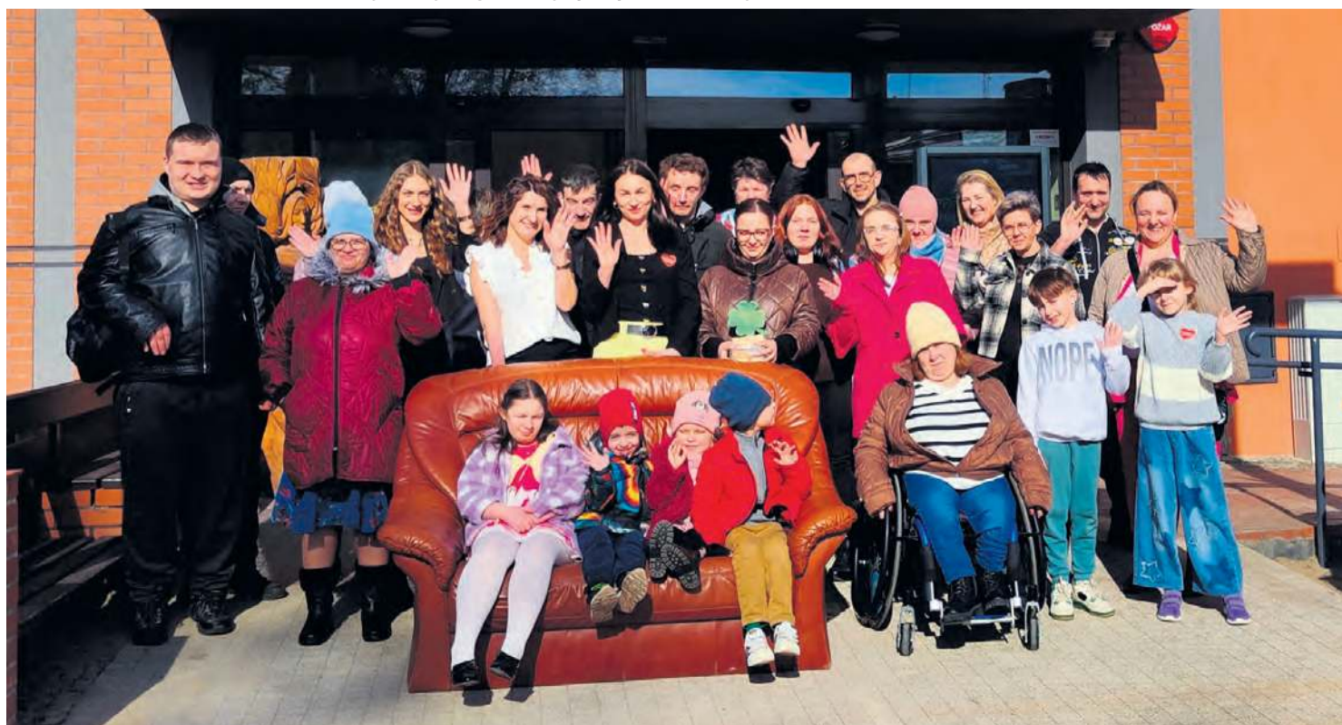
Uradowana, świętująca ekipa ze Stowarzyszenia Rodziców Dzieci Specjalnej Troski. Tak wyglądało pożegnanie z imprezą z okazji 35-lecia organizacji.

Warto dodać, że obie panie, matka i córka, pojawiły się jeszcze na filmie wyświetlonym podczas jubileuszu. Przeprowadziły między sobą wywiad, w którym