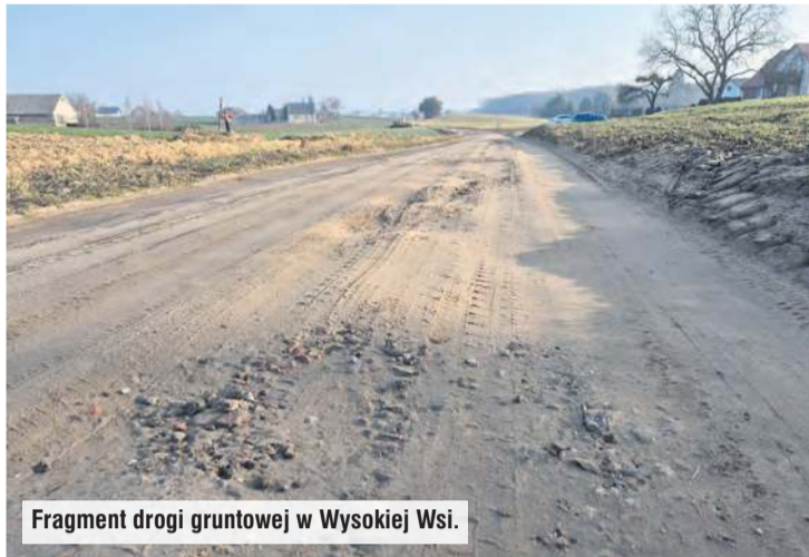
Fragment drogi gruntowej w Wysokiej Wsi.

Przetarg został podzielony na trzy części – naprawę dróg i nawierzchni gruntowej lub gruntowej ulepszonej, dostawę kruszywa niezbędnego do naprawy traktów oraz ich profilowanie. Zakład Sprzętowo-Transportowy Czesława Pawłowskiego w Tucholi złożył ofertę na każdą z nich. W dwóch pierwszych nie miał konkurencji, w trzeciej wygrał z firmą z Szubina, która przedstawiła wyższą ofertę. Tucholski zakład, który został zwycięzcą postępowania, wycenił swoje usługi łącznie na 448.027,50 zł.