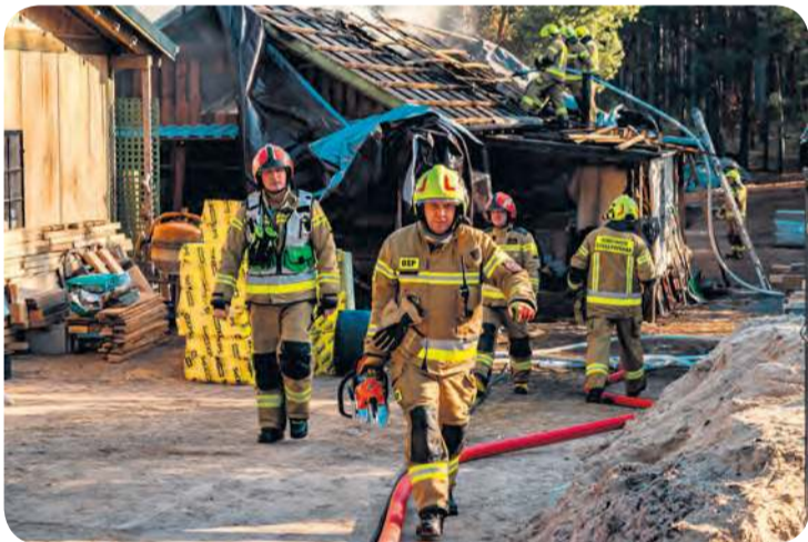
Akcję gaśniczą prowadziły jednostki z gminy Cekcyn i z Tucholi.