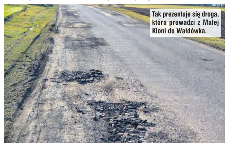
Tak prezentuje się droga, która prowadzi z Małej Kloni do Wałdówka.

Odpowiedzialny za powiatowe trakty zapowiada, że w krótkim