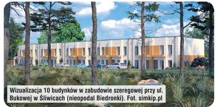
Wizualizacja 10 budynków w zabudowie szeregowej przy ul. Bukowej w Śliwicach (nieopodal Biedronki).

skarbowym właściwym dla gminy Śliwice. Obowiązywać będzie też wpłacenie partycypacji wynoszącej 15 procent od wartości danej mieszkania.