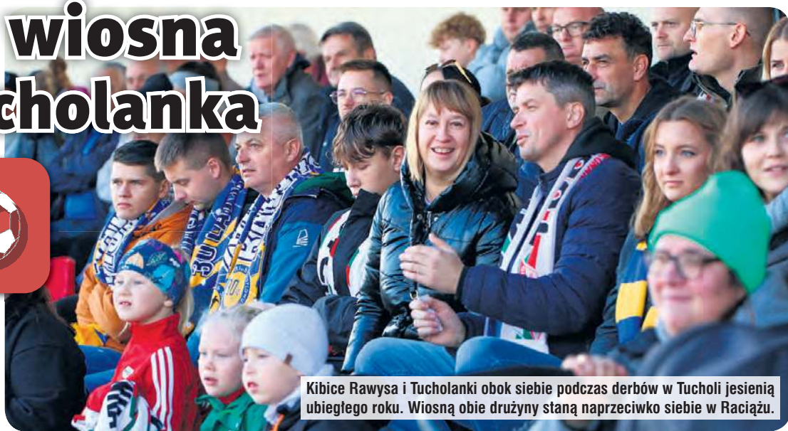
Kibice Rawysa i Tucholanki obok siebie podczas derbów w Tucholi jesienią ubiegłego roku. Wiosną obie drużyny staną naprzeciwko siebie w Raciążu.