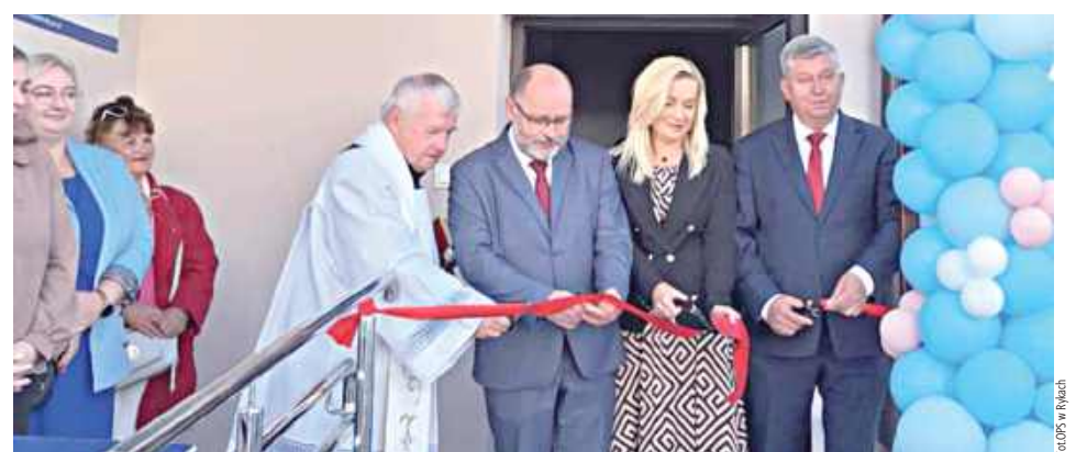
Symboliczne przecięcie wstęgi stało się formalnym rozpoczęciem działalności placówki

Podczas sobotniego wydarzenia panowała wyjątkowo ciepła i radosna atmosfera. Dzieci z entuzjazmem uczestniczyły w przygotowanych dla nich zabawach i animacjach, a warsztaty kreatywne cieszyły się ogromnym zainteresowaniem