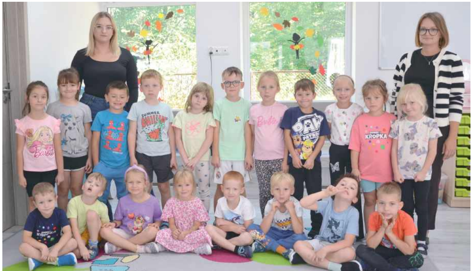
Do przedszkola uczęszczają dzieci nie tylko z Dębłina, ale również innych gmin i powiatów. Przez cały dzień w grupie jest dwóch opiekunów. Przy przedszkolu jest duży ogrodzony plac zabaw