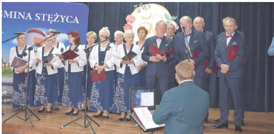
Dostojnym jubilatam zaśpiewał Chór Seniora „Zorza”. Usłyszeli pięknie wyśpiewane „Sto lat”, jak również wiele pięknych utworów