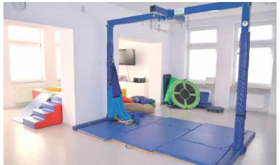
Dzieci ze specjalnymi potrzebami edukacyjnymi z autyzmem, w tym z zespołem Aspergera mogą również uczestniczyć w zajęciach terapeutycznych takich jak: zajęcia logopedyczne, zajęcia z psychologiem, pedagogiem, Dog terapii, SI - integracji sensorycznej czy TUS (Trening Umiejętności Społecznych) w ramach współpracy z Krajowym Towarzystwem Autyzmu w Lublinie, które są prowadzone w budynku przedszkola

Dzieci ze specjalnymi potrzebami edukacyjnymi z autyzmem, w tym z Zespołem Aspergera mogą również uczestniczyć w zajęciach terapeutycznych takich jak: zajęcia logopedyczne, zajęcia z psychologiem, pedagogiem, Dog terapii, SI - integracji sensorycznej czy TUS (Trening Umiejętności Społecznych) w ramach współpracy z Krajowym Towarzystwem Autyzmu