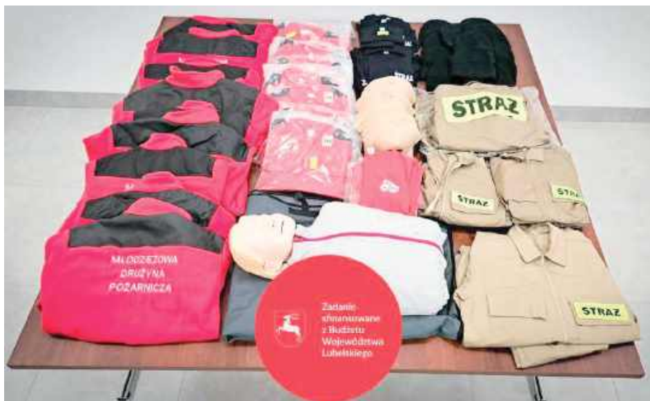
Dzięki otrzymanemu wsparciu i realizacji zadania strażacy mają możliwość stale zwiększać rozwój sprawności fizycznej młodzieży oraz podnosić ich wiedzę i umiejętności z zakresu pożarnictwa oraz udzielania pierwszej pomocy

Otrzymując dofinansowanie w kwocie 10 tys. zł, zrealizowaliśmy zakup umundurowania oraz fantomu szkoleniowego. Dzięki otrzymanemu wsparciu i realizacji zadania mamy możliwość stale zwiększać rozwój sprawności fizycznej młodzieży oraz podnoszenia ich wiedzy i umiejętności z zakresu pożarnictwa oraz udzielania