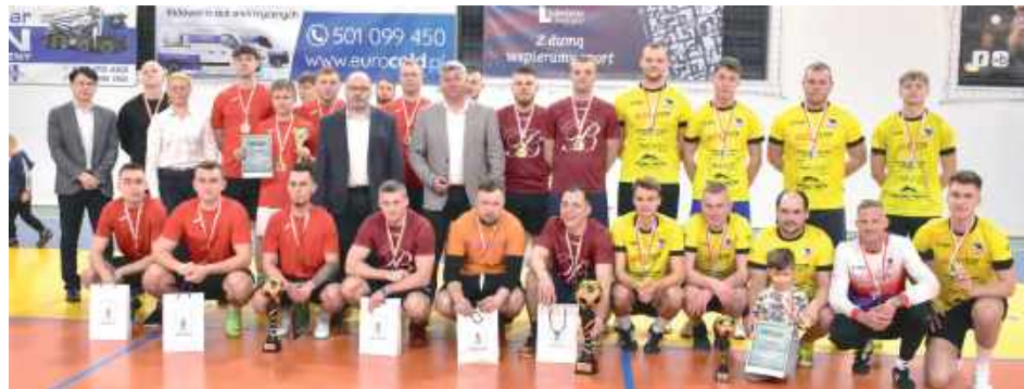
Najlepsze ekipy poprzedniego sezonu. Kto powalczy teraz o mistrzostwo?

Turniej odbędzie się w hali w Rykach, a jego formuła to emocjonujące rozgrywki ligowe zakończone fazą play-off. Na zwycięzców czeka presti-