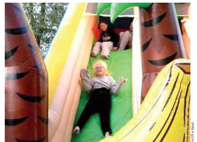
Podczas sobotniego wydarzenia panowała wyjątkowo ciepła i radosna atmosfera. Dzieci z entuzjazmem uczestniczyły w przygotowanych dla nich zabawach i animacjach