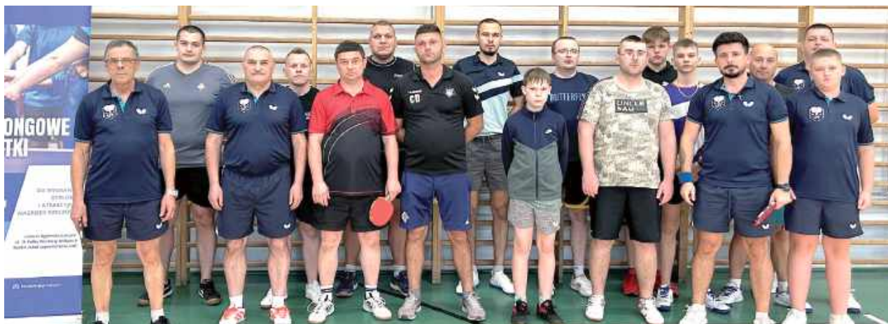
Pamiątkowe zdjęcie uczestników premierowej odsłony

Na uczestników czekają nie tylko sportowe emocje, lecz także atrakcyjne nagrody rzeczowe ufundowane przez renomowane tenisowe marki, takie jak Butterfly czy Tibhar. Rywalizacja toczy się w przyjaznej atmosferze, ale każdy