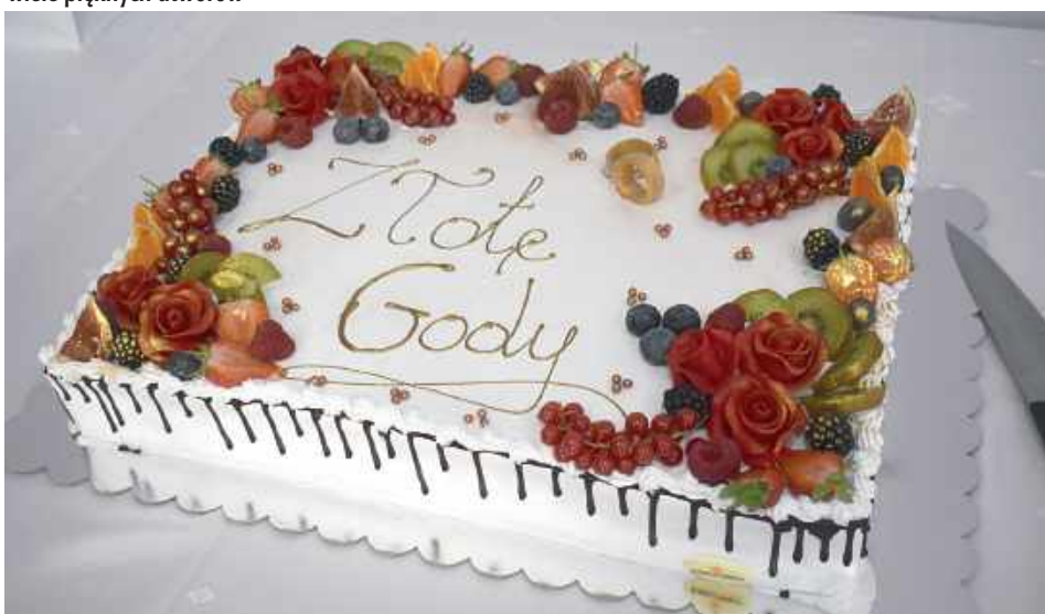
No i nie mogło zabraknąć tortu!