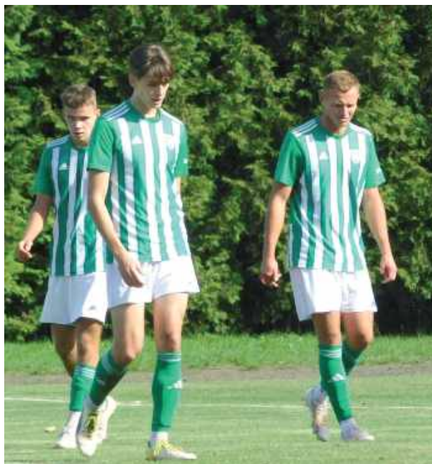
Nie tak miało być. Ruch został rozbity przez Janowiankę

Po dziewięciu kolejkach IV ligi Ruch stracił już niemal 30 bramek, co jest jednym z najgorszych wyników w lidze. Problem defensywy w zespole