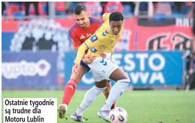
Ostatnie tygodnie są trudne dla Motoru Lublin