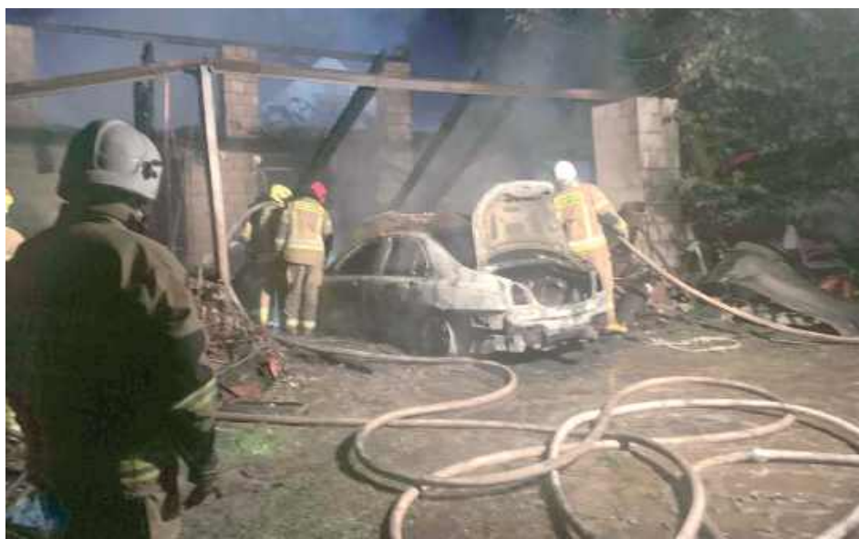
W budynku gospodarczym znajdowały się różnego rodzaju pojazdy, w tym samochód elektryczny, który uległ całkowitemu spaleni, ciągnik rolniczy, przyczepa ciągnikowa, maszyny rolnicze

W budynku gospodarczym znajdowały się różnego rodzaju pojazdy, w tym samochód elektryczny, który uległ całko-