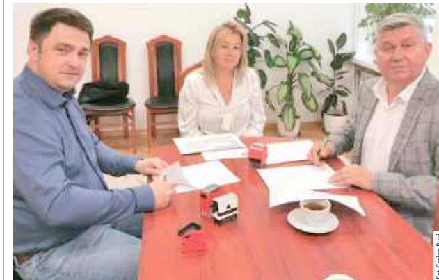
Przebudowana zostanie droga o długości 1913 metrów bieżących. Planowane jest wzmocnienie istniejącej podbudowy oraz wykonanie nowej nawierzchni bitumicznej, powstaną także nowe dojeżdża z kostki betonowej

Prawie dwa kilometry drogi zostaną zmodernizowane. Wyczekiwaną przez mieszkańców inwestycja niedługo się rozpocznie.