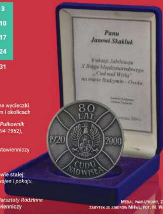
MEDEL PAMIĄTKOWY, 2000 r. ZABYTEK ZE ZBIORÓW MFAŁ, FOT. M. WOJŃSKA