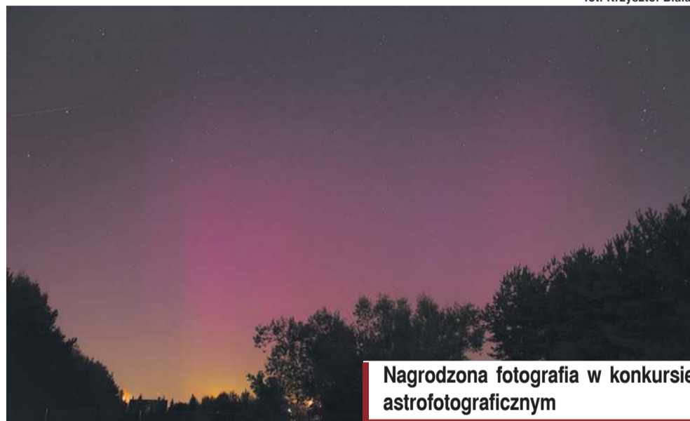
Nagrodzona fotografia w konkursie astrofotograficznym

• Blanka Cecota, Ambasadorka Edukacji Kosmicznej ESERO Polska, wygłosiła przemówienie,