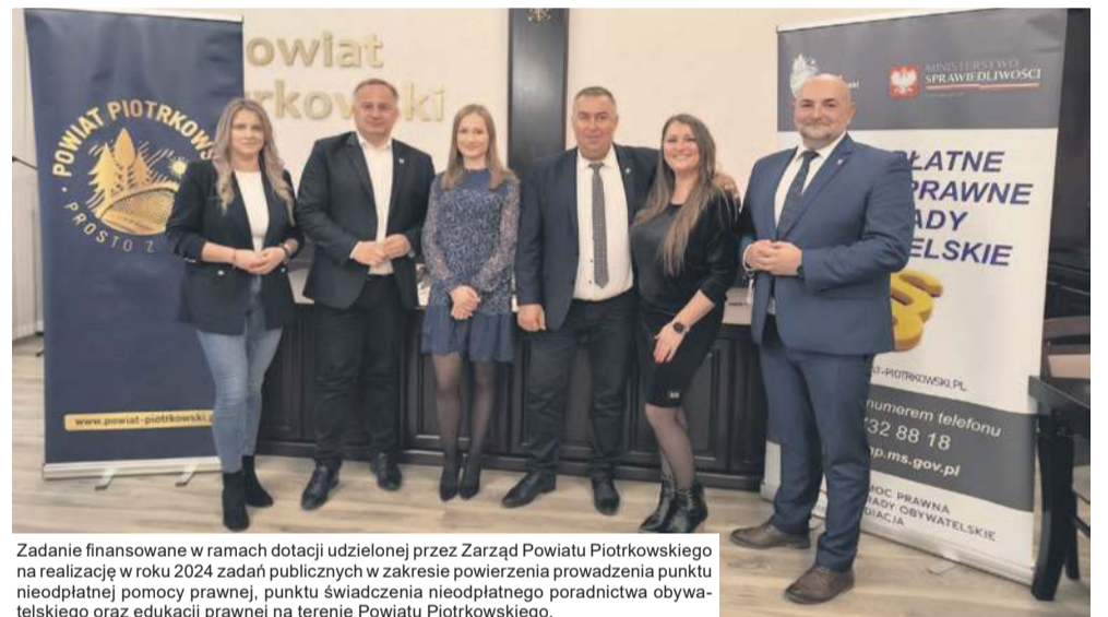
Zadanie finansowane w ramach dotacji udzielonej przez Zarząd Powiatu Piotrkowskiego na realizację w roku 2024 zadań publicznych w zakresie powierzenia prowadzenia punktu nieodpłatnej pomocy prawnej, punktu świadczenia nieodpłatnego poradnictwa obywatelskiego oraz edukacji prawnej na terenie Powiatu Piotrkowskiego.