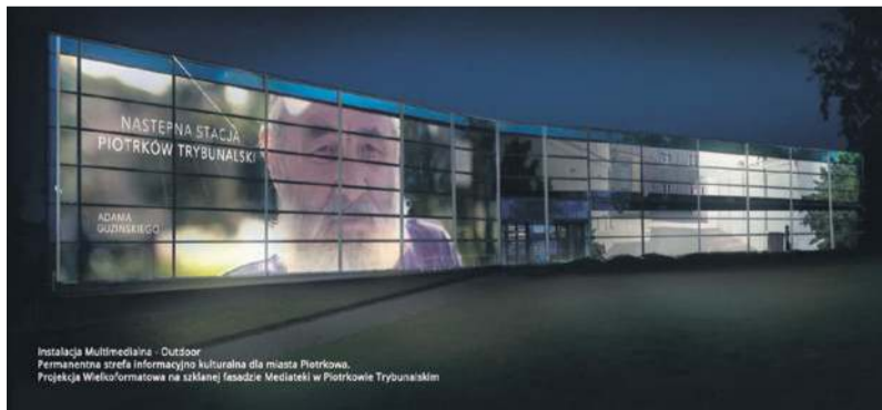
Instalacja Multimedialna - Outdoor Permanenna szrafa informacyjna dla miasta Piotrkowa. Projekcja wideo/formacje na szklanej fasadzie Mediateki w Piotrkowie Trybunalskim

Przypomniał, że dzięki 30 milionowej promesie do końca 2028 roku zrealizowanych będzie wiele inwestycji drogowych. - Całkowita przebudowa i rozbudowa ulicy Żelaznej, całkowita przebudowa ulicy Kwiatowej łącznie z odwodnieniem, budowa drogi ulicy Krótkiej, budowa drogi wewnętrznej na osiedlu Łódzka - wyjaśniał prezydent. Pieniądze