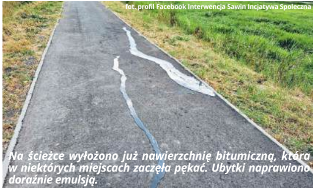
Na ścieżce wyłożono już nawierzchnię bitumiczną, która w niektórych miejscach zaczęła pękać. Ubytki naprawiono doraźnie emulsją.

Ścieżka pieszo-rowerowa w ciągu drogi wojewódzkiej nr 812 nie została jeszcze oddana do użytkowania, a mieszkańcy gminy zauważyli, że pojawiły się na niej pierwsze defekty. W sieci opublikowano zdjęcie rysy w nawierzchni bitumicznej, którą postanowiono naprawić doraźnie emulsją asfaltową. Wójt Agnieszka Dąbrowska zaznacza, że nie ma powodów do niepokoju.