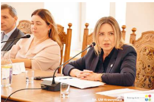
fol. UM Krasnystaw

Mieszkańcy ulicy Kickiego w Krasnymstawie będą musieli jeszcze poczekać na rozpoczęcie prac projektowych. Obecny wykonawca dokumentacji projektowej nie wywiązał się z umowy i została z nim zerwana. Wkrótce miasto ogłosi wybór nowego.