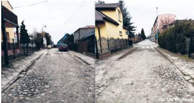
Po kocich łbach na ul. Rymarskiej wkrótce pozostanie wspomnienie

Miasto Trzech Kultur kontynuuje inwestycje drogowe, które mają poprawić komfort i bezpieczeństwo zarówno mieszkańców, jak i turystów. W ostatnich dniach ogłoszono przetarg na przebudowę ulicy Wąskiej, natomiast na ulicy Rymarskiej prace budowlane wchodzą już w decydującą fazę.