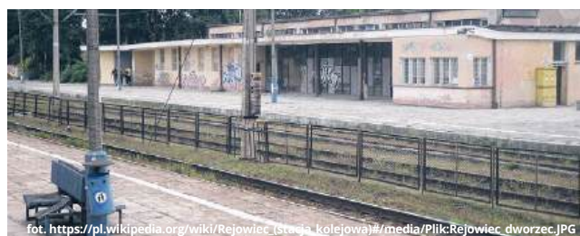
Stacja „Rejowiec” w Rejowcu Fabrycznym ma wkrótce zmienić swoje oblicze

- Położone na trasie przejazdu miejscowości, a więc i Rejowiec Fabryczny, staną się bardziej