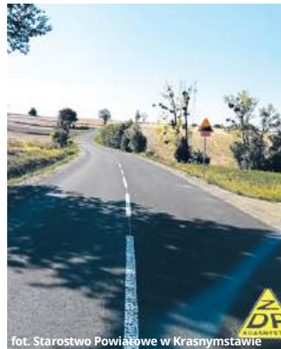
fol. Starostwo Powiatowe w Krasnymstawie

Na realizację przedsięwzięcia powiat krasnostawski pozyskał ponad 2,5 mln zł dofinansowania z Rządowego Funduszu Rozwoju Dróg w ramach naboru 2025. Łączny koszt kwalifikowalnej inwestycji wyniósł 5 071 260 zł, z czego po 1 267 682 zł dołoży-