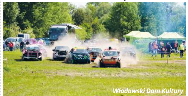
Włodawski Dom Kultury

Tegoroczna edycja Wrak Race Włodawa, podobnie jak poprzednie, będzie miała wymiar charytatywny. Tradycyjnie zbierane będą środki na rzecz potrzebujących z regionu. W tym roku wsparcie zostanie przekazane na rzecz