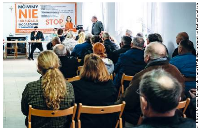
Zdjęcie ze spotkania przeciw biogazowni w Dołhobrodach w marcu 2025 r.