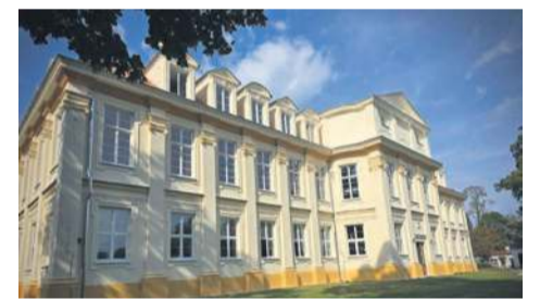
37. miejsce ZSCKU im. Andrzeja Frycza Modrzewskiego w Wolborzu