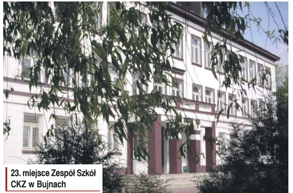
23. miejsce Zespół Szkół CKZ w Bujnach