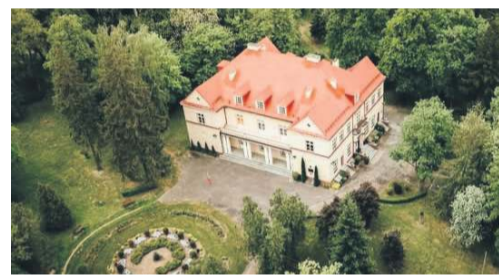
67. miejsce Zespół Szkół CKU im. Juliusza Poniatowskiego w Czarnocinie