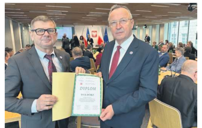
Ranking gmin miejsko - wiejskich 2023 r.