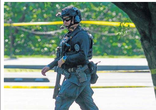
Policja oraz Secret Service nie ujawniają na razie, jakie były motywy działania postrzelonego mężczyzny

Ani policja, ani Secret Service nie określiły, jakie zamiary miał postrzelony mężczyzna. Chwilę przed incydem przejeżdżała obok kolumna pojazdów z wiceprezydentem J.D. Vance'em, lecz nic nie wskazuje, by miała ona związek ze strzelaniną.