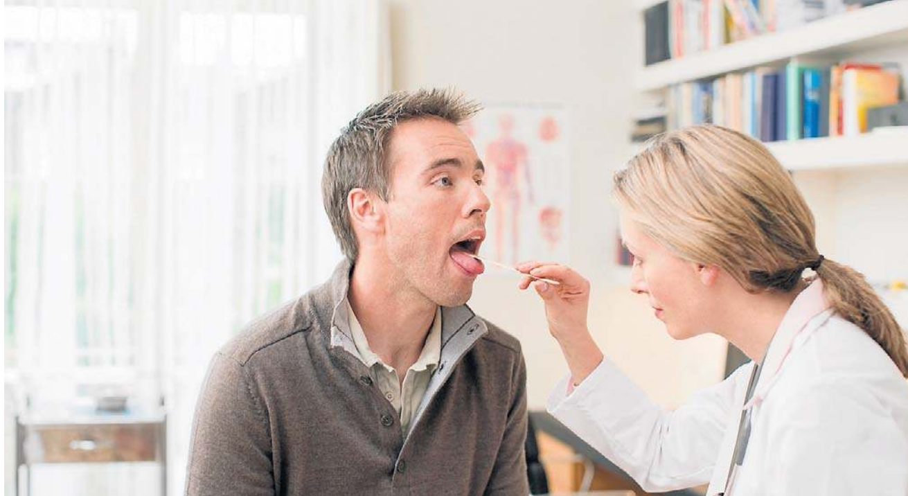
Grzybica jamy ustnej częściej występuje u osób osłabionych, po długotrwałej antybiotykoterapii, a także u pacjentów stosujących sterydy wziewne lub używających protez zębowych

- Zbilansowana dieta, to znaczy taka, która dostarcza organizmowi w odpowiedniej ilości składniki odżywcze, witaminy i minerały, to podstawa zdrowia. Wielu zapomina, że to, co jemy, ma też wpływ na mikroby żyjące w naszym organizmie. Generalnie nadpodaż cukrów prostych: ze słodyczy, dań instant oraz wysoko przetworzonych, niesie ze sobą ryzyko próchnicy, chorób dziąseł i wspomnianej drożdżycy.