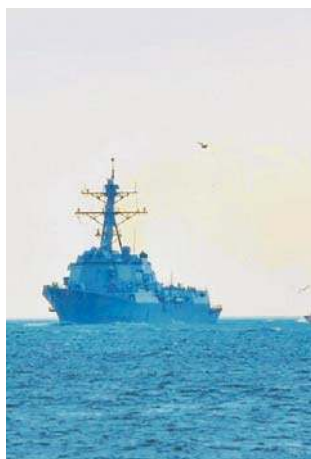
Niszczyciel USS Truxtun, zdjęcie z 2014 roku

Tranzyt niszczycieli nastąpił po ogłoszeniu przez prezydenta Donalda Trumpa, że Stany Zjednoczone pomogą przeprowadzać statki przez cieśninę Ormuz, zablokowaną przez Iran w pierwszych dniach