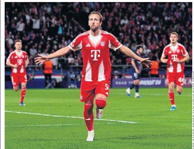
Napastnik Bayernu Monachium - Harry Kane ma już 53. gole strzelone w Lidze Mistrzów, co daje mu 10. miejsce