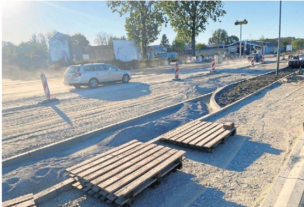
Modernizacja ulicy Zacisze w Zielonej Górze to jeszcze nie koniec utrudnień. Rozpoczęła się teraz przebudowa ronda

- Przebudowa ronda im. Haliny Lubicz wiąże się bezpośrednio z budową Trasy Aglomeracyjnej, która powinna zakończyć się najpóźniej w połowie 2028 roku. W ramach inwe-