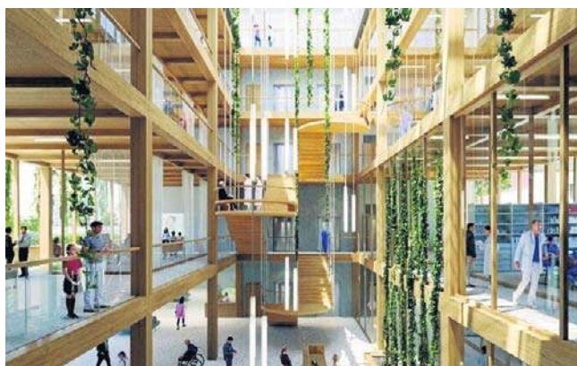
Obiekt ma być dobrze doświetlony, przeszklony, z elementami wykonanymi z materiałów imitujących drewno

Wszyscy na ten moment czekali z niecierpliwością. Wieść, że szpital dostanie pieniądze na budowę centrum onkologicznego przyszła w październiku ubiegłego roku. Ale dopóki umowa nie została podpisana, nie można było podjąć kolejnych kroków, związanych z tym tak ważnym zdrowotnym zadaniem. Teraz lada moment lecznica podpisze umowę na opracowanie dokumentacji projektowej z biurem, które wygrało konkurs na projekt architektoniczny tj. Kalata Architektki we współpracy