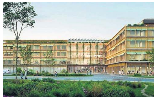
W nowym budynku znajdują się m.in.: chirurgia onkologiczna i klatki piersiowej, hematologia i urologia, Centralny Blok Operacyjny oraz poradnie specjalistyczne

Co się znajdzie w nowoczesnym budynku? Między innymi: chirurgia onkologiczna i klatki piersiowej, hematologia i urologia, Centralny Blok Operacyjny, poradnie specjalistyczne, Zakład Medycyny