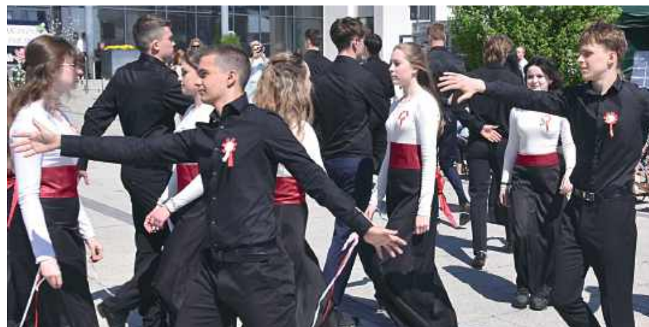
Mieszkańcy Garwolina oraz przybyli goście wysłuchali spektaklu słowno-muzyczno-tanecznego „Moja Ojczyzna, Moja Polska” w wykonaniu uczniów Zespołu Szkół nr 2 im. Tadeusza Kościuszki w Garwolinie

w wykonaniu uczniów Zespołu Szkół nr 2 im. Tadeusza Kościuszki.