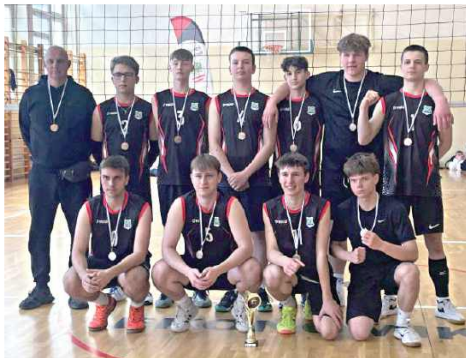
mp Zespół ZS nr 2 w Garwolinie zajął trzecią pozycję