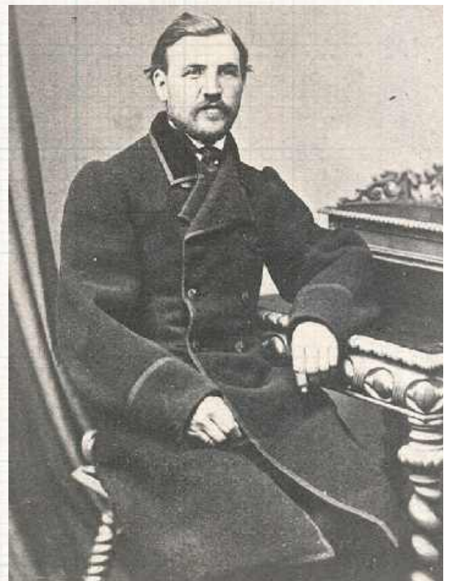
Pptk Józef Jankowski ps. „Szydłowski” w dobie Powstania Styczniowego dowodził oddziałem powstańczym składającym się głównie z chłopów, z którym stoczył ponad 30 walk. Walczył na terenie Mazowsza, w guberni lubelskiej, koło Sandomierza i na Podlasiu