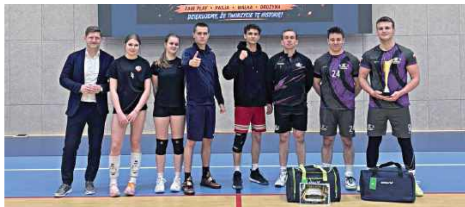
Najlepsi z najlepszych - Furia Volley