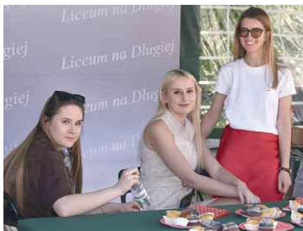
Piknik Patriotyczny był doskonałą okazją do integracji mieszkańców i wspólnego świętowania