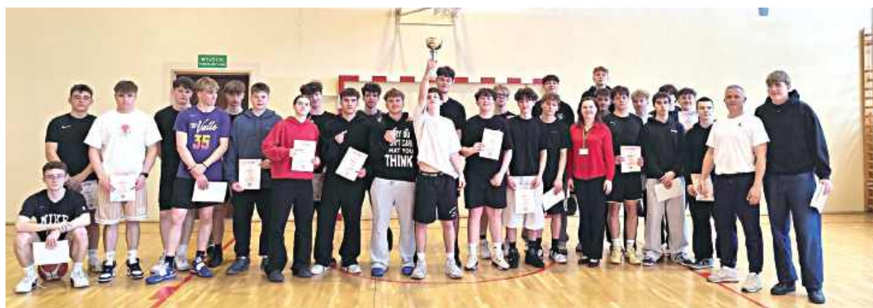
Pamiątkowe zdjęcie ekip

Po zaciętej fazie grupowej i pucharowej do najlepszej czwórki awansowały klasy: 4TE, 3TE, 3TRach oraz 3TRek. Kulminacyjnym punktem turnieju