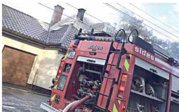
Sytuacja była poważna – pożar był już rozwinęty i wymagał natychmiastowej, intensywnej akcji gaśniczej

Do groźnego pożaru budynku mieszkalnego doszło 28 kwietnia wieczorem w Łaskarzewie. Ogień objął poddasze domu przy ul. Kardynała Stefana Wyszyńskiego. W działaniach gaśniczych uczestniczyło siedem zastępów straży pożarnej, a akcja trwała ponad dwie godziny.