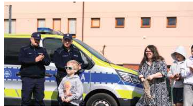
Obecność policjantów na pikniku była okazją do bezpośredniego kontaktu z młodymi osobami, rozmów o ich problemach oraz promowania odpowiedzialnych zachowań

W Garwolinie edukacja i dobra zabawa połączyły się w jedno. Podczas pikniku ekologicznego zorganizowanego w Publicznej Szkole Podstawowej nr 2 im. 1 Pułku Strzelców Konnych ważną rolę odegrali policjanci z Komendy Powiatowej Policji, którzy przygotowali specjalne stoisko profilaktyczne dla uczniów.