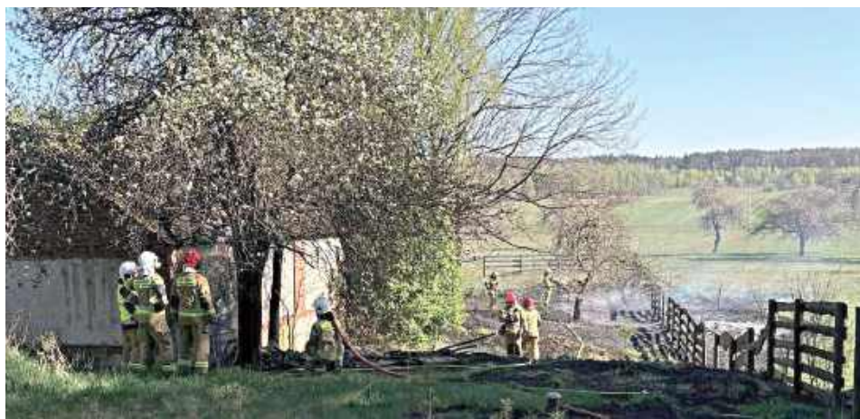
Działania strażaków polegały na zabezpieczeniu miejsca zdarzenia oraz podaniu trzech prądów wody

Wystarczyła chwila, by spokojny poranek zamienił się w akcję ratunkową. Ogień objął łąki i budynek gospodarczy w Łucznicy, a płomienie szybko zaczęły się rozprzestrzeniać. Na miejsce ruszyły trzy zastępy straży pożarnej, które przez ponad dwie godziny walczyły z żywiołem.