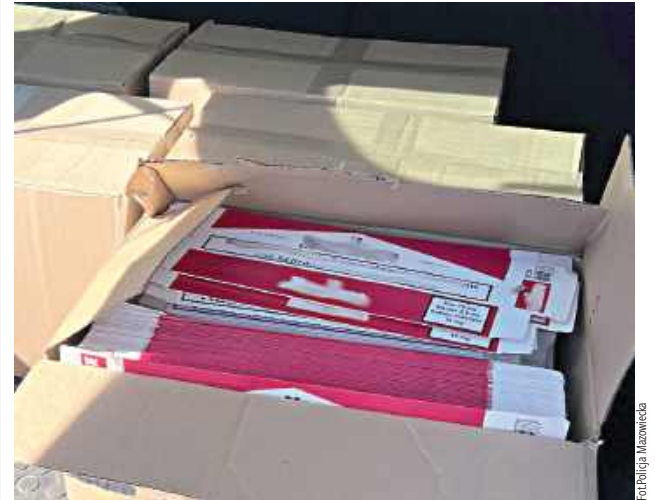
Policjanci z Ostrołęki rozbili zorganizowaną grupę przestępczą zajmującą się nielegalną produkcją papierosów, zatrzymując kilka osób i likwidując zaplecze działalności przestępczej

Policjanci z Ostrołęki rozbili zorganizowaną grupę przestępczą zajmującą się nielegalną produkcją papierosów, zatrzymując kilka osób i likwidując zaplecze działalności przestępczej.