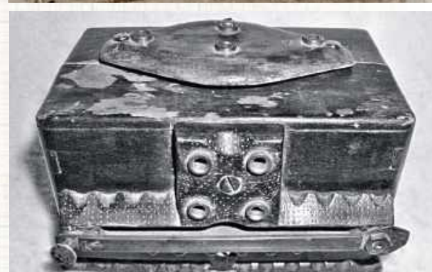
Radio kryształkowe: Strojenie do stacji odbywało się suwakiem widocznym u dołu zdjęcia. Nad suwakiem dwa podwójne gniazdzka na słuchawki. U góry – pośrodku miejsce na detektor kryształkowy, a dwa skrajne gniazdzka służyły do podłączenia anteny i uziemienia