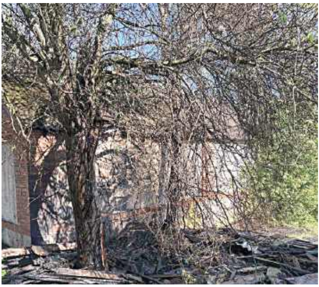
Ogień przeniósł się na budynek gospodarczy