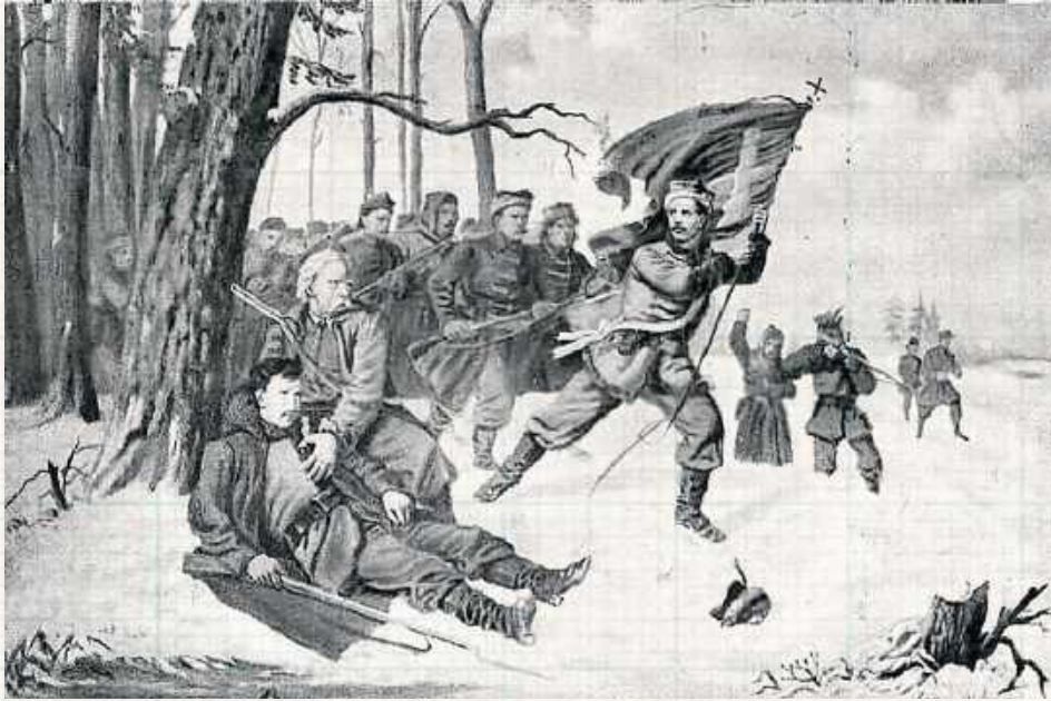
Powstańcy Styczniowi prowadzeni do boju przez Walentego Lewandowskiego

Mówiąc o bitwie pod Łucznicą, nie sposób nie wspomnieć o rozegranym dzień wcześniej lub 18