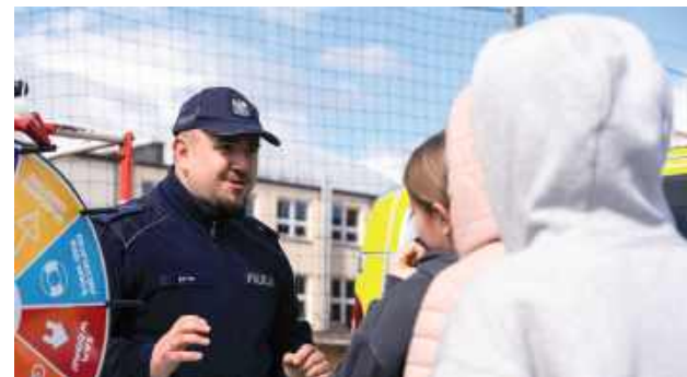
Dużym zainteresowaniem cieszyły się zagadnienia związane z bezpieczeństwem w ruchu drogowym