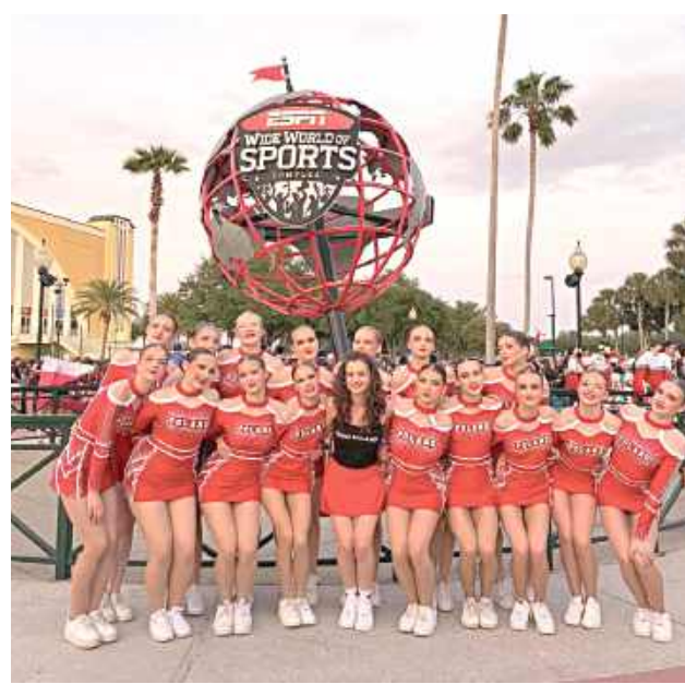
W Orlando spotykają się najlepsze zespoły z całego świata. Udział w takich zawodach to już sukces – a miejsce w pierwszej dziesiątce to potwierdzenie światowego poziomu