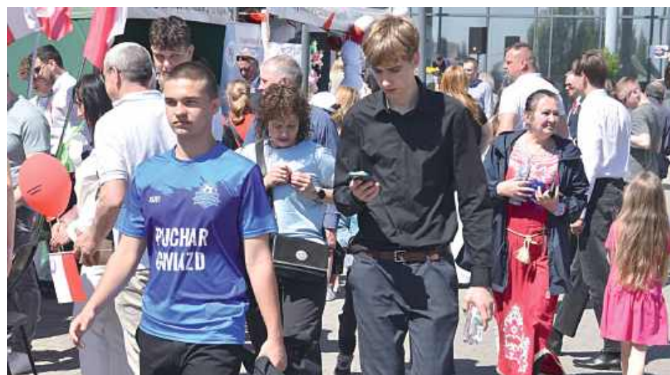
Obchody miały uroczysty i patriotyczny charakter, łącząc oficjalną ceremonię z rodzinną zabawą podczas Pikniku Patriotycznego