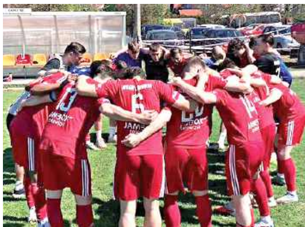
Piłkarze Wilgi ponieśli dwie porażki. Nie mają czasu na rozpamiętywanie, gdyż przed nimi kolejne spotkania

MAZUR KARCZEW - WILGA GARWOLIN 2:1 (1:1) Bramki: Staluszka 20', Trochim 90+2' - Wawryszczuk 33' (k) Wilga: Kowalczyk - D. Papiernik (64' Grzegorzczuk), Gimel,