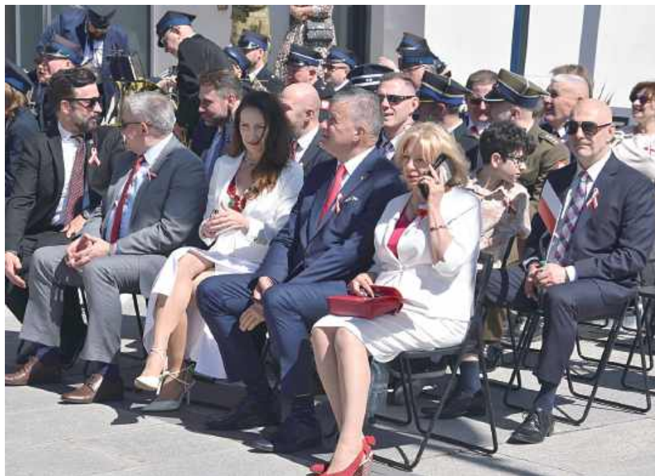
Swoją obecnością wydarzenie zaszczylicili przedstawiciele władz państwowych, powiatowych, miejskich i gminnych, a także reprezentanci służb mundurowych i jednostek organizacyjnych

Mieszkańcy Garwolina oraz przybyli goście wysłuchali spektaklu słowno-muzycznego „Moja Ojczyzna, Moja Polska”