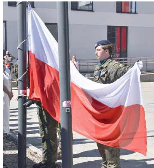
Odegrany został Hymn Państwowy – na maszt wciągnięto biało-czerwoną flagę