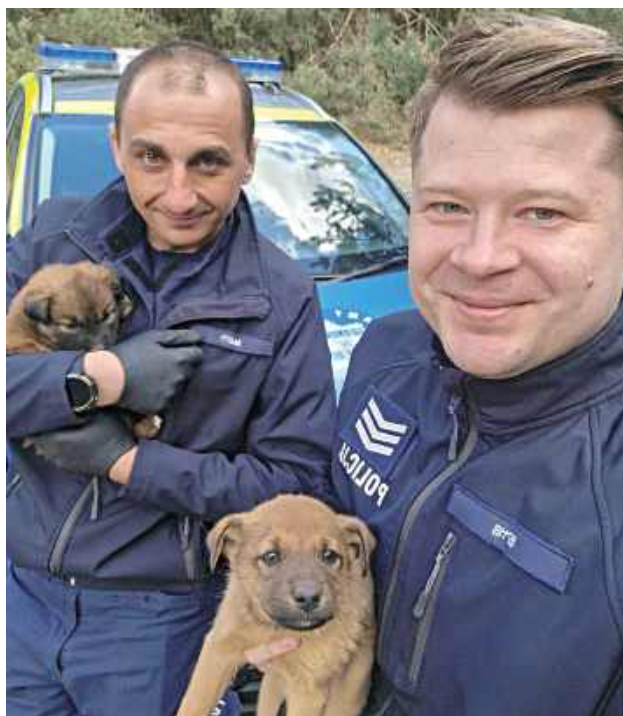
Policja przypomina, że porzucenie zwierzęcia stanowi formę znęcania się i jest przestępstwem zgodnie z ustawą o ochronie zwierząt

Funkcjonariusze natychmiast podjęli działania ratunkowe. Zapewnili szczeniętom wodę oraz doraźną opiekę i ciepło, zabezpieczając je do czasu przyjazdu odpowiednich służb. Następnie zwierzęta zostały przekazane pracownikom