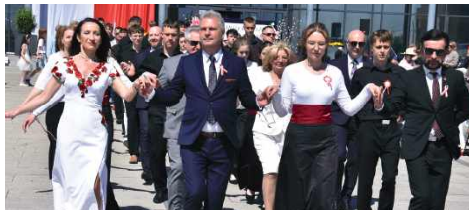
Przybyli goście na placu przed Starostwem Powiatowym zatańczyli Poloneza - polski taniec narodowy, nazywany w przeszłości tańcem dworskim