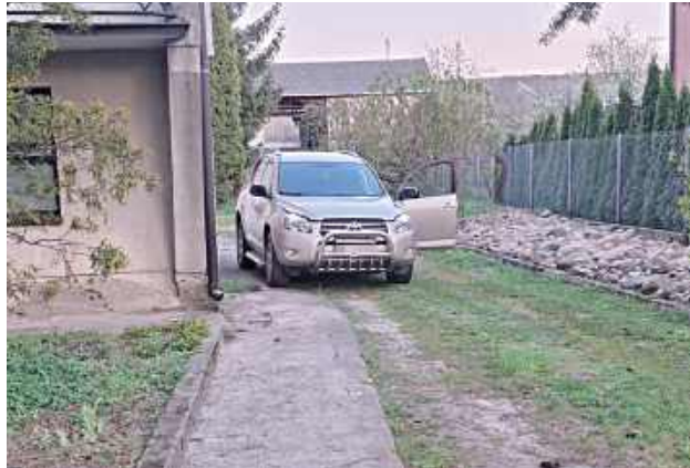
Odzyskany samochód został zwrócony właścicielowi, a zatrzymani trafili do policyjnej celi

Funkcjonariusz natychmiast przekazał informację patrolom. Podczas gdy część policjantów ustalała szczegóły