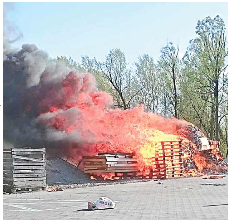
Ogień pojawił się po godzinie 17.30 na placu za budynkiem

Cztery zastępy straży pożarnej interweniowały w niedzielne popołudnie w Samogoszcy (gmina Maciejowice), gdzie doszło do pożaru na terenie przy jednym ze sklepów. Ogień pojawił się po godzinie 17.30 na placu za budynkiem.