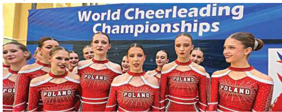
To wielki sukces zawodniczek z Garwolina