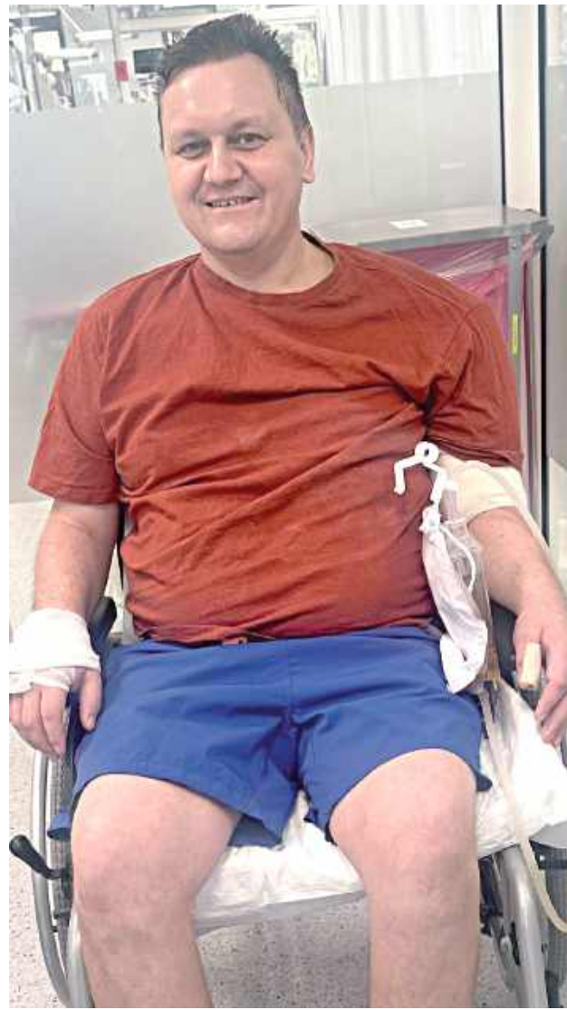
Rodzina podkreśla, jak ważna jest każda forma pomocy. – Waszym dobrym słowem, modlitwą, wiadomością jest nam z córką dużo łatwiej