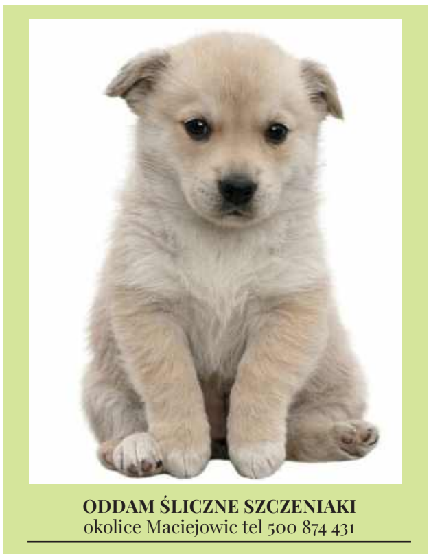
ODDAM ŚLICZNE SZCZENIAKI okolice Maciejowic tel 500 874 431

CIELAKI jałoweczki białe-czarne; 2 sztuki; cena do uzgodnienia; okolice Garwolina; Tel. 695 526 711