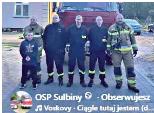
Druhowie z Ochotniczej Straży Pożarnej w Sulbinach i OSP Miętne wsparli akcję Fundacji Cancer Fighters