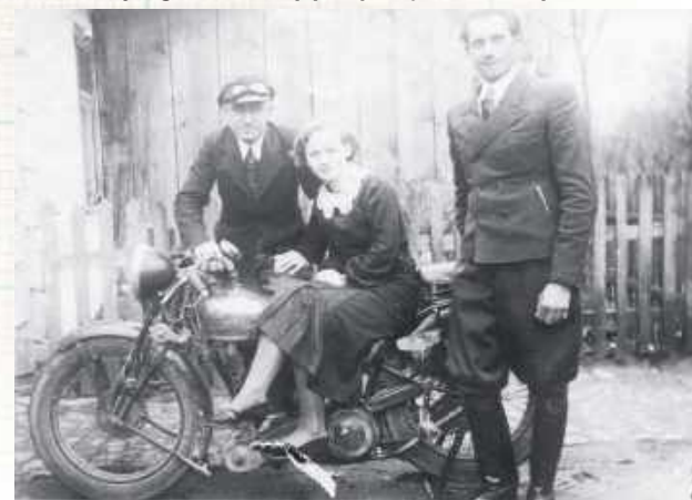
Zdjęcie z 1936 roku – na wsi pod Garwolinem 90 lat temu, ale motocykl ma już „współczesny” wygląd. Nad oknem po lewej widoczny jest izolator – pozostałość po prądzie z młyna