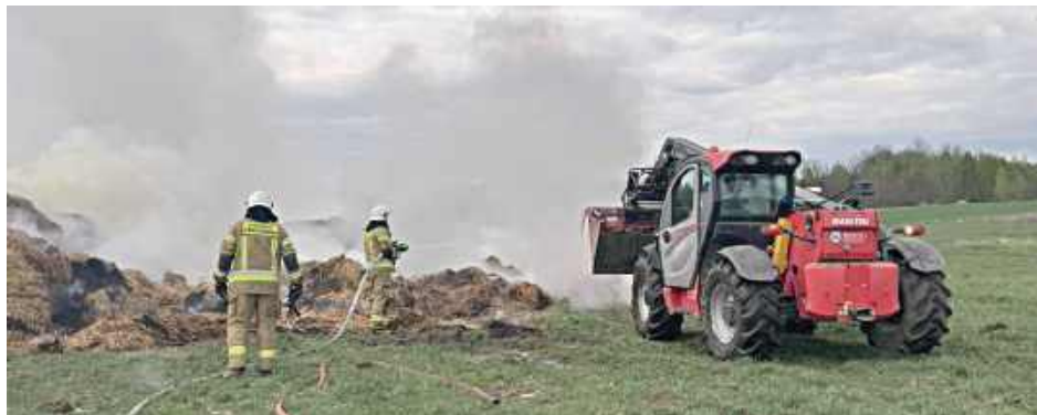
Zatrzymany 29-latek trafił do policyjnej celi, a następnie usłyszał zarzut zniszczenia mienia. Mężczyzna przyznał się do winy

Zgłoszenie o pożarze wpłynęło do służb około godziny 17. Na miejsce natychmiast skierowano kilka zastępów straży pożarnej. Akcja gaśnicza była wymagająca i trwała blisko cztery godziny. Strażacy skupili się nie tylko na opanowaniu ognia, ale również na dokładnym doga-