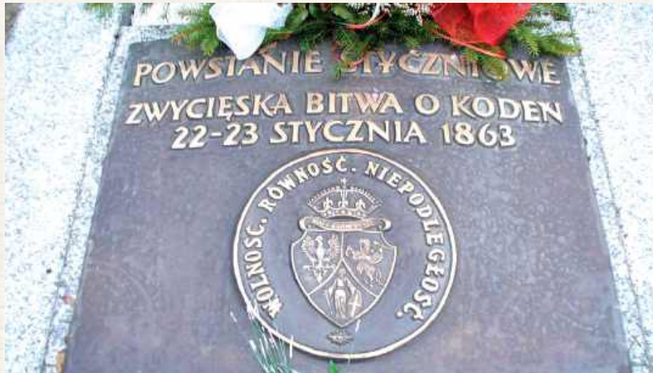
Kodeń był jednym z nielicznych ośrodków, gdzie plan ataku w Noc Styczniową został zrealizowany. Grób poległych znajduje się na cmentarzu katolickim

Zaczęto się szykować, mimo że sami dowódcy w powiatach pisali do Gregorowicza, że „krok podobny uważają za najgubniejszy dla narodowej sprawy, że w obecnych okolicznościach nakaz do powstania jest zdradą, celem zniszczenia organizacji i narażenia