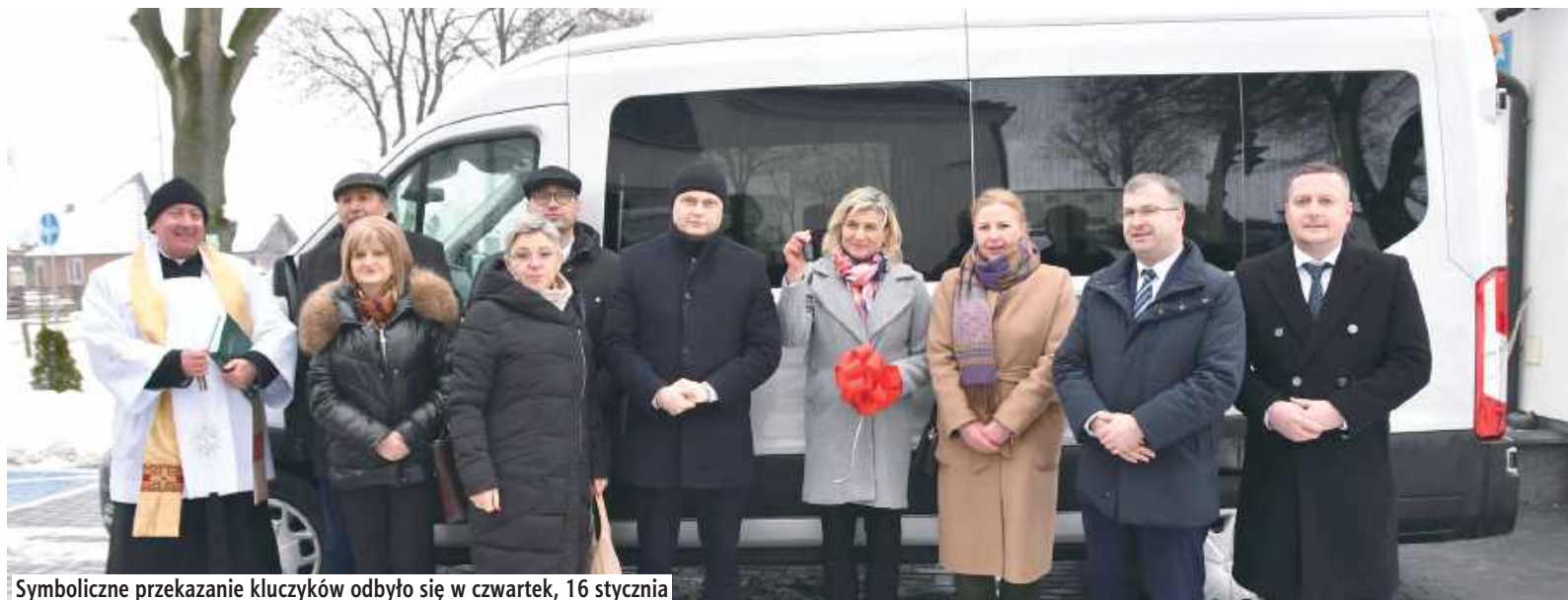
Symboliczne przekazanie kluczyków odbyło się w czwartek, 16 stycznia

– Dzięki zaangażowaniu wielu osób oraz wsparciu naszej społeczności, udało się zrealizować projekt, który pomoże poprawić komfort życia osób z niepełnościami – podkreślili przedstawiciele starostwa powiatowego w Łęcznej.