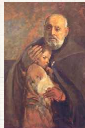
Adam Chmielowski studiował w Puławach i poszedł do powstania. W walkach stracił nogę. Potem był wybitnym malarzem, a po przejściu duchowej przemiany został zakonnikiem, który jako Brat Albert został opiekunem biedaków i katolickim świętym