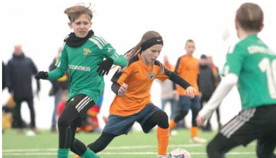
Zespół Górnika zajął piąte miejsce na turnieju w Koziencicach