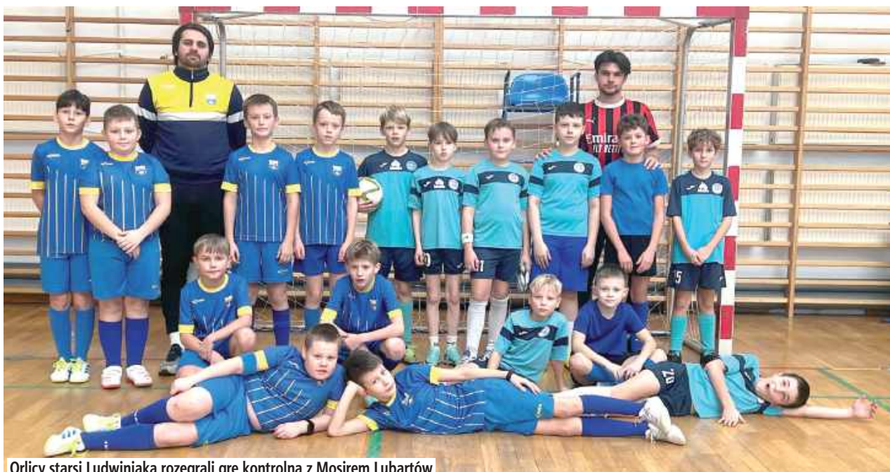
Orlicy starsi Ludwiniaka rozegrali grę kontrolną z Mosirem Lubartów