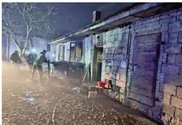
Pożar zauważono w niedzielę ok. godz. 19

O pożarze w gminie Niedźwiada służby zostały powiadomione w niedzielę 19 stycznia około godz. 19. Pożar zauważyła osoba postronna. - W trakcie prowadzenia akcji ratowniczo - gaśniczej strażacy wydobyli z wnętrza płonącego budynku 76-letniego mężczyznę, który nie dawał oznak życia. Niestety