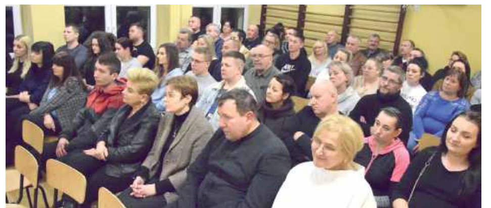
Na spotkanie w Malinówce przyszło około 50 osób

- Troszczymy się o dzieci. Starsi uczniowie zostaną przeniesieni do innych szkół, ale da-