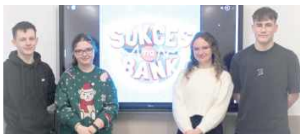
Finaliści zostali wyłonieni poprzez test online

Niebawem w Telewizji Polskiej zobaczymy uczniów klasy trzeciej technikum rachunkowości. Drużyna znalazła się w gronie 16 najlepszych zespołów z całej Polski, które będą rywalizować o 20 tys. zł.