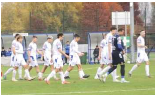
Lewartowianie rozpoczęli okres przygotowawczy od pewnego zwycięstwa

Spotkanie jak przystało na faworyta, nasz zespół miał pod kontrolą niemal przez cały czas jego trwania. Lewart od początkowych minut utrzymywał się przy piłce i konstruował ataki na bramkę rywali. Pierwszą dogod-