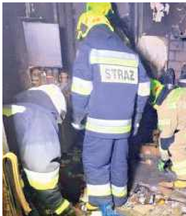
Strażacy wynieśli z płonącego domu mężczyznę, nie udało się go uratować