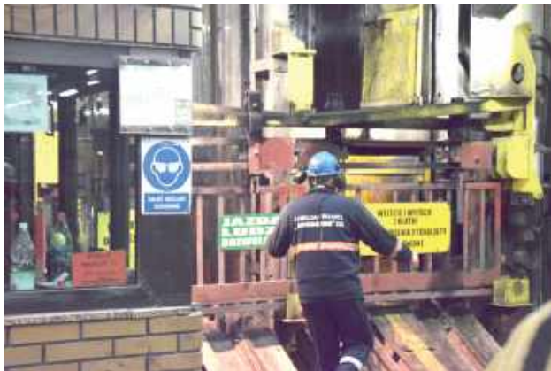
W tej chwili Enea odbiera rocznie 7-8 mln ton węgla z Bogdanki. Ale już w 2030 r. chce spalać w swoich elektrowniach 4,5 mln ton