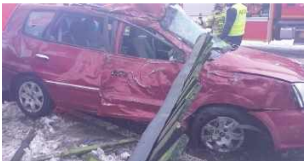
Samochód zjechał na prawe pobocze drogi, po czym uderzył w znak drogowy, przydrożne drzewo i ogrodzenie posesji

POWIAT RYCKI: Kierujący osobową kłm zjechał na pobocze, a następnie uderzył w znak drogowy, przydrożne drzewo i ogrodzenie posesji. W wyniku zdarzenia śmierć na miejscu poniósł 19-letni pasażer. 27-letni kierujący, który trafił do szpitala, miał prawie promil alkoholu w organizmie i nie miał prawa jazdy.