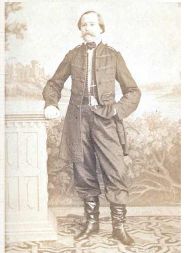
Aleksander Szaniawski poprowadził udany atak na Łomazy. Poległ kilka tygodni później pod Sycyną, pochowany jest w podziemiach kościoła św. Anny w Białej Podlaskiej