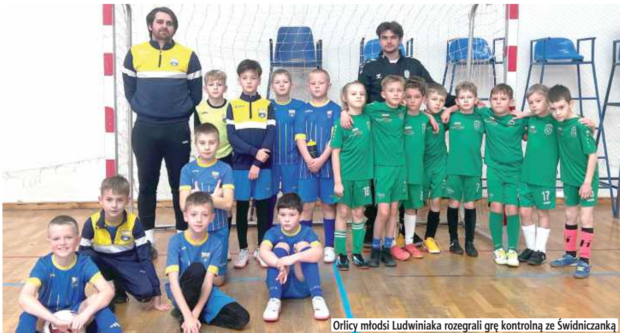
Orlicy młodszy Ludwiniaka rozegrali grę kontrolną ze Świdniczką