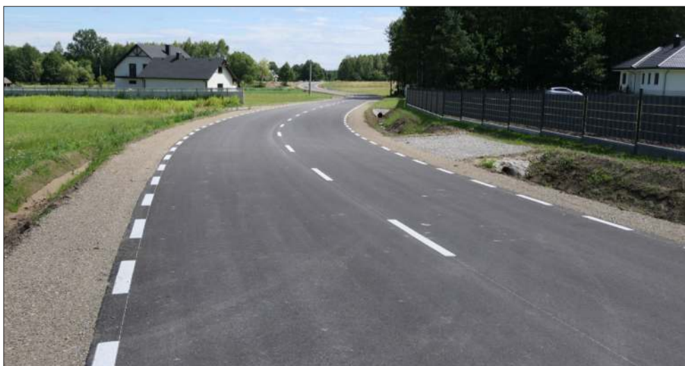
Jedna z ostatnich inwestycji powiatowych: nowa nawierzchnia, pobocza, odwodnienie i pełna infrastruktura techniczna sprawiły, że dawna droga gruntowa w Kłapówce zyskała standard nowoczesnej trasy klasy Z.