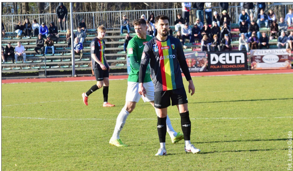
Piłkarze Sokola bezbramkowo zremisowali z Podlasie Biała Podlaska.