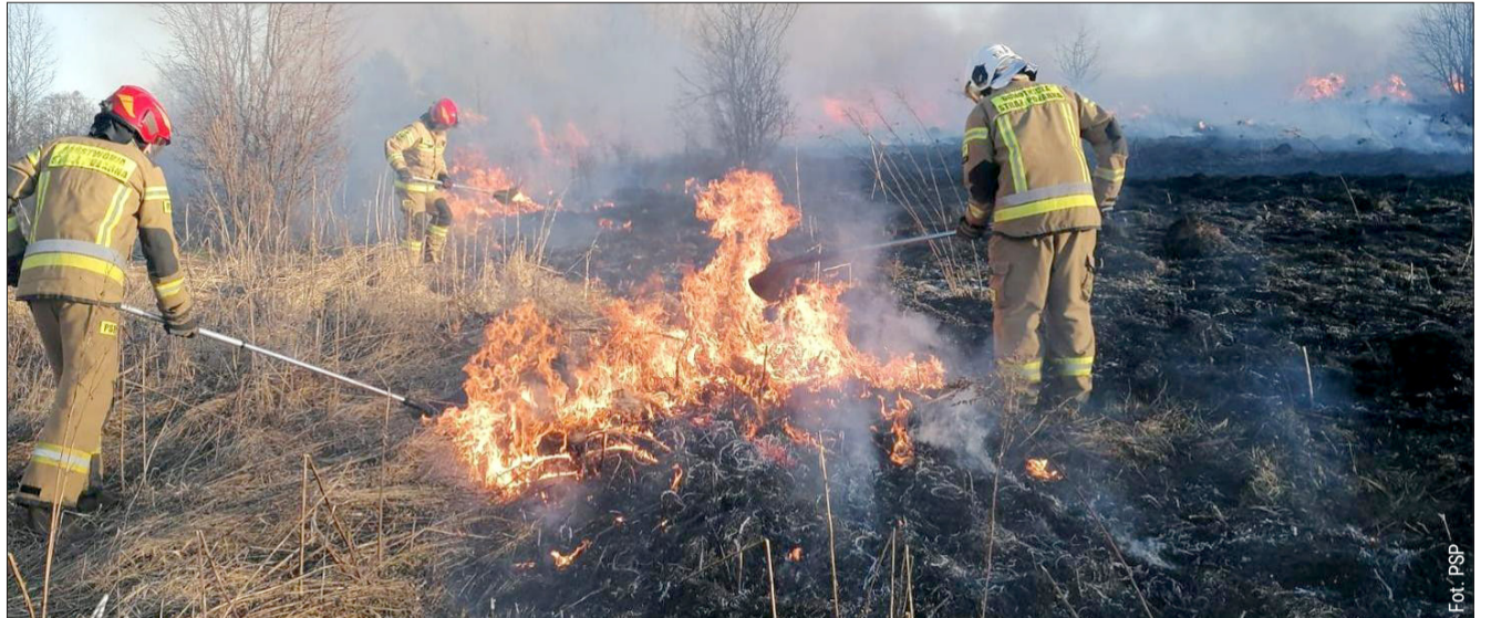
Wypalanie traw to coroczny problem z całej Polsce.

Państwowa Straż Pożarna nie pozostawia złudzeń – to nie są przypadki, to efekt ludzkiej bezmyślności. Liczba 4790 interwencji od początku roku pokazuje skalę zjawiska, które angażuje ogromne siły i środki, których może zabraknąć tam, gdzie akurat ktoś będzie walczył o życie w wypadku samochodowym.