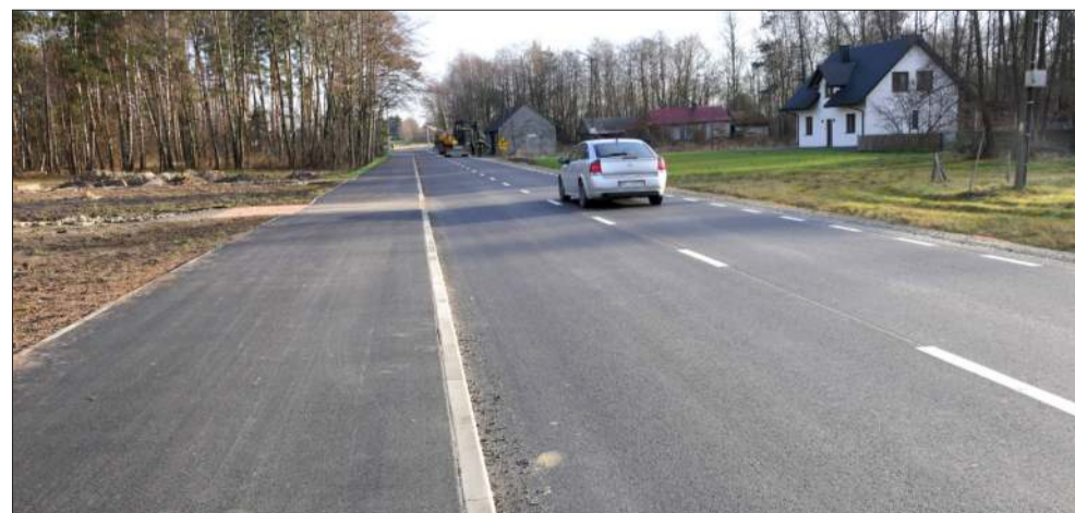
I kolejna udana inwestycja drogowa, tym razem w Kupnie, która obejmowała: poszerzenie jezdni do 6 metrów, budowę ścieżki pieszo-rowerowej o szerokości 3 metrów na prawie 3-kilometrowym odcinku, modernizację odwodnienia, wykonanie poboczy, zjazdów oraz nowego oznakowania pionowego i poziomego, które zwiększa czytelność i bezpieczeństwo ruchu.