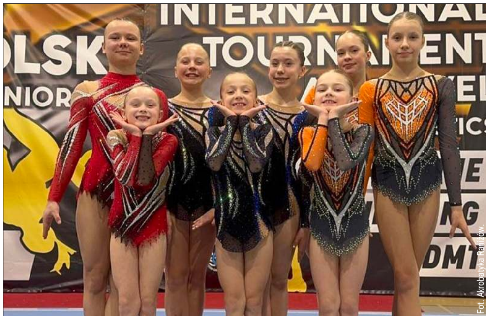
Akrobatki z Ranizowa wystartowały w Krakowie.

Rywalizacja w kategorii Mini-Youth zawsze wzbudza duże emocje – to tutaj młode talenty szlifują swoje umiejętności, łącząc siłę, precyzję i niesamowitą koordynację. Reprezentantki klubu Akrobatyka Ranizów w Krakowie pokazały się ze znakomitej strony udowad-