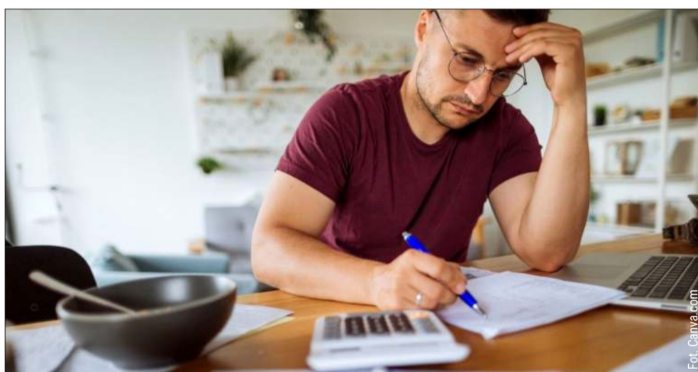
Wyjaśniamy, jak czytać „między wierszami” i jak skutecznie negocjować z zakładem energetycznym.

To jedna z najbardziej kontrowersyjnych pozycji. Może