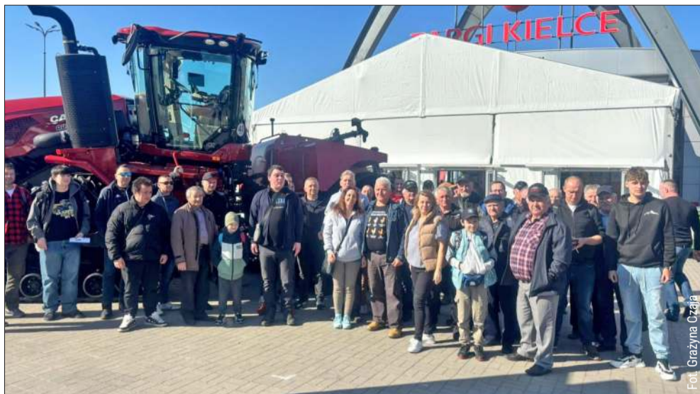
Rolnicy z powiatu kolbuszowskiego pojawili się na wielkich targach w Kielcach.

Rolnicze serwisy informacyjne podkreślały, że już od pierwszego dnia w Kielcach panował ogromny ruch. Wystawę oficjalnie otwarto w piątek rano, a dojazd do hal targowych od początku dnia był bardzo intensywnie uczęszczany.