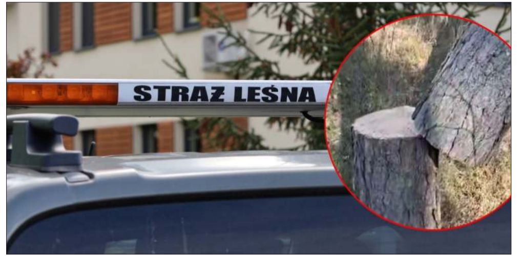
Sprawę nieudolnej próby kradzieży drewna bada kolbuszowska Straż Leśna.

Jak dodaje, na miejscu próbowano nieudolnie ściąć dwa drzewa, jednak działania zakończyły się fiaskiem. Na razie