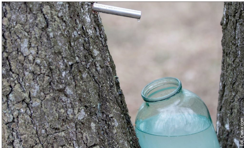
Sok z brzozy to cenne źródło od natury.

Złota zasada: Soki ruszają, gdy ziemia rozmarznie, dni stają się cieplejsze (ok. 5–8°C), a nocą wciąż zdarzają się lekie przymrozki.