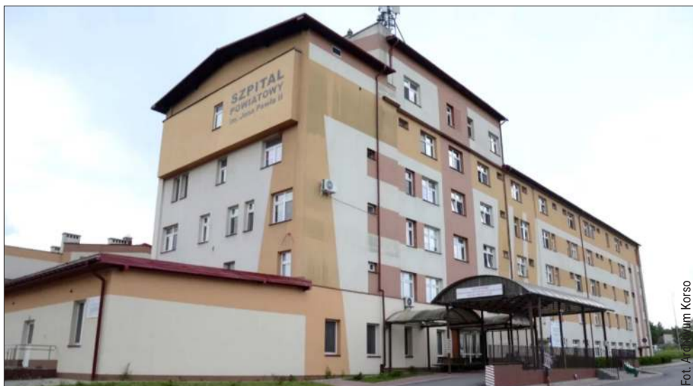
Szpital Powiatowy w Kolbuszowej przeszedł serię kluczowych modernizacji.

Adaptacja pracowni endoskopii: 318 800 zł Tworzenie Oddziału Geriatrii: 125 000 zł Modernizacja dachu: 122 200 zł Sprzęt do dializ (aparaty i stanowiska): 101 000 zł Wyposażenie Oddziału Wewnętrznego: 52 900 zł Dzięki systematycznemu wsparciu powiatu, szpital w Kolbuszowej sukcesywnie skraca dystans do największych ośrodków medycznych w regionie, stawiając na specjalistyczną opiekę blisko domu pacjenta