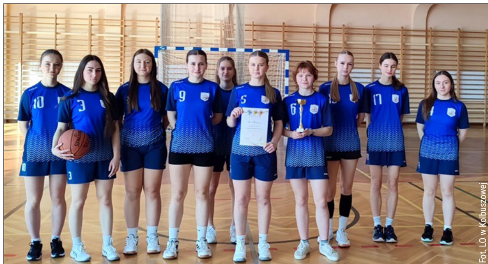
Uczennice z LO w Kolbuszowej były najlepsze wśród dziewcząt