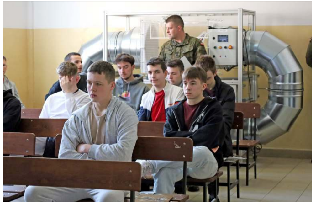
Młodzi mieszkańcy powiatu kolbuszowskiego rozpoczęli kwalifikację wojskową.