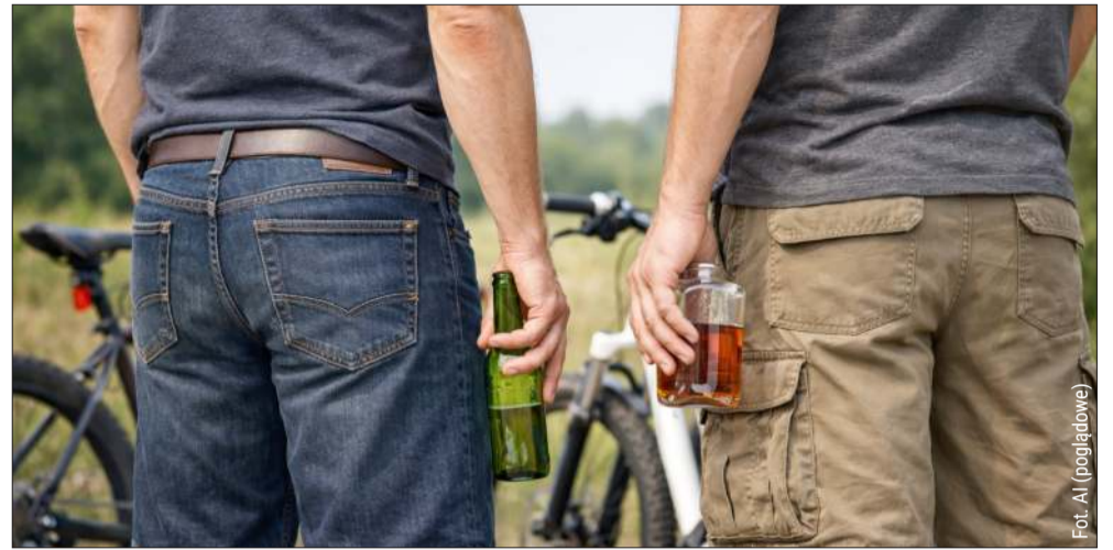
Nie odstrasza ani kary, ani konfiskata. Kolejni pijani zatrzymani.