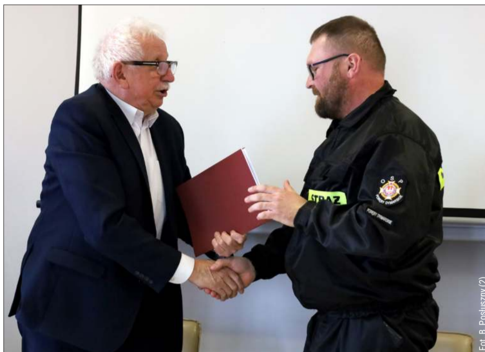
Wsparcie trafiło także do druhów z powiatu kolbuszowskiego.

Agregaty otrzymają również szkoły prowadzone przez powiat: Liceum Ogólnokształcące