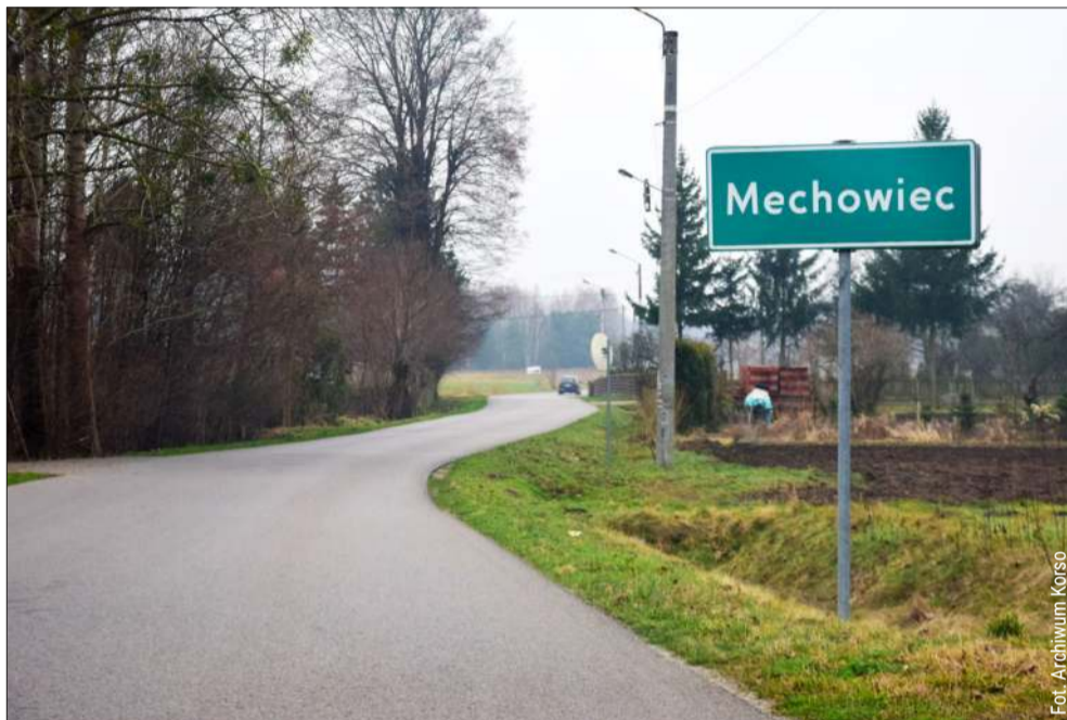
„Nie po to budowaliśmy domy”. Za nami gorąca debata o strzelnicy w Mechowcu.

Podczas spotkania drugi z inwestorów przedstawił tech-