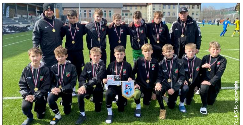
Młodziki KKS-u zaprezentowali się z dobrej strony w Zakopanem.