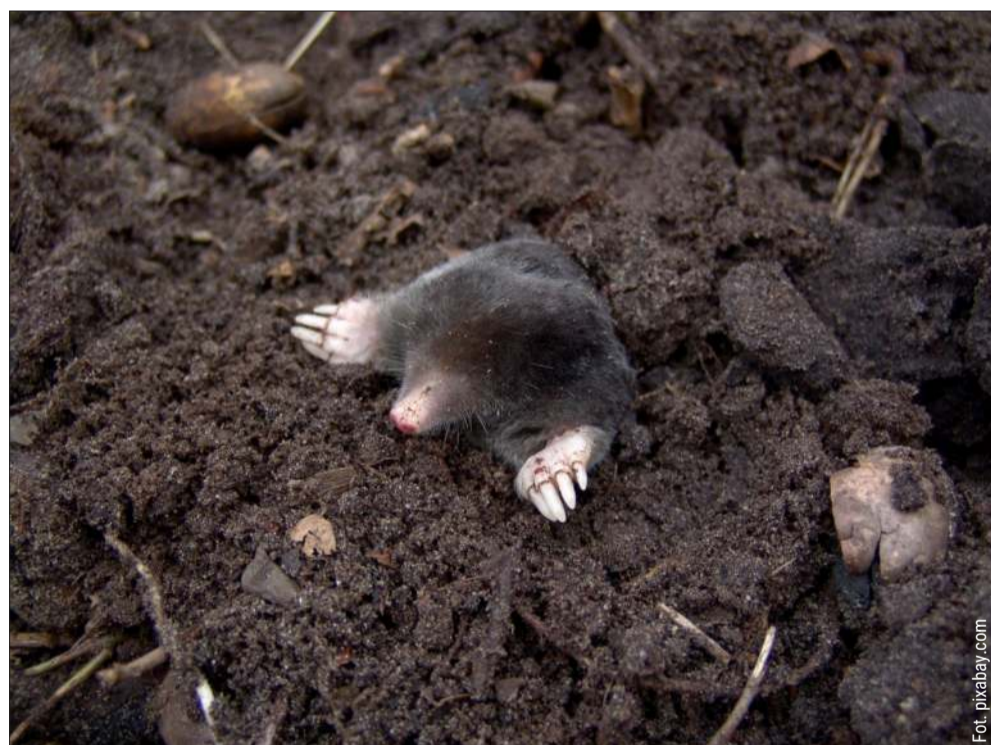
Krety bywają uciążliwym gościem w ogrodzie.

Wysoka trawa i gęste krzewy – Węże lubią gęste, nie-