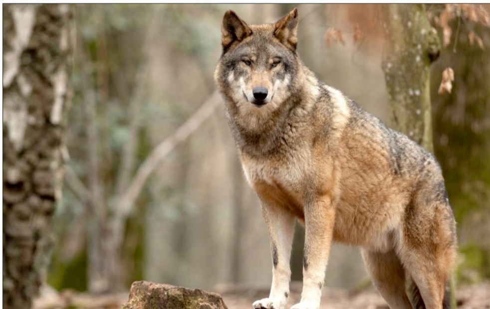
Sprawdzamy, jak wygląda liczba szkód wyrządzonych przez dzikie zwierzęta w naszym województwie i powiecie.

Szkody wyrządzone przez dzikie zwierzęta wciąż stanowią poważny problem dla mieszkańców i rolników na Podkarpaciu. Z danych przekazanych przez Łukasza Lisa, rzeczownika prasowego Regionalnej Dyrekcji Ochrony Środowiska w Rzeszowie, wynika, że tylko w ostatnich latach odnotowano setki takich zdarzeń, a wypłacone odszkodowania sięgają nawet ponad miliona złotych rocznie.