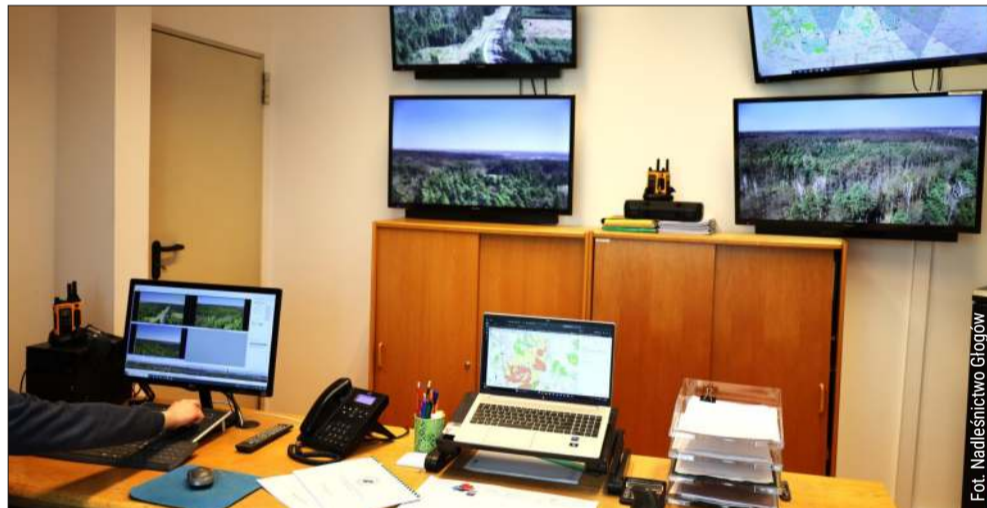
Z tego miejsca leśnicy reagują na każdy niepokojący sygnał.

Jeśli ktoś zauważy dym lub ogień, powinien natychmiast powiadomić służby. Zgłoszenia