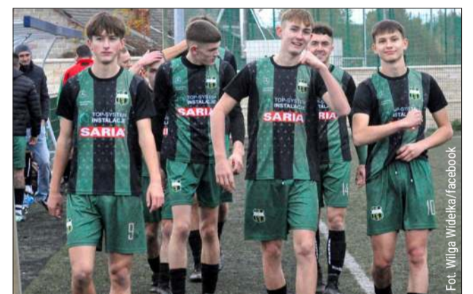
Piłkarze z Widelki rozegrali ostatnie sparingi.