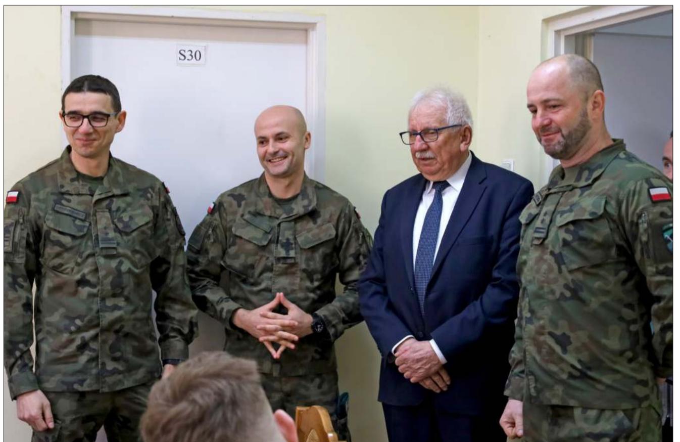
Mundurowi podkreślili podczas spotkania, że kwalifikacji nie należy się bać. Przebiega ona sprawnie i bezproblemowo.