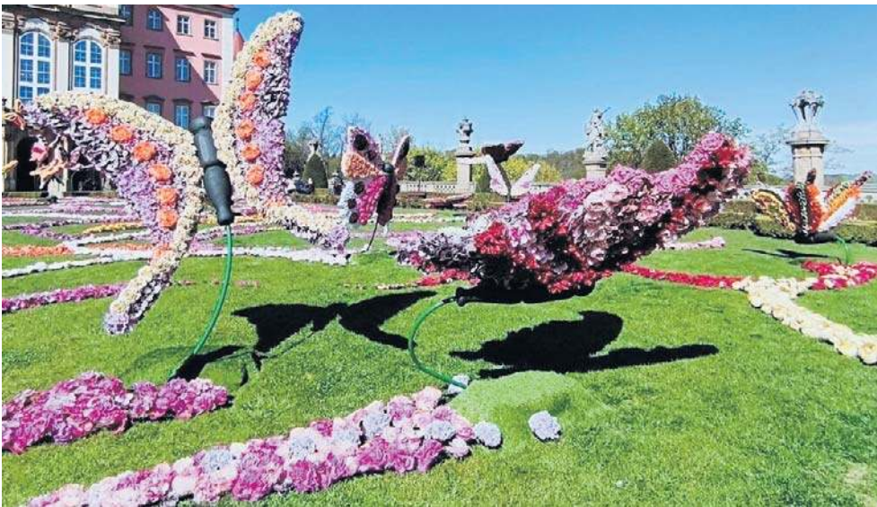
Tegoroczny festiwal nosił nazwę „Odyseja czasu”. Były więc atrakcje z różnych epok.