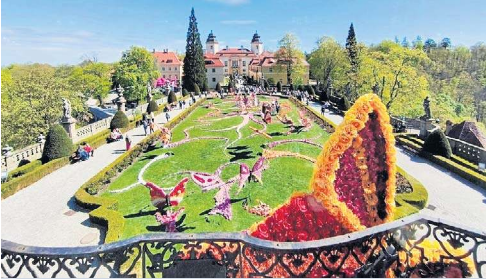
Tauron Festiwal Kwiatów i Sztuki w zamku Książ to największa majówka w regionie.