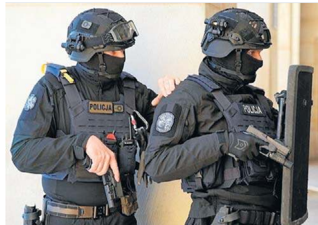
Praca w elitarnym wydziale kryminalnym jest bardzo wymagająca. Policjantów złamali jednak... policjanci.

Przed Sądem Okręgowym w Świdnicy zapadł kolejny wy-