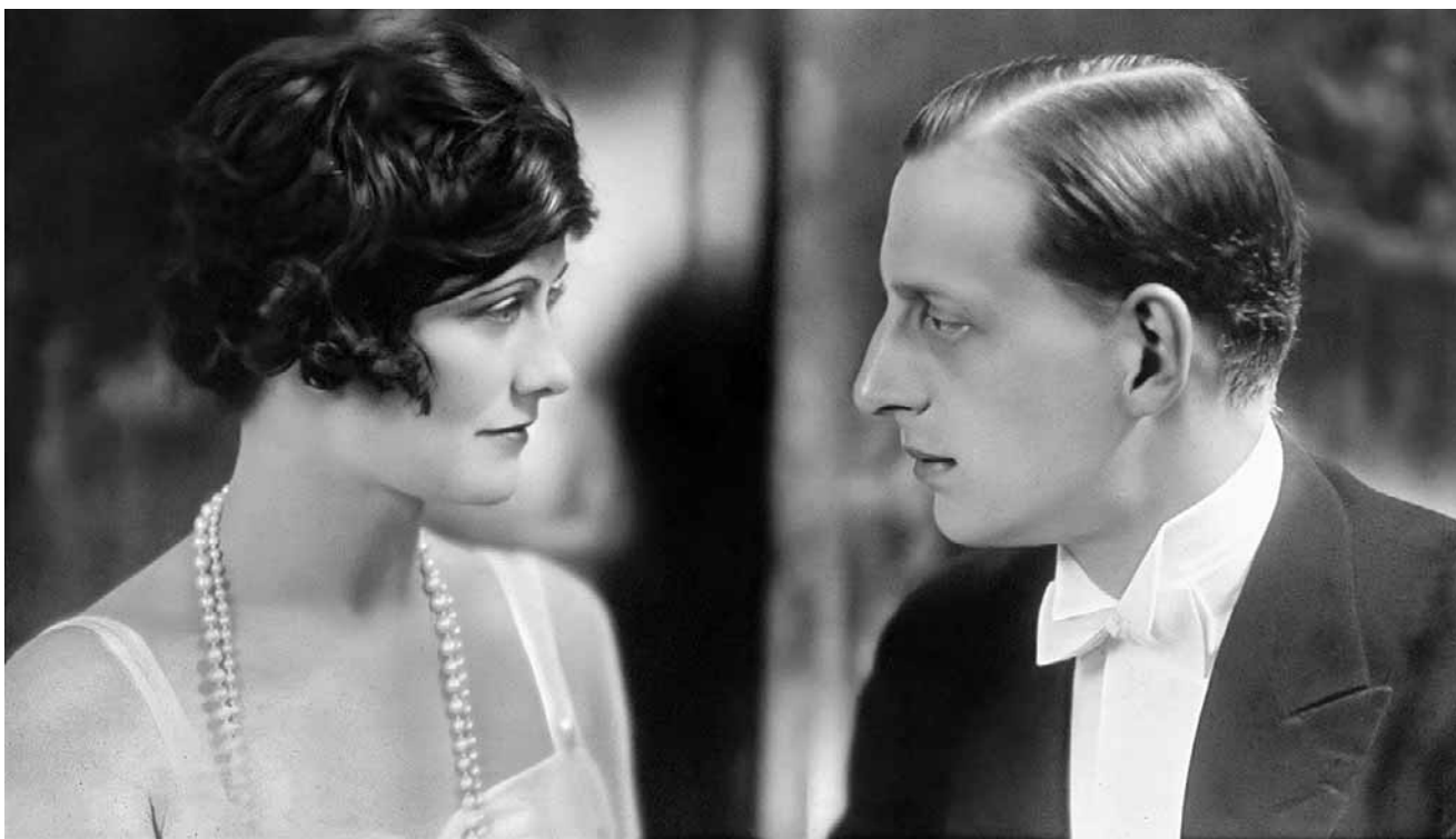
Ponoć pomysłodawcą flakonu Chanel 5 był już w 1920 roku wielki książę Dymitr Pawłowicz Romanow, a inspiracją były butelki wódki, noszone przez rosyjskie wojska.

Skład ów numer 5? Od tzw. ślepej próby. Twórca zapachu Ernest Beaux przedstawił Gabrielle Chanel pięć kompozycji zapachowych, z których ta wybrała ostatnią - właśnie 5 próbkę. Zapach od stu lat znaczący terytorium, do którego pariasom wstęp jest niewskazany.