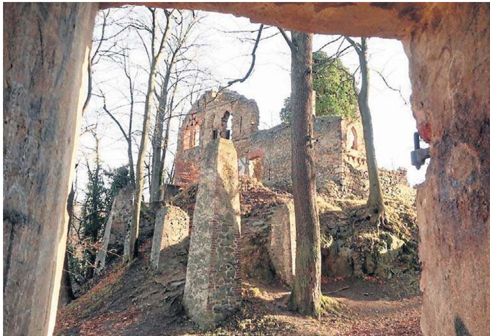
Do zamku Stary Książ turyści mogą dojść trzema szlakami: żółtym, czerwonym i zielonym.