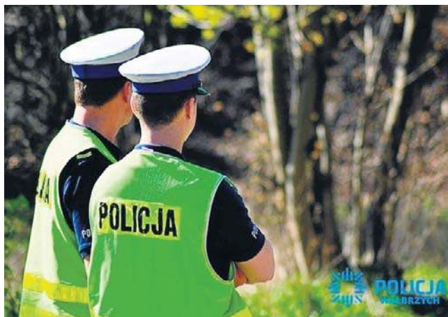
W wielu sytuacjach policjanci spieszą mieszkańcom z pomocą. Czasem i oni popełniają jednak błędy...

tkanie, dotyczące uważności i właściwej reakcji w takich sytuacjach.