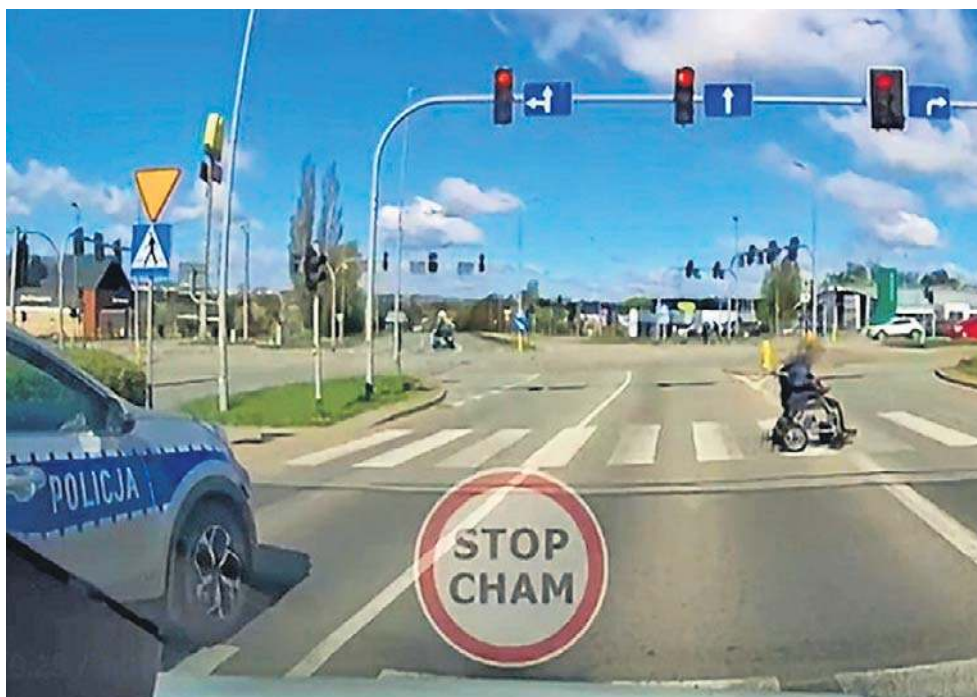
Czekający przed światłami policjanci nie zauważyli niepełnosprawnego na wózku.