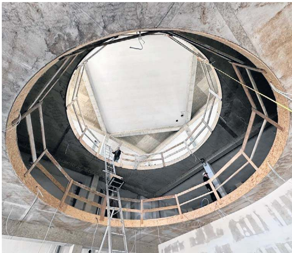
Przez okrągłe kondygnacje będzie „przechodziło” drzewo - dąb, symbol Wałbrzycha.

- To będzie ogromny dąb, który sięgnie ostatniej kondygnacji. Nie będzie to jednak zielone drzewo, a zrobione ze złomu, stali, przedmiotów, które pochodzą głównie z tej kopalni. Dąb jest symbolem miasta, jest w jego herbie, będzie też nawiązaniem do drzewa genealogicznego miasta. Skojarzenia z nim wzbudzą też zdjęcia, które będą „powie-