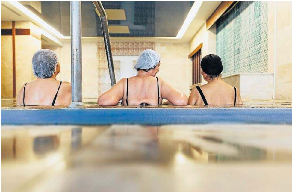
Aby leczyć się w sanatorium za granicą, najpierw trzeba spełnić określone warunki.

NFZ może pokryć koszty transportu do i z miejsca leczenia za granicą, jeżeli zostanie zaznaczone to we wniosku i zostanie pozytywnie zaopiniowane przez prezesa NFZ.