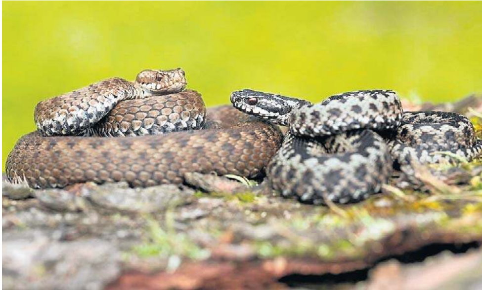
Żmije zygzakowate bardzo często są spotykane w Górach Wałbrzyskich i Kamiennych.

Węże, występujące naturalnie na terenie Polski są pod ścisłą ochroną gatunkową, a naj-