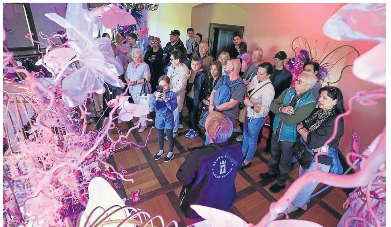
Na III piętrze była wystawa, poświęcona florystycznym kompozycjom i opowieściom o trzech synach księżnej Daisy.