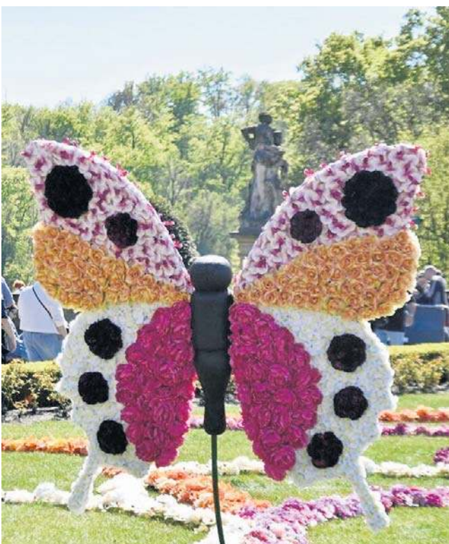
Barwne i ulotne motyle z kwiatów były znakomitymi plenerami do zdjęć. Goście chętnie z nich korzystali.