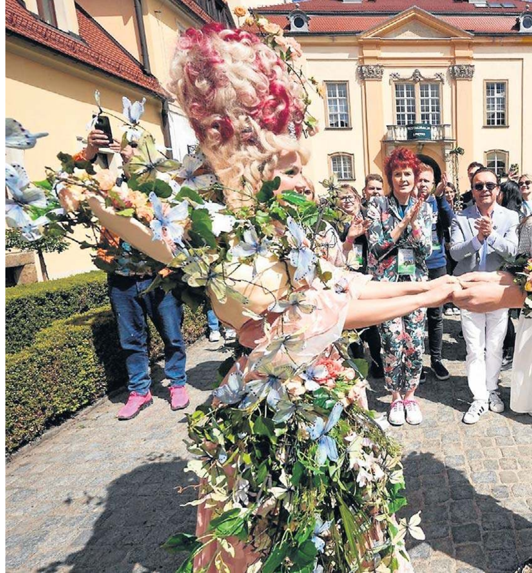
Motyli i kwiatów nie brakowało na wyjątkowych, kwiatowych ubraniach par animatorów, przechodzących przez ogrody.