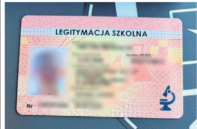
Fałszywe legitymacje zostały rozpoznane najpierw przez kierownika pociągu, a potem przez policjantów.

Młodzi ludzie trafili do policyjnej celi, a fałszywe dokumenty zostały zabezpieczone jako materiał dowodowy. 18-latkę i 17-latkowi grozi teraz kara grzywny, ograniczenia wolności albo nawet pozbawienia wolności do 5 lat. Taka jest cena próby przekrętu... ©