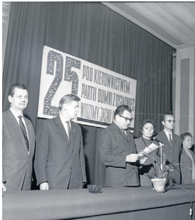
W 1949 roku w uchwale Biura Politycznego PZPR znalazł się zapis o utrwaleniu proletariackiego charakteru Łodzi. Tak kreowano czerwone oblicze miasta.