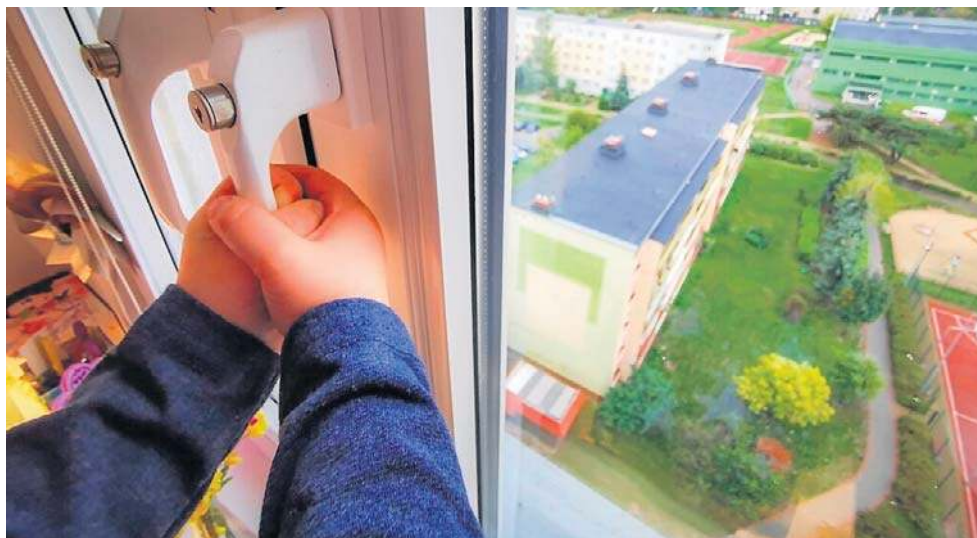
Dzieci wypadają z okien w Polsce każdego roku – taka jest smutna prawda. Niektóre przypadki kończą się w miarę szczęśliwie. Inne tragicznie – śmiercią lub trwałym kalectwem dziecka.

Wstępne ustalenia są takie, że dziecko, co do zasady, nie przebywało samo w domu.