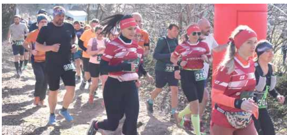
Uczestnicy biegu mogli wystartować na jednym z kilku dystansów

Pogoda od 2 tygodni dopisuje, a temperatury zachęcają do wypoczynku na świeżym powietrzu. W tym roku na prośbę biegaczy została zmieniona lokalizacja wydarzenia. Trasy biegu prowadziły przez malownicze tereny powiatu puławskiego. Po rozgrzewce biegacze udali się na start. Uczestnicy mogli wybrać jeden z kilku przygotowanych dystansów: 21 km, 10 km, 500 metrów, 250 metrów i 100 metrów. Frekwencja nie zawiodła.