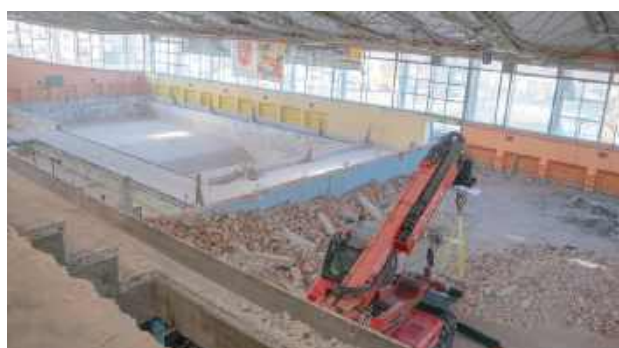
Pod koniec stycznia wykonawca przejął plac budowy. Prace są prowadzone obecnie przede wszystkim wewnątrz hali

Puławy: Ma być więcej miejsca i bardziej funkcjonalnie. Trwa modernizacja starej hali sportowej przy Al. Partyzantów. Inwestycja pochłonie blisko 60 mln zł. Wszystko ma być gotowe na początku 2028 r.