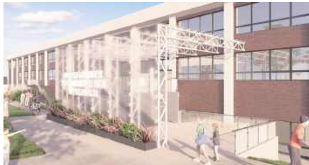
W ramach inwestycji władze Puław planują również przesunięcie wejścia głównego do hali