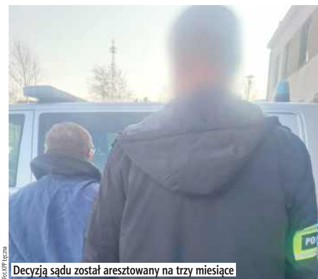
Decyzją sądu został aresztowany na trzy miesiące

- Jak ustalili funkcjonariusze, 64-latek wszczął awanturę, podczas której, trzymając w ręku siekiere, groził pobiciem i pozbawieniem życia swojej 68-letniej