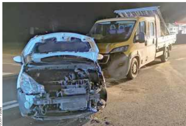
29-latka wyjeżdżała Citroenem ze stacji paliw i nie ustąpiła pierwszeństwa przejazdu dostawczemu Peugeotowi

- Jak ustalili policjanci ruchu drogowego, 29-latka z gminy Puławy, wyjeżdżając Citroenem z terenu stacji paliw, nie ustąpiła pierwszeństwa jadącemu prawidłowo Peugeotem 53-latkowi z gminy Baranów. Doszło do zderzenia się pojazdów - informuje nadkom. Ewa Rejn-Kozak, rzecznik prasowy Komendy Powiatowej Policji w Puławach.