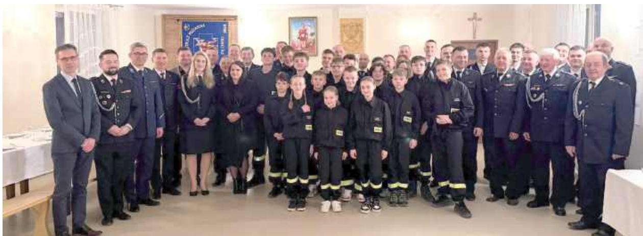
Zebranie było również okazją do spotkania strażackiej braci z władzami gminy

7 marca w Ochotniczej Straży Pożarnej w Płonkach odbyło się walne zebranie sprawozdawczo-wyborcze. Spotkanie było okazją do podsumowania działalności strażaków, wręczenia odznaczeń oraz wyboru nowych władz jednostki.