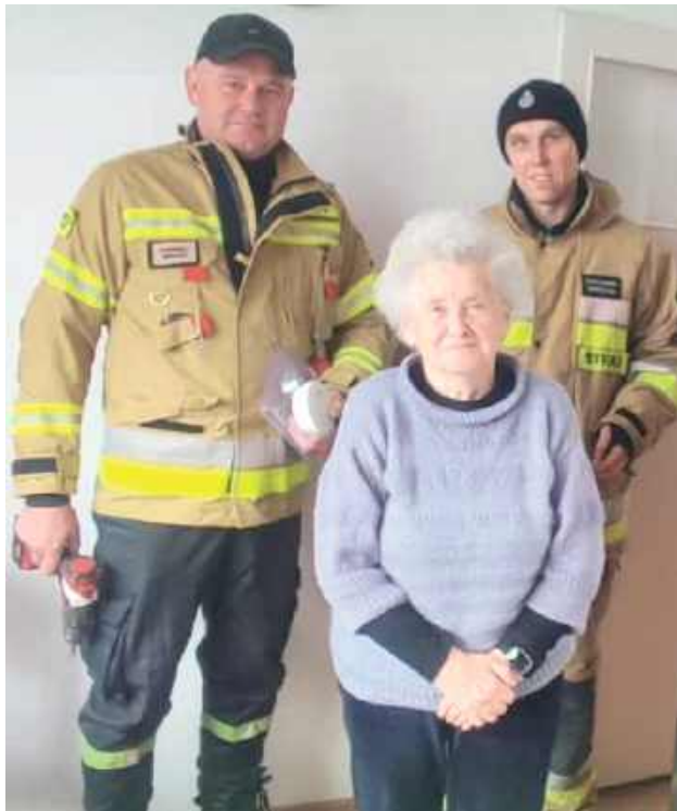
Czujki czadu i dymu trafiły do mieszkańców gminy w trudnej sytuacji życiowej. W ich rozdysponowaniu, a niejednokrotnie montażu pomogli strażacy ochotnicy

W gminie Końskowola już są w domach mieszkańców. W wytypowaniu osób potrzebujących pomogli pracownicy