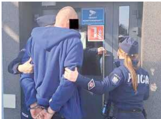
Sprawa jest tym bardziej poważna, że 53-latek niedawno wyszedł z więzienia, gdzie odbywał karę za znęcanie się nad najbliższymi

GMINA OPOLE LUBELSKIE: Groźne sceny rozegrały się w jednej z miejscowości w gminie Opole Lubelskie. 53-letni mężczyzna pod wpływem alkoholu wpadł w szal i zaczął grozić swoim rodzicom spaleniem ich dobytku. Niszczył przedmioty w domu, a na podwórku rozpałił ognisko tuż przy budynkach gospodarczych. Prerażeni rodzice wezwali policję.