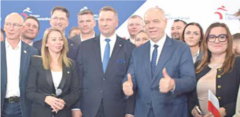
Przemysław Czarnek wśród polityków PiS na spotkaniu w Lubartowie

Po raz pierwszy w Lubartowie jako kandydat na premiera. A z nim cała świat