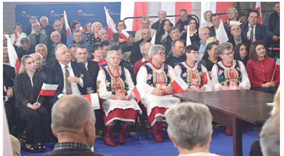
Przybyła grupa w strojach ludowych

prezydenta Rzeczypospolitej Polskiej – mówił kandydat na premiera.