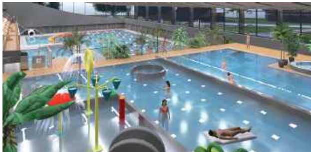
Modernizacja obiektu przy Al. Partyzantów zakłada powiększenie hali basenowej o 4,5 przęsła kosztem istniejącej hali sportowej oraz rozbudowę zespół zjeżdżalni od południowej części hali