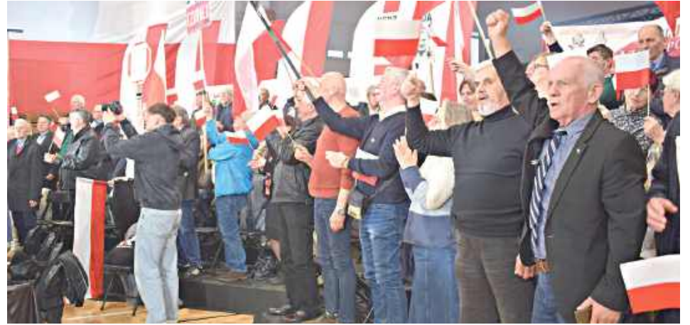
Powitanie Przemysława Czarnka

- Kto do ciebie dzwonił Tusku? Oni? Friedrich? Ursula? Do ciebie powinni dzwonić Polacy, zwykli, prości, którzy stanęli wczoraj pod Pałacem Prezydenckim i bronili