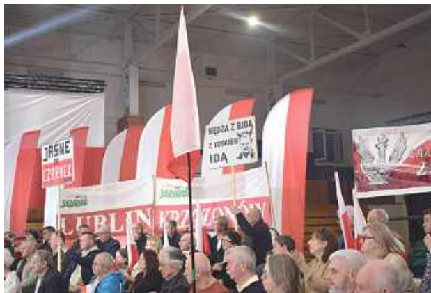
Uczestnicy spotkania przynieśli transparenty z hasłami: „Jasne, że Czarnek” czy „Nęcza z bidą z Tuskiem idą”