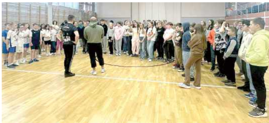
Wizyta w Gołębiu

Podczas wizyty dzieci miały także okazję zapoznać się z podstawowymi elementami sztuk walki oraz przekonać się, że sport to nie tylko rywalizacja, ale również świetna zabawa i sposób na rozwój osobisty.