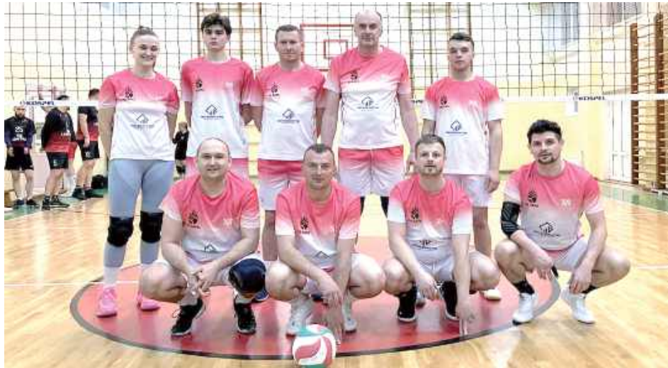
KS RAPS Łuszczów

Czwarta kolejka Regionalnej Ligi Siatkówki KLEM-LIGA oraz dwa zaległe mecze dostarczyły kibicom wielu emocji. W tygodniu pełnym sportowych zmagani rozegrano aż siedem spotkań, a sytuacja w tabeli zaczyna się wyraźnie klarować.