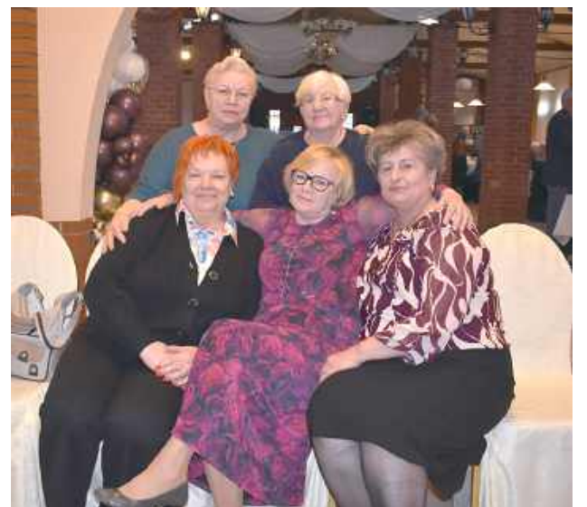
Zabawa i rozmowy w gronie koleżanek to piękna sprawa