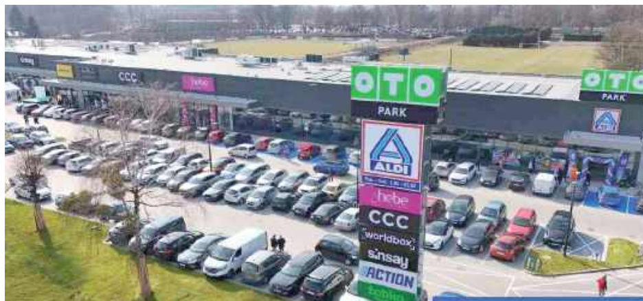
Mamy pierwszą w powiecie galerię handlową, a właściwie park handlowy

Obiekt zlokalizowany jest przy ulicy 15 Pułku Piechoty „Wilków” 5b i zajmuje 4,1