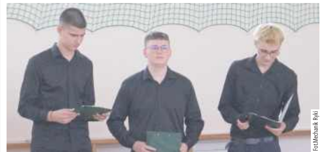
W ciągu dnia uczniowie wręczali drobne upominki nauczycielkom, pracownikom szkoły oraz uczennicom

W Mechaniku w Rykach obchodzono Dzień Kobiet, który był okazją do złożenia życzeń wszystkim paniom należącym do społeczności szkolnej. Z tej okazji zorganizowano uroczysty apel, podczas którego panowała radosna i serdeczna atmosfera.