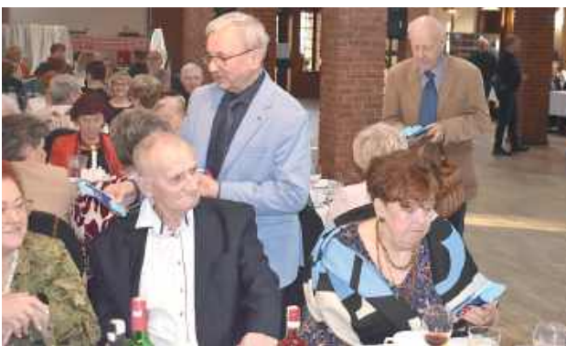
Dzień Kobiet w Dęblinie wypadł znakomicie