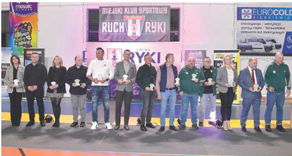
Pamiątkowe zdjęcie przedstawicieli firm, które nie szczędzą grosza na Ruch