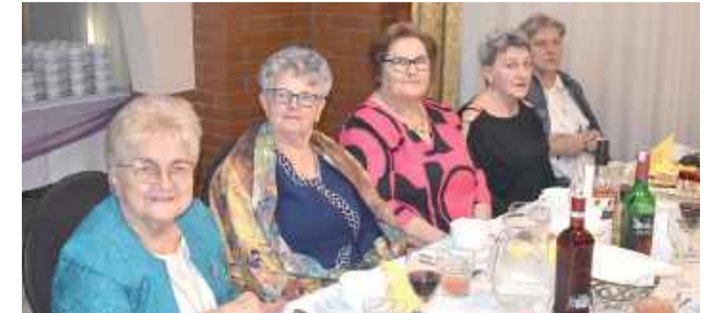
- To wspaniała okazja, by spotkać się w gronie znajomych, porozmawiać, pośpiewać i spędzić czas w miłej atmosferze - podkreślały uczestniczki