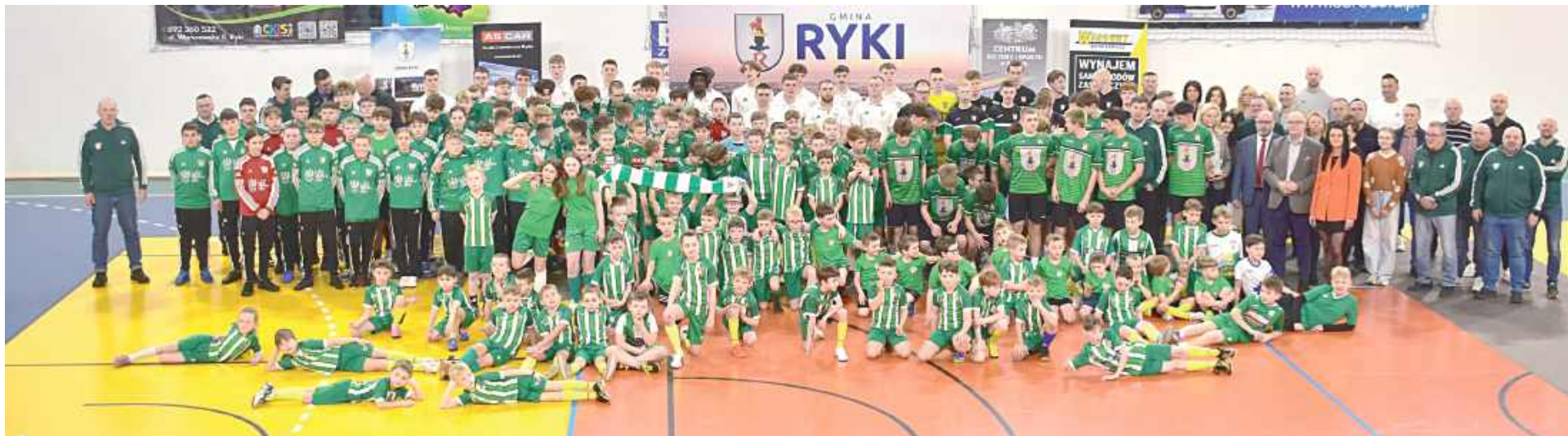
Wielka rodzina Ruchu Ryki

N iezliczona ilość młodych piłkarzy i piłkarze Ruchu Ryki pojawiła się na drugiej w historii prezentacji klubowej. Punktem kulminacyjnym była pierwsza ekipa walcząca w IV lidze.