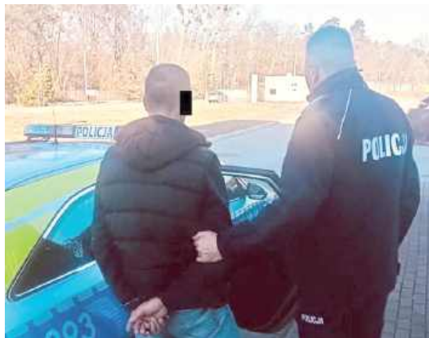
48-latek będzie odpowiadał w warunkach recydywy, bo wcześniej już prowadził, będąc pod wpływem alkoholu. Podczas jednej z kontroli podszył się nawet pod swojego brata

- 48-latek był już zatrzymany za to samo przestępstwo kilka miesięcy wcześniej. Kierował wówczas Citroenem,