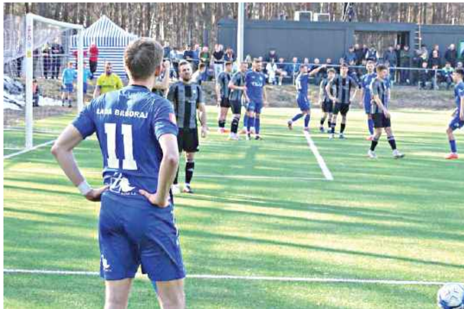
Ruch dzielnie walczył, ale musiał się pogodzić z porażką