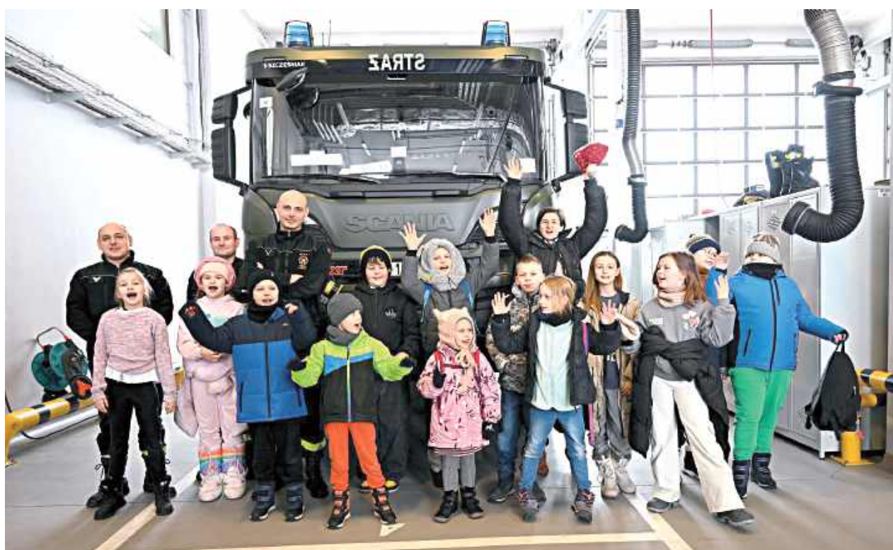
Dzieci odwiedziły Wojskową Straż Pożarną. Strażacy przybliżyli tajniki swojej pracy, zaprezentowali specjalistyczny sprzęt ratowniczy oraz przypomnieli najważniejsze zasady udzielania pierwszej pomocy

We wtorek dzieci wybrały się na wycieczkę do Puław. Najpierw zwiedziły Muzeum Badań Polarnych, gdzie poznały tajniki wypraw arktycznych i antarktycznych oraz dowiedziały się, jak wygląda codzienność badaczy w ekstremalnych warunkach. Kolejnym punktem była wizyta w Bibliotece Mie-