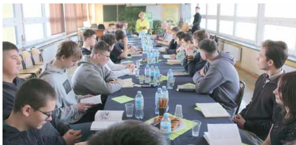
Każdy uczestnik z dużym zaangażowaniem i odwagą stanął przed publicznością, udowadniając, że czytanie może być prawdziwą sztuką

Organizatorzy serdecznie podziękowali wszystkim uczniom za udział oraz nauczycielom za przygotowanie młodzieży do konkursu. Szczególne gratulacje skierowano do laureatów, którzy zdobyli miejsca na podium: