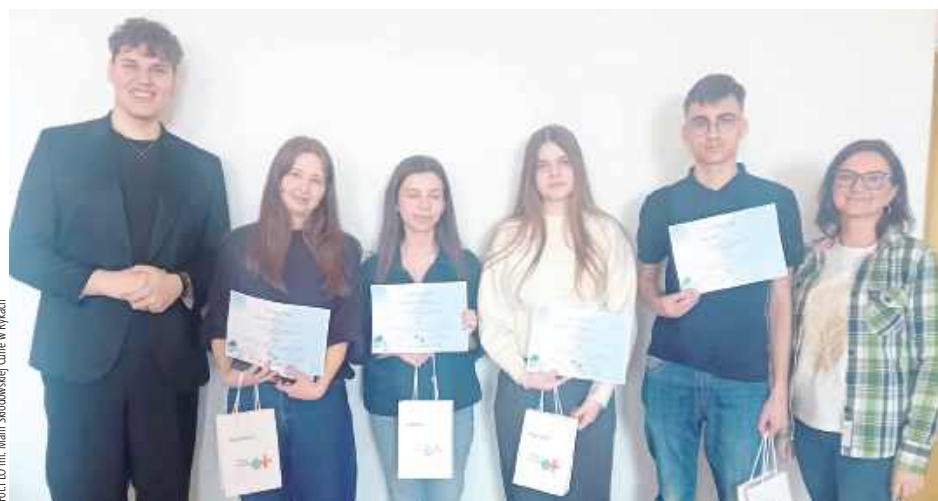
Uczennica I Liceum Ogólnokształcącego im. Marii Skłodowskiej-Curie w Rykach odniosła sukces w etapie okręgowym ogólnopolskiego konkursu naukowego