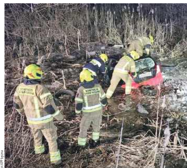
Jak się okazało, był wcześniej prawomocnie skazany za prowadzenie pojazdu w stanie nietrzeźwości, a decyzją starosty ma cofnięte uprawnienia do kierowania

- Jak się okazało, w pojeździe zanurzonym do połowy w wodzie znajdowały się dwie osoby, 46-letni mieszkaniec gminy Ludwin oraz 45-letnia mieszkanka gminy Cyców. W wydostaniu kobiety z pojazdu niezbędna była pomoc strażaków - przekazała aspirant sztabowy Magdalena Krasna z KPP w Łęcznej.