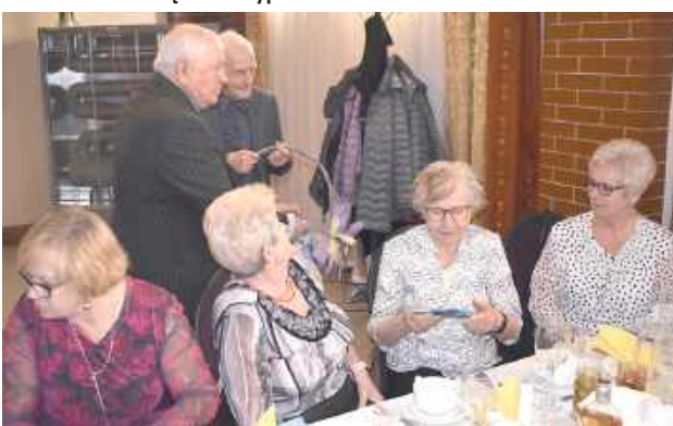
Wszystkie panie otrzymały czekolady