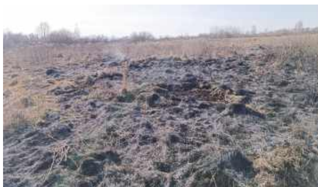
Wspólne działania jednostek pozwoliły na szybkie ugaszenie ognia i zabezpieczenie terenu

Po przybyciu na miejsce strażacy zastali rozwinięty pożar suchej roślinności. Ogień obejmował trawy oraz nieużytki, a działania ratowniczo-gaśnicze polegały głównie na tłumieniu płomieni przy użyciu tłumic, aby zapobiec