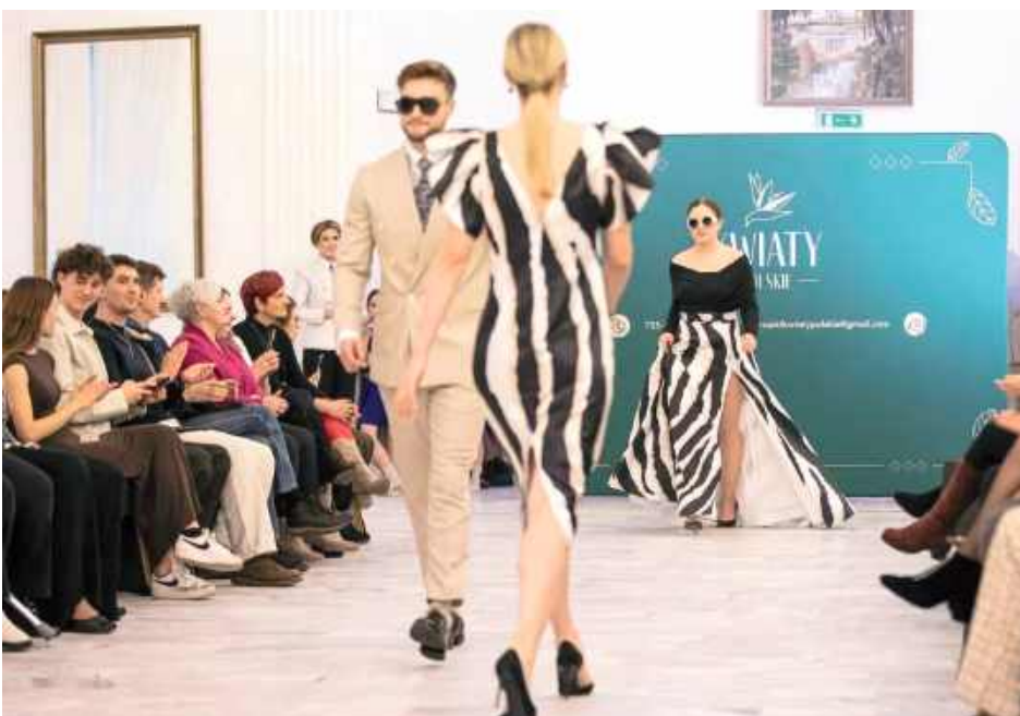
Na wybiegu zaprezentowane zostały najnowsze kolekcje hiszpańskiej marki Carla Ruiz, znanej z kobiecych i perfekcyjnie skrojonych projektów, które podkreślają indywidualność i siłę stylu. Męska moda pojawiła się w wydaniu marki Club Conesera, łączącej klasyczną elegancję z nowoczesnym designem i odważnymi detalami

Nie zabrakło także pokazów tanecznych. Przedstawicielki Małej Rewii Tanecznej zapre-