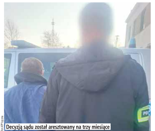
Decyzją sądu został aresztowany na trzy miesiące

- Jak ustalili funkcjonariusze, 64-latek wszczął awanturę, podczas której, trzymając w ręku siekiere, groził pobiciem i pozbawieniem życia swojej 68-letniej