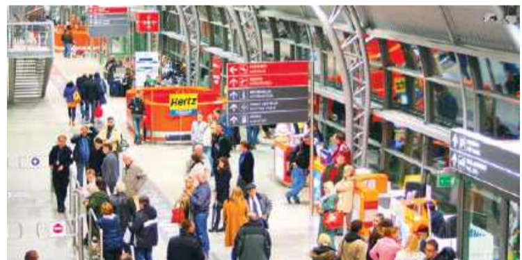
Modlin przygotowuje się do odprawiania 10 mln pasażerów rocznie

Dodatkowo Ryanair zapowiedział utworzenie bazy z 8 samolotami bazowanymi na miejscu oraz uruchomienie 25 nowych tras. W planach są także 200 nowych miejsc pracy dla pilotów, personelu pokładowego, mechaników i obsługi lotniska.