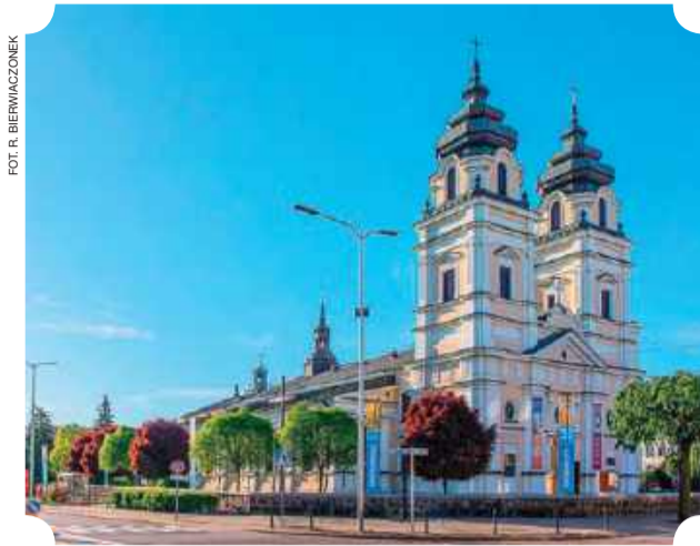
Kościół św. Trójcy