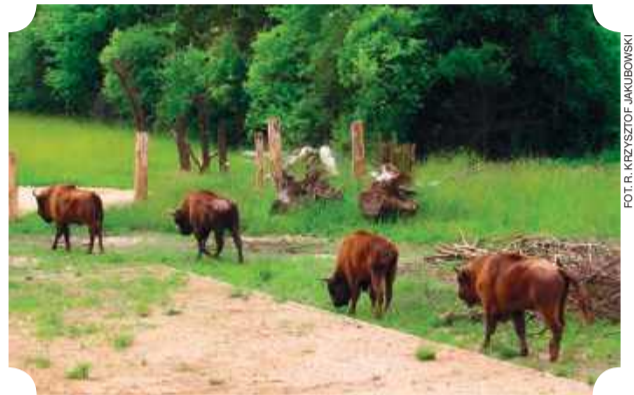
Pokazowa Zagroda żubrów

wanego ze środków Lasów Państwowych przy wsparciu funduszy Unii Europejskiej. Do zagrody można też dojechać ciuchcią turystyczną, która kursuje w weekendy według rozkładu. Podczas przejazdu pasażerowie mogą posłuchać opowieści lektorów o historii miasta, o mijających miejscach, a także o faunie i florze. ES