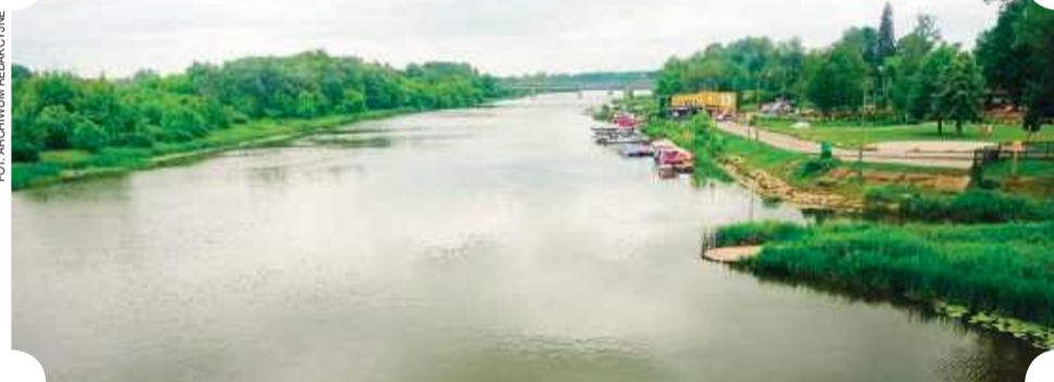
Narew pod Pułtuskiem: plaża miejska, przystań, kajaki, gondole...

To również wiele zabytków, w tym także sakralnych, co może zachęcić osoby w każdym wieku, zainteresowane historią.