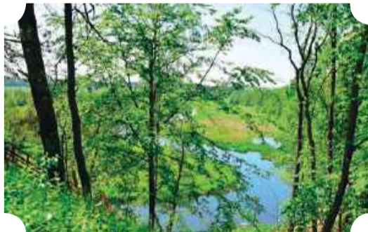
Widok na dolinę Wkry ze skarpy w Łazach