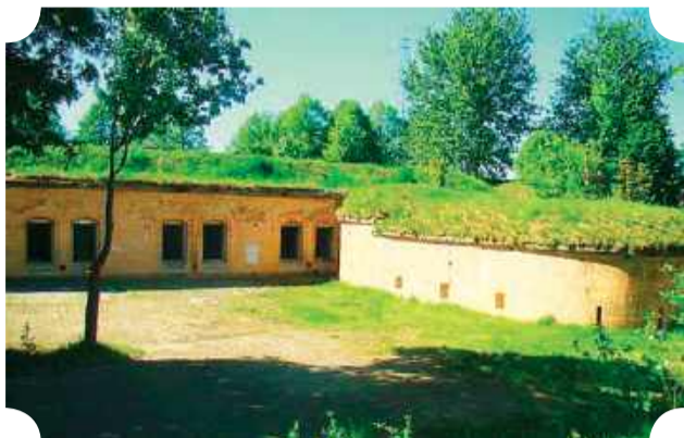
Zrewitalizowane carskie forty w Różanie

św. Stanisława, św. Józefa oraz Maryi Matki Kościoła. W 1961 roku świątynia została wpisana do rejestru zabytków. Na jednej z ławek