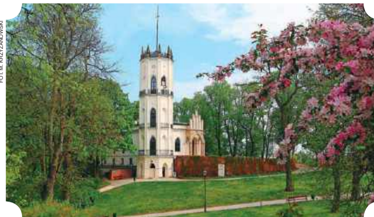
Pałac w Opinogórze

Jego rekonstrukcja uwzględniła formę, jaką uzyskał w momencie budowy w 1880 r., kiedy to wszystkie obiekty powstającej Drogi Żelaznej