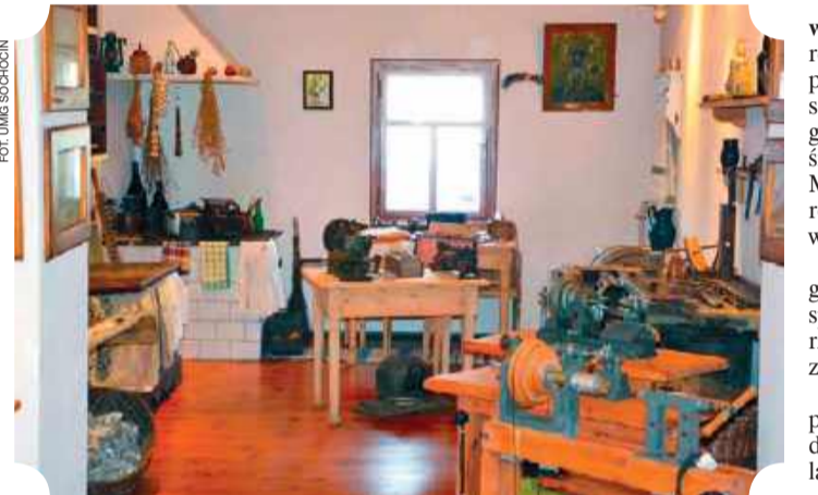
Izba Guzikarstwa w Sochocinie

Izbę Guzikarstwa, która przechowuje zabytki związane z tym rzemiosłem. Wystawa została nagrodzona w jednej z edycji konkursu Mazowieckie Zdarzenia Muzealne „Wierzbą”, uzyskując pierwsze miejsce w kategorii „Najciekawsza wystawa zorganizowana przez placówkę muzealną na Mazowszu”. Sochocińskie guziki , produkowane niegdyś głównie z muszli wylawianych z rzeki Wkry, cieszyły się wzięciem nie tylko w Warszawie, Łodzi, Krakowie, ale nawet w Petersburgu. Sochocin od początku XX wieku do lat 60., był prężnie działającym ośrodkiem guzikarstwa.