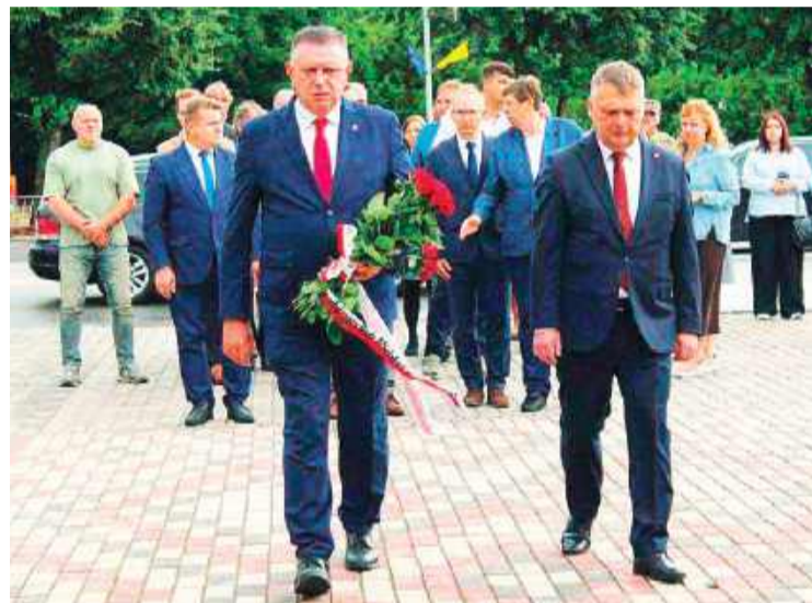
Delegacja Płońska gościła w partnerskim mieście Berdyczów