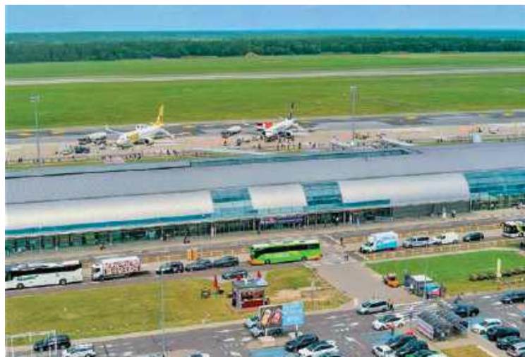
Ryanair chce zainwestować w modlińskie lotnisko 400 mln USD

Lotnisko w Modlinie od początku swojego istnienia było symbolem regionalnych ambicji i taniego latania. Dziś znów ma szansę stać się bramą na świat dla mieszkańców północnego Mazowsza i Warszawy. żet