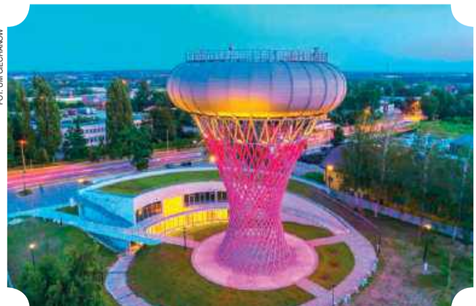
Park Nauki Torus

Pobyt w Opinogórze, spacer po muzeach i parku, a także ukłon przed wieszczem i spoczywającą jego rodziną w podziemiach kościoła, może zająć dobre pół dnia. W Domku Ogrodnika , w centralnej części parku przy stawach, można przysiąść na kawę i ciasto, ale także zaspokoić głód. Potrawy są wyjątkowo smaczne, a miejsce chętnie odwiedzane przez ciechanowian.