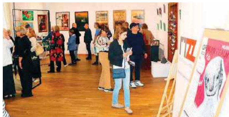
W nowym projekcie MZZ wzięło udział 17 twórców

Wernisaż odbył się w ramach miejskich obchodów Dni Mławy. W.D.