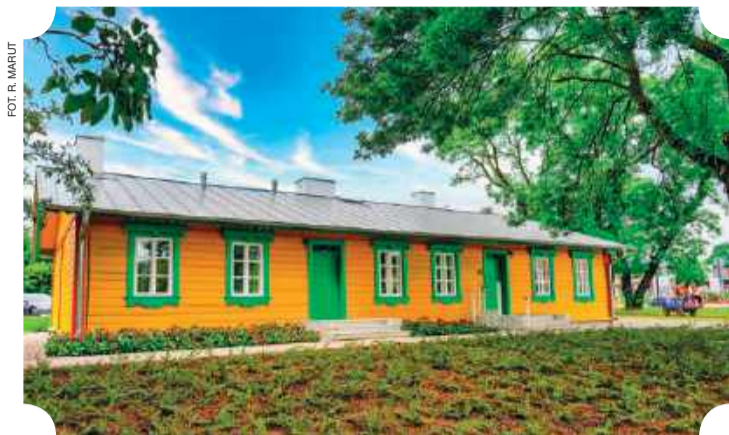
Zrewitalizowany budynek Kolei Nadwiślańskich

Jego rekonstrukcja uwzględniła formę, jaką uzyskał w momencie budowy w 1880 r., kiedy to wszystkie obiekty powstającej Drogi Żelaznej