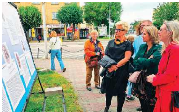
Biogramy były uważnie czytane przez zwiedzających