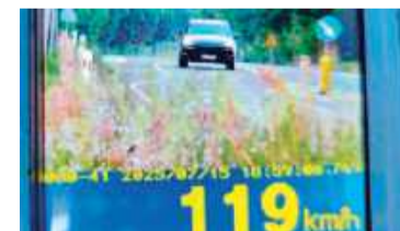
„Zapomniał”, że ma sądowy zakaz

Zatrzymany stanął przed sądem w trybie przyspieszonym. Przed upływem 48 godzin usłyszał zarzut niestosowania się do sądowego zakazu. Na sali