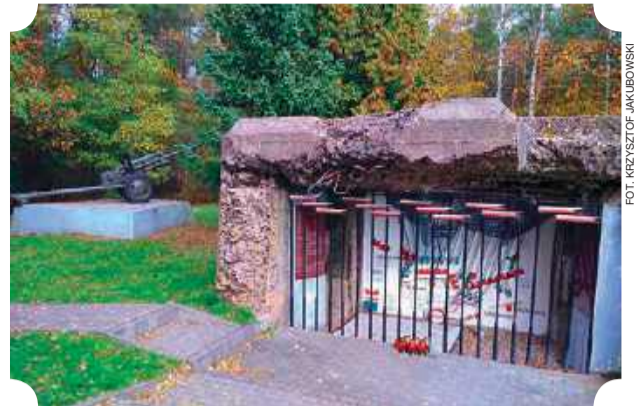
Mauzoleum Żołnierzy Września 1939