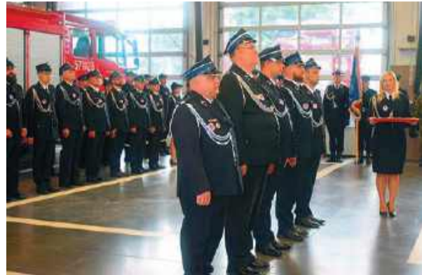
Podczas uroczystego apelu wręczono strażackie odznaczenia

plonący ogień naszej jednostki nigdy nie zagaśnie.