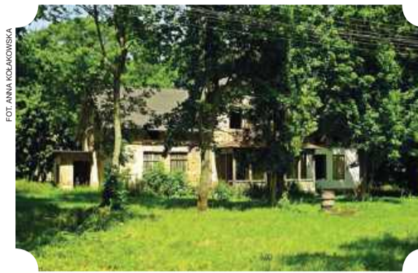
Dwór w Szczukach z 1870 r., miejsce związane z młodością Marii Skłodowskiej