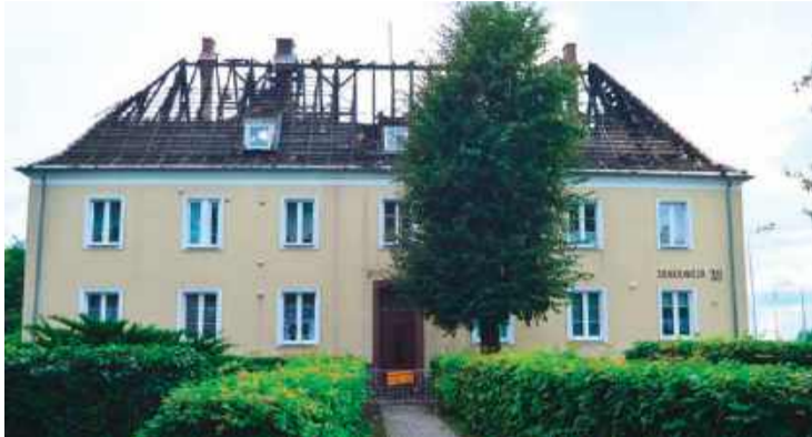
Tak wyglądał blok przy Sienkiewicza 39 w niedzielę po południu

dasze zostało kilka lat temu zaadaptowane na lokale mieszkalne. Ogień zajął je niemal w całości.