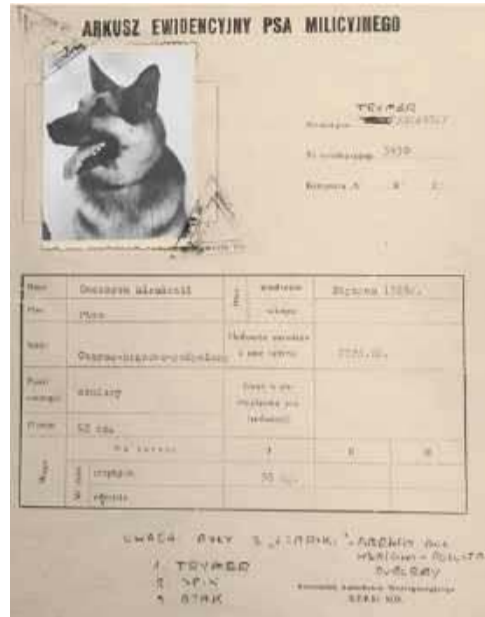
„Dowód osobisty” Trymera-Szarika

Trymer był psem o żelaznych nerwach. Nawet podczas spotkań z tuma-