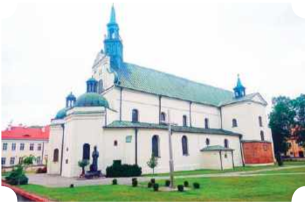
Bazylika kolegiacka pw. Zwiastowania Najświętszej Maryi Panny, wewnątrz imponuje słynnym renesansowym „sklepieniem pułtuskim”

Sam Pułtusk to, jak wiadomo, najdłuższy brukowany rynek w Europie, wspaniały zamek (siedziba Domu Polonii) i oczywiście rzeka Narew , po której można popływać choćby gondolą. Dlaczego gondolą? Bo Pułtusk zwany jest... Wenecją Północnego Mazowsza.