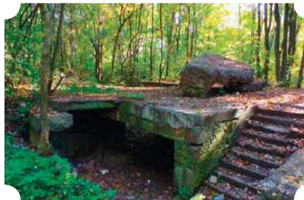
Pozostałości po rezydencji Ericha Kocha

blizszych i dalszych plantacjach. Zachowały się wagony, pozostałości torów i zabudowań kolejowych. W Krasnem działa prężnie Gminna Biblioteka Publiczna, do której warto zajrzeć, bo z pewnością każdy przyjezdny będzie serdecznie przyjęty. ES