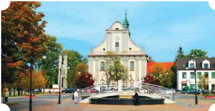
Plac Jana Pawła II w Żurominie i widok na Sanktuarium Matki Bożej w Żurominie

z której roztacza się niezwykle widok na dolinę rzeki Wkry. Oprócz tego przy ścieżce znajdują się figury zwierząt (bobrów, jeleni, dzików czy gigantyczna mrówka) oraz różne atrakcje dla rodzin z dziećmi. To teren leśny, idealny do leniwego lub aktywnego wypoczynku. Znajduje się tu obszar Natura 2000 – Dolina Wkry i Mławy .