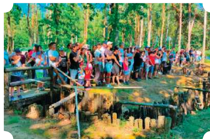
Sieć okopów w Strożęcinie