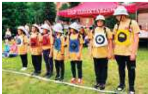
W zawodach wzięły udział również drużyny młodzieżowe

W niedzielę, 13 lipca w Dziektarzewie rywalizowali strażacy z jednostek OSP z terenu gminy Baboszewo. W zawodach wzięło udział 7 zespołów w grupie A oraz cztery młodzieżowe drużyny pożarnicze.