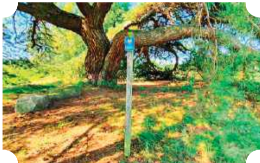
250-letnia sosna „bezgranicznej miłości”