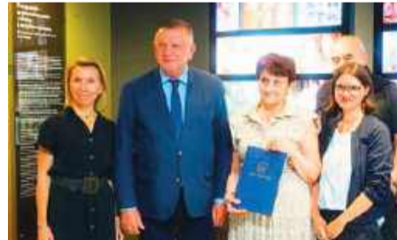
Porozumienie dotyczy zasad współpracy w zakresie upowszechniania historii i dziedzictwa Żydów na terenie Płońska

dających Płońsk współpraca ta oznacza poszerzenie oferty kulturalnej.