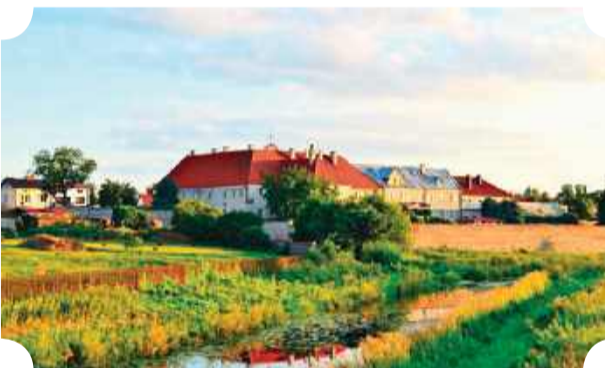
Przasnysz - widok na miasto w różnych porach roku