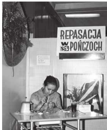
Punkt repasacji pończoch (1970)

Jedna z dziennikarek napisała niedawno, że „nie lubi pudrowania PRL-u”. Jest w tym zapewne jakiś sens, bo okres ten nie u wszystkich budzi pozytywne reakcje i wielu kojarzy się przede wszystkim z wszechobecnym komunizmem (pod różnymi nazwami „chrzczonej”), na straży którego stał aparat represji. Ale przecież dla wielu z nas, tych urodzonych i wychowanych w PRL-u, to okres, kiedy przeżyliśmy najpiękniejsze chwile swego życia związane z młodością. Kiedy w sklepach brakowało niemal wszystkiego, a większość dzisiejszych dóbr codziennego użytku uchodziła wówczas za towar deficytowy, po który stało się w długich kolejkach, wokół nas kwitło życie kulturalne (mimo cenzury i represji), rodzinne i towarzyskie, i to takie w realu, a nie tylko w rzeczywistości wirtualnej. Może dlatego właśnie, kiedy przywołuję w swoim kąciku obrazy z życia codziennego tamtego okresu, niemal od razu spotykam się z bardzo pozytywnymi reakcjami ze strony Czytelników. Czyżby czegoś nam dzisiaj brakowało? A może po prostu trochę się postarzeliliśmy? Niech każdy sam rozsądzi, ale po niedawno opublikowanym felietonie „W kolejce po rajstopy” aż dwie koleżanki wyznały mi, że ich mamy były w dobre PRL-u wziętymi repasaczkami, czyli paniami od „podnoszenia oczek”. A że mało kto już dziś pamięta, kim były repasaczki, więc nie dla pudru, ani nie dla lukru, lecz z potrzeby pisania o rzeczywisto-