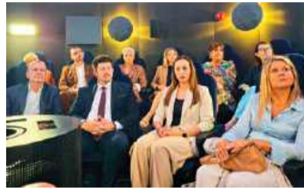
Podsumowano pierwszy rok działalności Planetarium