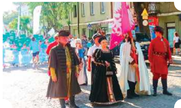
W Pułtusku odbywa się wiele imprez, w tym tych przeznaczonych dla całych rodzin

Wschodnią część powiatu porastają lasy Puszczy Białej. Zwana była ona dawniej biskupią, gdyż od XIII wieku należała do biskupów płockich, którzy rezydowali w swoim zamku w Pułtusku. Cały jej obszar mieści się pomiędzy dwiema rzekami: Narwią i Bugiem. Na terenie Puszczy Białej i Doliny Narwi wytyczono pięć rezerwatów przyrody. W niektórych wioskach Puszczy Białej nadal żywa jest kultura Kurpiów. Dla aktywnych turystów wytyczono szlaki piesze, ścieżkę edukacyjną, a także trasy rowerowe. Tzw. Wielki Szlak Kurpiowski to trasa: Pułtusk – Zambski Kościelny – Sokolowo Włościańskie, Pulwy – Gródek – Sadykierz – Pniewo – Bartodzieje – do Pułtusk. Trasa obfituje także w zabytki, po drodze można zobaczyć m.in. kościół i cmentarz w Zambskich Kościelnym, kościoły w Sokolowie Włościańskim, Nowym Lubielu, Porządziu, Sadykruzu, Kuźnię Kurpiowską i kościół z malowanymi motywami kurpiowskimi w Pniewie, tereny osuszonych bagien na Pulwach, rzańnickie łąki oraz leśne rezerваты „Wielgolas” i „Popławy”.