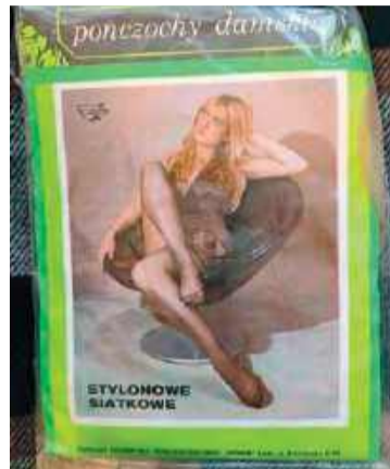
Pończochy stylonowe firmy Fenix - towar szczególnie pożądany