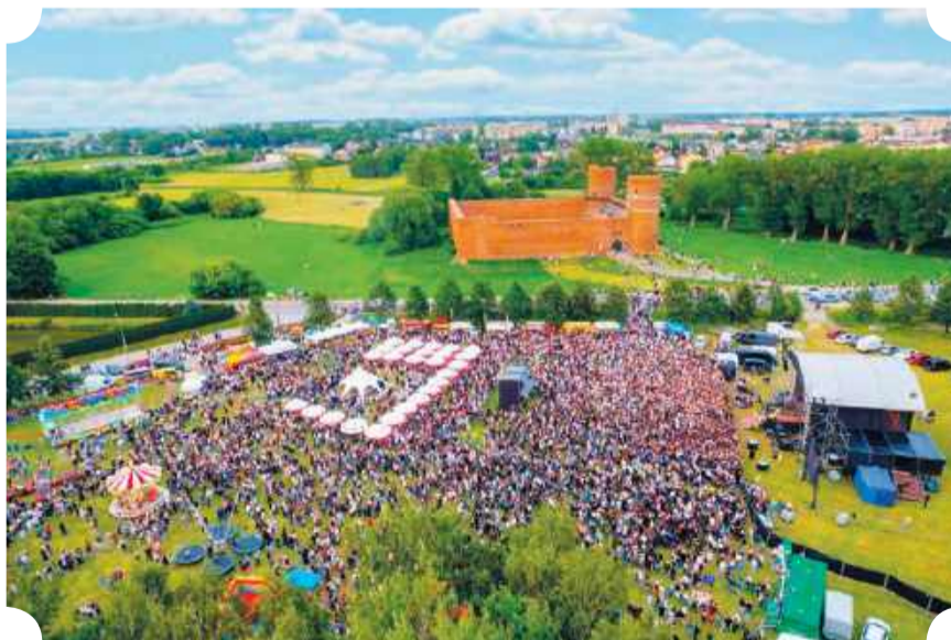
Powitanie lata pod Zamkiem Księżąt Mazowieckich

Sam Ciechanów to m.in. średniowiecze i mariaż romantyzmu z pozytywizmem. I oczywiście współczesność – miasto bardzo zmieniło się na korzyść w ostatnich dwóch dekadach, wzbogacając się o cenną infrastrukturę, w tym kulturalną i turystyczną.