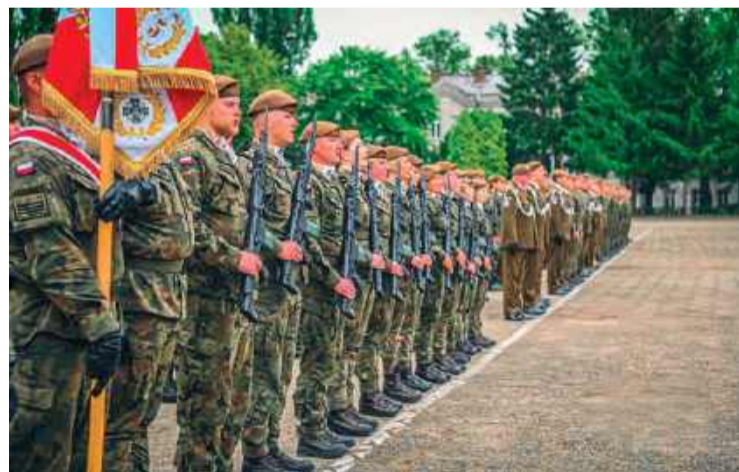
Przysięga wojskowa w ciechanowskich koszarach

Ważnym momentem było także wręczenie medali „Pro Patria” - odznaczeń za pielęgnowanie pamięci o walce o niepodległość. Medale otrzymało trzech żołnierzy 5. MBOT: ppłk Mar-