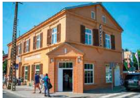
Dawny budynek Spółdzielczego Stowarzyszenia Spożyców „Łydynia” po rewitalizacji

Kategorie: Utrwalenie wartości zabytkowej obiektu - Zespół klasztoru Bernardynów w Radomiu; Rewaloryzacja przestrzeni kulturowej i krajobrazu (w tym założenia dworskie i pałacowe) - Park Podworski w Zielonej; Adaptacja obiektów zabytkowych - budynek dawnego Stowarzyszenia Spożyców „Łydynia” w Ciechanowie, budynek zwany „Poniatówką” w Piasecznie; Architektura i budownictwo drewniane -