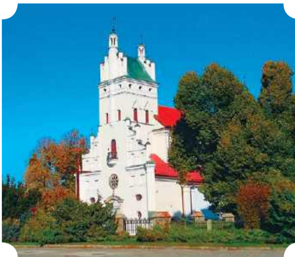
Kościół w Krasnem

W Krasnem warto odwiedzić Muzeum Rodu Krasieńskich oraz pozostałości po dawnej kolejce wąskotorowej, która zaopatrywała pobliską cukrownię Krasiniec w buraki, uprawiane na okolicznych,