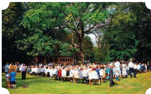
Uroczysko Święta Rozalia w gm. Rzewnie

Z Pułtusk przeniesiemy się nieco na południowy wschód, na teren powiatu makowskiego, ze stolicą w Makowie Mazowieckim. Warto odwiedzić Różan , położony pięknie nad Narwią. W ubiegłym roku, dzięki m.in. wsparciu finansowemu Samorządu Województwa Mazowieckiego, utworzono tu zrewitalizowany carski Fort IV , gdzie zwiedzający znajdą tablice informacyjne dotyczące losów tutejszych ziem i ludności, zabytkowe armaty oraz platformę widokową na dolinę Narwi. Miłośników architektury zainteresuje z pewnością neogotycki kościół św. Anny , oddany do użytku w 1907 roku, który góruje nad miastem. Dwa razy w roku, z okazji Dni Różana oraz Nocy Muzeów, możliwe jest także zwiedzanie Składowiska Odpadów Promieniotwórczych , utworzonego na terenie po dawnym forcie.