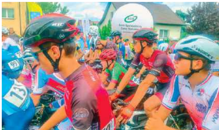
Ogólnopolska Olimpiada Młodzieży w kolarstwie szosowym