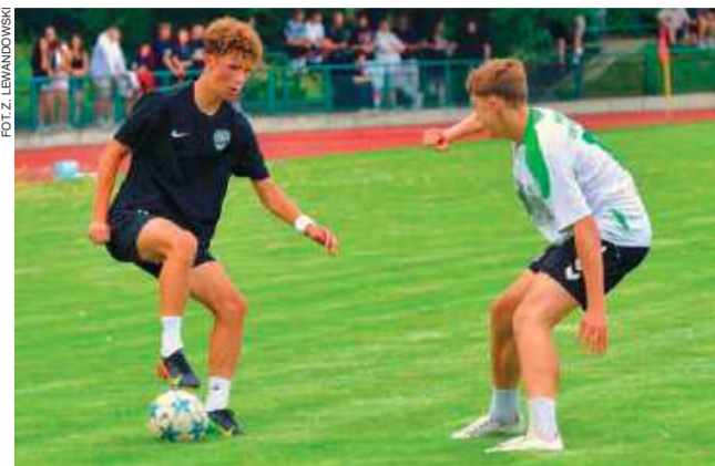
MKS Ciechanów wygrał 2:0 z Mazurem Radzymin

Mecz towarzyski, rozgrywany w ramach przygotowań MKS-u do nowego sezonu w V lidze, przyciągnął zdecydowanie więcej fanów niż zazwyczaj. Obecność artystów, którzy niedawno zapelniali Stadion Narodowy, sprawiła, że piłkarskie widowisko nabrało dodatkowego smaku.