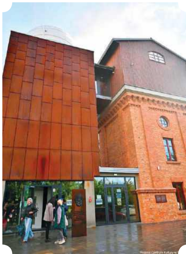
Planetarium i Obserwatorium w Płońsku

W Płońsku można odpocząć na niedawno zrewitalizowanym rynku i zajrzeć do „ Domu Pamięci ”. Placówka, która powstała niedawno w zabytkowej zmodernizowanej kamienicy przy ulicy Warszawskiej 2, upamiętnia historię dwóch współistniejących w przestrzeni jednego miasta przez blisko 500 lat narodów – polskiego i żydowskiego. Jest to miejsce dedykowane mieszkańcom, ale także płońskim Żydom , których potomkowie odwiedzają Płońsk, oraz turystom, którzy chcą