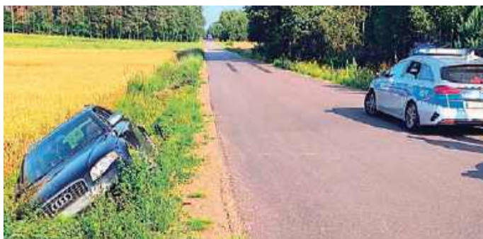
Audi rowem przejechało kilkadziesiąt metrów

Do zdarzenia doszło w środę, na drodze relacji Krępa- Rywociny (gm. Lipowiec K.). Jak wynika z ustaleń interweniujących policjantów, kierujący audi, 42 -letni mieszkaniec powiatu mławskiego, zjechał z drogi do rowu. Rowem przejechał jeszcze kilkadziesiąt metrów. Był kompletnie pijany – badanie alko-matem wykazało ponad 3,5 promila alkoholu w jego organizmie.