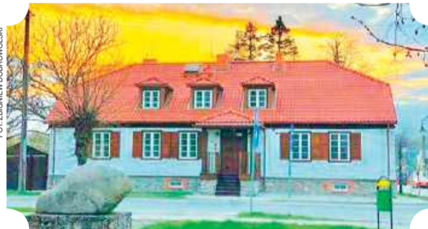
Muzeum Małego Miasta w Bieżuniu

Widok na dolinę najważniejszej rzeki powiatu najlepszy jest z położonej kilka kilometrów na północ od Brudnic, przy trasie DW 541, ścieżki przyrodniczej w Łazach. Jest to już teren gminy Lubowidz, najatrakcyjniejszej pod względem turystycznym i graniczącej bezpośrednio z Mazurami. Wspomniana ścieżka położona jest na wysokiej skarpie,