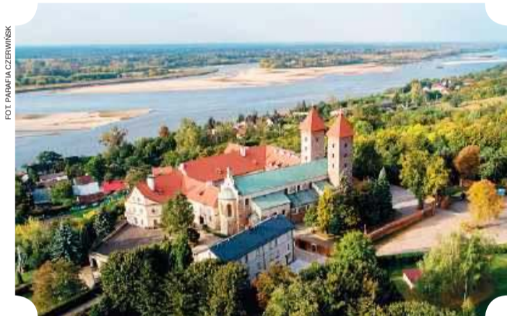
Bazylika w Czerwińsku nad Wisłą - pomnik historii