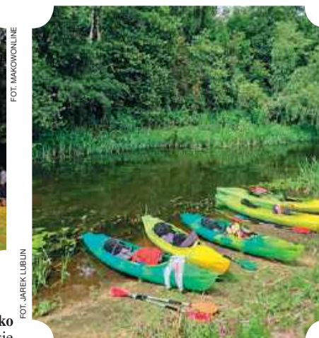
Rzeka Orzyc płynie przez lasy i pola stwarza idealne warunki do spływów kajakowych

Niewątpliwie warto odwiedzić uroczysko Święta Rozalia (gm. Rzewnie) . Wznosi się tam kościół położony z dala od wiosek, w lesie, będący znanym miejscem kultu świętej