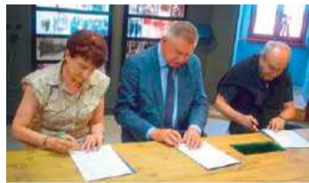
W płońskim Domu Pamięci podpisano porozumienie pomiędzy Muzeum Historii Żydów Polskich POLIN a miastem Płońsk i Miejskim Centrum Kultury

Muzeum POLIN będzie udostępniać swoje zbiory - w szczególności cyfrowe, płońskiemu Domowi Pamięci, służyć wsparciem eksperckim, a także udzieli patronatu nad działaniami placówki MCK, a dla mieszkańców i gości odwie-