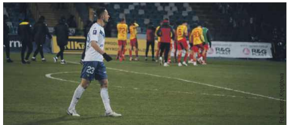
Stal Mielec spada do 1 ligi