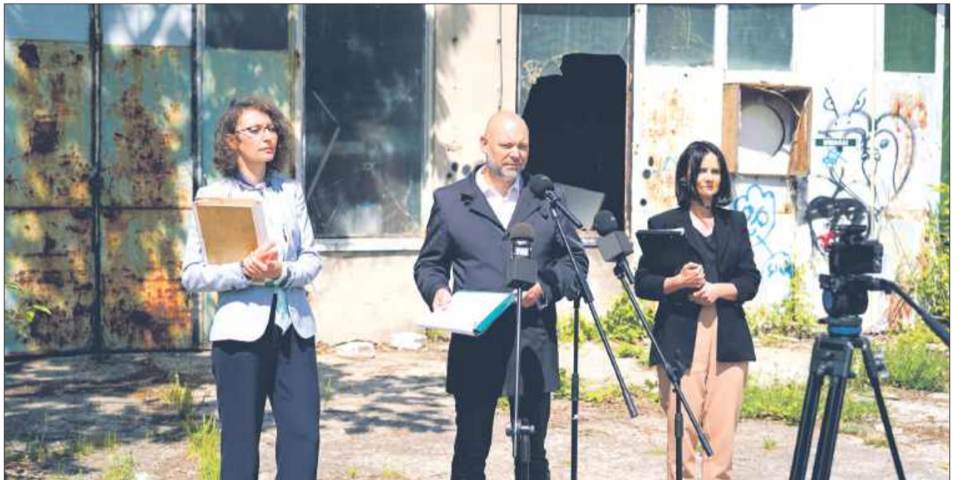
Prezydent Swół podkreślił, że decyzja o eksmisji była uzasadniona przede wszystkim stanem technicznym.

Emocje mieszkańców i miłośników lokalnej historii są żywe. Dla wielu Aeroklub to symbol tradycji i lotniczej tożsamości Mielca – miasta związanego z przemysłem lotniczym od dziesięcioleci.