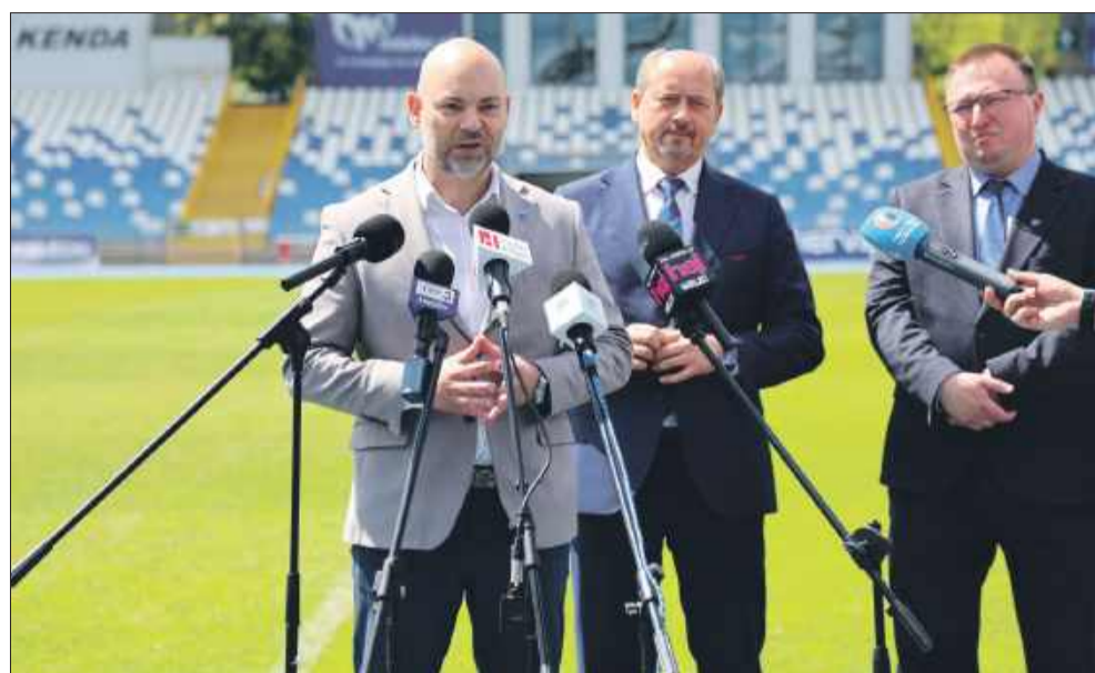
Reprezentacja Polski kobiet w piłce nożnej zmierzy się w meczu towarzyskim z Ukrainą w Mielcu!

- Wierzymy, że przygotowania na Podkarpaciu przyniosą reprezentacji szczęście w Szwajcarii. Cieszymy się, że możemy być częścią tej historii