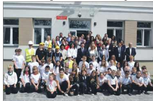
Nauka w takiej szkole to przyjemność!