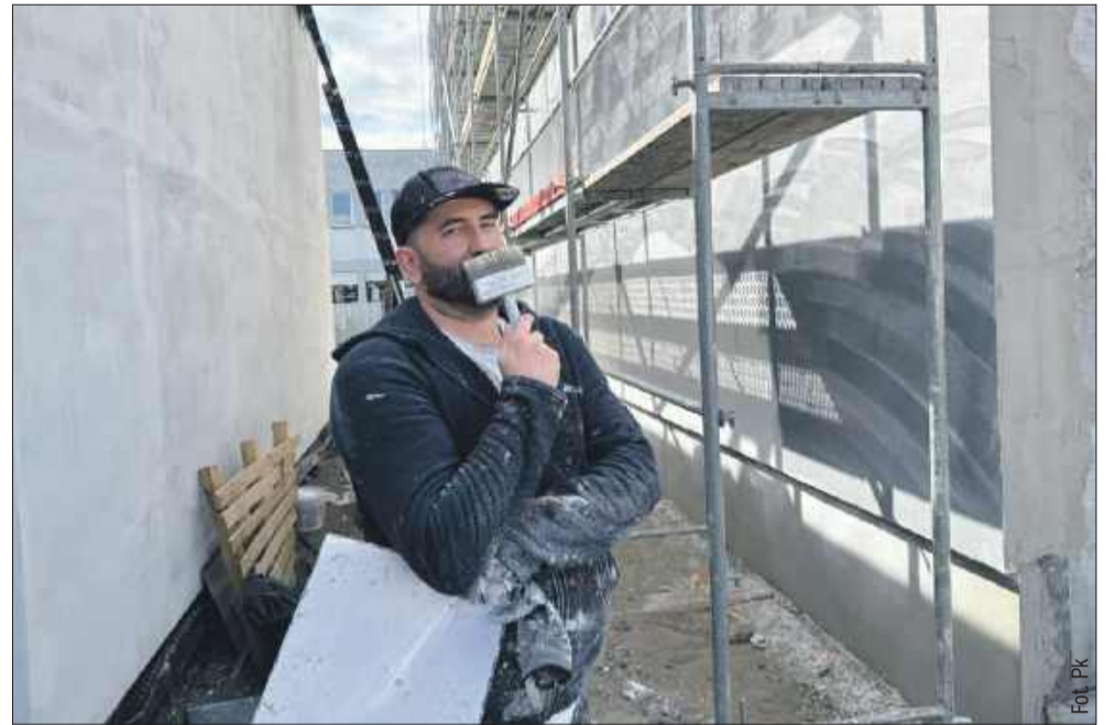
Mural będzie przedstawiał historyczną panoramę mieleckiego rynku.