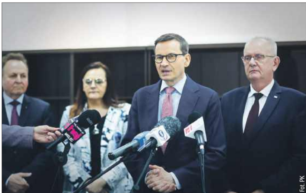
Morawiecki poruszył m.in. kwestie związane z nadchodzącymi wyborami.

Były premier Mateusz Morawiecki złożył wizytę w Mielcu, gdzie w ramach objazdu po Podkarpaciu spotkał się z przedstawicielami mediów, przedsiębiorcami oraz samorządowcami. Nie szczędził krytyki pod adresem Rafała Trzaskowskiego, wskazując na konieczność właściwego wyboru w nadchodzących wyborach.