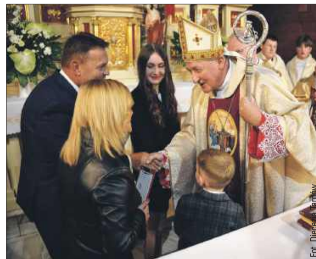
Biskup przypomniał, że parafia nie jest tylko budynkiem, ale wspólnotą.