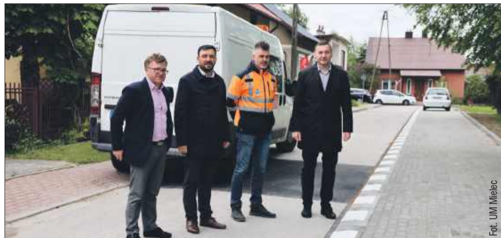
W Mielcu zakończono realizację trzech ważnych inwestycji.

W Mielcu zakończono realizację trzech ważnych inwestycji infrastrukturalnych. To remonty ulic i budowa parkingu.