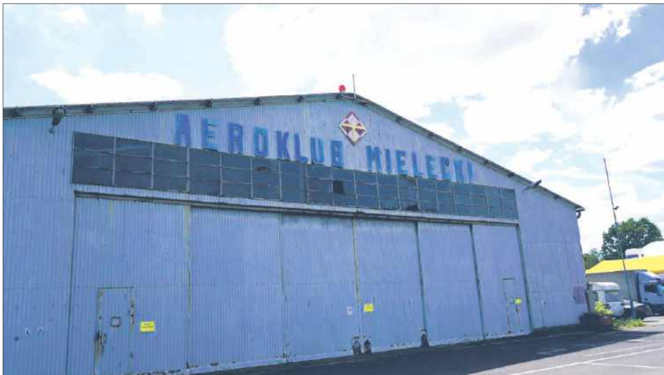
Spór o hangar przy ul. COP-u ciągnie się od lat.

Pozbawianie Aeroklubu dostępu do infrastruktury niezbędnej do funkcjonowania – w tym nakaz sądowy opuszczenia tzw. starej siedziby oraz realne zagrożenie eksmisji z obecnej lokalizacji (ul. Lotniskowa 14), spowodowane żądaniem opłat przekraczających możliwości finansowe – stoi w sprzeczności z interesem społecznym mieszkańców Mielca. Dodatkowo,