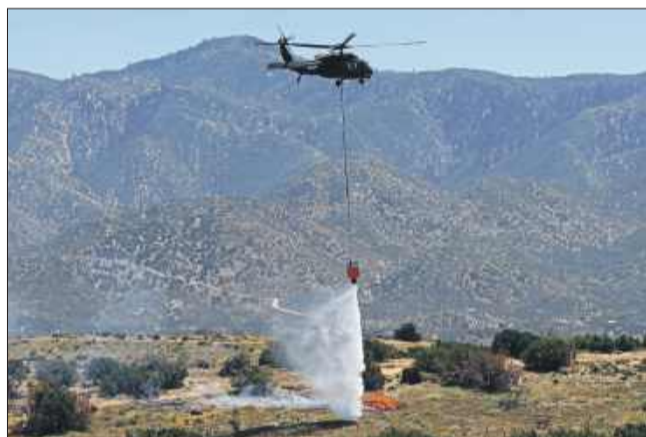
Śmigłowiec Black Hawk wyposażony w system MATRIX Sikorsky i autonomię Rain zrzuca wodę.

Pod koniec kwietnia w rejonie Hesperii w Południowej Kalifornii przeprowadzono pierwsze tego typu testy nad rzeczywistym ogniem. Strażacy z San Bernardino County Fire Protection District rozpalili stopy suchych krzewów, symulując pożary w warunkach zbliżonych do naturalnych. Wysokość terenu sięgała 3 300 stóp (ponad 1000 m), a wiatr osiągał prędkość do 30 węzłów. W takich warunkach autonomiczny śmigłowca Black Hawk wykazał się wyjątkową skutecznością, wykonując misje zrzutu wody z zawieszono pod kadłubem zbiornika Bambi Bucket o pojemności 324 galonów (ok. 1227 litrów).