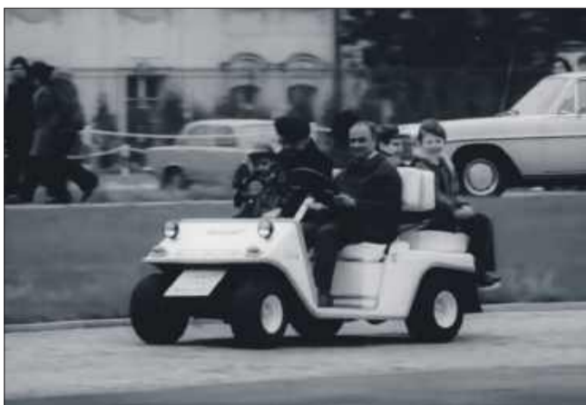
Kadr z filmu o Melexie.

- To Melex! Słynny elektryczny wózek golfowy z Mielca, przez entuzjastów zwany również samochodem... – słyszymy w nagraniu. - Patrz, panie, jakie to zmyślne, a najważniejsze, że benzyny nie żre! – zachwyca się jeden z uczestników warszawskiego pokazu.