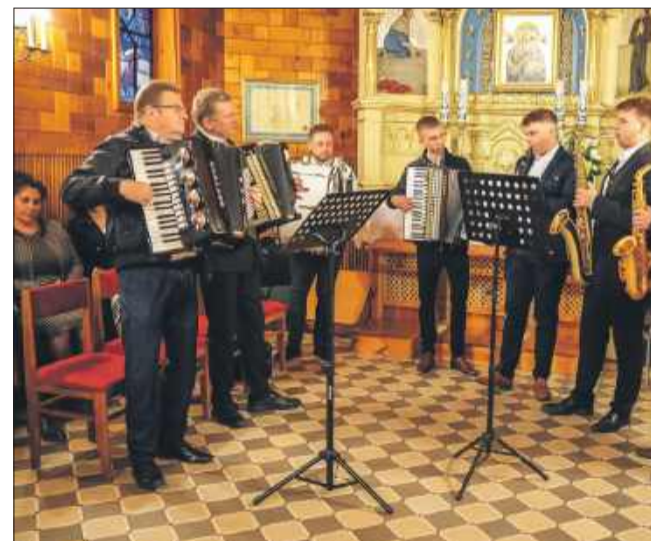
Podczas nabożeństwa nie zabrakło radosnego śpiewu.