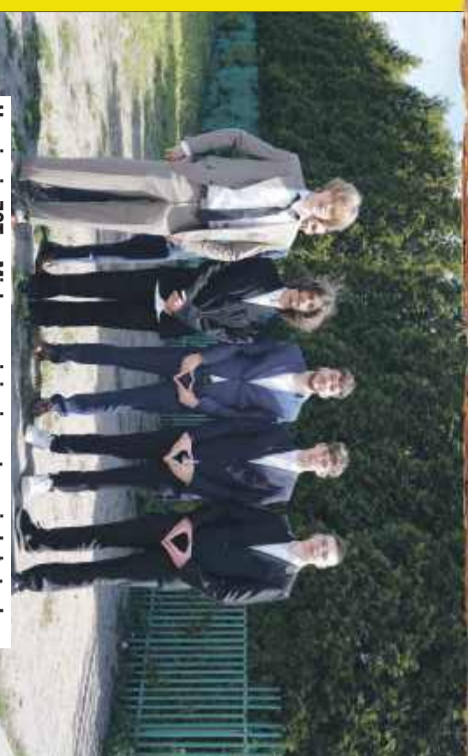
Uczniowie ZST w Mielcu uważają, że matura nie była trudna.