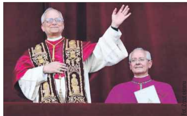
Robert Francis Prevost pochodzi z Ameryki Północnej.

26 września 2015 roku papież powierzył mu kierowanie diecezją Chiclayo. W marcu 2018 roku został wybrany drugim