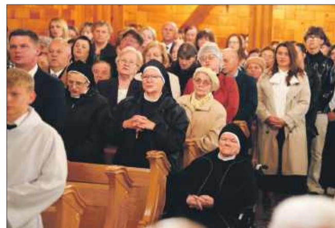
Wierni z parafii Jamy.