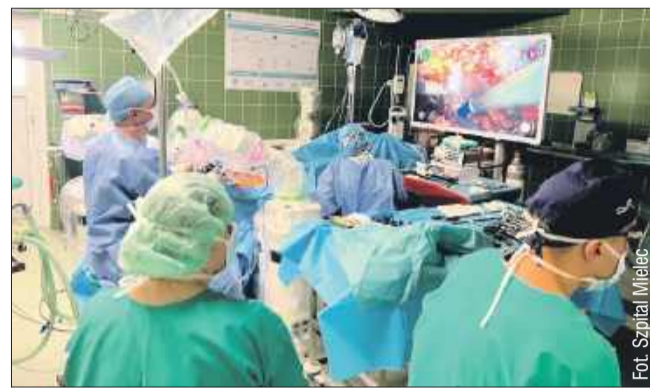
Systemy robotyczne to obecnie część najnowszej techniki operacyjnej.

W Szpitalu Specjalistycznym w Mielcu trwają testy nowoczesnego robota chirurgicznego. To krok milowy w kierunku wprowadzenia najnowszych technologii operacyjnych w naszej służbie zdrowia. Jak zapewniali przedstawiciele szpitala, realna szansa na wdrożenie systemu jest bardzo duża.