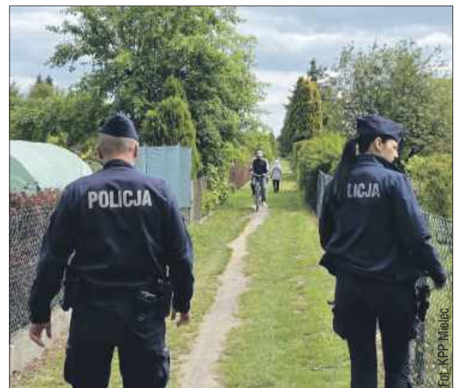
Policjanci regularnie odwiedzają ogródki działkowe na terenie Mielca.

Wraz z nadejściem sezonu działkowego mieleccy dzielnicowi rozpoczęli akcję profilaktyczną „Bezpieczny Ogród”, której celem jest zwiększenie bezpieczeństwa użytkowników ogródków działkowych oraz ochrona ich mienia przed kradzieżami i aktami wandalizmu.