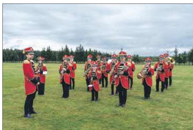
Otwarcie z orkiestrą.