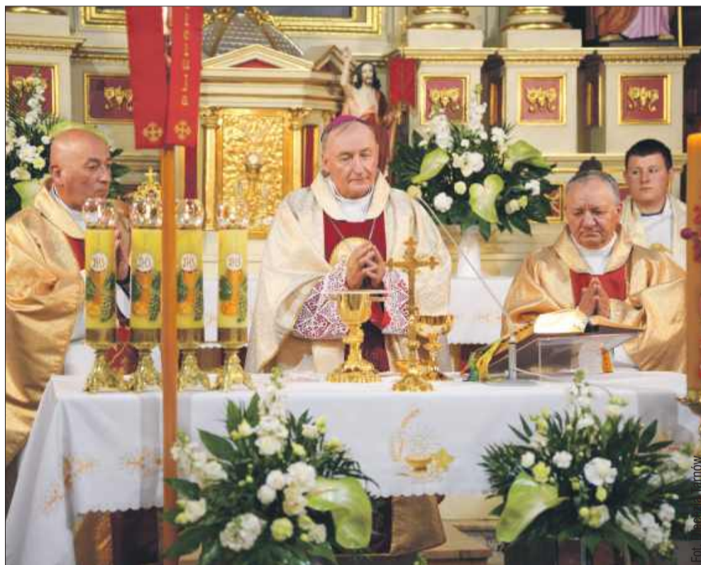
Parafia św. Augustyna Jamach świętowała swoje 100-lecie istnienia.

Setna rocznica istnienia parafii była również okazją do