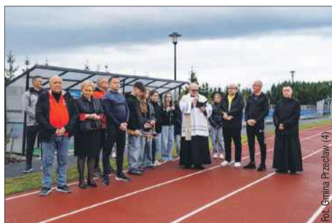
Poświęcenie obiektu sportowego w Dobrynie.