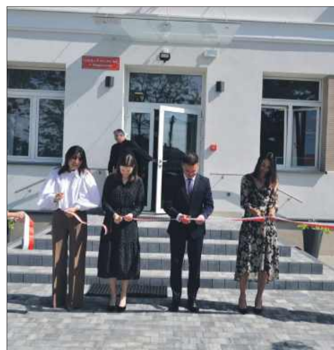
Uroczyste „otwarcie” wyremontowanego budynku.