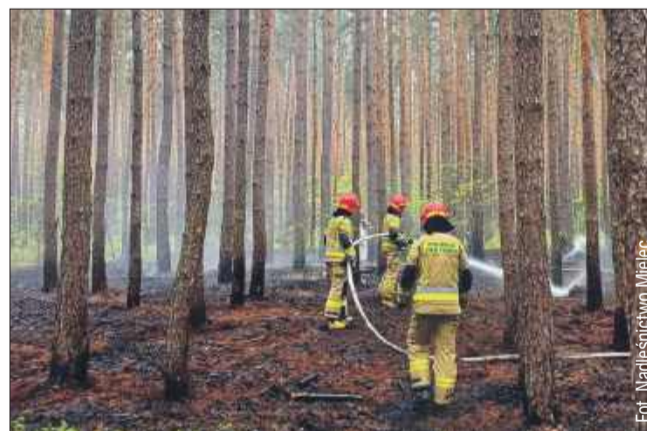
Ogień objął około 4 ary poszycia leśnego.

W piątek rutynowy dzień pracy w Nadleśnictwie Mielec został niespodziewanie przerwany zgłoszeniem o pożarze w leśnictwie Szydłowice.