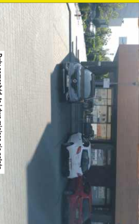
Duży samochód, to i dwa miejsca się należą.