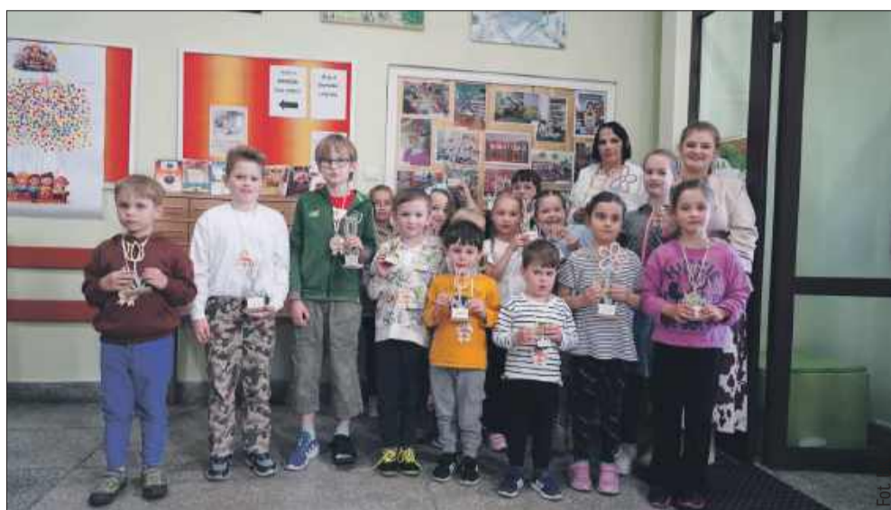
Uczestnicy zmierzali się z różnorodnymi zadaniami.

Choć rywalizacja była zacięta, atmosfera wydarzenia była bardzo przyjazna. Dzieci współpracowały w drużynach, ucząc się nie tylko liczyć punkty, ale także wspierać swoich kolegów i koleżanki. W czasie rywalizacji można było poczuć radość z wyzwań, ale również