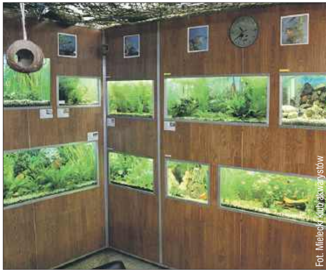
W piwnicznych pomieszczeniach przy ul. Biernackiego mieści się kilkadziesiąt akwariów.