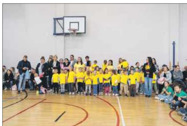
Część artystyczna w SP Dobrynin.