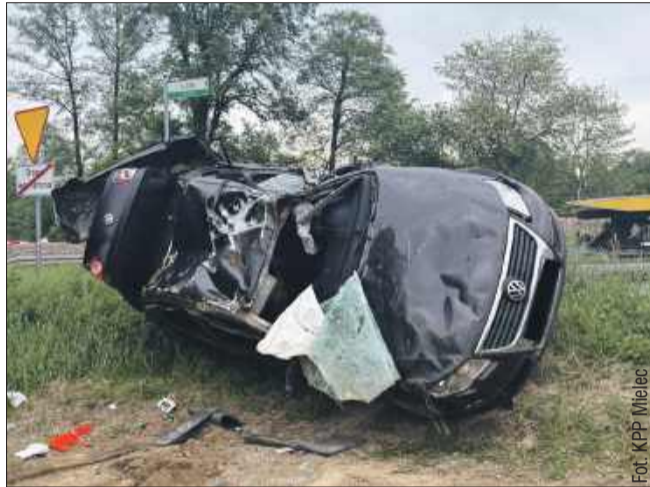
Dachowanie na drodze wojewódzkiej w Rzemieniu.

W zdarzeniu uczestniczył jeden samochód osobowy, któ-