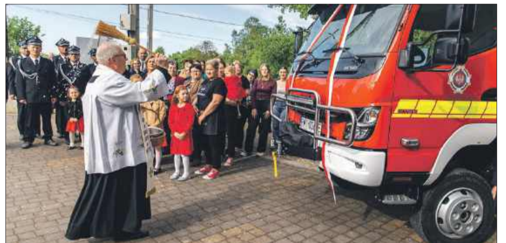
Poświęcenie nowego samochodu.