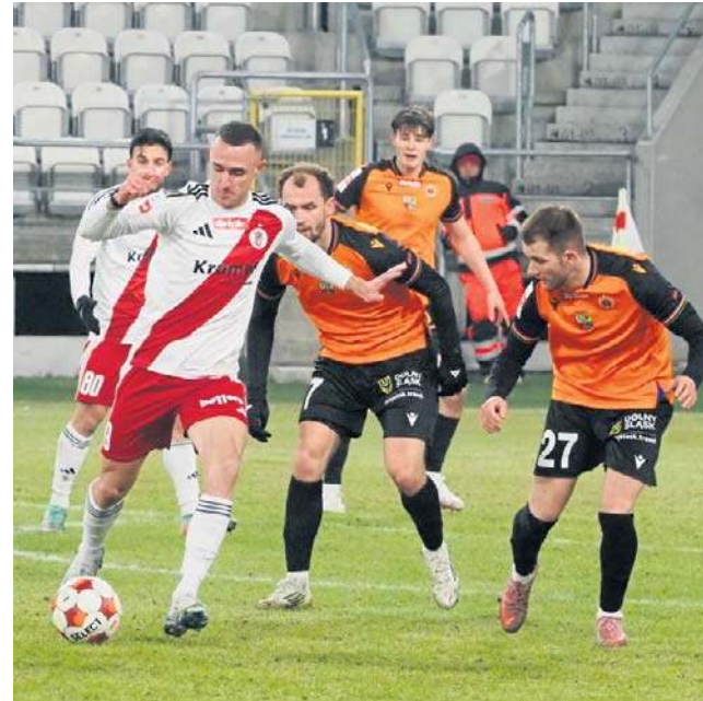
Piłkarze ŁKS Łódź (białe stroje) zmierzą się w najbliższą sobotę na swoim stadionie z Miedzią Legnica