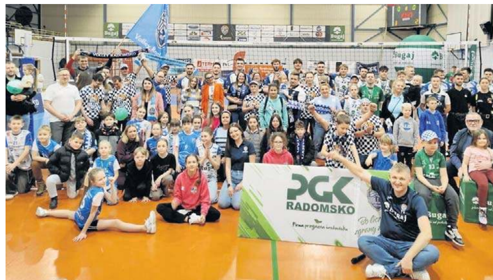
Siatkarze Bugaj Volley Radomsko pokonali w pięciu setach SPS Brzeg Dolny, czyniąc poważny krok w walce o utrzymanie się w II lidze

Grupa I. Wyniki meczów 20. kolejki: Joker Piła - Volley Team Żychlin 0:3 (20:25, 16:25, 16:25), Tarnovia Tarnowo Podg. 20 30 36:35