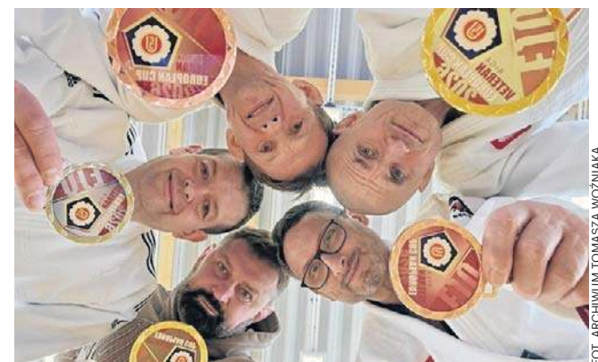
FOT. ARCHIWUM TOMASZA WOŹNIAKA

Sukces Tomasza Woźniaka to też doskonała promocja Gwardii Łódź. Na stronie klubu czytamy: Zajęcia z judo są doskonałym przygotowaniem do uprawiania każdej dyscypliny sportu, a także receptą na wychowanie zdrowych i silnych dzieci zarówno fizycznie, jak i psychicznie. Nasi wychowankowie otrzymali przygotowanie ogólne na jak najwyższym poziomie. ©©