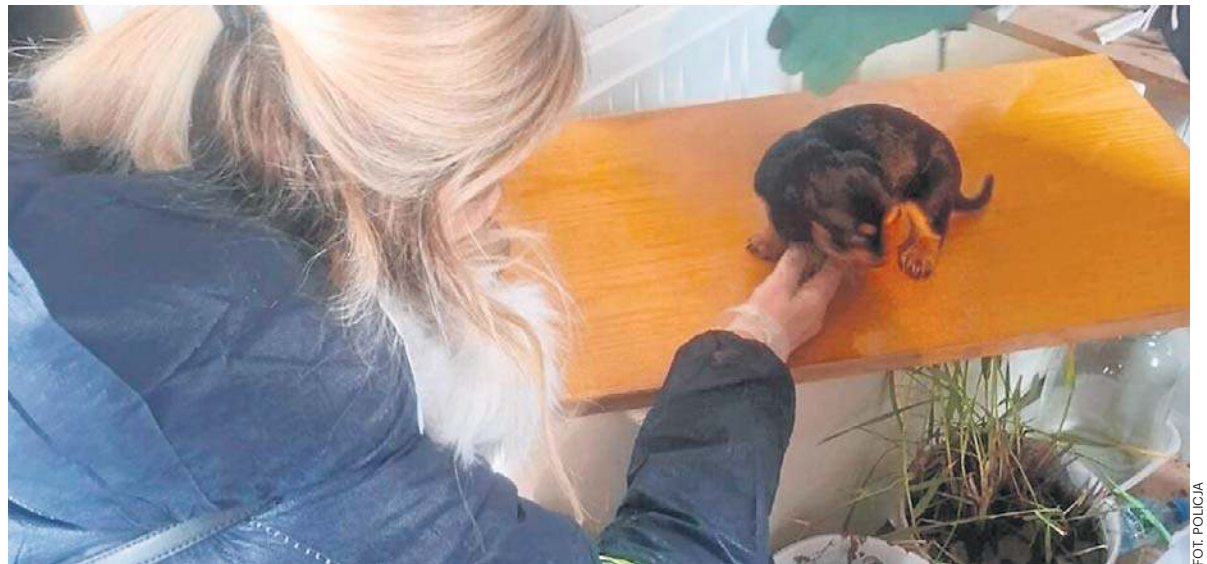
Podczas akcji policji w gminie Piątek uratowano ponad 40 małych czworonogów

52-letnia właścicielka hodowli, która sprzedawała psy za pomocą internetu, została zatrzymana. Podczas przesłuchania usłyszała zarzuty znęcania się nad zwierzętami, oszustwa oraz fałszowania dokumentów. Decyzją Sądu Rejonowego w Zgierzu została aresztowana na trzy miesiące.