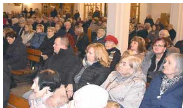
Na uroczystość konsekracji kościoła i ołtarza przybyły tłumy parafian i pielgrzymów z bliższej i dalszej okolicy