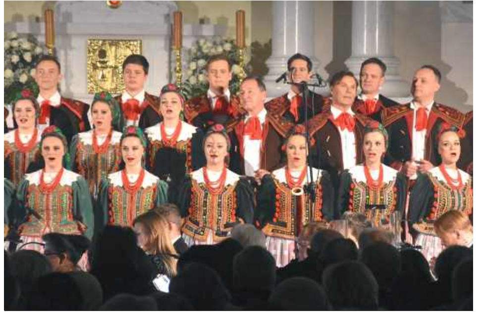
Połowę koncertu stanowiły pieśni sakralne takie jak „Bogurodzica”, „Przekrasy Jezu” i „Barka” - druga część to najpopularniejsze pieśni ludowe Zespołu: „Karolinka”, „Szła dziewczeczka do laseczka” i inne