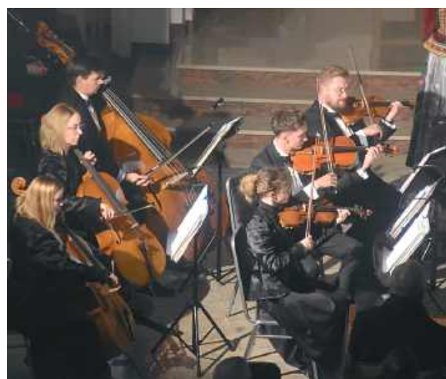
Występowi Zespołu Pieśni i Tańca „Śląsk” towarzyszyła orkiestra