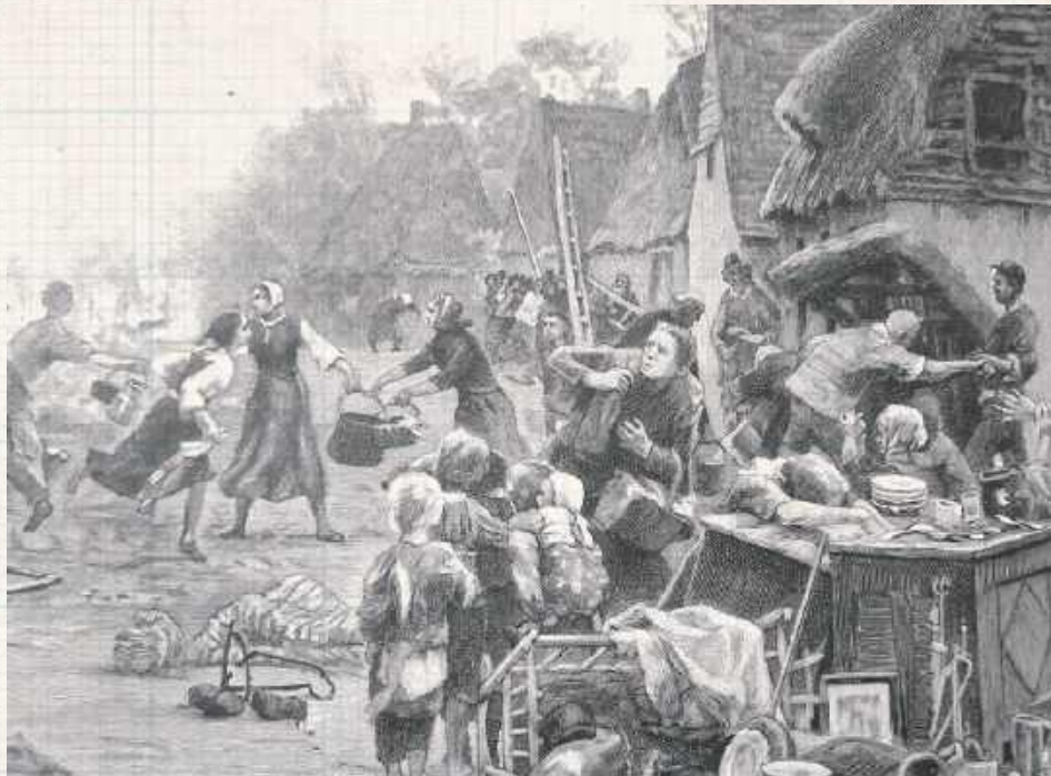
Tak mógł wyglądać pożar wsi Puznówka z 18 stycznia 1925 roku. Ogień strawił 39 zagród ze zbożem, z całym inwentarzem żywym i martwym. Straty oszacowano na 300 tysięcy złotych (Zastawie i Ziemia Łukowska, zastawie-netau.net)

Požary w minionych wiekach były wielkim niebezpieczeństwem dla mieszkańców wsi i miast. Na tę niekorzystną sytuację wpływały: drewniana zabudowa, najczęściej kryta strzechą, nadmierne zacieśnienie domostw, niedostateczny poziom świadomości gospodarzy obchodzenia się z ogniem oraz brak zorganizowanej służby pożarniczej.