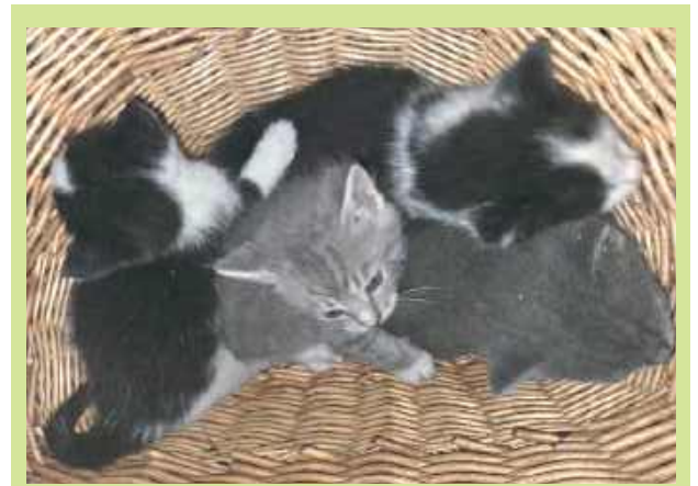
ODDAM ŚLICZNE KOTKI Tel 519 199 241

BE CZKI plastikowe z obejmą metalową; plastikowy dekiel; czyste; jak nowe; 200, 150, 120 i 60 litrów; okolice Garwolina; Tel. 600 039 408