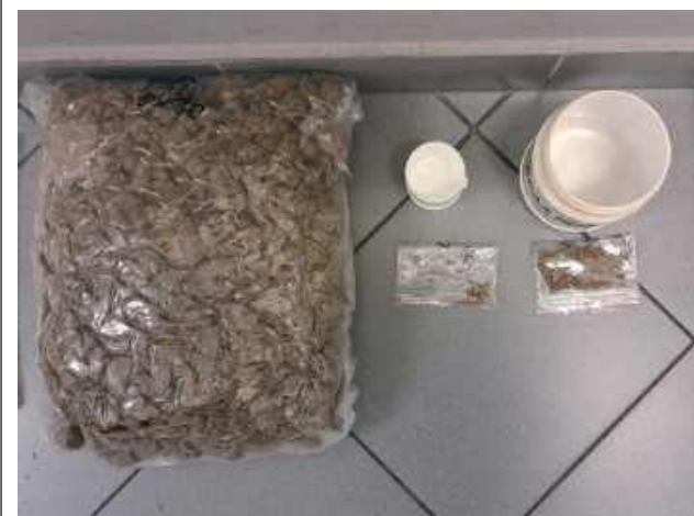
Przejęte substancje, to między innymi marihuana, amfetamina, mefedron i haszysz

Funkcjonariusze Komendy Powiatowej Policji w Garwolinie, wspierani przez policjantów Wydziału dw. z Przystępnością Narkotykową Komendy Wojewódzkiej Policji w Radomiu, przeprowadzili szeroko zakrojoną operację wymierzoną w przestępczość narkotykową.