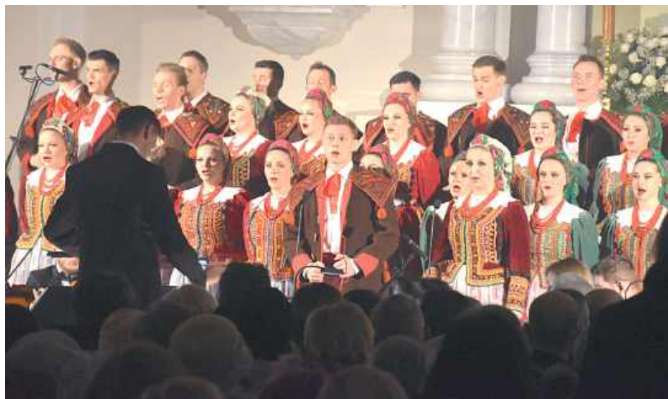
Zespół Pieśni i Tańca „Śląsk” wystąpił z programem pieśni kościelnych i maryjnych

W poniedziałek, 8 grudnia odbyła się uroczystość poświęcenia nowego – rozbudowanego kościoła parafialnego i sanktuarijnego w Górkach. Ceremonia zbiegła się z uroczystością Niepokalanego Poczęcia Najświętszej Maryi Panny.