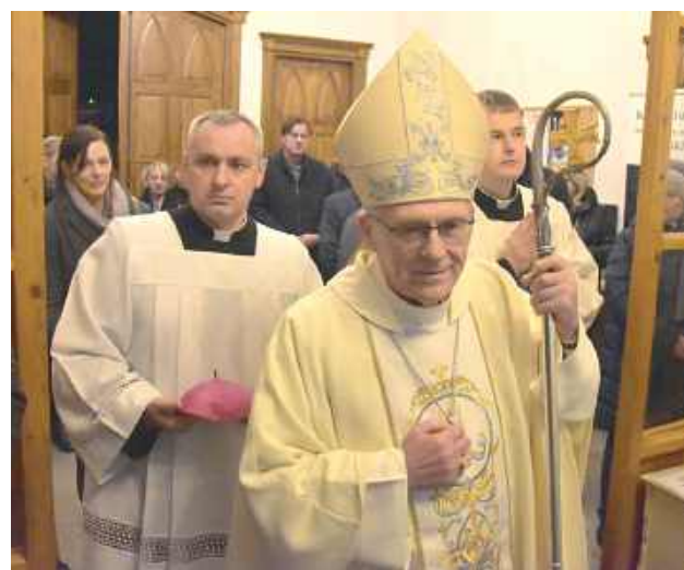
Msza święta konsekracyjna odprawiona została o godzinie 17. Nabożeństwu przewodniczył biskup siedlecki Kazimierz Gurda