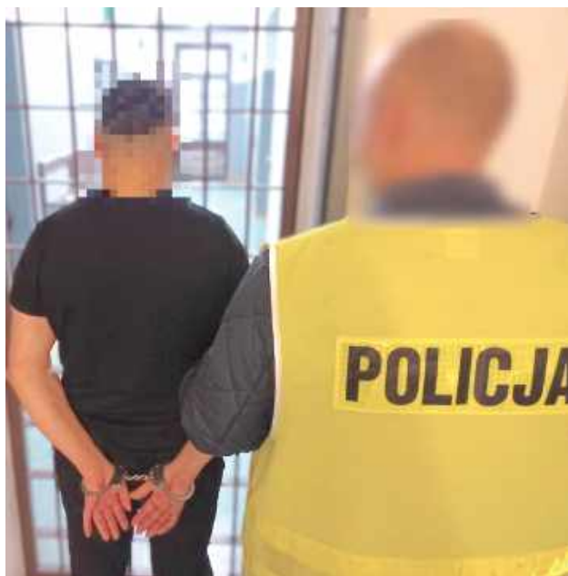
Mężczyzna skazany na pół roku więzienia za oszustwo odpowie także za wyłudzenie 25 tys. zł pod pretekstem sprowadzenia samochodu z zagranicy

Zanim 46-latek trafił do zakładu karnego, usłyszał kolejne zarzuty. Z materiałów zgromadzonych przez policjantów