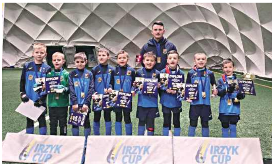
Złoci chłopcy z Wilgi Garwolin. W weekend zdominowali obydwa turnieje, w których zagraли