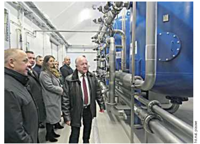
Samorząd Gminy Górzno otrzymał na ww. zadanie dofinansowanie w kwocie 8 000 000 zł w ramach Programu „Polski Ład”