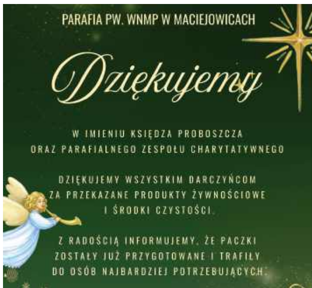
Parafia Maciejowice z radością informuje, że paczki trafiły do osób najbardziej potrzebujących (Parafia pw. Wniebowzięcia Najświętszej Maryi Panny w Maciejowicach)

Jednocześnie parafia poszukuje sprzętów dla osób potrzebujących, tj. sprawną pralkę automatyczną w dobrym stanie, małą lodówkę oraz kołdry.