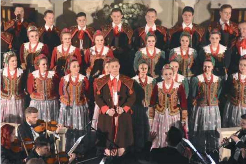
W Górkach wystąpiło około 80 osób, a w całym Zespole wszystkich pracowników jest ponad 300, przy czym sam dział artystyczny skupia w granicach 130 osób. To jest chór, balet i orkiestra