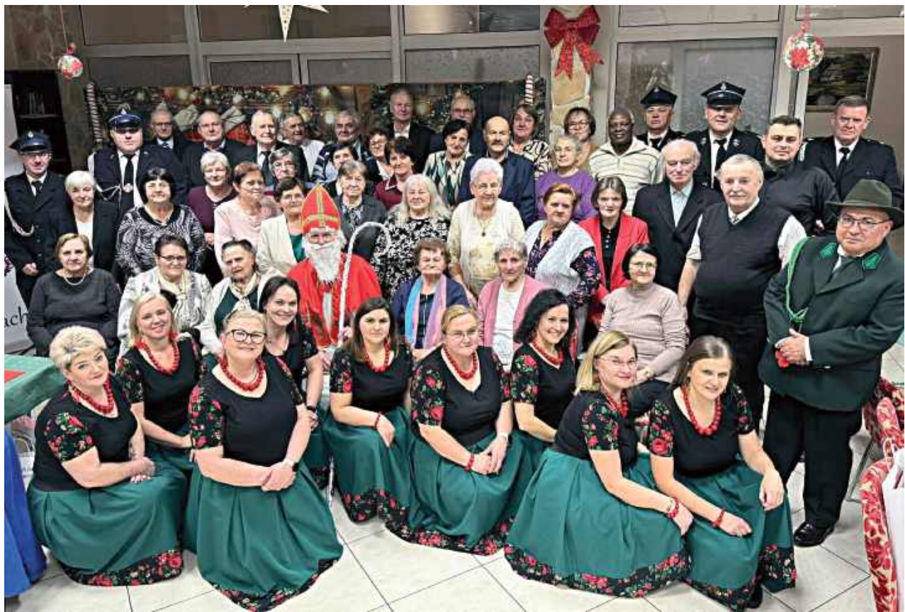
W niedzielne popołudnie, 7 grudnia br. w GOK w Borowiu odbyło się szóste, finałowe spotkanie w ramach tegorocznej edycji programu „Danie Wspólnych Chwil”