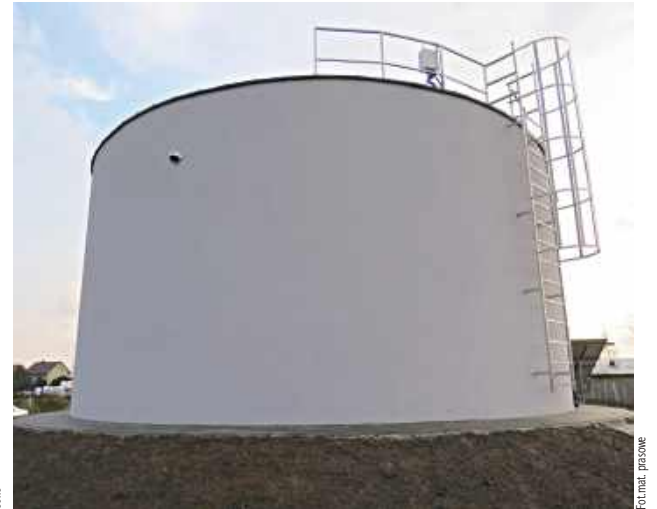
Dzięki tej inwestycji mieszkańcy gminy mogą cieszyć się lepszym bezpieczeństwem dostaw wody pitnej oraz nowoczesnymi rozwiązaniami technologicznymi