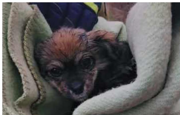
Zdarzenie miało miejsce w poniedziałek, 8 grudnia w Trzciance (gm. Wilga)

Zdarzenie miało miejsce w poniedziałek, 8 grudnia w Trzciance (gm. Wilga). Zgłoszenie do służb wpłynęło o 11.20. Na ratunek zwierzęciu, które znajdowało się w rzece ruszyli strażacy z Ochotniczej Straży Pożarnej w Trzciance. Wycią-