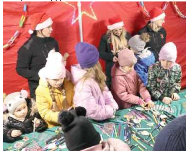
Ku ucieście małych i dużych czekających na przybycie Mikołaja w namiotach na skwerku odbywały się warsztaty kreatywne