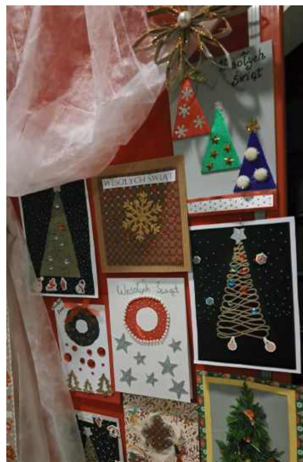
W ramach zbiórki młodzież przygotowała coś szczególnego: świąteczne kartki oraz gwiazdki, które każdy darczyńca mógł zabrać ze sobą w zamian za dowolny datek wrzucony do puszek (Parafia pw. Świętego Jana Chrzciciela w Górznie)