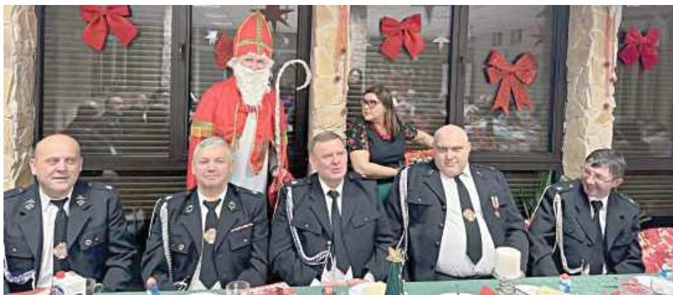
Wydarzenie stało się również okazją do podziękowań przedstawicielom OSP w Jaźwinach