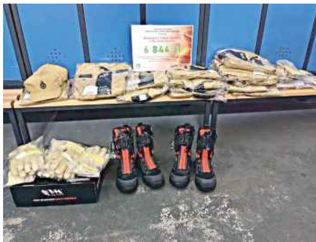
Każda taka pomoc realnie wzmacnia gotowość strażaków do niesienia pomocy mieszkańcom