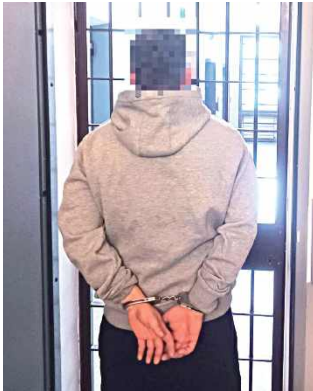
Mężczyzna został aresztowany

tury sąd zastosował wobec zatrzymanego tymczasowy areszt. Prokuratura Rejonowa w Garwolinie skierowała przeciwko mężczyźnie akt oskarżenia. – Obejmuje on posiadanie bez zezwolenia broni, posiada-