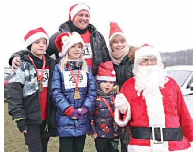
Bieg z Mikołajem co roku przyciąga wielu entuzjastów

Gospodarz miasta dziękowała za owocną współpracę zarówno władzom województwa, jak i działającym z miastem stowarzyszeniom