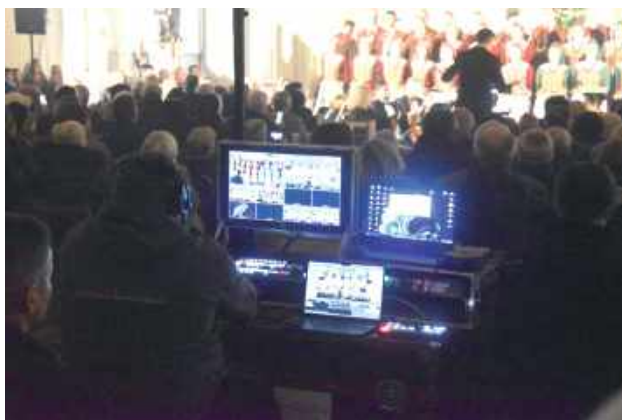
Uroczystość konsekracji była transmitowana przez Katolickie Radio Podlasie i Diecezjalną Telewizję Internetową FAROTV

Po mszy świętej odbył się koncert Zespołu Pieśni i Tańca „Śląsk”. Na zewnątrz kościoła został ustawiony telebim dla osób, które nie zmieściły się w świątyni. Uroczystość konsekracji była transmitowana przez Katolickie Radio Podlasie i Diecezjalną Telewizję Internetową FAROTV. Po nabożeństwie w budynku Ochotniczej Straży Pożarnej w Rudzie Talubskiej zorganizowano poczęstunek dla zaproszonych gości.