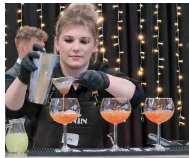
4 grudnia odbył się najbardziej prestiżowy konkurs barmański dla uczniów w Polsce – Monin Junior Cup 2025