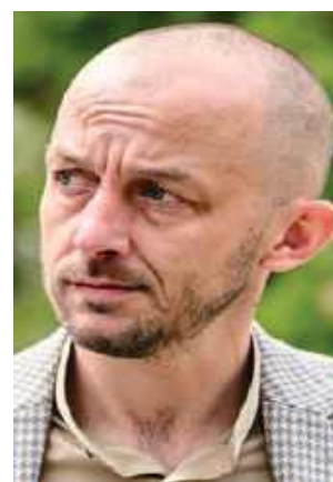
Znany lokalny działacz i pasjonat historii wprost mówi, że „system śmieciowy w Garwolinie to fikcja”

„Nowe bloki, korki, pełne szkoły - moich wyliczeń wynika, że jest nas 22-25 tysięcy. A może i 31 tysięcy”