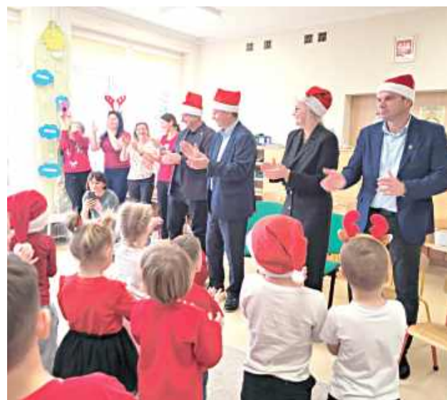
Dzieci z entuzjazmem powitały gości, a ich radosne okrzyki i uśmiechy sprawiły, że w przedszkolu zapanowała prawdziwie magiczna atmosfera