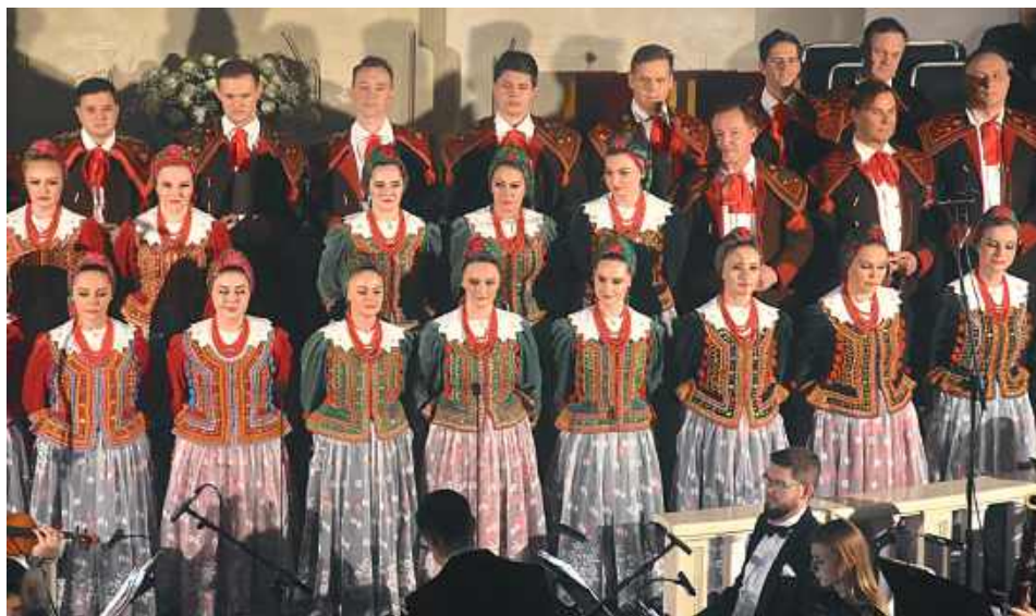
Po mszy świętej odbył się koncert Zespołu Pieśni i Tańca „Śląsk”