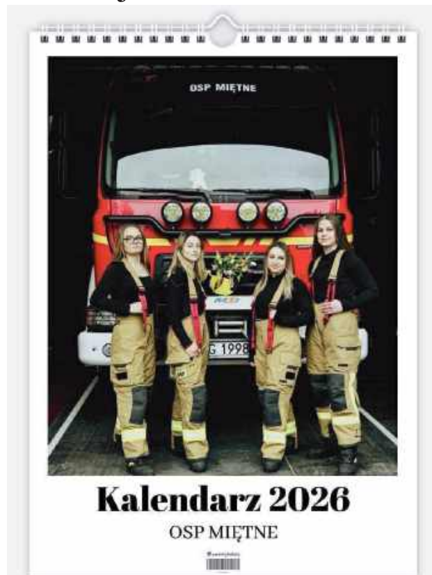
Zakup kalendarza to forma wsparcia Ochotniczej Straży Pożarnej w Miętnej. Młodzieżowa Drużyna Strażacka przy OSP została powołana do życia w roku 2020

W tym miejscu przypomnijmy: Ochotnicza Straż Pożarna w Miętnej została założona w 1922 roku. Powstała z inicjatywy aktywnie działającego w miejscowości koła młodzieży. Jego pierwsi członkowie w roku 1921 brali udział w kursie teatralnym w Garwolinie, zorganizowanym z pomysłu Związku Teatrów Ludowych w Warszawie. Młodzieżowa Drużyna Strażacka przy Ochotniczej Straży Pożarnej w Miętnej została powołana do życia w roku 2020. Od tego czasu prężnie działa na rzecz OSP i sołectwa Miętne oraz systematycznie się rozwija. Strażacy z Miętnej corocznie biorą udział m.in. w adoracji Grobu Pańskiego, przygotowaniach ołtarza do procesji Bożego Ciała