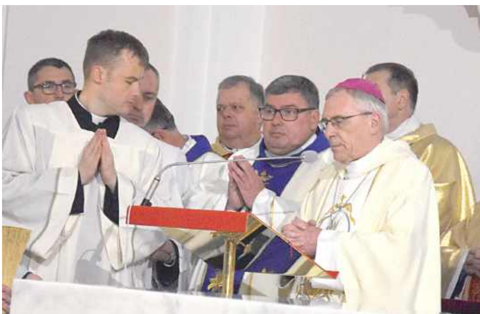
Podczas homilii biskup siedlecki mówił: Tytuł kaplicy, kościoła i sanktuarium w Górkach koło Garwolina wskazują na szczególną obecność w tym miejscu Matki naszego Zbawiciela, Jezusa Chrystusa

- Prezydent Rzeczypospolitej Polski Karol Nawrocki: Łącząc się z państwem w radosnym dziękczynieniu za dzieło rozbudowy tutejszego sanktuarium Matki Bożej Fatimskiej oraz za wszelkie łaski płynące z posługi pełnionej w kościele parafialnym Matki Bożej Szkaplerznej w Górkach. Dzisiejsza uroczystość jest okazją do wspólnego świętowania pomyślnego zakończenia prac, a zarazem przypomina o dziejach tej ziemi i zamieszkującej ją