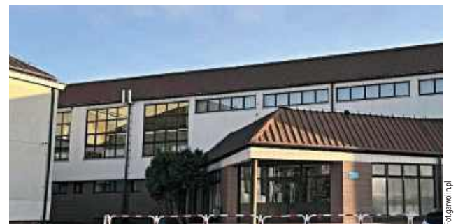
Dzięki tym środkom zmodernizowana zostanie miejska hala sportowa przy Publicznej Szkole Podstawowej nr 1 im. Marii Konopnickiej w Garwolinie

Miasto Garwolin otrzyma łącznie prawie 1,6 mln zł na modernizację kluczowych obiektów sportowych