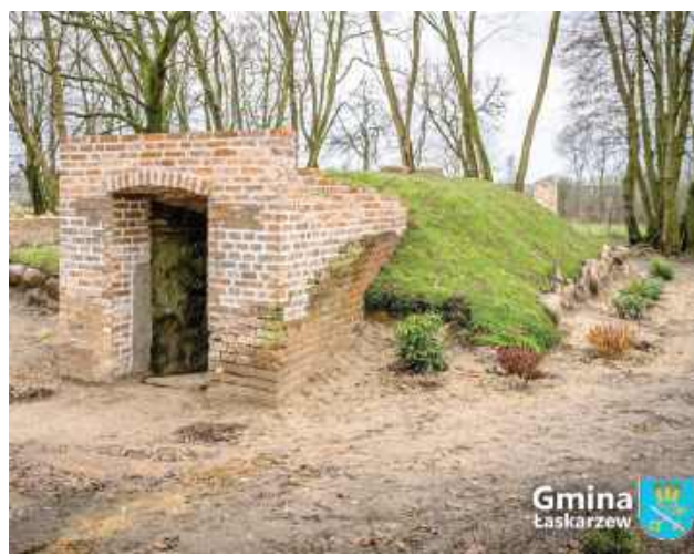
Przeprowadzono remont starej ziemianki

To kolejny krok w stronę rewitalizacji tego wyjątkowego miejsca, które staje się coraz bardziej atrakcyjne, przyjazne i zielone – zarówno dla mieszkańców, jak