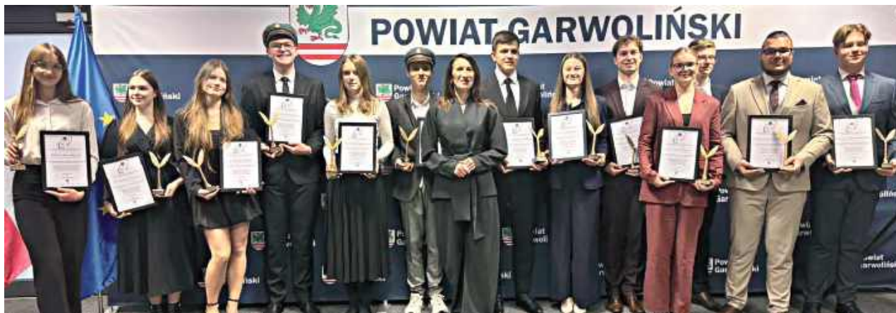
Nagrody najzdolniejszym uczniom wręczyła starosta Iwona Kurowska

Starosta Iwona Kurowska wręczyła stypendia naukowe uczniom naszego powiatu, którzy osiągają wybitne wyniki w nauce. Trzynastu z nich ma się czym pochwalić!