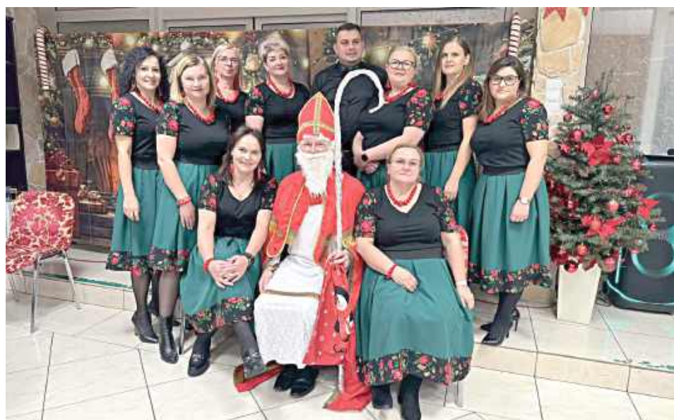
Wydarzenie miało charakter wyjątkowy – tym razem uczestnicy spotkali się na wspólnej Wigilii