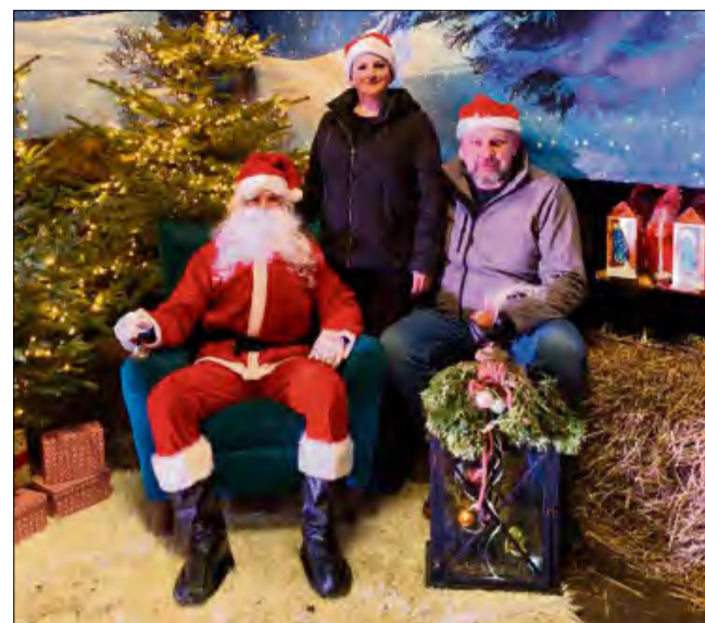
Takie mikołajki to wspólna inicjatywa sołectw Boguszyce oraz Chrzowice.

Procedura toczy się w ramach postępowania o wydanie decyzji o środowiskowych uwa-