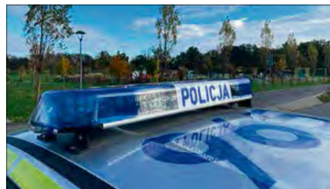
Dzięki czujności pracodawcy, szybkiej reakcji służb i współdziałaniu pomoc nadeszła na czas.

Do tego zdarzenia doszło w ubiegłym tygodniu. Policjanci z Komisariatu Policji I w Opolu otrzymali zgłoszenie od jednego z zaniepokojonych pracodawców, dotyczące nieobecności jego pracownika w firmie. Według przekazanych informacji, mężczyzna nie przyszedł do pracy i nie było z nim od rana żadnego kontaktu. Nie odbierał również telefonu, co nigdy wcześniej się nie zdarzało. Na miejsce zostali skierowani kryminalni z komisariatu, którzy zauważyli palące się światło w mieszkaniu. W rozmowie z sąsiadami ustalili, że mężczyzna ostatni raz widziany był przez nich dzień wcześniej, kiedy po