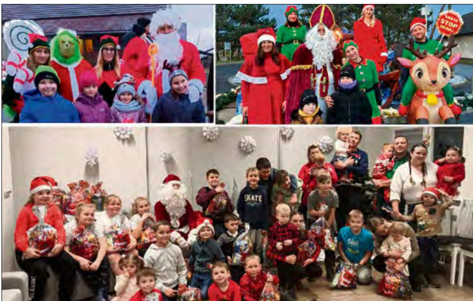
Święty Mikołaj odwiedził mieszkańców gminy Popielów.

W Karłowicach z kolei zorganizowano „Wielki Finał strażackiej paczki dla dzieciaczka z Mikołajem”. W Popielowie spotkanie świąteczne zorganizowało natomiast Koło DFK Popielów działające przy Mniejszości Niemieckiej.