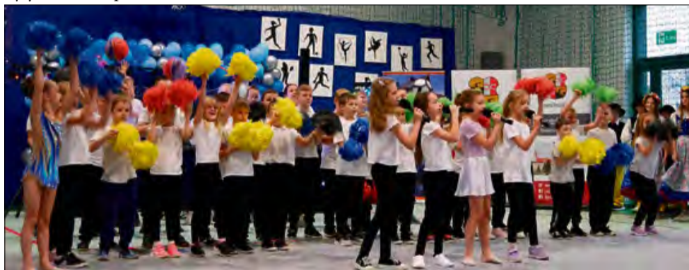
Organizatorzy zatroszczyli się o atrakcyjną oprawę wydarzenia.