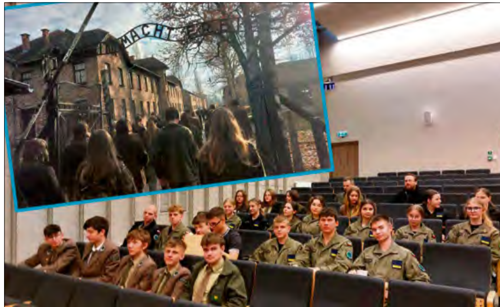
Uczniowie Zespołu Szkół w Tułowicach wzięli udział w ciekawych wydarzeniach.

Uczniowie Zespołu Szkół w Tułowicach uczestniczyli w dziesiątej edycji poruszającego wydarzenia edukacyjnego. W ramach dwóch wizyt studyjnych odwiedzili m.in. Państwowe Muzeum Auschwitz-Birkenau.