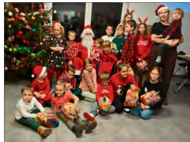
Mikołajki w Niwkach odbyły się w sobotę 6 grudnia.

Dwa dni wcześniej (4 grudnia) święty Mikołaj odwiedził również świetlicę w Łędzinach. W podziękowaniu za otrzymane prezenty dzieci