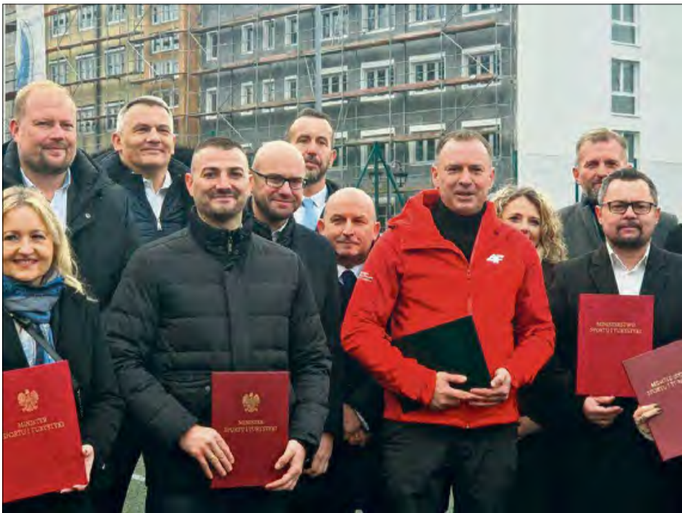
Wiceminister Sportu i Turystyki Piotr Borys wręczał w Opolu decyzje o dofinansowaniu inwestycji sportowych w regionie.

W iceminister Sportu i Turystyki Piotr Borys wręczał 8 grudnia w Opolu decyzje o dofinansowaniu inwestycji sportowych w regionie. Wśród zadań, które uzyskały ministerialne wsparcie jest modernizacja realizowana właśnie na krytej pływalni przy naszym Zespole Szkół w Tułowicach.