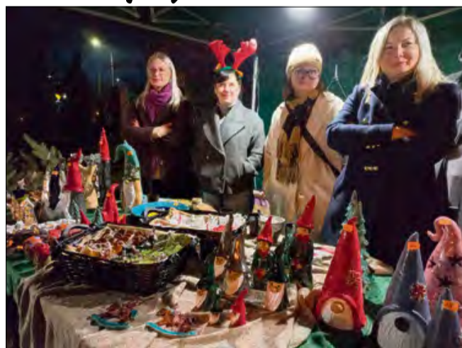
Uczestnicy, którzy skorzystali z zaproszenia mogli na stoiskach nabyć świąteczne rękodzieło.

Organizatorzy zadbali o dodatkowe atrakcje. Dzieci mogły spotkać się ze św. Mikołajem oraz wziąć udział w animacjach. Warto podkreślić, że szczególną uwagę poświęcono oprawie artystycznej.