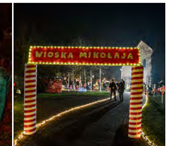
Trzy tygodnie trwały przygotowania wioski Mikołaja w Żelaznej.