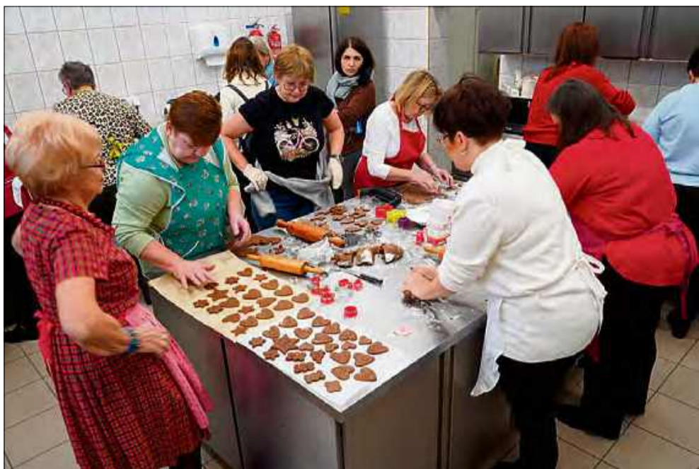
Wydarzenie odbyło się w środę 3 grudnia w Klubie Samorządowym w Chrzastowicach.

T radycyjne pieczenie pierników w Chrzastowicach świętowało swój jubileusz. W XX edycji wydarzenia udział wzięła rekordowa liczba uczestników, a po raz pierwszy w przygotowaniu zaangażowały się dzieci. W efekcie powstało blisko 200 słodkich paczuszek, które trafiły do osób samotnych i potrzebujących.