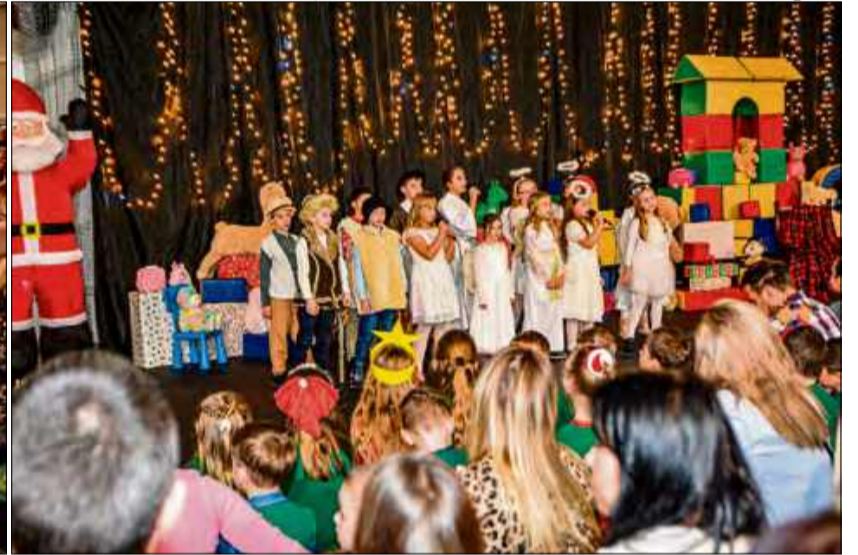
W Naroku po raz trzeci zorganizowano Narocki Kiermasz Mikołajkowy

nastroj. Tradycyjnie nie zabrakło stoisk z rękodziełem, warsztatów plastycznych, fotobudki czy domowego jedzenia: bigosu, ciast i pierniczek.