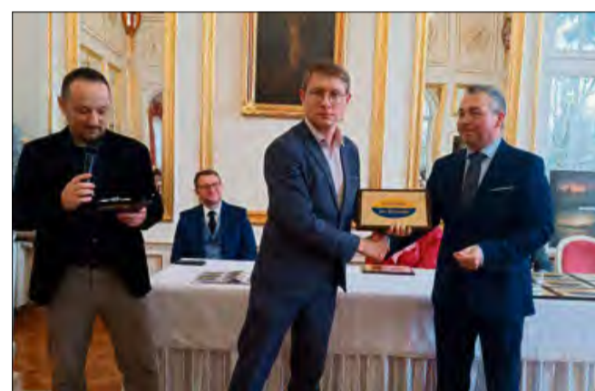
Oficjalne włączenie do wojewódzkiej akcji „Gōdōmy po ślōnsku” zostało potwierdzone certyfikatem, wręczonym podczas uroczystej gali na Zamku Odrowążów w Kamieniu Śląskim.

Integralną częścią spotkania był panel dyskusyjny, który dotyczył praktycznego wykorzystania mowy śląskiej w kluczowych obszarach: