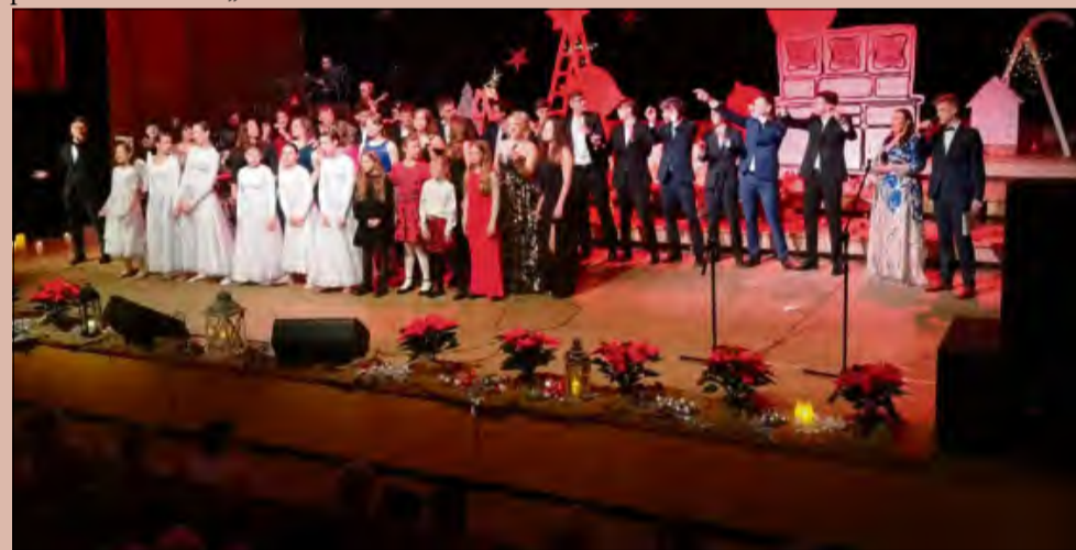
Publiczność w pełnej sali Filharmonii Opolskiej świętowała razem z artystami.