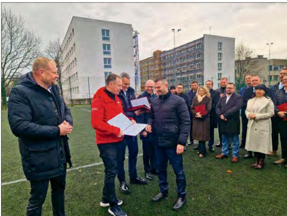
Dzięki staraniom powiatu opolskiego obiekt otrzymał kolejne dofinansowanie.