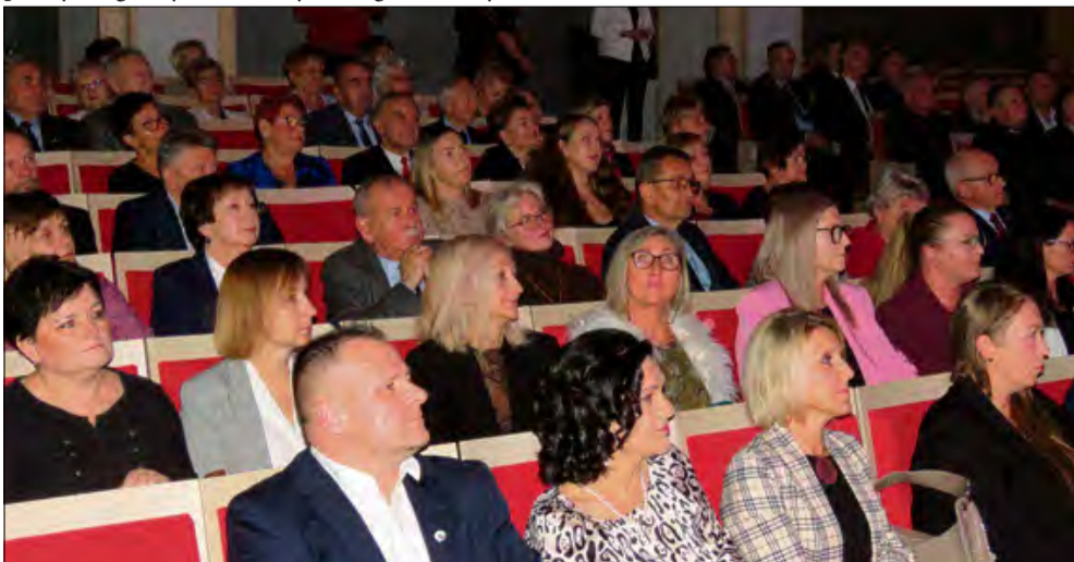
Uczestnicy z dużym zainteresowaniem wysłuchali debaty burmistrzów oraz prelekcji o historii gminy Ożimek.