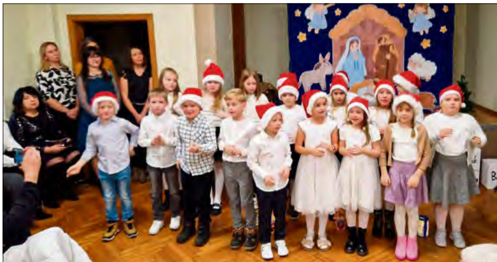
Uczniowie Publicznej Szkoły Podstawowej w Dańcu oraz dzieci z oddziałów przedszkolnych zaprezentowali ciekawy program artystyczny.

W niedzielę 7 grudnia w Klubie Wiejskim w Dańcu odbyło się spotkanie opłatkowe zorganizowane przez lokalną szkołę podstawową. Wydarzenie zgromadziło mieszkańców wsi, rodziny uczniów oraz gości.