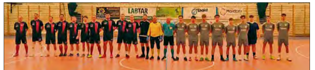
Inauguracyjny mecz ligi futsalu w Tarnowie Opolskim – starcie Malik Przywory z Młoda Gieksą otworzyło trzynastą edycję rozgrywek.

dziesięć drużyn: Futsal Team Jagódki, FC Fences, Malik Przywory, Młoda Gieksa, KS Krasiejów, Tropikanez, FC Łubudubu, Samba Squad oraz FC Nakło. Każde spotkanie potrwa 30 minut, a cała liga zakończy się 1 lutego. Tradycyjnie mecze odbywać się