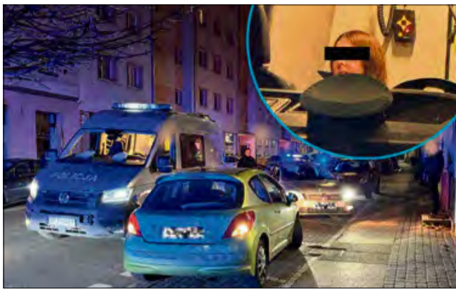
Policjantka, która została zatrzymana po spektakularnym pościgu przez swoich kolegów po fachu, może pożegnać się z mundurem.

42 -letnia funkcjonariuszka z Opola, która w nocy 16 listopada uciekała przed patrolami, nie wróci już do służby. Kobięcie, zatrzymanej po spektakularnym pościgu, grozi do 5 lat więzienia za jazdę pod wpływem alkoholu i niepodporządkowanie się poleceniom. Jako pierwszy informację o tym zdarzeniu podał „Tygodnik Ziemi Opolskiej”.