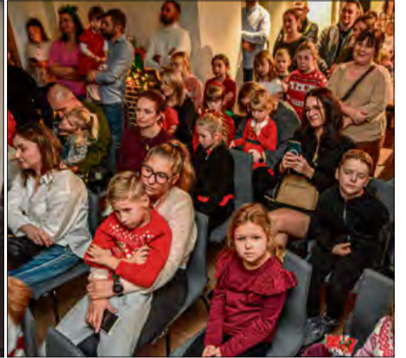
Centrum Aktywności Lokalnej w Chróście zamieniło się w fabrykę świętego Mikołaja.

W gminie Dąbrowa rozpoczął się czas świątecznych spotkań, które integrują mieszkańców i tworzą wyjątkową atmosferę.