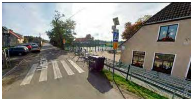
Przy Publicznej Szkole Podstawowej w Dańcu przydałyby się dodatkowe miejsca parkingowe. Gmina ma pomysł, jak rozwiązać ten problem.

Sprawa jest w fazie wstępnej. Urząd podpisał z wła-