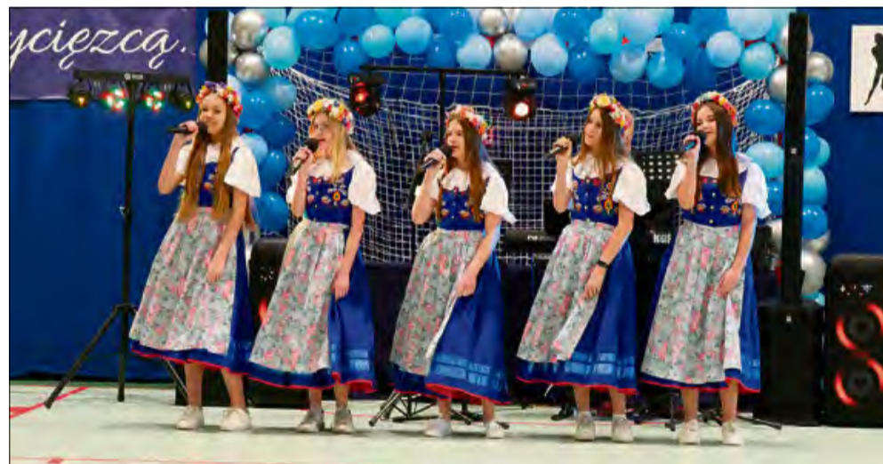
Wystąpiły również uczennice szkoły.