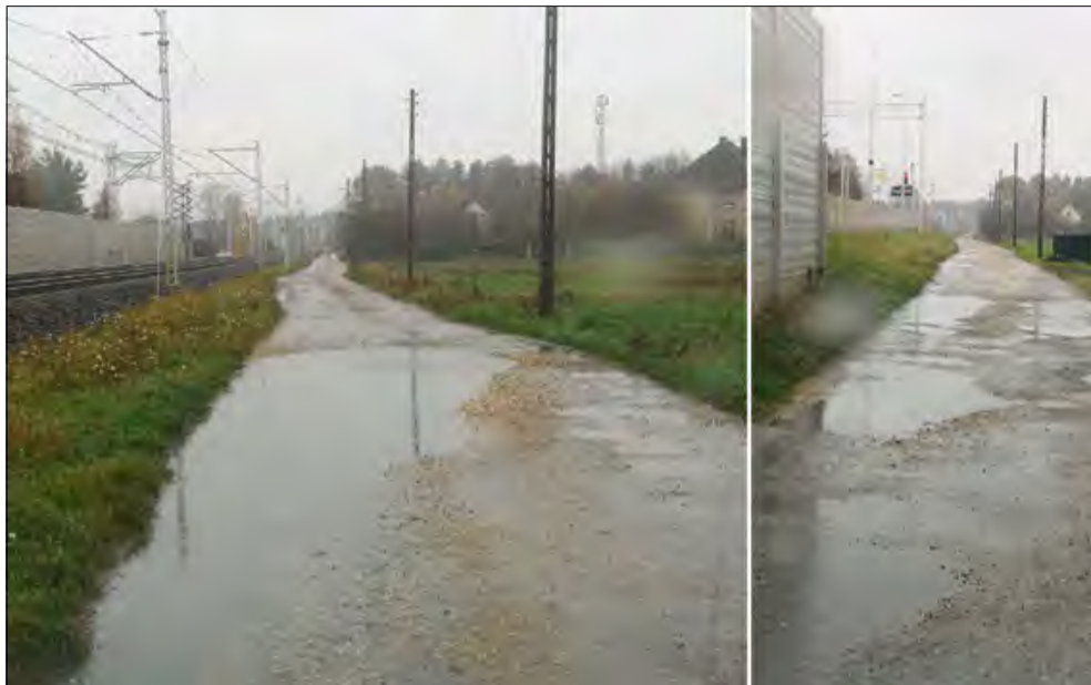
Ulica Parkowa w Przyworach – jedyna droga dojazdowa dla mieszkańców 7 domów. Jej katastrofalny stan techniczny, widoczny na zdjęciu, od dziesięcioleci stanowi zagrożenie dla bezpieczeństwa i utrudnia codzienne życie.

Od ponad czterdziestu lat mieszkańcy ulicy Parkowej w Przyworach bezskutecznie zabiegają o remont swojej drogi. W złożonej w listopadzie petycji do wójty gminy Tarnów Opolski opisują dramatyczną sytuację: nieremontowana od dziesięcioleci, prowizorycznie łamana ulica zamienia się w coraz głębszą koleinę pełną ubytków i zapadlisk. Po deszczu tworzą się kałuże i błoto, zimą przejazd bywa niemożliwy.