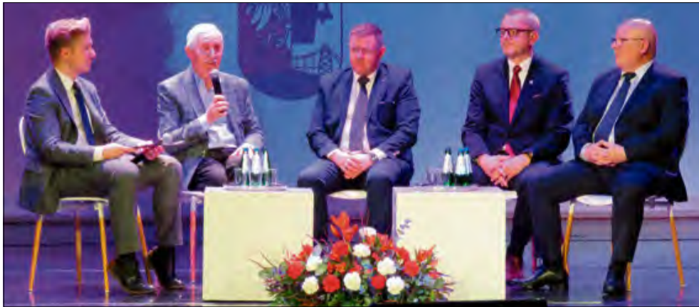
Byli i obecni samorządowcy wspominali okres tworzenia się i funkcjonowania gminy Ożimek.

- Dzisiejsze święto to doskonała okazja by z uznaniem pochylić głowy nad wszyst-