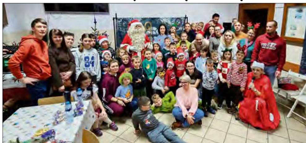
Dzieci z Łędzin ucieszyły się na widok świętego Mikołaja.

W gminie Chrzastowice odbyły się zabawy mikołajkowe dla dzieci. Kreatywnie i wesoło było m.in. w Niwkach oraz Łędzinach.