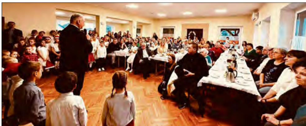
Tego dnia Klub Wiejski w Dańcu pękał w szwach.