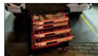
Strażacka remiza wzbogaciła się o nowe narzędzia.

W ostatnich dniach święty Mikołaj dotarł nawet do strażackiej remizy, przynosząc ze sobą wyjątkowy podarunek. Załoga okazała się w minionym roku wyjątkowo grzeczna – nie urządzali psikusów i nie-