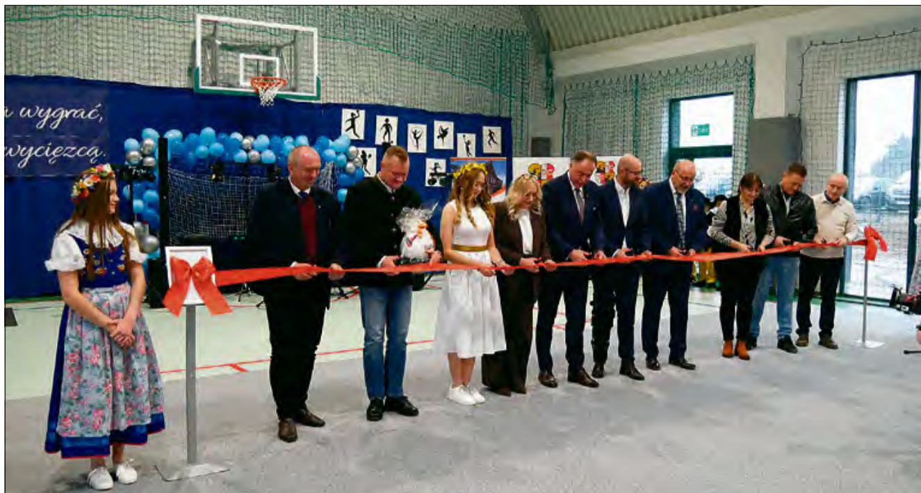
Ważnym elementem było uroczyste przecięcie wstęgi.

Uczestnicy wydarzenia mogli obejrzeć artystyczno-sportowy występ przygotowany przez uczniów szkoły. Były również przemówienia,