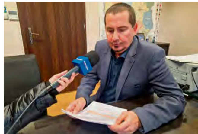
Wprowadzenie nowych przepisów ma na celu przede wszystkim odciążenie urzędów i ułatwienie obywatelom załatwiania formalności.

Nowelizacja przyniesie kilka kluczowych udogodnień, które wpłyną na codzienną obsługę w Wydziale Komunikacji. Tablice zostają w domu: zostanie zniesiony obowiązek legalizacji tablic rejestracyjnych w przypadku, gdy nowy nabywca decyduje się zachować dotychczasowe numery. Oznacza to mniej formalności i szybsze załatwienie sprawy w urzędzie. Hak bez dodatkowego badania: uproszczona zostanie procedura rejestracji haka holowniczego. W przypadku nowych aut, jeśli wpis HAK znajduje się już w homologacji pojazdu, nie