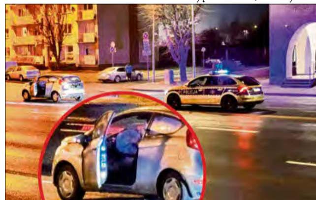
W samochodzie 51-letniej kobiety w wyniku uderzenia uaktywniła się poduszka powietrzna.

W sobotę około godziny 21.45 na ul. Nysy Łużyckiej nieopodal budynku Agencji Bezpieczeństwa Wewnętrznego – Delegatury w Opolu podczas kontroli prędkości prowadzonej przez policję doszło do kolizji. Kierująca kobietą nie zdołała wyhamować swojego samochodu i uderzyła w tył pojazdu, jadącego przed nią, który został zatrzymany do kontroli przez funkcjonariusza policji.