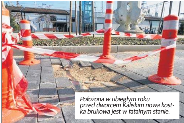
Położona w ubiegłym roku przed dworcem Kaliskim nowa kostka brukowa jest w fatalnym stanie.