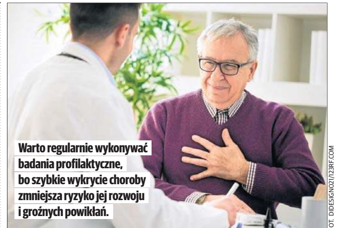
Warto regularnie wykonywać badania profilaktyczne, bo szybkie wykrycie choroby zmniejsza ryzyko jej rozwoju i groźnych powikłań.

Aby słuchali siebie, własnych instynktów, nie patrzyli na to, że ktoś każe zachodzić im w ciążę, bo takie są społeczne oczekiwania i obowiązki. Oni po prostu muszą czuć się gotowi. A przy okazji muszą liczyć się z tym, że posiadanie potomstwa to olbrzymia odpowiedzialność. I pojawiają się takie sytuacje, że będzie pięknie i kolorowo, ale też momenty, gdy będzie smutno i trudno.