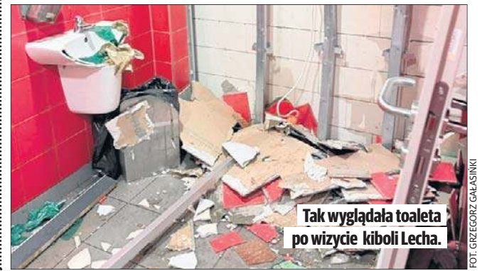
Tak wyglądała toaleta po wizycie kiboli Lecha.

Kibice ze stolicy Wielkopolski weszli na obiekt, po czym opuścili go jeszcze w trakcie pierwszej połowy. Dlaczego? Bo - z obawy o bezpieczeństwo - nie wpuszczono na stadion fanów zaprzyjaźnionego ŁKS Łódź.