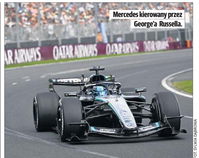
Mercedes kierowany przez George'a Russella.