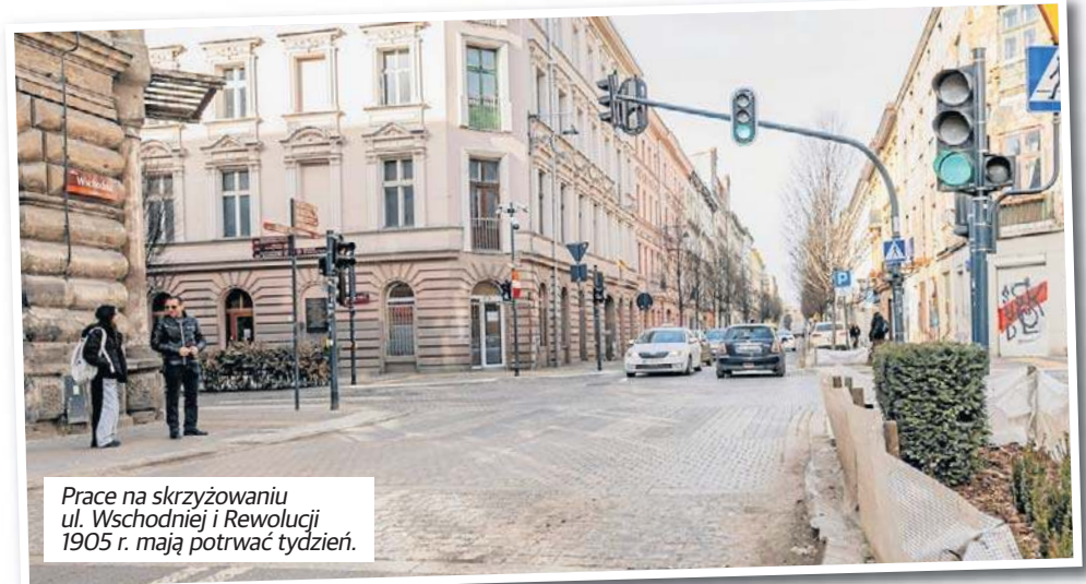
Prace na skrzyżowaniu ul. Wschodniej i Rewolucji 1905 r. mają potrwać tydzień.

● Linia 96: Teofilów - Rojna, Traktorowa, Aleksandrow-