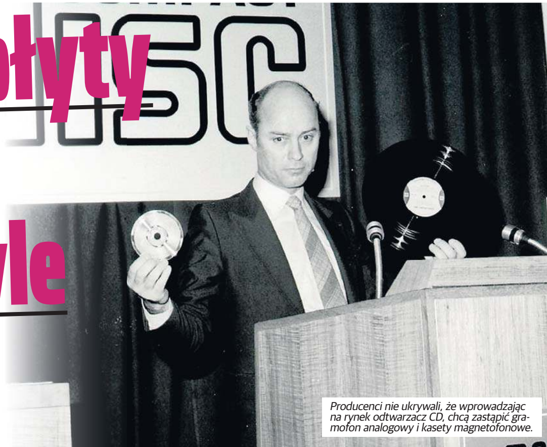
Producenci nie ukrywali, że wprowadzając na rynek odtwarzacz CD, chcą zastąpić gramofon analogowy i kasetę magnetofonową.

Pierwsze płyty CD zostały po raz pierwszy zaprezentowane 8 marca 1979 roku w Eindhoven.