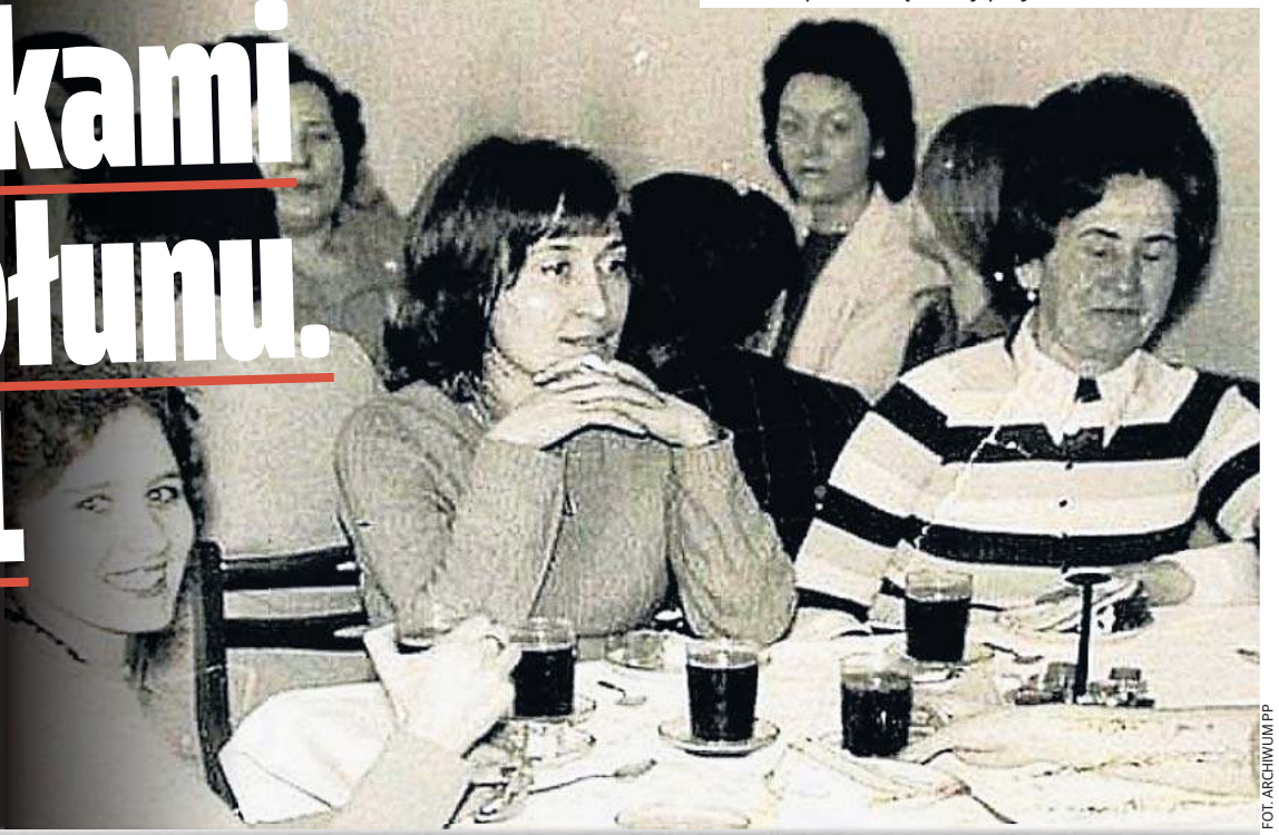
8 marca panie świętowały przy kawie i ciastkach.

W PRL-u Dzień Kobiet był jednym z najważniejszych świąt. Panie dostawały symbolicznego goździka, czekoladę, rajstopy. Ale to było tylko od święta.