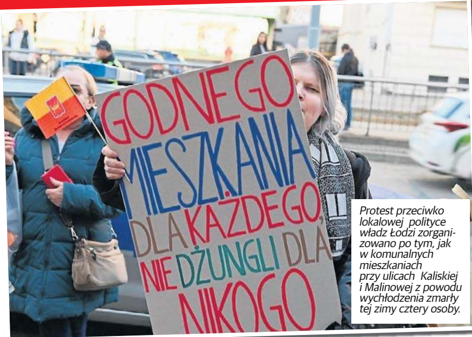
Protest przeciwko lokalowej polityce władz Łodzi zorganizowano po tym, jak w komunalnych mieszkaniach przy ulicach Kaliskiej i Malinowej z powodu wychłodzenia zmarły tej zimy cztery osoby.

● Jerzy Skolimowski na premierze filmu „Dobry chłopiec” STR. 18