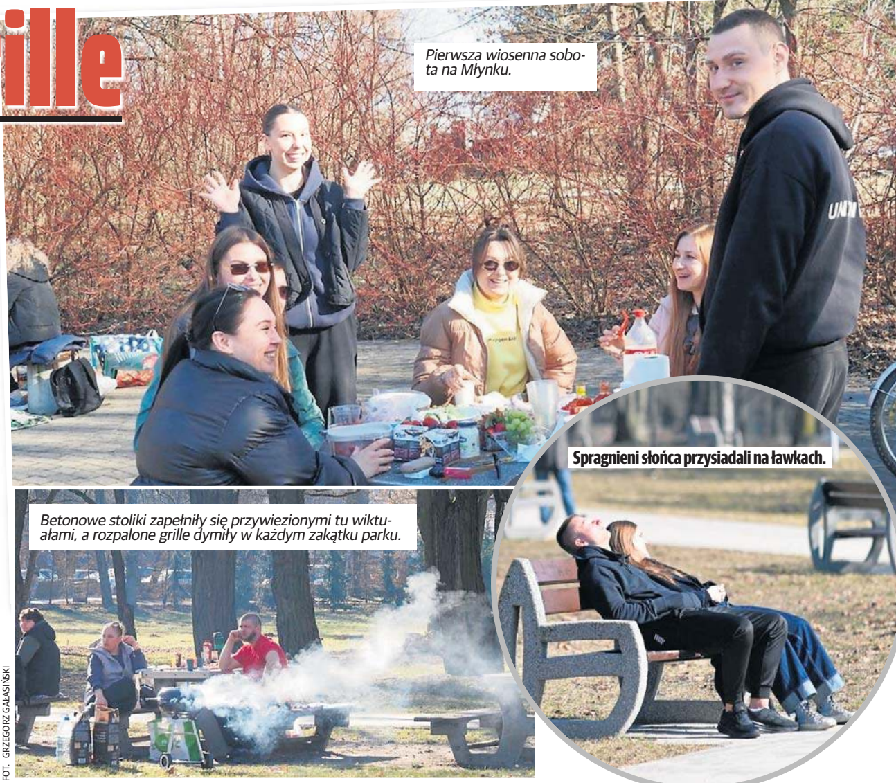
Pierwsza wiosenna sobota na Młynku.