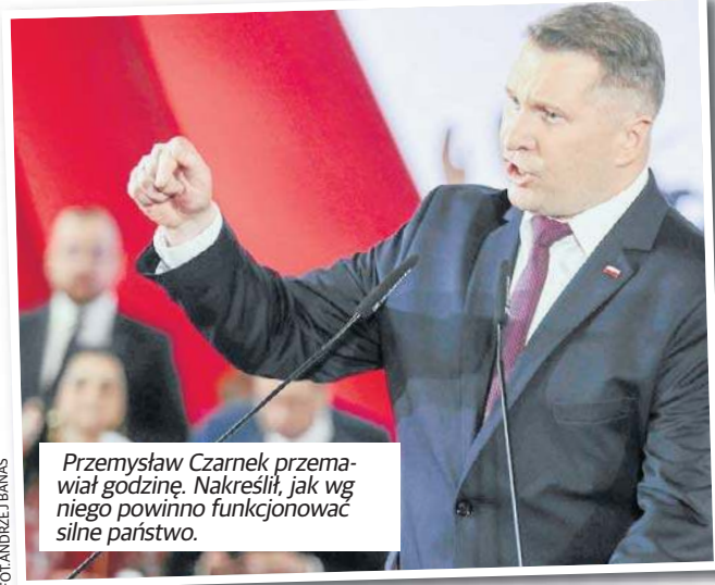
Przemysław Czarnek przemawiał godzinę. Nakreślił, jak w jego wyobrażeniu powinno funkcjonować silne państwo.

- W walce o Polskę nogi nie odstawiamy. Jak ktoś odstawi nogę, Polska przegra, my razem z nią. Tu się nogi nie odstawia.