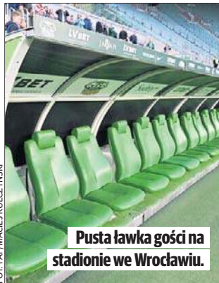
Pusta ławka gości na stadionie we Wrocławiu.

1:0 - Laskowski (26), 2:0 - Noiszewski (34, samobójcza), 3:0 - Laskowski (53).