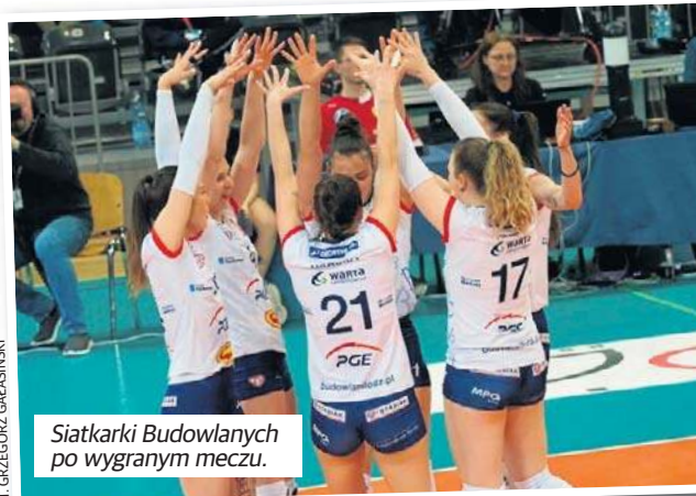
Siatkarki Budowlanych po wygranej meczu.

Nie powiodło się natomiast siatkarkom ŁKS Commercecon. Łódzianki przegrały 0:3 z Lotto Chemikiem Police. Elkaesiankom wybitnie nie udało się mecz w Szczecinie. A przecież kilka dni temu ŁKS Commercecon rozegrały bardzo dobre zawody przeciwko UNI Opole i pewnie pokonał rewelację tego sezonu.