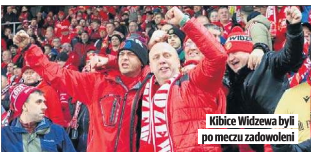
Kibice Widzewa byli po meczu zadowoleni