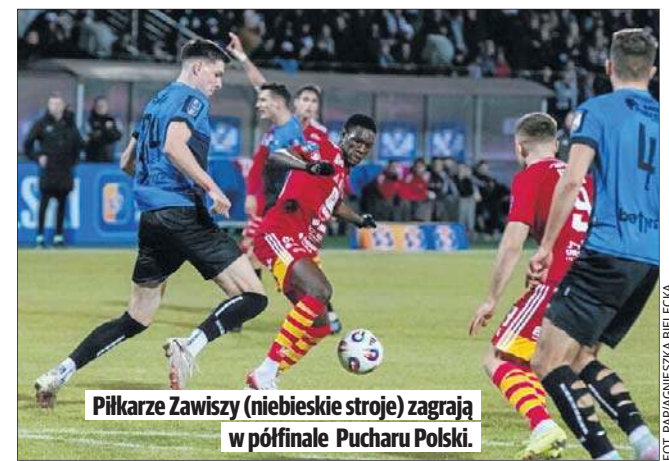
Piłkarze Zawiszy (niebieskie stroje) zagrają w półfinale Pucharu Polski.

Finał planowany jest na 2 maja na PGE Narodowym. Jego formalnym gospodarzem będzie zwycięzca pary Zawisza - Górnik.