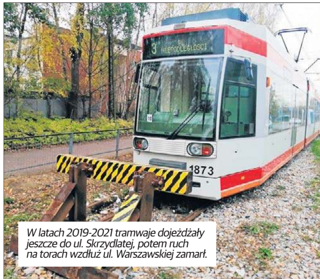
W latach 2019-2021 tramwaje dojeżdżały jeszcze do ul. Skrzydlatej, potem ruch na torach wzdłuż ul. Warszawskiej zamarł.