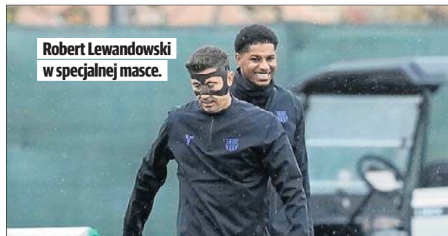
Robert Lewandowski w specjalnej masce.