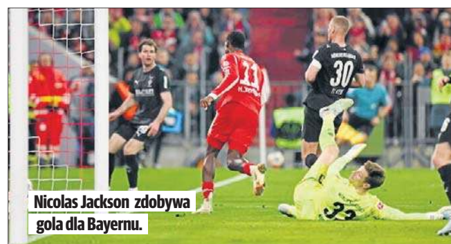
Nicolas Jackson zdobywa gola dla Bayernu.

Mistrzowie Niemiec efektywne zwycięstwo okupili jednak kontuzją Manuela Neuera. Doświadczony bramkarz doznał naderwania mięśnia łydki w lewej nodze i nie wystąpił we wtorkowym meczu Ligi Mistrzów z Atalantą w Bergamo.