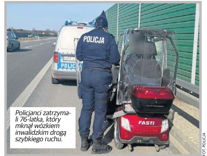
Policjanci zatrzymali 76-latka, który mknął wózkiem inwalidzkim drogą szybkiego ruchu.

- Z uwagi na realne zagrożenie dla życia i zdrowia seniora oraz innych uczestników ruchu postanowienie go na trasie było niemożliwe. Policjanci skontaktowali się z jego synem, który bardzo szybko dotarł na miejsce interwencji. Był zaskoczony i przyznał, że to pierwsze tego rodzaju zdarze-