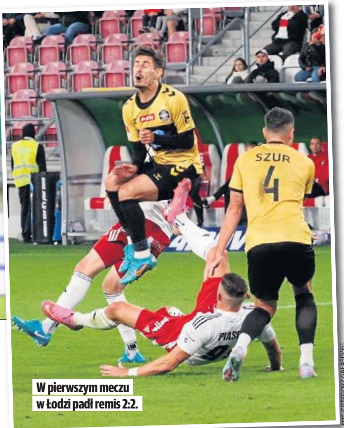
W pierwszym meczu w Łodzi padł remis 2:2.