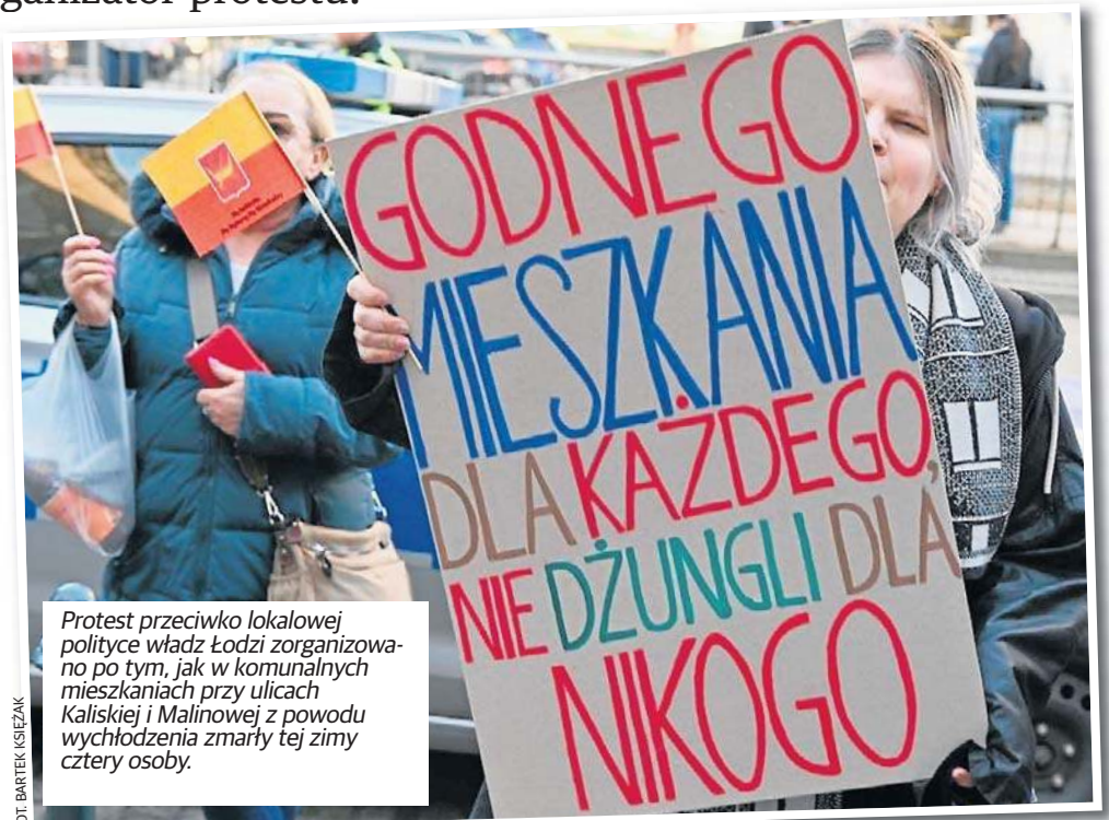
Protest przeciwko lokalowej polityce władz Łodzi zorganizowano po tym, jak w komunalnych mieszkaniach przy ulicach Kaliskiej i Malinowej z powodu wychłodzenia zmarły tej zimy cztery osoby.

W oświadczeniu Stowarzyszenia czytamy też, że władze miasta, zgodnie z przedstawionymi przed kilku dniami planami na następne 3 lata, zapowiedziały remonty 3,6 tys. lokali, 125 budynków i budowę 1,5 tys. nowych mieszkań. Sęk w tym, że podobne zapowiedzi miały już miejsce przed laty. W 2018 r. ogłoszono plany budowy 800 mieszkań komunalnych. „Z ogłoszonych wtedy mieszkań