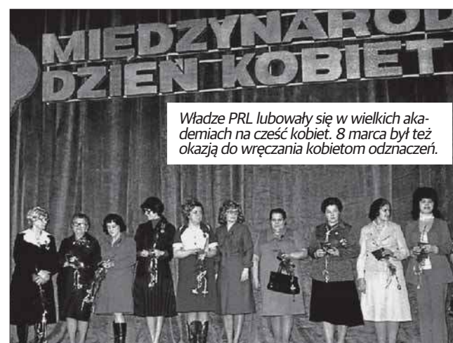
Władze PRL lubowały się w wielkich akademiach na cześć kobiet. 8 marca był też okazją do wręczania kobietom odznaczeń.