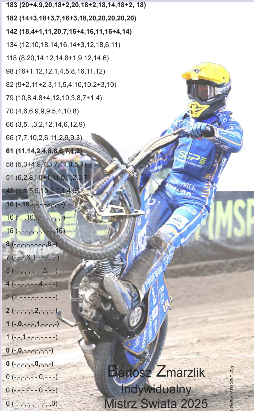
Bartosz Zmarzlik Indywidualny Mistrz Świata 2025