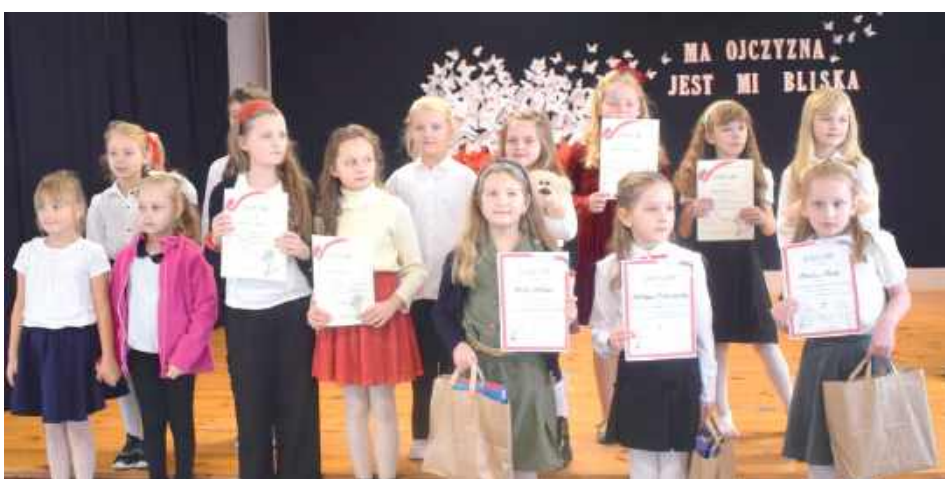
Uczestnicy koncertu w kategorii klas I - IV