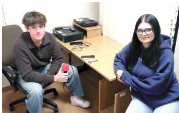
Dzięki stowarzyszeniu wyremontowano salę, w której działa radiowęzeł szkolny

nauczyciele, którzy dołączyli do stowarzyszenia. Współpracujemy z nauczycielami, wsłuchujemy się w potrzeby nauczycieli, a przede wszystkim uczniów.