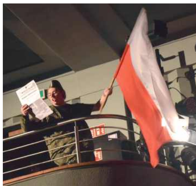
Niepodległa Młodych - proklamacja niepodległości