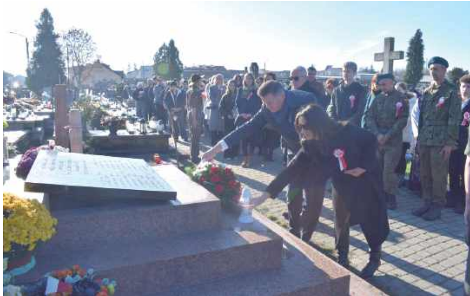
Delegacja miasta składa kwiaty pod pomnikiem legionistów I Brygady poległych w 1915 r.

Kolejnym miejscem, w którym uczczono bohaterów, była