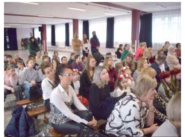
Publiczność podczas koncertu