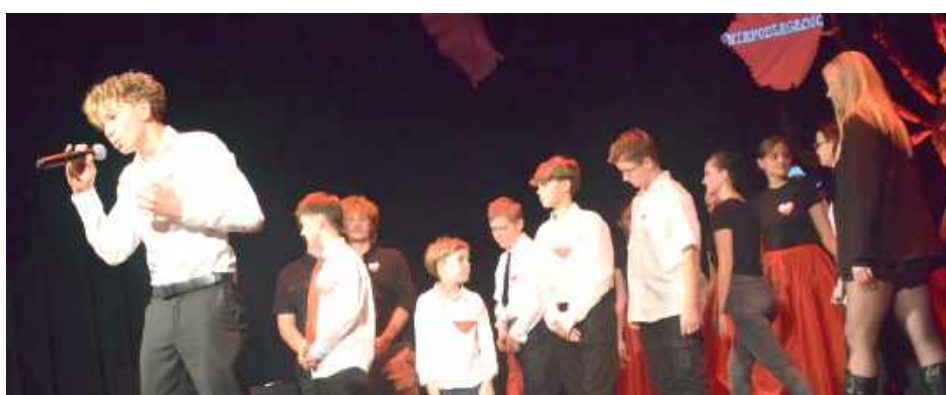
Finał - „Powróćisz tu” z repertuaru Ireny Santor

Niepodległa Młodych to tradycyjny tytuł koncertów organizowanych w PMDK w okolicach Święta Niepodległości. Koncert 6 listopada połączył wiele różnych gatunków muzycznych i literackich. Zabrzmią m.in. „Szara piechota” w wykonaniu gitarowym, utwory „Czerwonych Gitar” (piosenka „Płoną góry, płoną lasy”). Publiczność wysłuchała utworów zespołu „Lao Che”, piosenek z filmów i seriali historycznych („Bitwa warszawska” i „Czas honoru”). Były recytowane wiersze Władysława Broniewskiego i Krzysztofa Kamila Baczyńskiego. Koncert zakończył utwór „Powróćisz tu”, znany z repertuaru Ireny Santor. Śpiewali i recytowali wychowankowie pracowni muzycznych, teatralnych, artystycznych działających w PMDK.