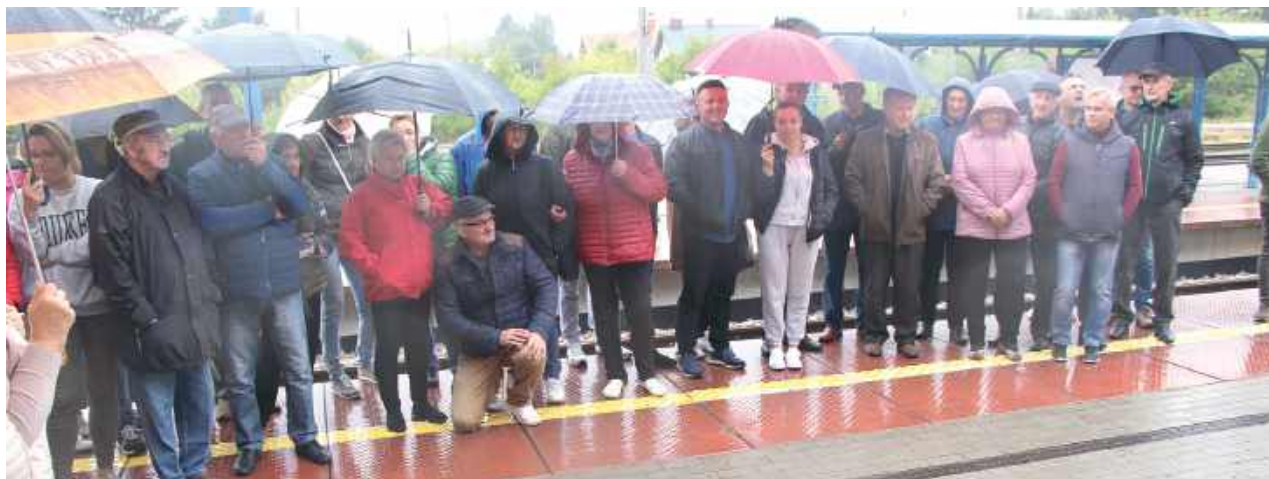
Od tego się zaczęło. Pierwszy protest przeciw lokalizacji zakładu w Annoborze, wrzesień 2022 r.

W końcu w czerwcu wójt wydał decyzję o odmowie wydania decyzji środowiskowej dla Steny. Według uzasadnienia lokalizacja zakładu Steny w planowanym miejscu jest sprzeczna z miejscowym planem zagospodarowania przestrzennego. Dla działek, na których ma powstać zakład firmy Stena Recycling sp. z o.o.,