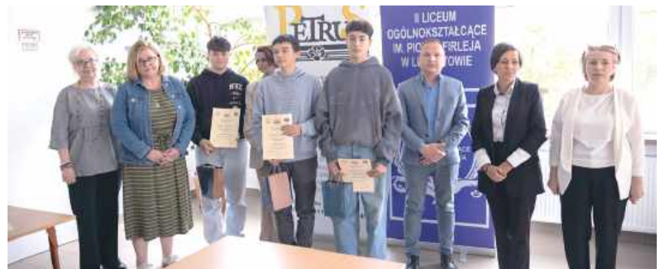
Członkowie stowarzyszenia, nauczyciele i uczniowie szkoły

były to nagrody w konkursach, tablice ogłoszeniowe, również dla samorządu uczniowskiego. Wybudowaliśmy radiowęzeł szkolny, którego nie było do tej pory. To był spory wydatek. Zakupiliśmy materiały do remontu sali, w której działa radiowęzeł. Finansowaliśmy dyskotekę szkolną, kupowaliśmy gadżety do wyposażenia szkoły. Wspieraliśmy uczniów - były stypendia dla uczniów. Wynajęliśmy salę LOK na spektakl „Portret kobiety”. Drukowaliśmy plakaty przy okazji spektakli, żeby wyjść z tym do lubartowian. Wyposażyliśmy szkołę w dystrybutor na wodę, który jest dostępny dla każdego ucznia. Zakupiliśmy leżaki, z których korzysta młodzież, gdy jest ciepło, są prowadzone też lekcje na dworze. Wyposażyliśmy jeden z korytarzy w kolorowe meble, żeby nie było w szkole szarości, ale żeby zrobiło się bardziej kolorowo. W ostatnim czasie pojawiły się w szkole ogromne, bardzo efektowne plakaty - to też był spory koszt. Kosztowne były spotkania uczniów i rodziców z terapeutą. Dużym kosztem były nagrody dla uczniów na zakończenie roku szkolnego. W każdej szkole Rada rodziców sponsoruje nagrody, ale to nagrody za średnią ocen. My chcieliśmy wyróżnić uczniów