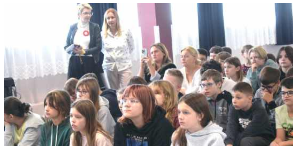
Uczniowie SP 3 podczas występów kolegów