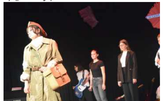
Do wojennych klimatów nawiązywała recytacja wiersza Krzysztofa Kamila Baczyńskiego