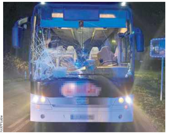
W Stoczku Łukowskim doszło do tragicznego wypadku drogowego, w wyniku którego 56-letni pieszzy zginął