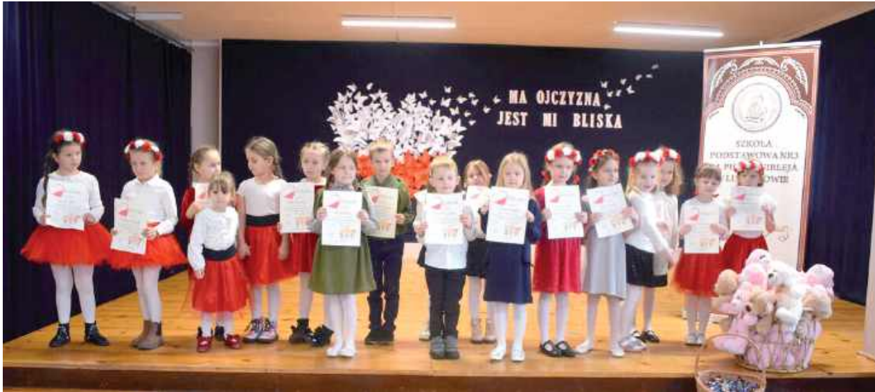
Uczestnicy koncertu z kategorii przedszkoli

Patriotyczne pieśni w Szkole Podstawowej nr 3 w Lubartowie