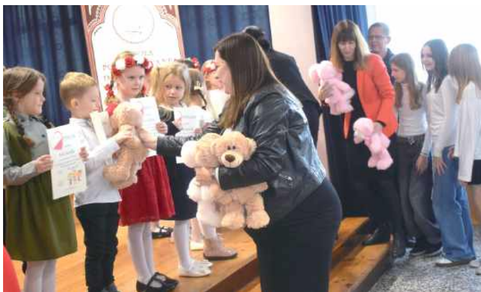
Misie dla uczestników koncertu