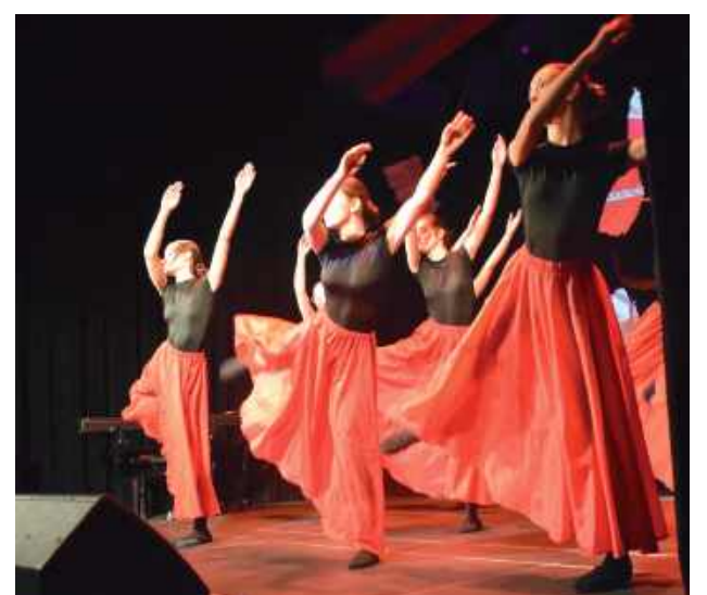
Występowała też grupa taneczna