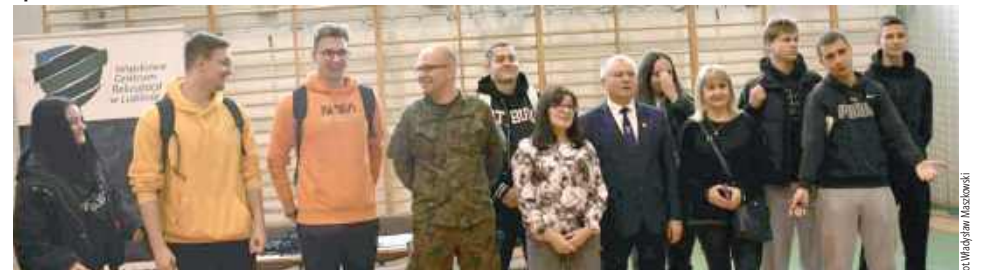
Pomysł utworzenia oddziału spotkał się z ciepłym przyjęciem