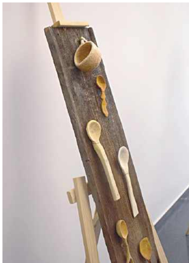
Fragment ekspozycji - podczas zajęć wykonano około 30 łyżek