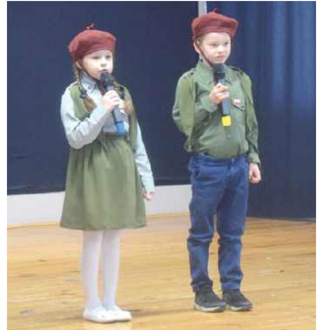
Wykonanie „Pieśni o Wodzu miłym” - piosenki o Józefie Piłsudskim