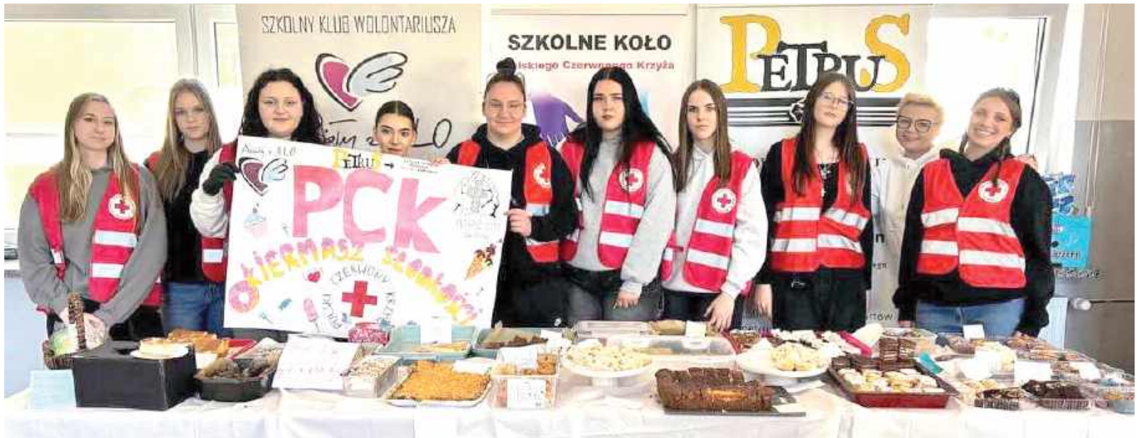
PETRUS wspiera działalność szkolnego koła PCK