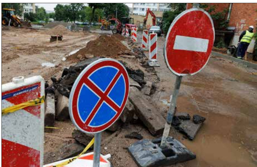
Remonty i zły stan nawierzchni latem zwiększają ryzyko uszkodzeń samochodu