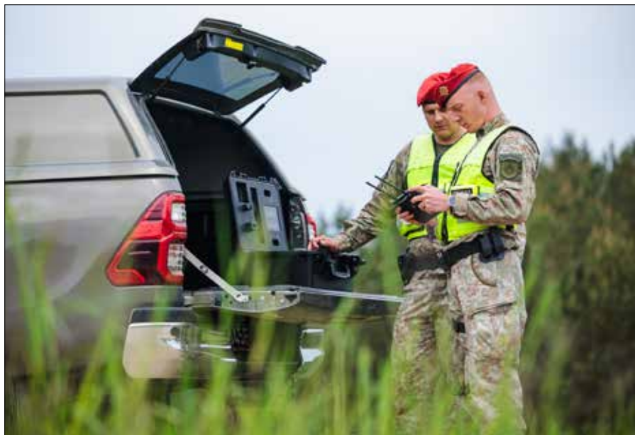
W ubiegłym tygodniu na części terytorium Litwy dwukrotnie ogłaszano alarm lotniczy

W ubiegłym tygodniu na części terytorium Litwy dwukrotnie ogłaszano alarm lotniczy z powodu dronów, które mogły wlecieć do kraju. Podobne komunikaty przez kilka dni z rzędu otrzymywali również mieszkańcy wschodniej Łotwy. ■