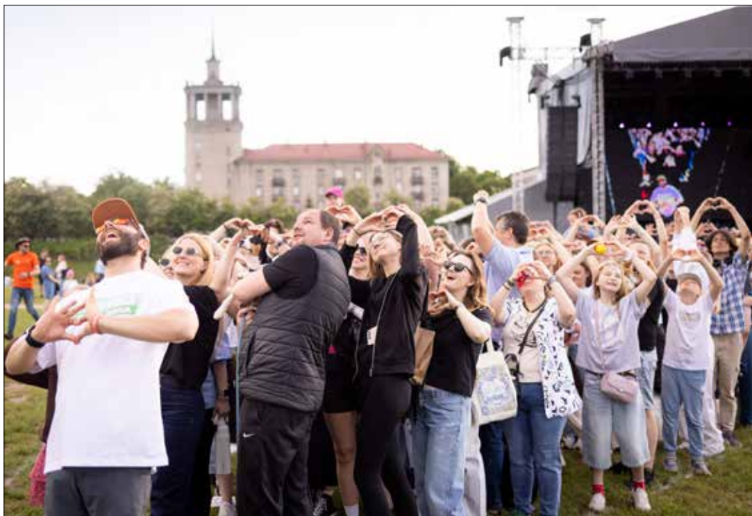
W sobotę w Wilnie nieopodal Białego mostu odbył się koncert z okazji Dni szczęśliwej młodzieży.