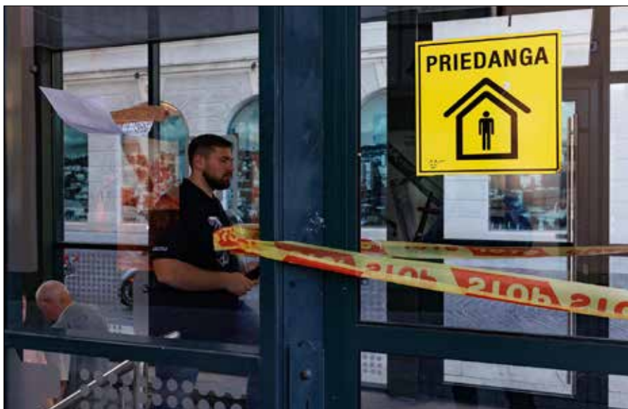
Każdy z nas powinien wcześniej się dowiedzieć, gdzie znajduje się najbliższe schronienie

Każdy z nas powinien wcześniej się dowiedzieć, gdzie znajduje się najbliższe schronienie lub miejsce, w którym można bezpiecznie się