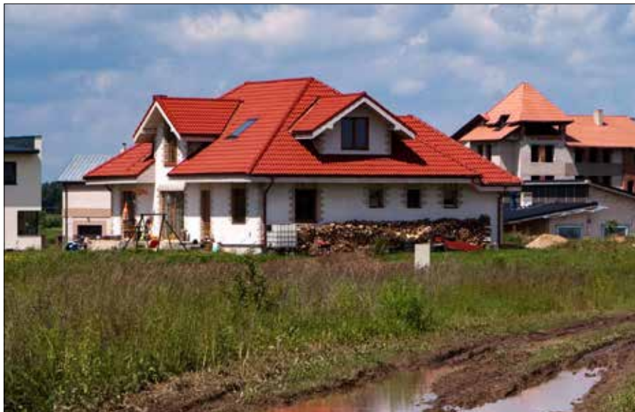
Coraz więcej mieszkańców musi mierzyć się z rosnącymi kosztami zakupu własnej nieruchomości.

W Kownie spadek był jeszcze większy – o 8 mkw. Mimo to możliwości zakupowe pozostają tam wyższe niż w stolicy i wynoszą nie-