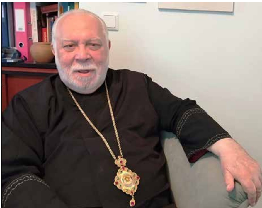
Abp Stefanos, metropolita Tallinna i całej Estonii, zwierzchnik Estońskiej Apostolskiej Cerkwi Prawosławnej podlegającej Patriarchatowi Konstantynopolitańskiemu

Pierwszy z nich to dawny Estoński Kościół Prawosławny Patriarchatu Moskiewskiego, który w 2025 r. zmienił nazwę na Estoński Chrześcijański Kościół Prawosławny. Sama zmiana nazwy miała znaczenie nie tylko symboliczne. Była próbą zdystansowania się od Moskwy w momencie, gdy Rosyjski Kościół Prawosławny jawnie wspiera agresję na Ukrainę i wpisuje się w narrację imperialną Kremla. Proces ten nie jest jednak prosty ani szybki. Odcinanie się od Moskwy odbywa się równoległe na kilku poziomach: prawnym, kanonicznym i mentalnym. Kluczowym momentem był Drugi Sobór Cerkwi, który odbył się 20 sierpnia 2024 r. w Tallinie. Przyjęto wówczas nowy statut, usuwający wszelkie bezpośrednie odniesienia do Patriarchatu Moskiewskiego i podkreślający niezależność Kościoła w sprawach nauczania. Paradoksalnie, argumentem na rzecz uniezależnienia stał się... tomos z 1993 r., wydany przez patriarchę moskiewskiego Aleksiego II, przyznający estońskiej cerkwi autonomię. Dziś dokument ten wykorzystywany jest jako narzędzie emancypacji spod wpływów, które sam niegdyś legitymizował.