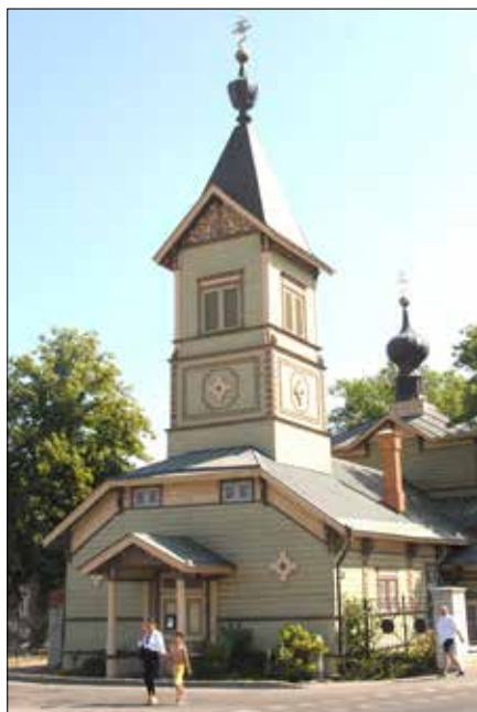
Tallin, cerkiew św. Mikołaja w dzielnicy Kopli w północnym Tallinnie

— Nie interesuje nas polityka. Interesuje nas praca duchowa. Jakość życia chrześcijańskiego jest ważniejsza niż liczby — dodaje hierarcha.