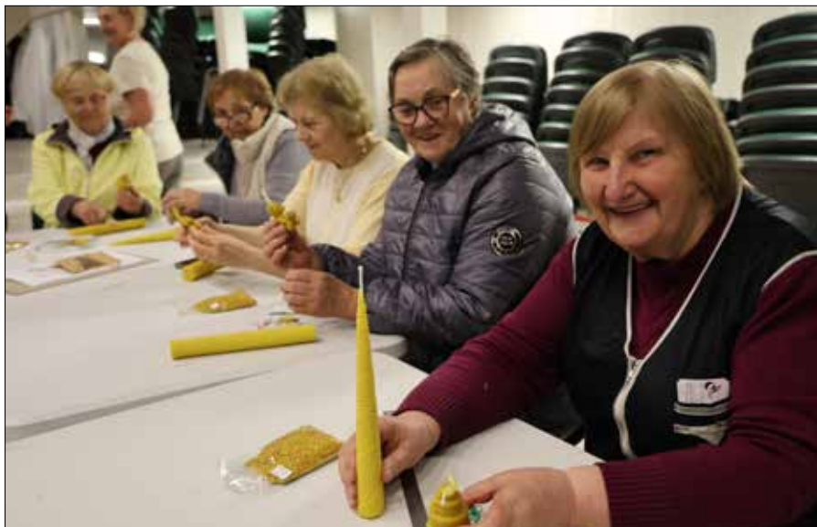
■ Tego dnia w RKC odbyły się warsztaty świecowe dla dzieci oraz dla seniorów

Tego dnia odbyły się warsztaty świecowe dla dzieci oraz dla seniorów. Uczestnicy warsztatów mieli okazję zanurzyć się w magiczny świat świec, gdzie zapachy i światło łączą się w harmonijną całość. Poznali tradycyjne metody rzemiosła, które od wieków towarzyszą ludzkości. Uczestnicy mogli stworzyć własne unikalne dzieło, które będzie wdzięcznym i naturalnym