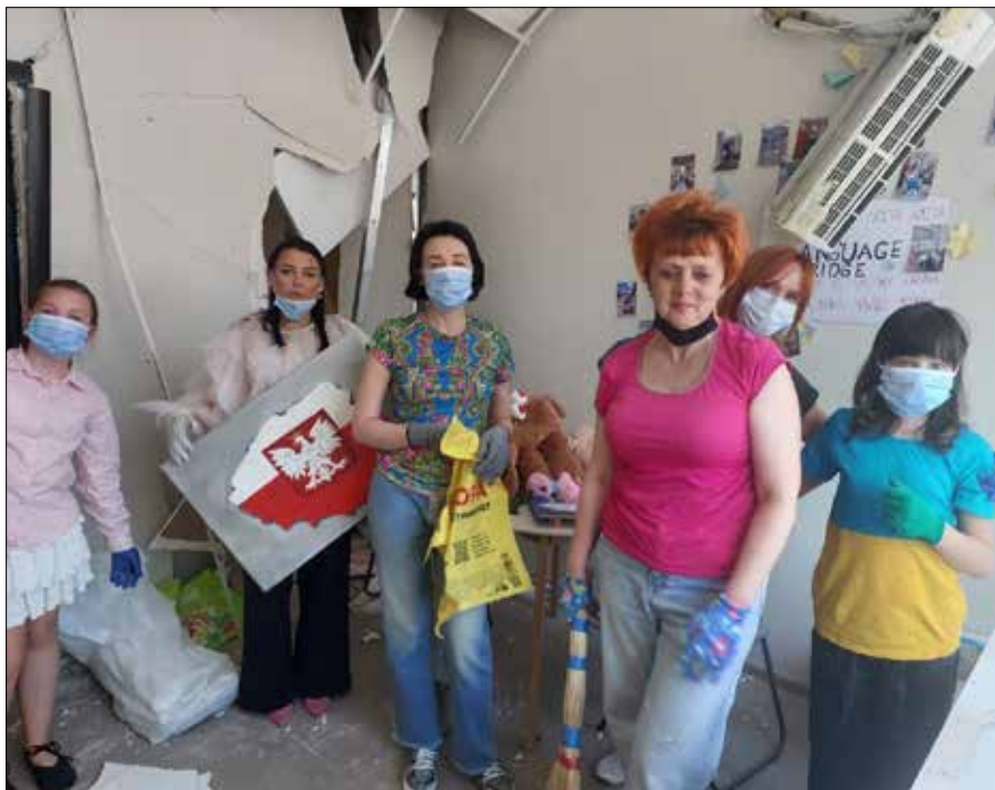
Zniszczone pomieszczenia organizacji Language Bridge, zajmującej się upowszechnianiem języka polskiego