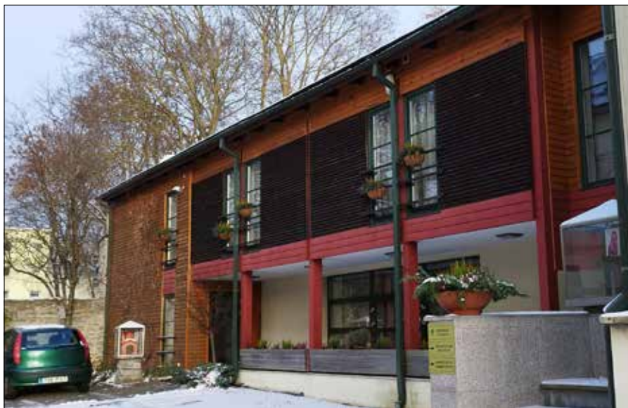
Tallin, Wismari 32, siedziba metropolity Tallinna i całej Estonii

W kraju, który uchodzi za jeden z najbardziej zsekularyzowanych w Europie, cerkiew musi pracować niemal od podstaw: bez religii w szkołach, bez masowego przekazu wiary, opierając się na katechezie parafialnej i osobistym świadectwie.