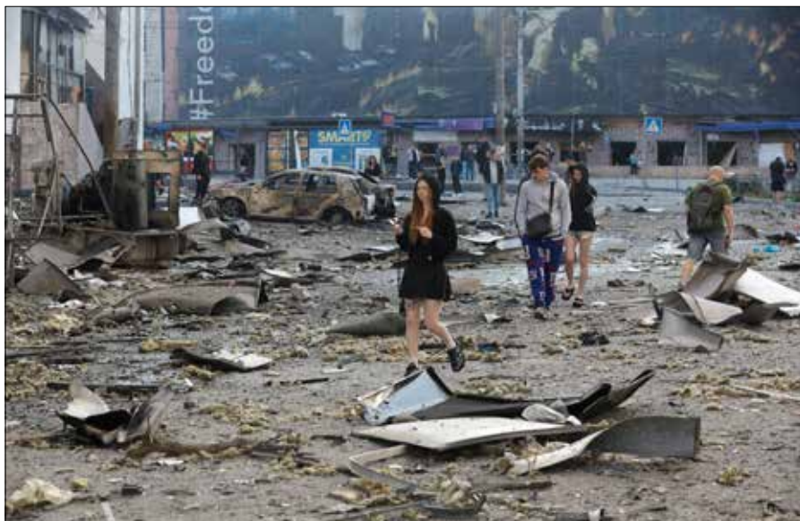
Mieszkańcy Kijowa próbują wracać do codzienności mimo ogromnych zniszczeń

— Zniszczenia objęły również inne ważne instytucje kultury, w tym kilka teatrów oraz muzeów, a także Muzeum Sztuki znajdujące się w centrum Kijowa, które również ucierpiało w wyniku ostrzału. Tego rodzaju uderzenia nie są wymierzone w cele militarne, lecz w ludność cywilną oraz w przestrzeń kultury. Podkreślone jest, że działania te mogą być interpretowane jako próba osłabienia i niszczenia tożsamości Ukrainy oraz jej mieszkańców. W tym ujęciu kultura, sztuka i dziedzictwo narodowe stają się jednym z celów presji i destrukcji, co ma prowadzić nie tylko do fizycznych strat, ale także do osłabienia więzi społecznych oraz poczucia ciągłości historycznej społeczeństwa. Szczególnie poważnie ucierpiało Muzeum Czarnobyła, które zostało zniszczone lub uszkodzone w ok. 40 proc. Ma to wymiar symboliczny, ponieważ niedawno obchodzono rocznicę 40 lat od katastrofy w Czarnobyli. Uszkodzenia obiektu uznawane są za wyjątkowo dotkliwe dla ukraińskiego dziedzictwa pamięci — podkreśla rozmówca.