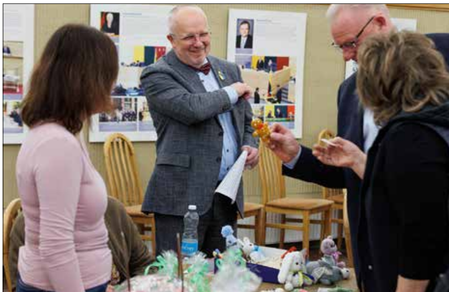
■ Inicjatorem wydarzenia był przewodniczący litewskiego parlamentu Juozas Olekas

— Zapoznałem wysokiego komisarza z podstawowymi, istotnymi dla polskiej mniejszości narodowej kwestiami — sprawami oświaty, praw mniejszości narodowych oraz polityką regionalną. Poruszyłem również ważną kwestię obniżenia progu wyborczego dla partii politycznych reprezentujących mniejszości narodowe. Uważamy, że w wyborach parlamentarnych próg wyborczy w kraju nie powinien wynosić 5 proc. dla partii i 7 proc. dla koalicji, lecz powinien być niższy. Zasadne jest ujednoczenie progów wyborczych w wyborach samorządowych, parlamentarnych oraz do Parlamentu Europejskiego. Poprawka AWPL-ZChR dotycząca obniżenia progu wyborczego nie odnosi się wyłącznie do mniejszości narodowych. Proponujemy, aby we wszystkich tych wyborach próg wyborczy wynosił 4 proc. dla partii oraz 6 proc. dla koalicji, natomiast dla partii politycznych reprezentujących mniejszości