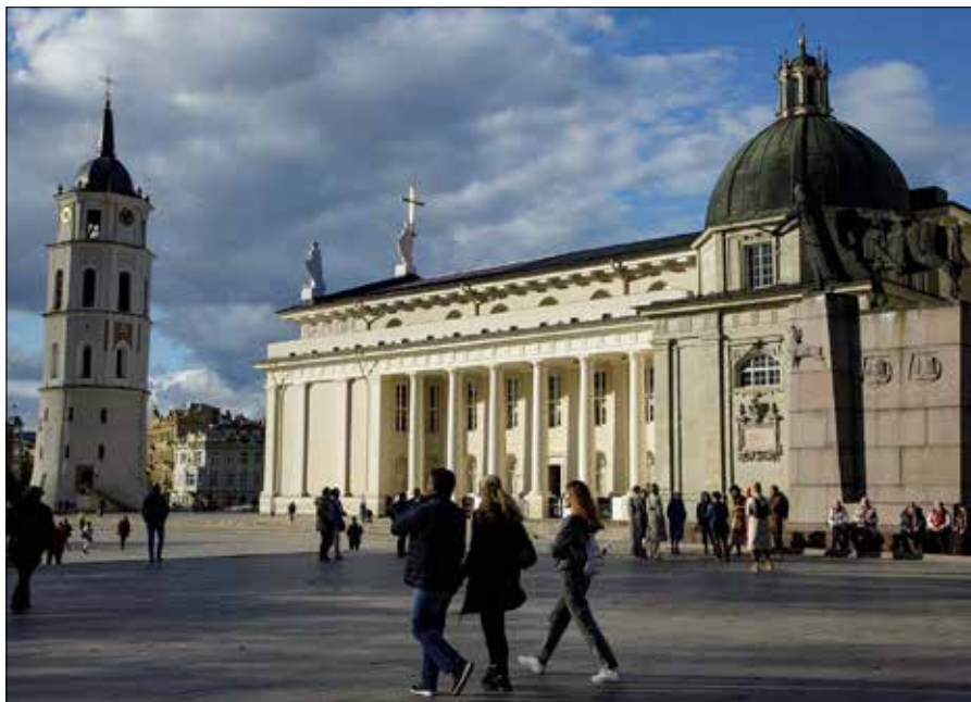
■ Katedra wileńska jest miejscem pochówku znacznej części historycznej elity Litwy