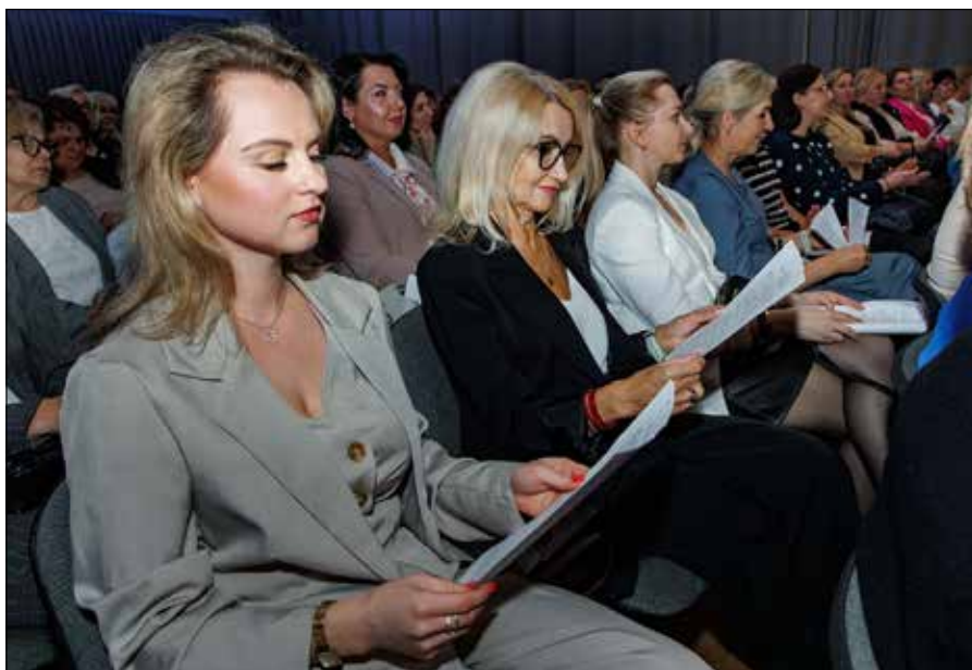
Podczas wydarzenia przyjęto uchwałę, w której podkreślono, że konferencja skupiła się na systemowych, prawnych i strukturalnych problemach polskiego szkolnictwa na Wileńszczyźnie