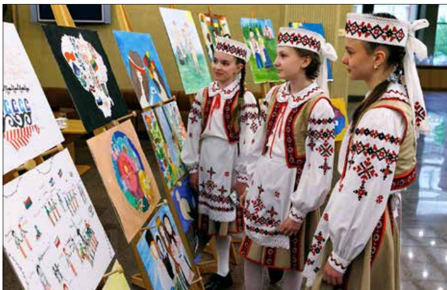
■ W gmachu Sejmu odbył się kiermasz i wystawa prac uczniów różnych wspólnot narodowych

narodowe — 3 proc. — powiedział „Kurierowi Wileńskiem” Jarosław Narkiewicz. Polityk zaznaczył, że za partię mniejszości narodowych należy uważać takie ugrupowanie polityczne, w którym 75 proc. członków stanowią obywatele Litwy będący przedstawicielami mniejszości narodowych.