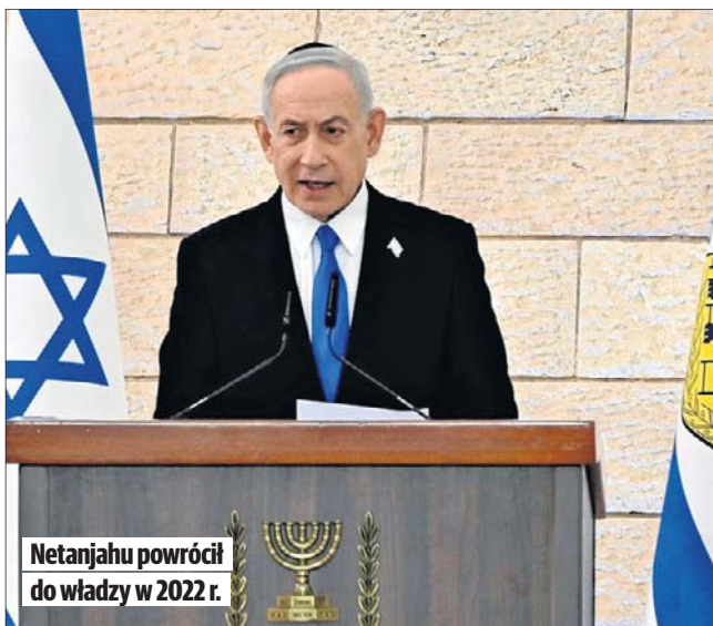
Netanjahu powrócił do władzy w 2022 r.

Do głosowania doszło po tym, gdy partia Zjednoczony Judaizm Tory, reprezentująca ultraortodoksyjnych żydów i tradycyjny sojusznik Netanjahu, zapowiedziała w ubiegłym tygodniu, że wraz z opozycją będzie dążyć do przedterminowych wyborów. Liderzy ugrupowania oświadczyli, że zdecydowali się na ten krok, ponieważ koalicja