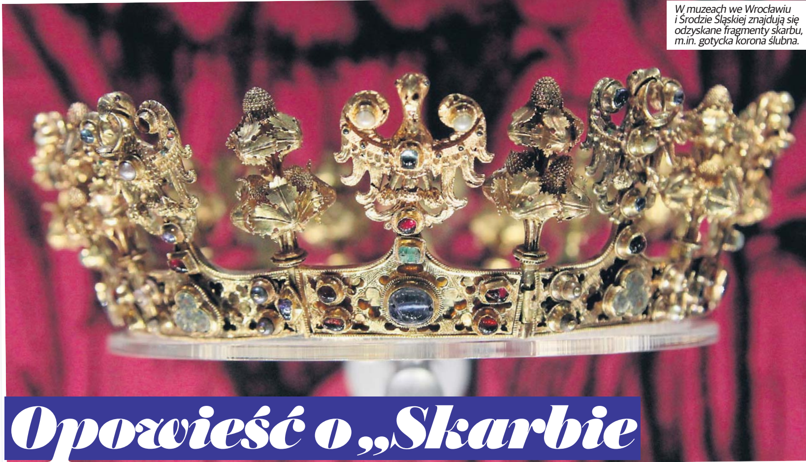
W muzeach we Wrocławiu i Środzie Śląskiej znajdują się odzyskane fragmenty skarbu, m.in. gotycka korona ślubna.