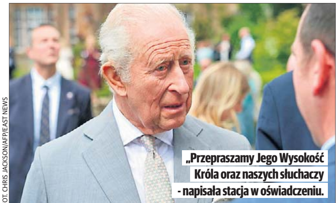
„Przepraszamy Jego Wysokość Króla oraz naszych słuchaczy - napisała stacja w oświadczeniu.

- Będę pierwszym ministrem całej Szkocji - zapewnił Swinney po tym, gdy posłowie szkockiego parlamentu ponownie wybrali go na szefa rządu. Nawiązał w ten sposób do podziałów w społeczeństwie w kwestii oddzielenia się Szkocji od Zjednoczonego Królestwa. Podkreślił jednak, że nie zrezygnuje z dążenia do tego celu.