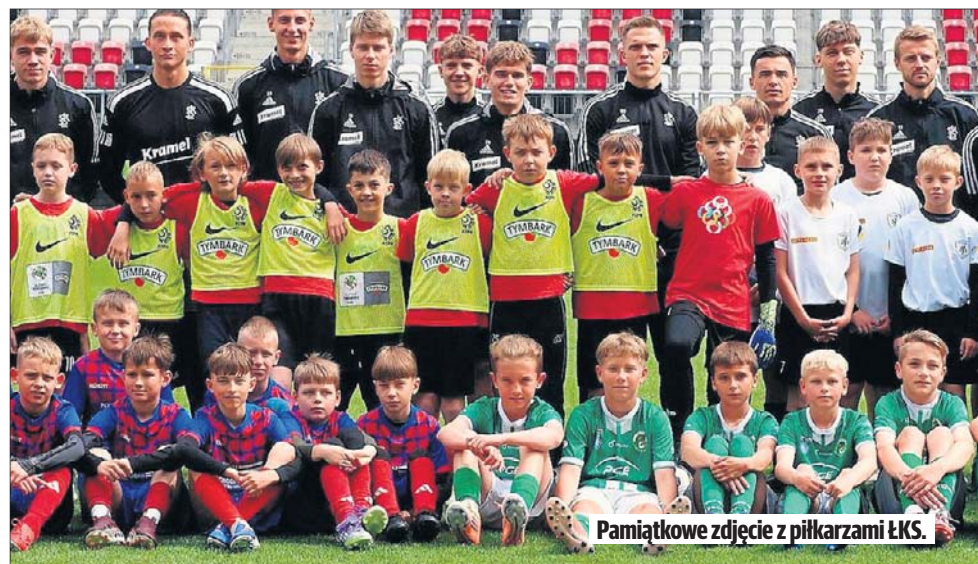
Pamiątkowe zdjęcie z piłkarzami ŁKS.

Tegoroczni zwycięzcy: SP 198 Łódź (U-8 chłopcy), SP Buczek (U-8 dziewczynki), TCT SP 162 Łódź (U-10 chłopcy), SP Domaniewice (U-10 dziewczynki), Szkoła Gortata Łódź (U-12