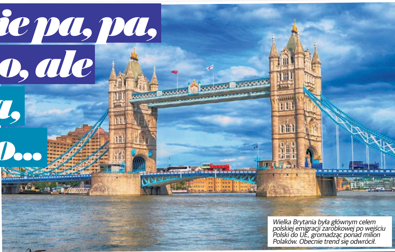
Wielka Brytania była głównym celem polskiej emigracji zarobkowej po wejściu Polski do UE, gromadząc ponad milion Polaków. Obecnie trend się odwrócił.