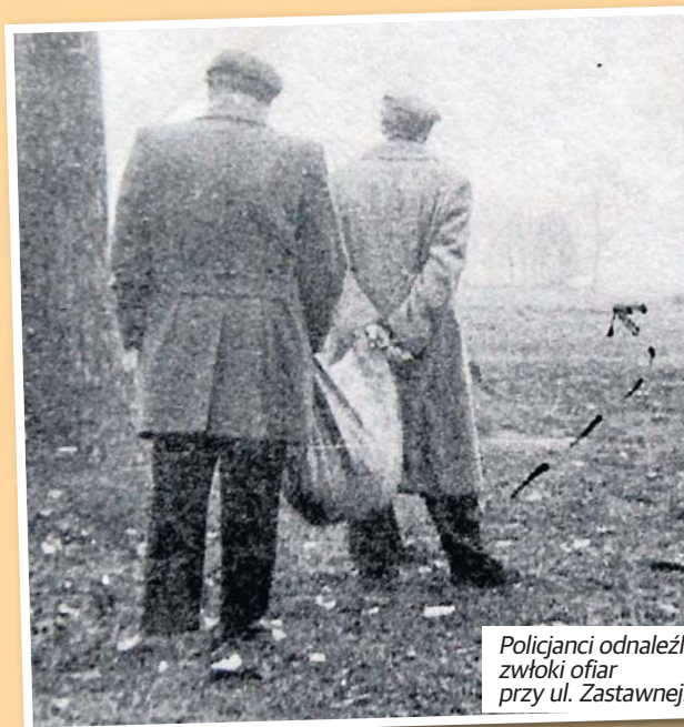
Policjanci odnaleźli zwłoki ofiar przy ul. Zastawnej.