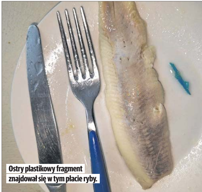
Ostry plastikowy fragment znajdował się w tym płacie ryby.