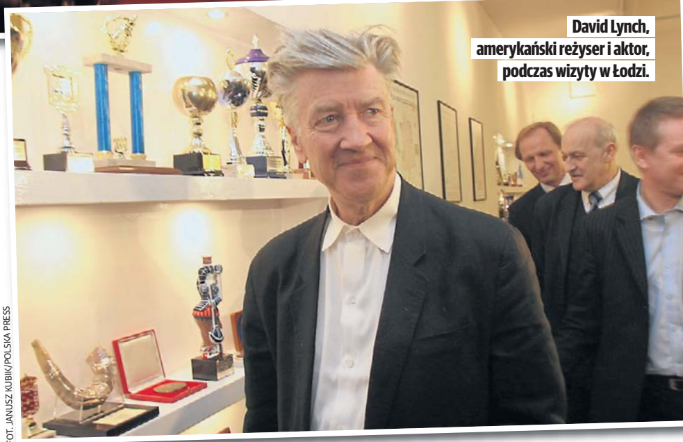
David Lynch, amerykański reżyser i aktor, podczas wizyty w Łodzi.