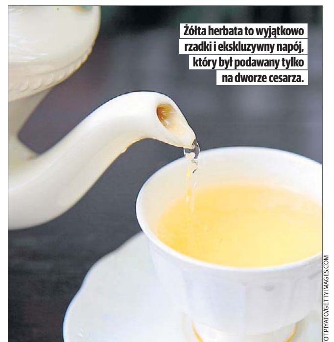
Żółta herbata to wyjątkowo rzadki i ekskluzywny napój, który był podawany tylko na dworze cesarza.