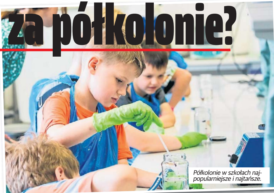
Półkolonie w szkołach najpopularniejsze i najtańsze.