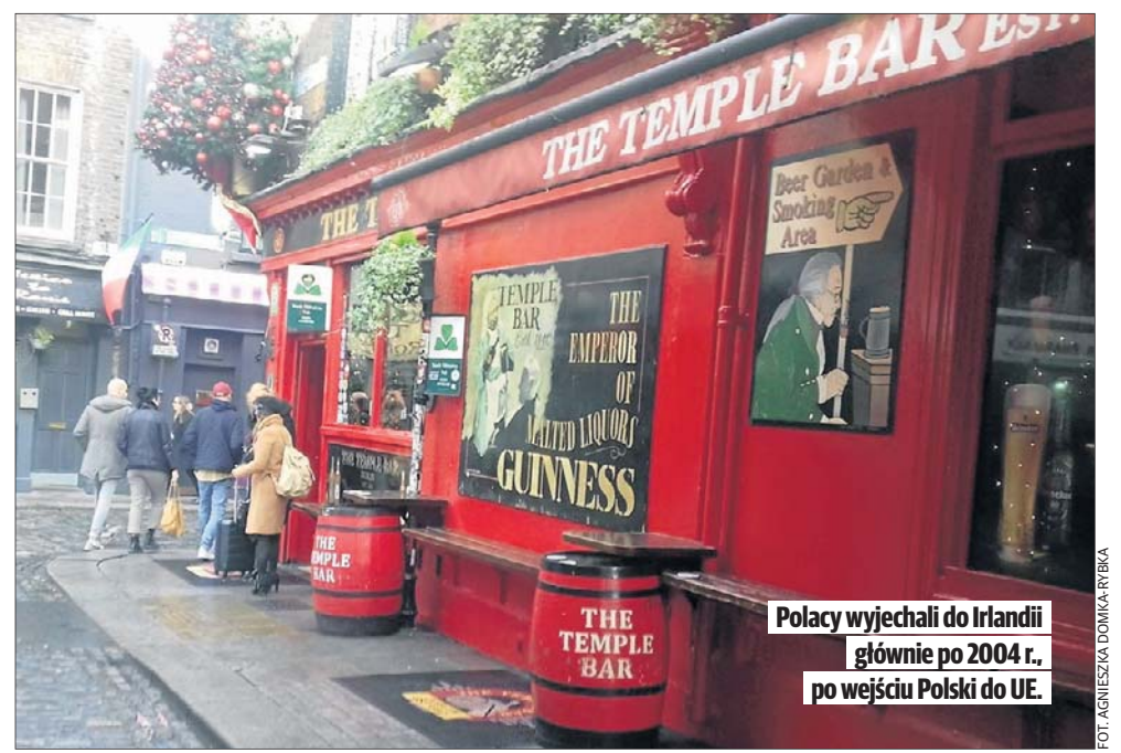
Polacy wyjechali do Irlandii głównie po 2004 r., po wejściu Polski do UE.