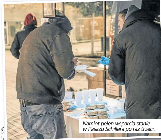
Namiot pełen wsparcia stanie w Pasażu Schillera po raz trzeci.