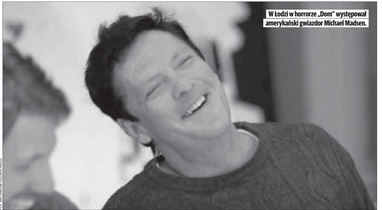
W Łodzi w horrorze „Dom” występował amerykański gwiazdor Michael Madsen.

W 2015 roku w Łodzi realizowane były zdjęcia do amerykańskiej produkcji „Znajdę cię”, w reżyserii Marthy Coolidge. Akcja tej opowieści o miłości między śpiewakiem operowym, katolikiem Robertem (w tej roli Leo Suter) a żydowską skrzypaczką (Adelaide Clemens) rozgrywa się w okresie II wojny światowej. W obsadzie znaleźli się też: Stellan Skarsgård, Connie Nielsen, Stephen Dorff oraz Małgorzata Kożuchowska, Mirosław Zbrojewicz, Weronika Rosati i Jacek Braciak. Ekipe filmową można było spotkać na Księżym Młynie oraz w lokacjach przy ulicach Piotrkowskiej, 1 Maja, Młynarskiej, Wojska Polskiego, a także w okolicach Manufaktury, w Pałacu Poznańskim i parku Reymonta.