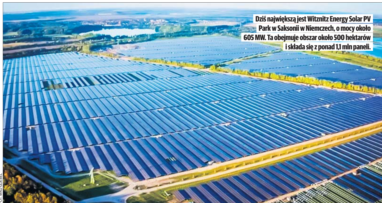
Dziś największą jest Witznitz Energy Solar PV Park w Saksonii w Niemczech, o mocy około 605 MW. Ta obejmuje obszar około 500 hektarów i składa się z ponad 1,1 mln paneli.

To będzie największa w Europie farma fotowoltaiczna, którą zbuduje belgijska firma Virya Energy. Obiekt ma się składać z trzech elementów: farmy Sidłowo o mocy 290 MW i powierzchni 266 hektarów z 414 tysiącami modułów fotowoltaicznych; farmy Kikowo o mocy 235 MW, powierzchni 231 hektarów z zainstalowanymi 335 tysiącami paneli; farmy Dobrowo - 190 ha, 197 MW i 281 tysięcy paneli. Łącznie powstanie więc rzeczywiście największa w tej chwili farma w Europie o powierzchni prawie 700 hektarów i mocy 722 MW. Dziś największą jest Witznitz Energy Solar PV Park w Saksonii w Niemczech, o mocy około 605 MW. Ta obejmuje obszar około 500 hektarów i składa się z ponad 1,1 mln paneli. Farma podkoszalińska - umiejscowio-