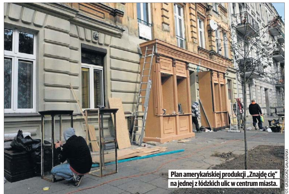
Plan amerykańskiej produkcji „Znajdę cię” na jednej z łódzkich ulic w centrum miasta.