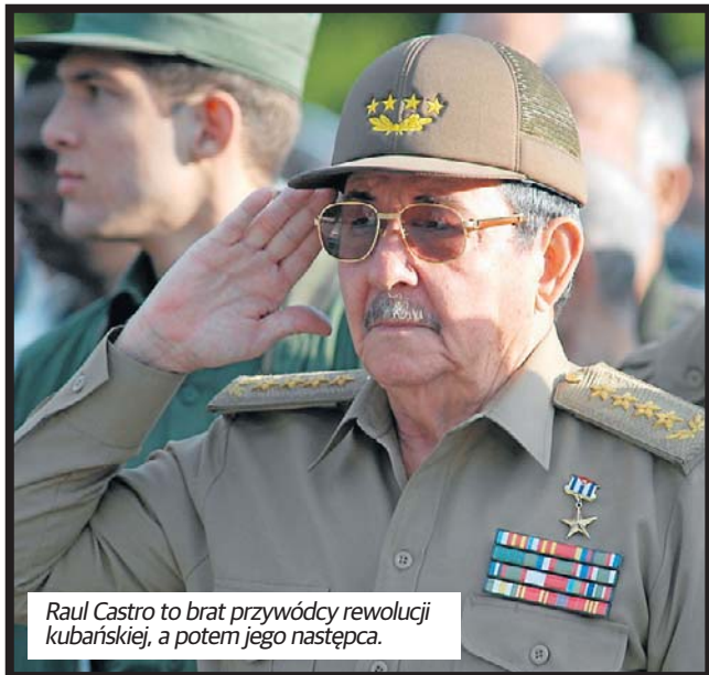
Raul Castro to brat przywódcy rewolucji kubańskiej, a potem jego następcą.

Przedstawiciel Departamentu Sprawiedliwości USA powiedział w zeszłym tygodniu agencji Reuters, że prze-