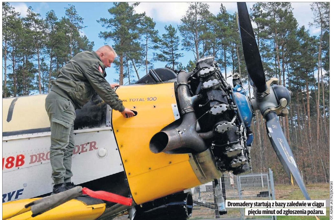
Dromadery startują z bazy zaledwie w ciągu pięciu minut od zgłoszenia pożaru.