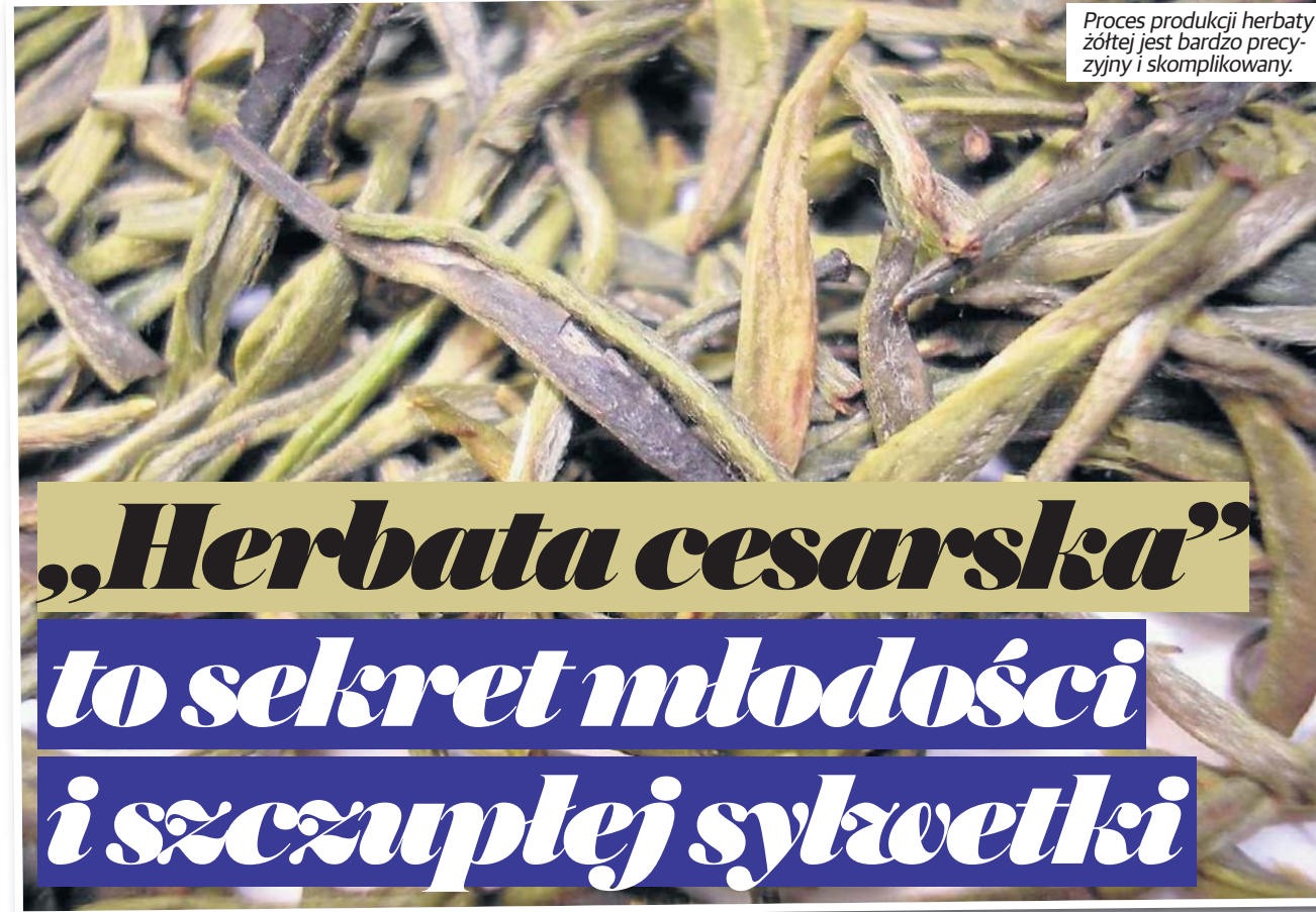
Proces produkcji herbaty żółtej jest bardzo precyzyjny i skomplikowany.

To prawdziwy klejnot w świecie herbat, ceniona za swój subtelny, złożony smak i delikatny aromat. Ma delikatny, łagodny i aksamienny smak. Wyczuwalne są naturalne nuty słodczy, czasem przypominające miód, karmel, orzechy, a nawet ziarna kukurydzy. W żółtej herbacie można wyczuć także nutę umami - głębo-