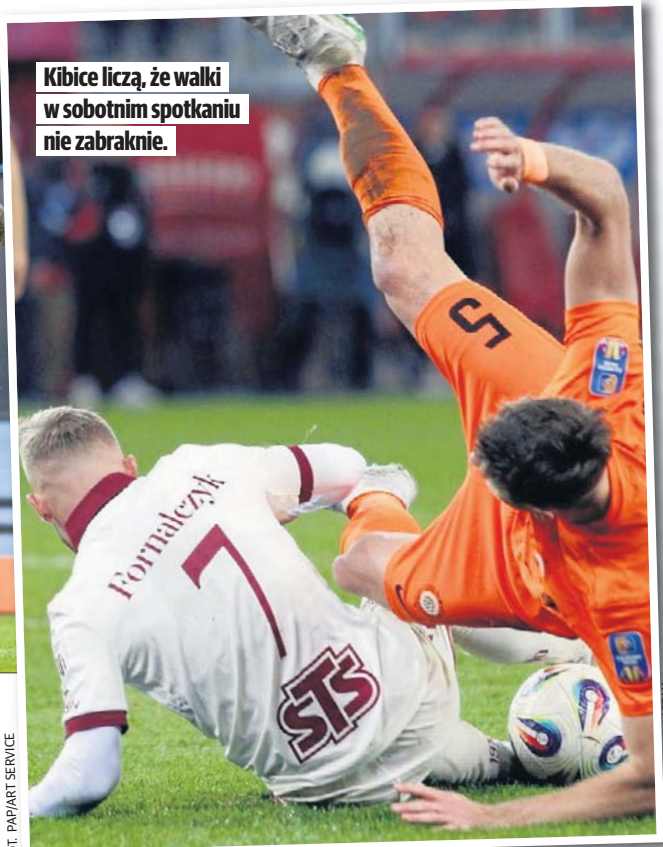
Kibice liczą, że walki w sobotnim spotkaniu nie zabraknie.