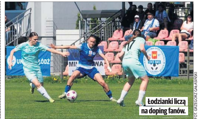
Łodzianki liczą na doping fanów.

by dać sobie szansę na barażowe mecze, muszą wygrać i wówczas nie będą musieli się oglądać w wyniki rywali, którym także marzy się podjęcie walki o awans do elity. A za plecami ełkaesiaków są: siódma Polonia Warszawa (50), ósma Puszca Niepołomice (49) i dziewiąta Miedź Legnica (49).