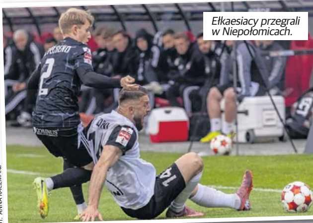
Ełkaesiacy przegrali w Niepołomicach.