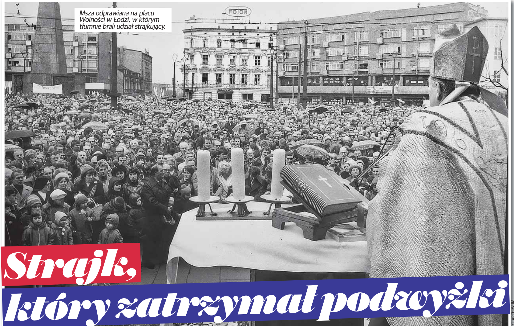
Msza odprawiana na placu Wolności w Łodzi, w którym tłumnie brali udział strajkujący.

Łódzcy włókniarze pracowali też w ciężkich warunkach. Tylko w 85 procentach fabryk w Łodzi były szatnie. Natryski znajdowały się w co drugim zakładzie, a jadalnie w co piątym... Robotnicy pracowali też