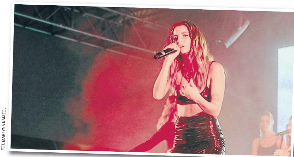
FOT. MARTYNA KAMZOL