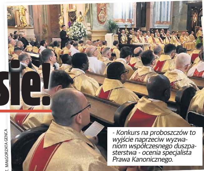
- Konkurs na proboszczów to wyjście naprzeciw wyzwaniom współczesnego duszpasterstwa - ocenia specjalista Prawa Kanonicznego.

Proboszczów 16 parafii w drodze konkursu poszukuje archidiecezja lubelska. Kandydat musi mieć 15 lat kapłańskiego stażu, przedstawić program duszpasterski i swoje osiągnięcia.