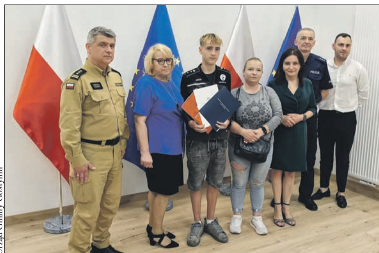
Urząd Gminy Gostynin