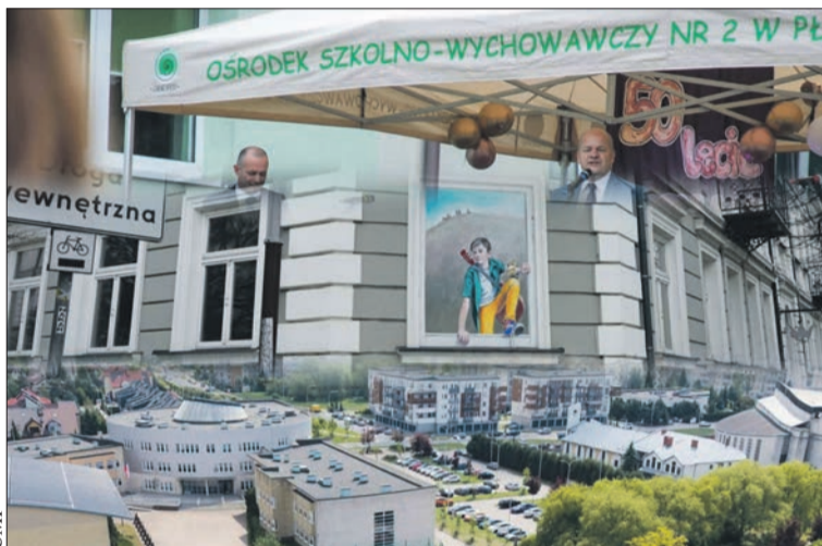
Poznaliśmy pierwsze wyniki konkursów na dyrektorów

Wydarzenie odbywa się pod patronatem miasta Płocka oraz przy wsparciu partnera wydarzenia – Samorządu Województwa Mazowieckiego. (kb)