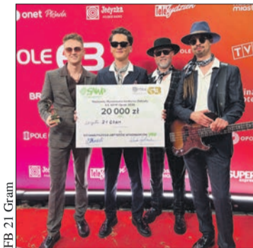
Członkowie zespołu 21 Gram z nagrodą

Zespół 21 Gram wykonuje utwory z pogranicza popu, rocka, soulu i funku. Muzycy poznali się podczas studiów