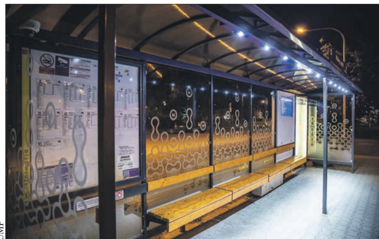
Jedna z płockich wiat przystankowych