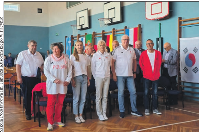
Olimpijczycy podczas Dnia Sportu w Szkole Podstawowej w Pacynie

Ważnym momentem uroczystości było także wręczenie Brązowych Medalów „Za Zasługi dla Polskiego Ruchu Olimpijskiego”, przyznanych przez Polski