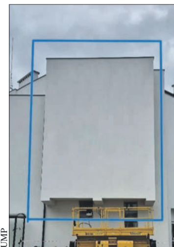
Ściana na dziedzińcu UMP, na której rozważane jest umieszczenie muralu

Przed wszystkim tematyka muralu ma „nawiązywać do charakteru miasta, w szczególności walorów przyrodni-