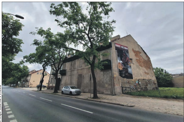
Urząd miasta Płocka

Prace będą możliwe dzięki pozyskaniu przez Inwestycje Miejskie dofinansowania z Banku Gospodarstwa Krajowego na poziomie 85 proc. wartości przeprowadzonych prac. Co istotne, przetarg wyłaniający wykonawcę miejska spółka ogłosi w ciągu kilku najbliższych tygodni. Po jego rozstrzygnięciu będzie znany ostateczny koszt inwestycji, który może przekroczyć 10 mln zł. (kb)