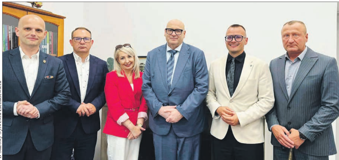
Samorządowcy z powiatu płockiego spotkali się w Warszawie z przedstawicielami rządu i parlamentu