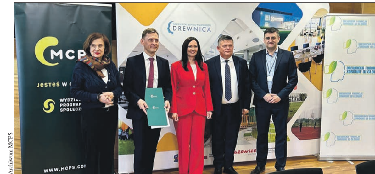
Samorząd Mazowsza wspiera tworzenie placówek opiekuńczych dla seniorów z chorobami otępiennymi

Od początku model tych placówek zakładał korzystanie z nich przez osoby we wstępnym stadium chorób, aby było możliwe oddziaływanie na zmiany neurodegradacyjne. Dotychczas