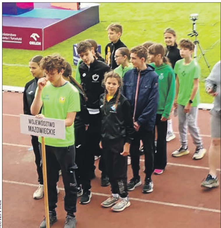
Płocczanie w barwach województwa mazowieckiego