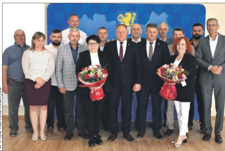
Podczas majowej sesji radni udzieliли wójtowi absolutorium i wotum zaufania

Ponad 217 tys. zł na rozwój i wsparcie uczniów