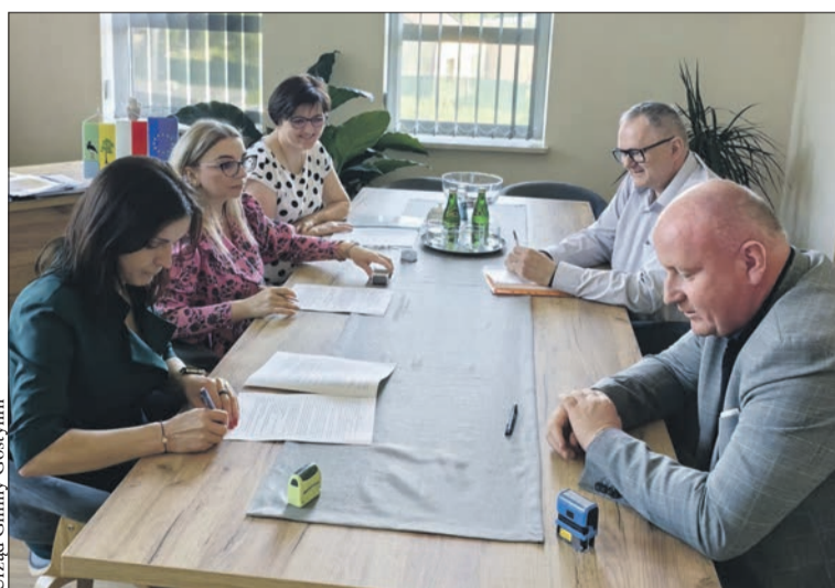
Umowa na przebudowę drogi gminnej w Ruszkowie została podpisana

Gmina Gostynin podpisała umowę na przebudowę drogi