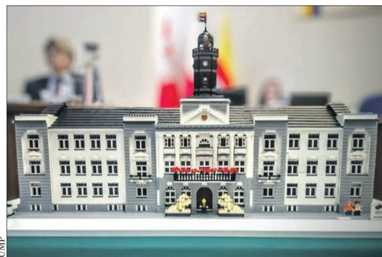
Makieta płockiego ratusza wykonana z klocków

Lubicie klocki LEGO? Tworzyliście z nich wszystko, co tylko podpowiedziało wam wyobraźnia, albo szukacie nowych wyzwań i inspiracji? Już 13 czerwca w siedzibie Płockiego Ośrodka Kultury i Sztuki przy ul. Jakubowskiego zostanie przygotowane coś specjalnego dla fanów kreatywnej rozrywki.