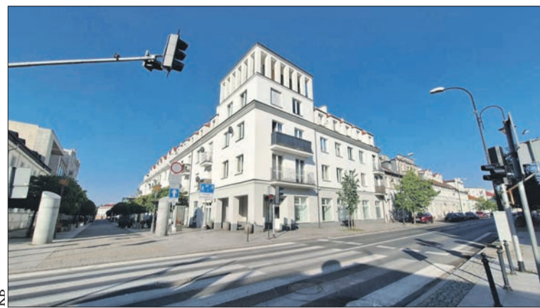
Trwają poszukiwania najemcy na lokal przy ul. Tumskiej 5

Modernizacja infrastruktury przystankowej w Płocku