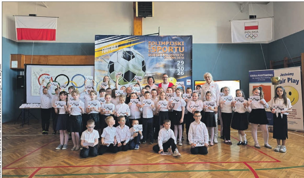
Zaproszeni goście pozowali do zdjęć z uczniami

29 maja w Szkole Podstawowej im. Janusza Kusocińskiego w Pacynie odbył się Olimpijski Dzień Sportu Dzieci i Młodzieży 2026. W wydarzeniu wzięli udział uczniowie kilku szkół noszących imię Polskich Olimpijczyków oraz zaproszeni goście, w tym medaliści olimpijscy, przedstawiciele samorządów i Polskiego Komitetu Olimpijskiego.