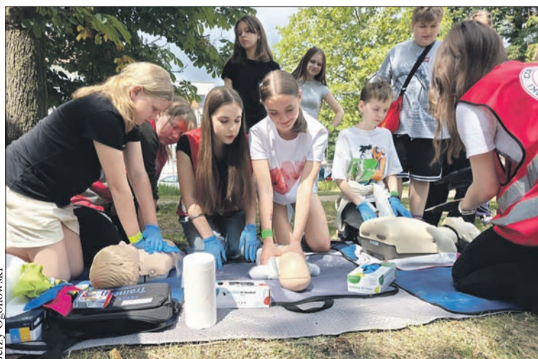
Uczniowie podczas warsztatów z zakresu pierwszej pomocy