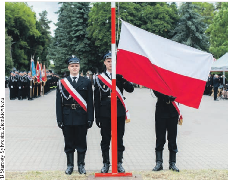
OSP Słupno świętowało 70 lat działalności, 20-lecie Młodzieżowej Drużyny Pożarniczej i Gminny Dzień Strażaka

Gminny Dzień Strażaka był także okazją do przypomnienia dorobku całego środowiska strażackiego w gminie Słupno. Na jej terenie działają trzy jednostki z ponad stu-