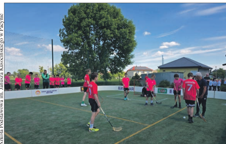
Uczniowie zmierzali się w turniejach unihokeja oraz piłki nożnej dziewcząt i chłopców