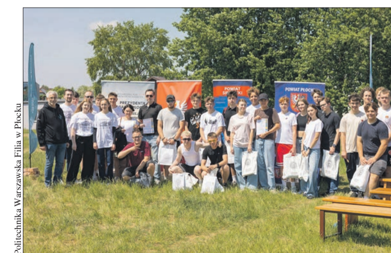
Uczestnicy II edycji Konkursu Konstruktorów Machin Miotających „PACYFIKATOR 2026”