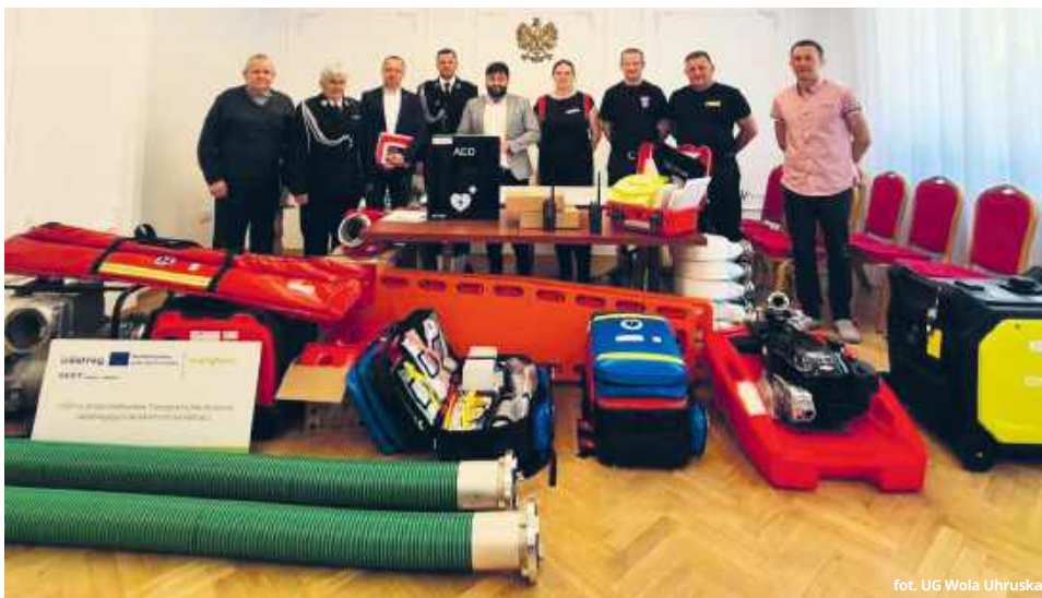
fol. UG Wola Uhruska

● GM. WOLA UHRUSKA Ochotnicze jednostki straży pożarnej z terenu gminy zyskały nowoczesne wyposażenie, które realnie wpłynie na efektywność prowadzonych akcji ratowniczych. Oficjalne przekazanie specjalistycznego sprzętu odbyło się w ramach działań związanych z obroną cywilną oraz projektów transgranicznych.