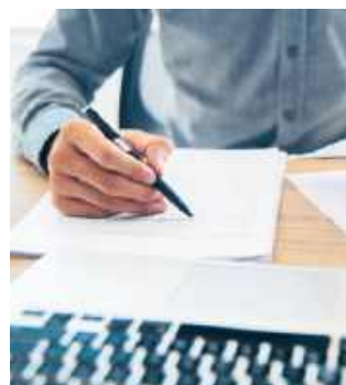
Gmina Leśniewice prowadzi czynności administracyjne w sprawie wydania decyzji o środowiskowych uwarunkowaniach dla biogazowni w Janówce.

Mieszkańcy mogą zapoznać się z dokumentacją dotyczącą inwestycji w siedzibie Urzędu Gminy Leśniewice, w Referacie Inwestycji, Gospodarki Komunalnej, Ochrony Środowiska i Rolnictwa (pokój nr 3c).