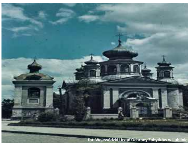
fol. Wojewódzki Urząd Ochrony Zabytków w Lublinie