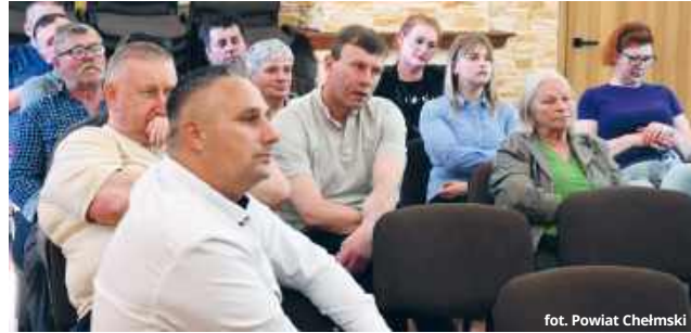
fol. Powiat Chełmski

Stan techniczny drogi powiatowej nr 1811L na odcinku Toruń - Borowica od lat budził ogromne niezadowolone mieszkańców gmin Łopiennik Górny oraz Rejowiec Fabryczny. Ostatnie dni przyniosły jednak wyraźny zwrot akcji - od obywatelskiej petycji, przez emocjonalne spotkanie w świetlicy w Kaniem, aż po konkretne decyzje finansowe podjęte podczas sesji Rady Powiatu w Krasnymstawie.