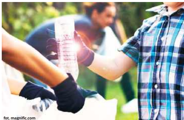
Władze gminy muszą podjąć decyzję w sprawie inwestycji, która będzie polegała na budowie lokalnego Punktu Selektywnego Zbierania Odpadów Komunalnych. Czy są w stanie dołożyć do zakładanego budżetu kolejne 100 tys. zł?

● GM. REJOWIEC Rejowiec planuje budowę nowoczesnego Punktu Selektywnego Zbierania Odpadów Komunalnych (PSZOK). Choć postępowanie przetargowe weszło już w kluczową fazę, przyszłość inwestycji wciąż pozostaje niepewna. Wszystkie złożone oferty okazały się bowiem wyższe od środków zabezpieczonych przez samorząd.