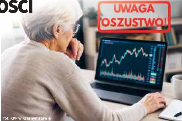
fol. KPP w Krasnymstawie

Mając pełną kontrolę nad sytuacją, oszuści kontynu-