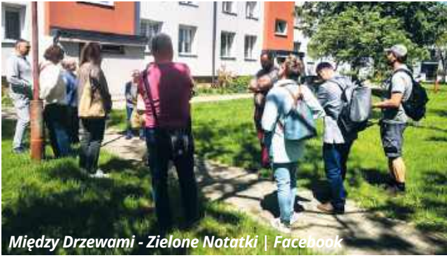
Między Drzewami - Zielone Notatki | Facebook

● WŁODAWA Pod takim hasłem Inicjatywa Lokalna Między Drzewami zrealizowała kolejny etap projektu „Wodo-Zależni – o wodzie, klimacie i miejskiej zieleni”. Po marcowych warsztatach prawnostrażniczych, tym razem uwaga organizatorów i uczestników skupiła się na praktycznych aspektach architektury krajobrazu oraz racjonalnego zarządzania zasobami naturalnymi w przestrzeni publicznej i prywatnej.