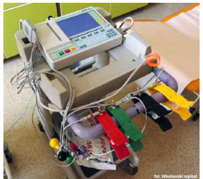
fol. Włodawski szpital

Pozyskane środki pozwoliły nam doposażyć dwa miejsca, w których badanie EKG jest szczególnie potrzebne: Izbę Przyjęć oraz Oddział Wewnętrz-