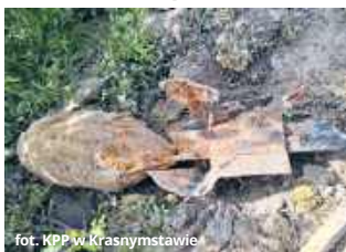
fol. KPP w Krasnymstawie

● GM. IZBICA Podczas prac ziemnych w Tarnogórze ujawniono bombę lotniczą z okresu II wojny światowej. Miejsce zabezpieczyli policjanci, a niewybuch przejęli saperzy.