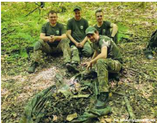
fol. Stowarzyszenie Wolica

Ślady wojny sprzed ponad 80 lat wciąż kryją się pod ziemią Lasu Orłowskiego w gminie Izbica. Pasjonaci historii i militariów przeszukali miejsce katastrofy niemieckiego bombowca, który rozbił się tam 3 kwietnia 1944 roku po bombardowaniu wsi Majdan Sitaniecki. W ziemi do dziś znajdują się fragmenty samolotu, a miejsce katastrofy nadal nosi wyraźne ślady tragicznych wydarzeń z czasów II wojny światowej.