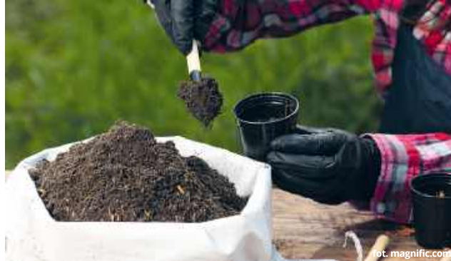
Mieszkańcy, którzy zainteresowani są działalnością spółki Agrocal w Buśnie mogą zająć stanowisko w sprawie planów

Przedsiębiorca podkreśla, że prowadzi swoją działalność od ponad 20 lat i czuje się nękany licznymi kontrolami. W sporze