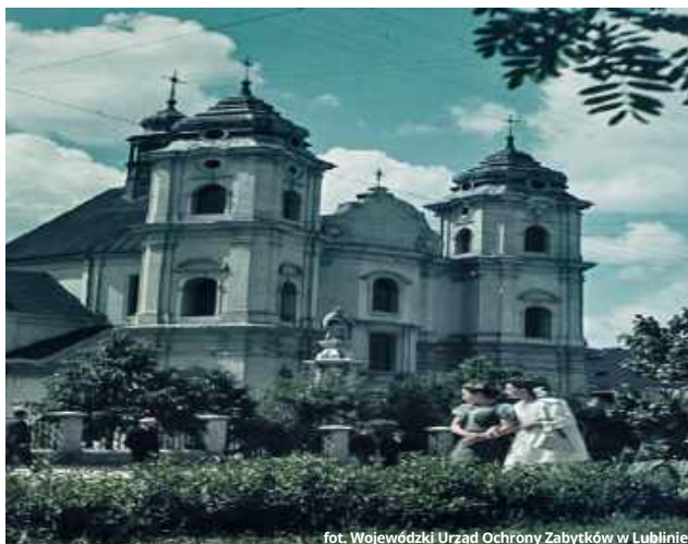
fol. Wojewódzki Urząd Ochrony Zabytków w Lublinie

W zasobach Saksońskiej Biblioteki Państwowej i Uniwersyteckiej w Dreźnie (Sächsische Landesbibliothek - Staats- und Universitätsbibliothek Dresden) odnaleziono unikatowe świadectwo historii. Na portalu Deutsche Fotothek udostępniono cztery kolorowe fotografie Chełma, które z dużym prawdopodobieństwem można uznać za najstarsze znane barwne zdjęcia miasta.