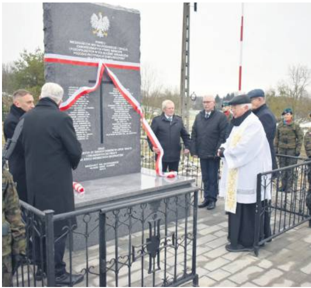
Uroczystości odbyły się w Rachodoszczach.

Wydarzenie zgromadziło mieszkańców, rodziny ofiar, przedstawicieli władz samorządowych oraz zaproszonych gości. 28 listopada w Rachodoszczach (gm. Adamów) uroczysto odsłonięto odnowiony pomnik pamięci mieszkańców tej i okolicznych wiosek, zamordowanych przez Niemców oraz pozostałych w ich służbie Ukraińców podczas pacyfikacji Zamojszczyzny.