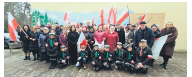
Odsłonięcie muralu stało się okazją do wspólnego świętowania.

Mural przedstawia piękno ziemi zamojskiej, w tle widać jej obrońców z czasów II wojny