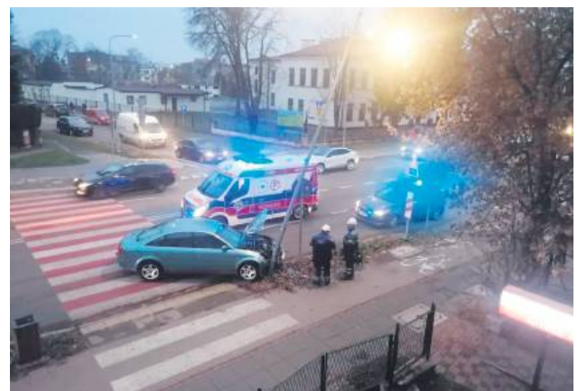
Kierujący audi 57-latek z Zamościa stracił panowanie nad samochodem i uderzył w latarnię.

– Kierowca gwałtownie skręcił, po czym samochód uderzył w latarnię. Na szczęście nikomu nic się nie stało – mówi podkomisarz Dorota