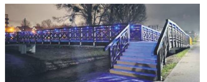
Powstała bezpieczna kładka.