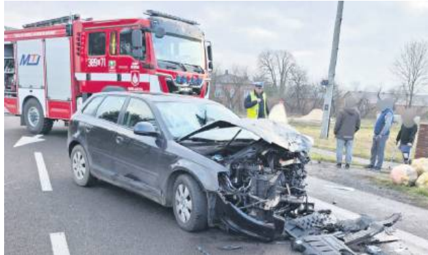
Kierująca audi najpierw potrafiła pieszego, a potem czołowo zderzyła się z innym samochodem.

W Wielączy kierująca audi potrafiła przechodzącego przez jezdnię 72-latką, po czym zjechała na przeciwny pas ruchu i czołowo zderzyła się z kierującą fordem. Niestety, pieszy w wyniku odniesionych obrażeń zmarł na miejscu wypadku.