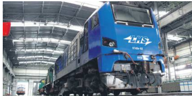
PKP LHS jest najdłuższą linią szerokotorową w Polsce, przeznaczoną do transportu towarowego. Liczy prawie 400 km i łączy kolejowe przejście graniczne Izow-Hrubieszów ze Śląskiem.

– Najważniejszą kwestią jest ratowanie spółki, a jako poseł