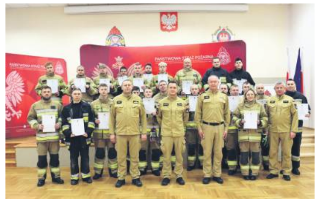
24 kolejnych druhow z powiatu tomaszowskiego przeszło szkolenie na strażaka ratownika.

Przed przystąpieniem do egzaminu strażacy musieli zaliczyć testy w komorze dymowej Ośrodka Szkolenia Komendy Wojewódzkiej PSP w Lublinie. Następnie, 28 listopada, w Komendzie Powiatowej Państwowej Straży Pożarnej w Tomaszowie Lubelskim przeprowadzono egzamin teoretyczny i praktyczny kończący szkolenie podstawowe strażaka