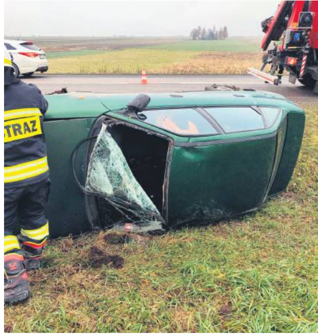
Strażak pomógł kobiecie, która kierowała tym autem.