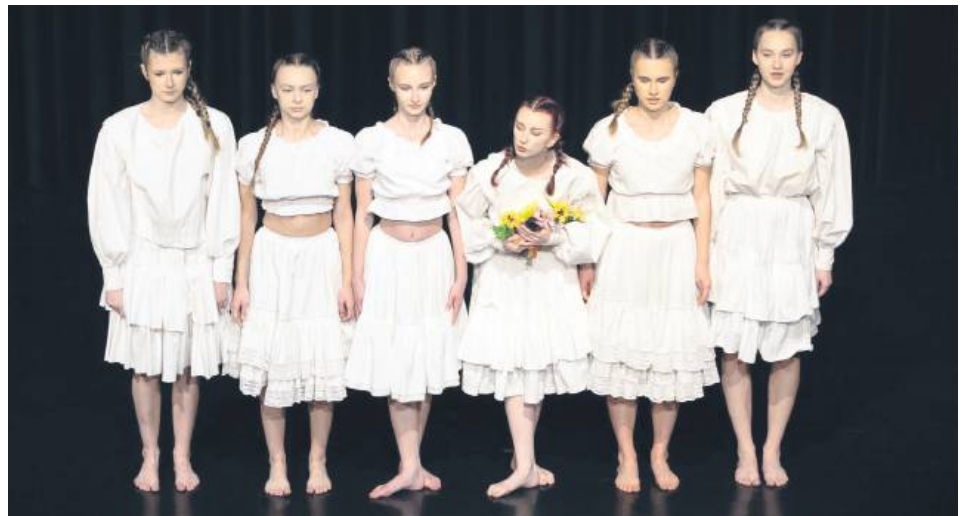
Dziewczyny ćwiczą w Młodzieżowym Domu Kultury.