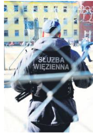
Dwaj funkcjonariusze SW zostali skazani po ucieczce Bartłomieja B. ze szpitala w Radecku.

Sąd Rejonowy w Zamościu wymierzył tym strażnikom karę roku więzienia w zawieszeniu na trzy lata. Nałożył na nich również