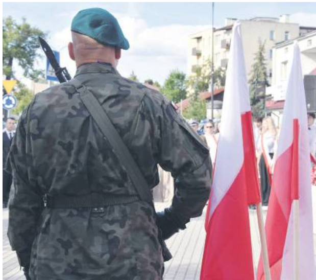
Biłgorajscy samorządowcy dążą do utworzenia jednostki wojskowej.

Jak podkreślono w trakcie sesji, rozmowy dotyczące lokalizacji jednostki wojskowej na terenie Biłgoraja lub okolicznych gmin trwają od dłuższego czasu. Według władz miasta i gminy przemawia za tym zarówno sytuacja międzynarodowa, jak i potencjalne korzyści gospodarcze.