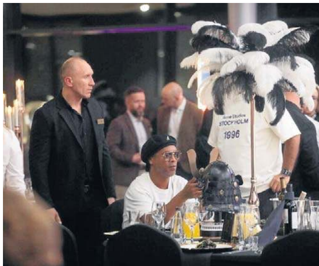
W piątek wieczorem Ronaldinho i spółka spotkali się na uroczystej kolacji w salonie Mercedesa w Rudzie Śląskiej

Mecz trwał dwa razy po 40 minut, a na ostatnie pięć minut każdej części sędzia Szymon Marciniak wymieniał piłkę na „złotą”. Zdobyte nią gole liczyły się podwójnie. Z okazji skorzystał Ronaldinho, dzięki