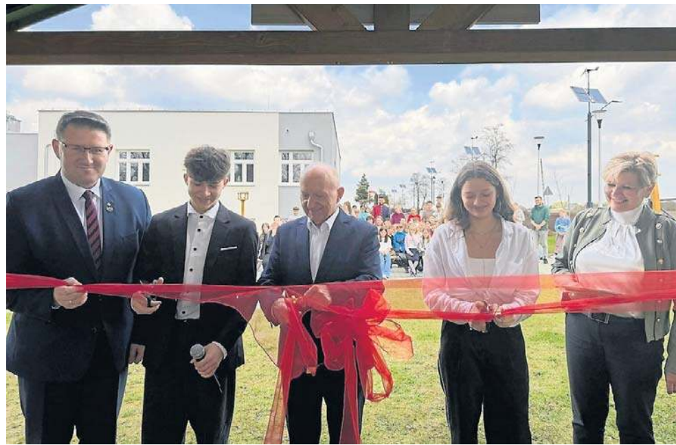
W SP im. Adama Mickiewicza w Kobielicach powstała „Pracownia pod chmurką”

Z kolei w ZSP im. Jana Pawła II w Bystrej otwarto Zieloną Pra-