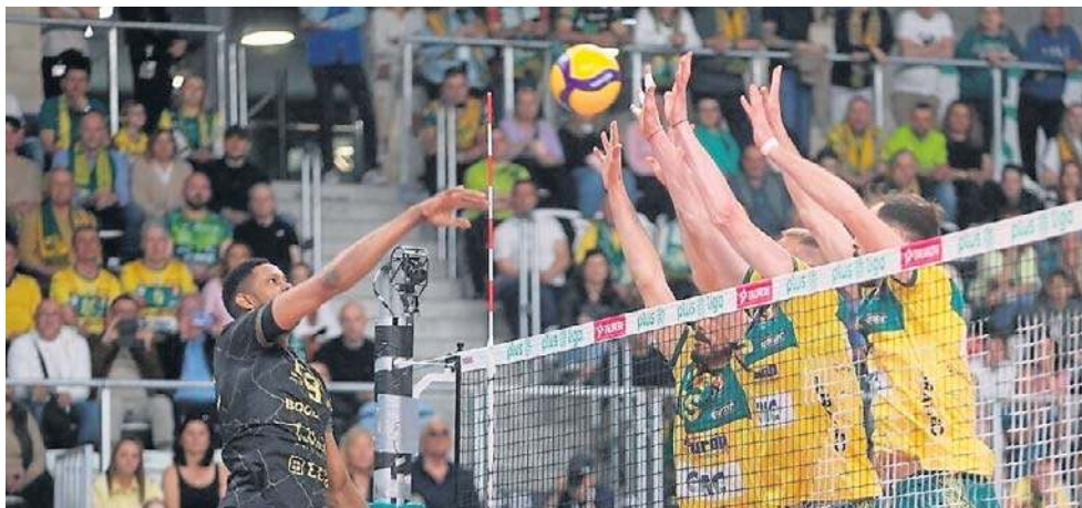
Wilfredo Leon miał spore problemy z przebieciem się przez blok siatkarzy z Zawiercia