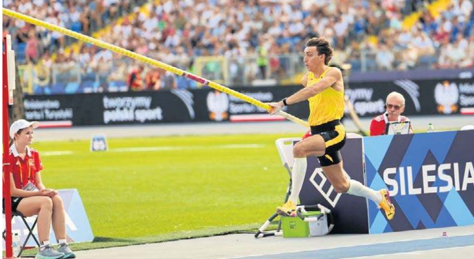
W ME 2028 w Kotle Czarownic jedną z gwiazd będzie Szwed Armando Duplantis

Radości z powierzenia nam organizacji ME nie ukrywał również minister sportu i turystyki Jakub Rutnicki.