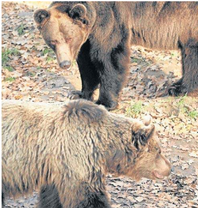
Ataki niedźwiedzi na ludzi są incydentalne, ale to dzikie zwierzęta, a w Beskidzie Żywieckim mają swoje ostoje

Nic dziwnego, że po tym tragicznym zdarzeniu strach padł także na mieszkańców i turystów odwiedzających Beskidy - w Beskidzie Żywieckim, w rejonie Babiej Góry czy Piłska drapieżniki mają swoje ostoje. - Niedźwiedzie wszystkim kojarzą się z Bieszczadami i Tatrami. Tymczasem Beskid Żywiecki to stała ostoja tego gatunku, miejsce gawrowania i co bardzo istotne - rozrodu. Nasze fotopułki regularnie rejestrują obecność samic i samców, a nawet młodych niedźwiedzi w różnych miejscach Beskidu Żywieckiego - napisali wówczas członkowie