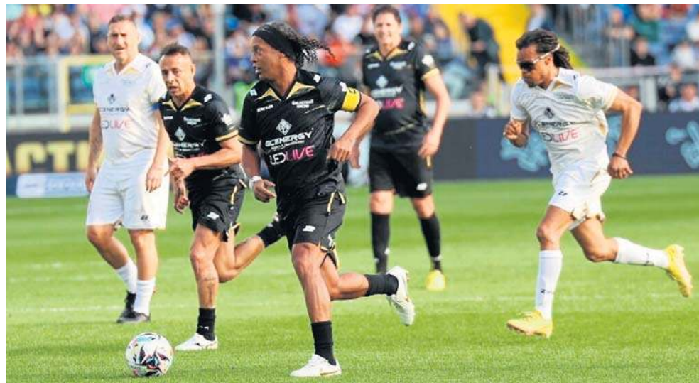
Kibice na Stadionie Śląskim mieli okazję zobaczyć w akcji wielkie gwiazdy futbolu, m.in. Ronaldinho i Edgara Davidsa. Widowisko i zabawa były znakomite

Obecność piłkarskich gwiazd była jednym z elemen-