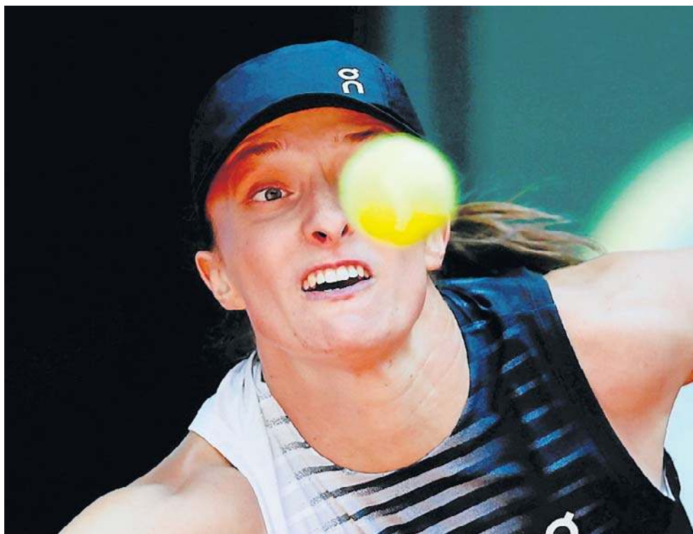
Iga Świątek z powodów zdrowotnych poddała mecz w trzeciej rundzie w Madrycie

W pierwszym secie obie tenisistki nie zachwycały. Znacznie częściej popełniały niewymuszone błędy niż popisywały się zagraniami wygrywającymi. O losach tej partii zadecydował tie-break, który wygrała Amerykanka 7:6.