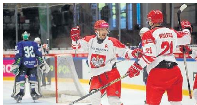
Polacy cieszyli się z pierwszej od roku wygranej ze Słowenią