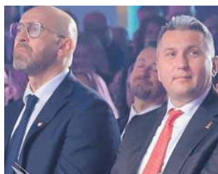
Minister sportu Jakub Rutnicki i prezes PKOl Radosław Piesiewicz spotykają się w sądzie

OLIMPIZM. Prezesi 52 związków sportowych domagają się ustąpienia szefa PKOl Radosława Piesiewicza. On jednak nie zamierza rezygnować i zapowiada pozwanie ministra sportu Jakuba Rutnickiego.