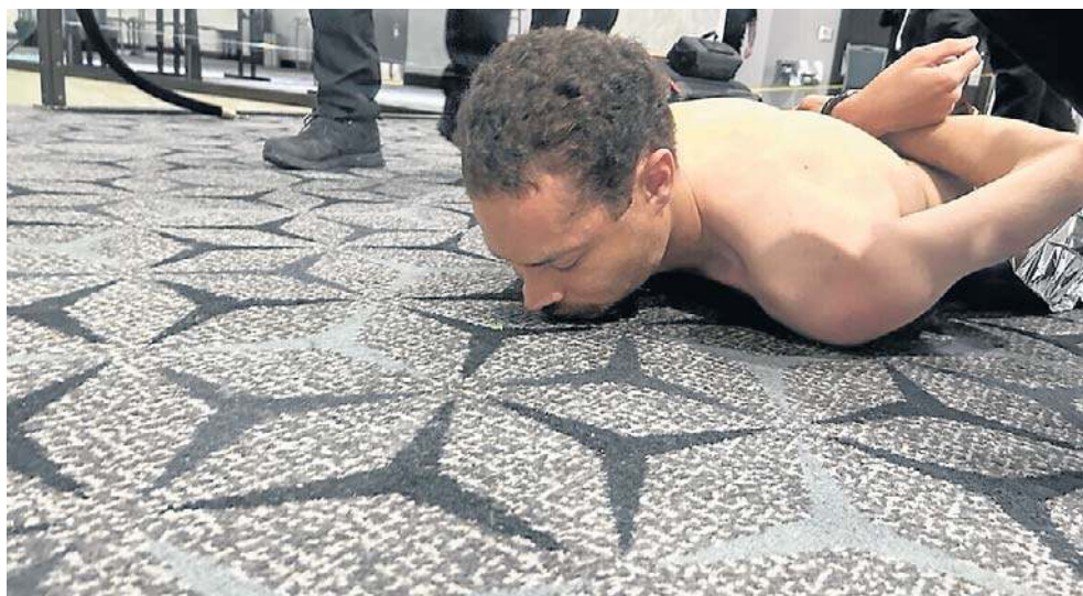
Prezydent opublikował w serwisie Truth Social zdjęcia mężczyzny leżącego na podłodze oraz nagranie, na którym widać, jak przebiega przez kontrolę bezpieczeństwa

Oprócz członków gabinetu, np. sekretarza stanu Marco Rubio i szefa Pentagonu Pete'a Hegsetha, na sali obecne były setki dziennikarzy i politycy. Goście wydarzenia ukrywali się pod stołami w sali balowej.