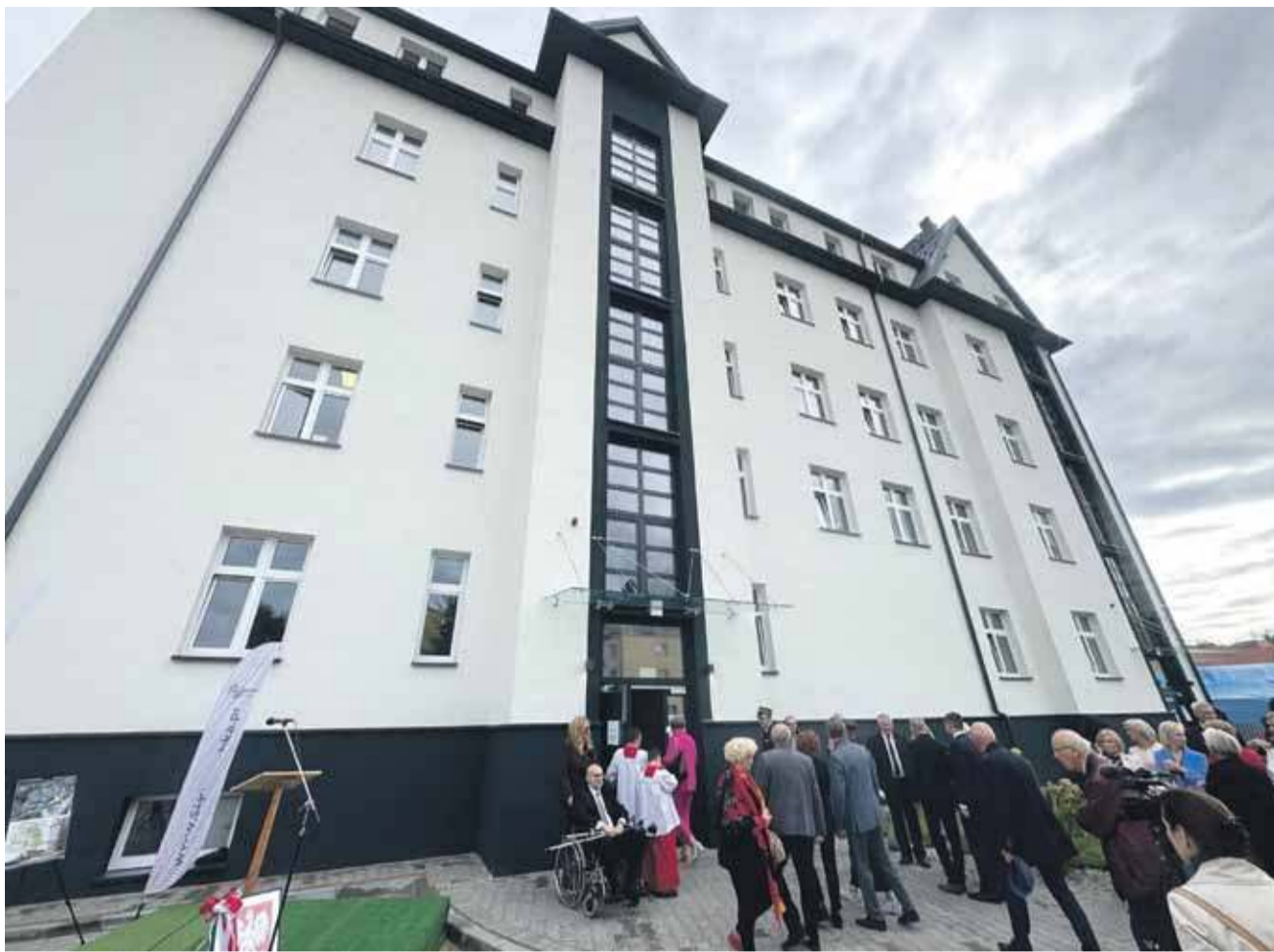
Szpital Miejski w Rabce w czasie uroczystego otwarcia nowej siedziby.