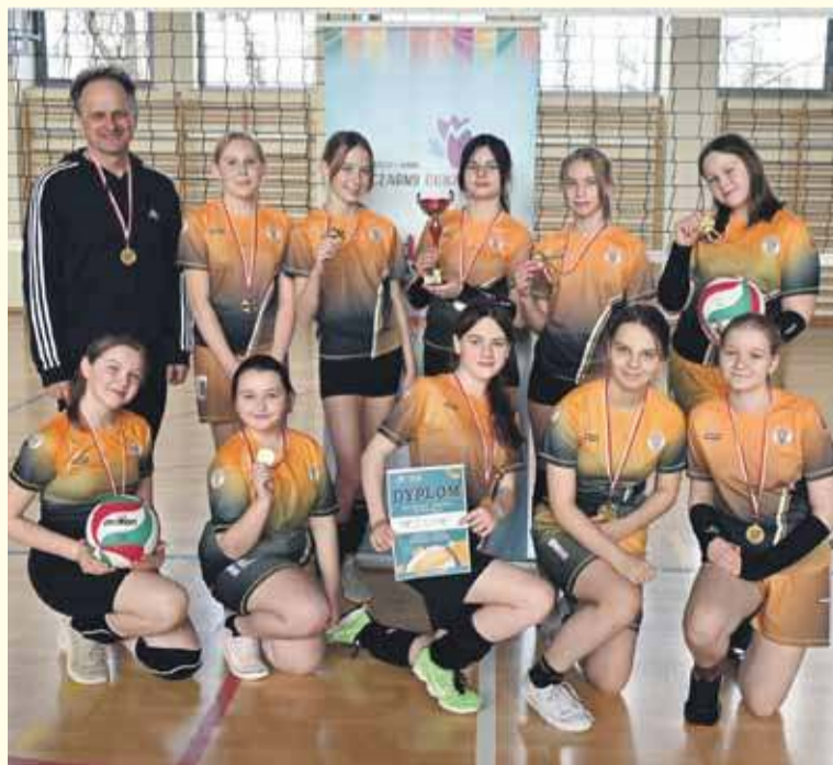
Gospodarze z Cichego byli gościnni, ale na boisku nie dali za wygraną.