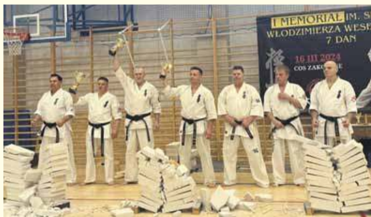
Memoriał był okazją do rozegrania widowiskowego turnieju tameshiwari, czyli rozbijania betonowych bloczków układanych jeden na drugim.

Wśród gości wydarzenia znaleźli się przedstawiciele władz samorządowych: burmistrz