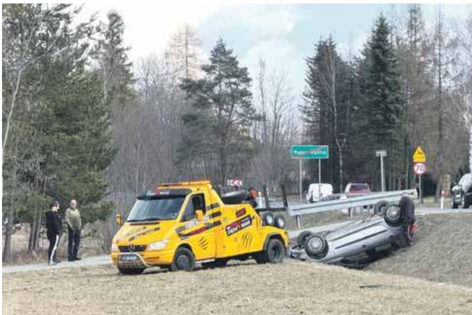
Groźny wypadek na Chyźniance.