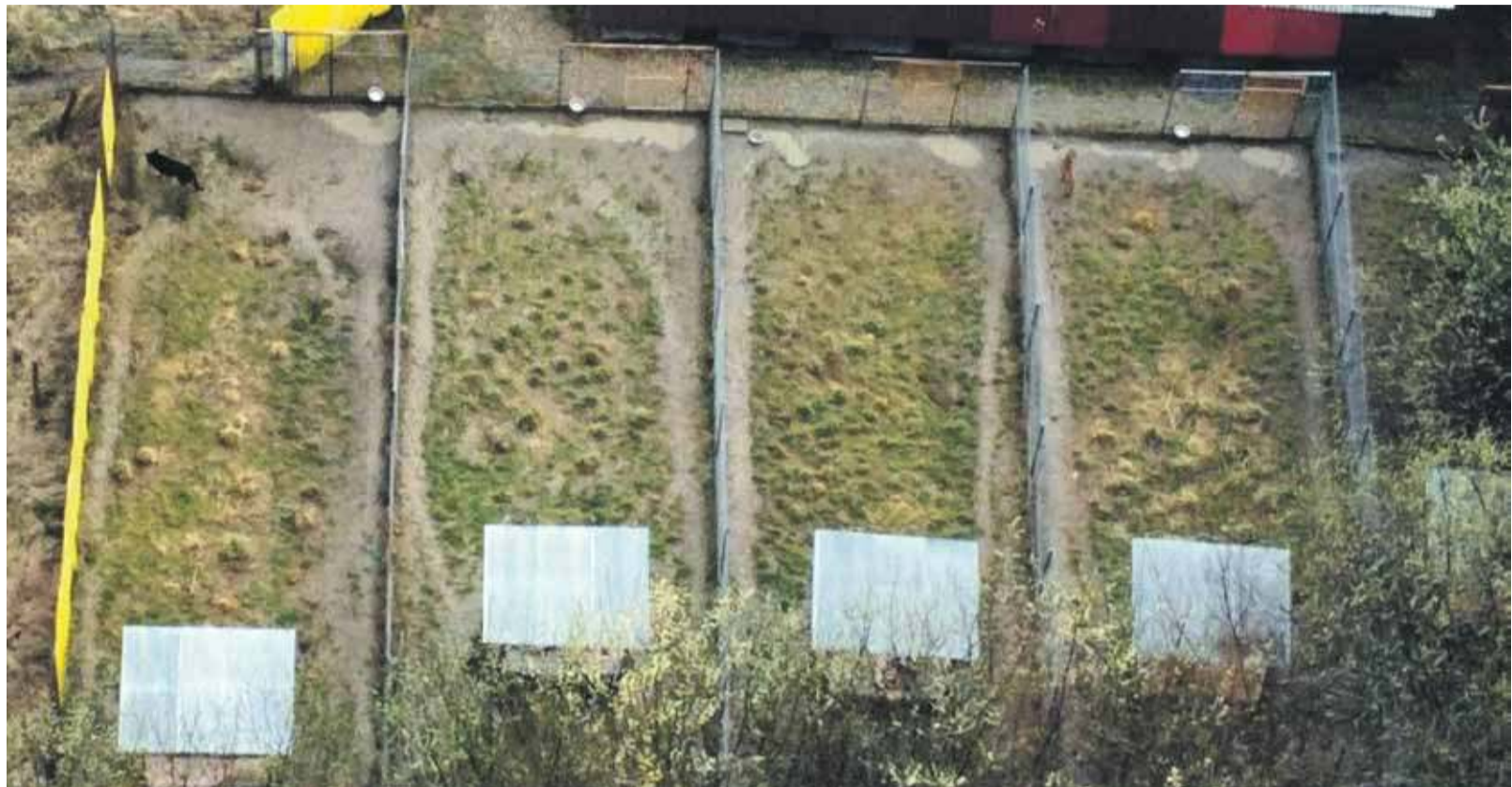
Wybiegi dla psów w nowotarskim schronisku z lotu ptaka.

Zastrzeżenia protestujących budzi również stan infrastruktury. Psów jest - ich zdaniem - za dużo, na zbyt małej przestrzeni, żeby spacerować z psem, behawiorysta, szkoleniowiec czy do-