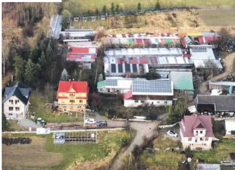
Schronisko dla Bezdomnych Zwierząt na Kokoszkowie w Nowym Targu.