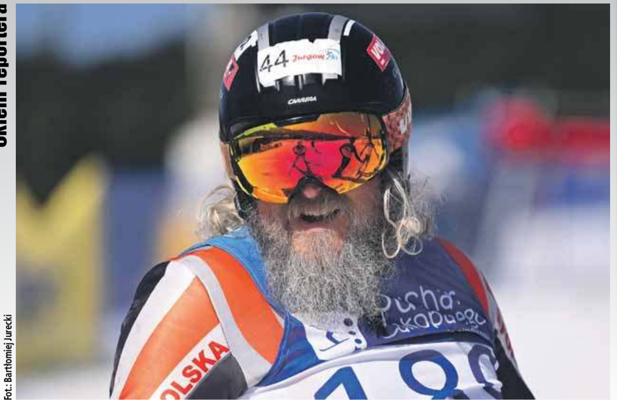
Fot.: Bartłomiej Jurecki