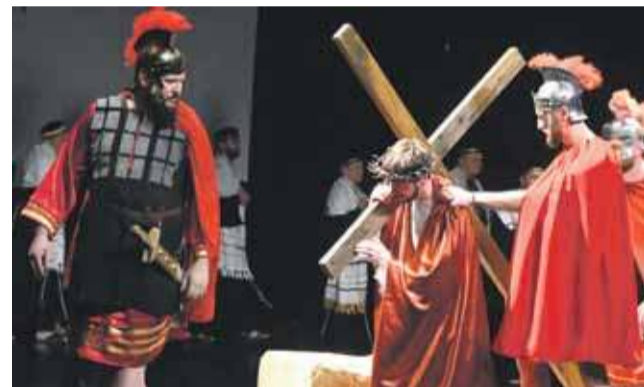
Jezus bierze krzyż na swe ramiona.

niu organizatorzy dziękowali też wszystkim, którzy w jakikolwiek sposób byli zaangażowani w powstanie tegorocznego Misterium