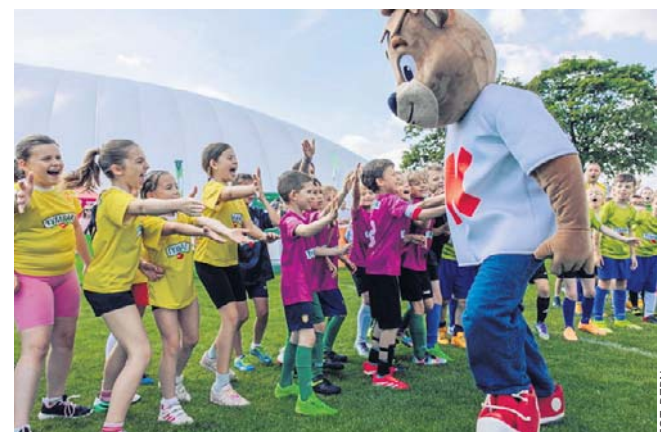
Wynik był ważny, ale liczyła się też dobra zabawa