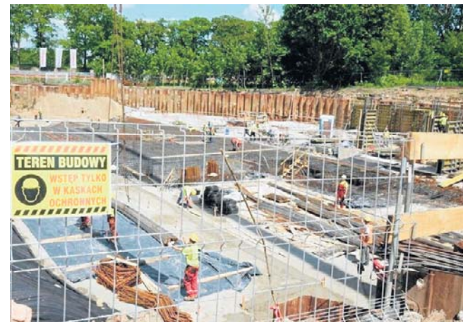
Tak wyglądał plac budowy w dniu wmurowania kamienia węgielnego

Szacowany termin zakończenia inwestycji to pierwszy kwartał 2028 r.