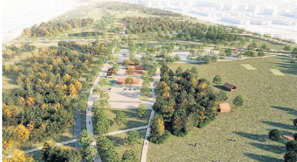
W intencji mieszkańców i urzędników nowy obszar zieleni i wypoczynku stanie prawdziwymi „zielonymi płucami” na południu Wrocławia