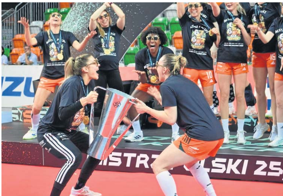
Ogromna radość piłkarek ręcznych KGHM MKS-u Zagłębia Lubin. W pełni zasłużona

Los sprawił, że w tym sezonie Lubin w Lublinie grały ze sobą nader często - nie tylko na krajowym podwórku, ale także w europejskich pucharach. Na siedem rozegranych do piątku meczów aż sześć