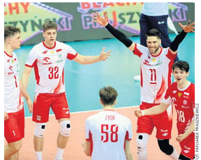
Radość siatkarzy reprezentacji Polski podczas sobotniego meczu Silesia Cup z Bułgarią w Katowicach

Trenerzy obu zespołów zdecydowali o rozegraniu dodatkowego seta. Był on najbardziej wyrównany ze wszystkich - tym razem inicjatywa była po stronie Bułgarów, którzy wykorzystywali błędy polskiego zespołu i wygrali 25:22. Kolejnym przystankiem Polaków będzie chińskie Liny, gdzie 10 czerwca rozpoczyna walkę w Lidze Narodów. ©