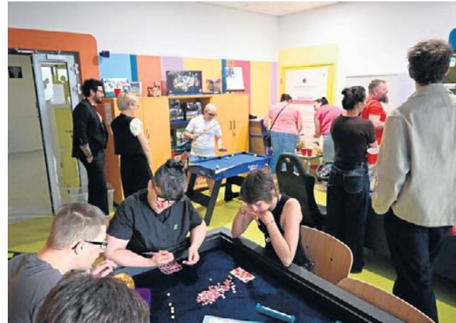
We Wrocławiu działa pierwsza w Polsce świetlica dla nastoletnich pacjentów onkologicznych

- To bardzo dobre rozwiązanie, zwłaszcza, że spędzając tyle czasu w sali z rodzicami czasami potrzeba chwili dla