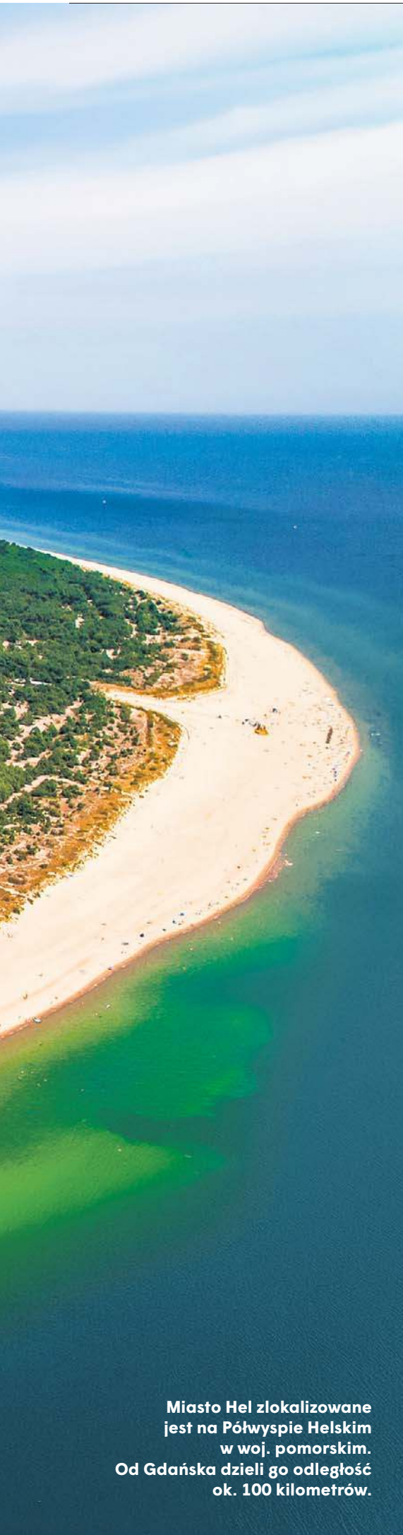
Miasto Hel zlokalizowane jest na Półwyspie Helskim w woj. pomorskim. Od Gdańska dzieli go odległość ok. 100 kilometrów.