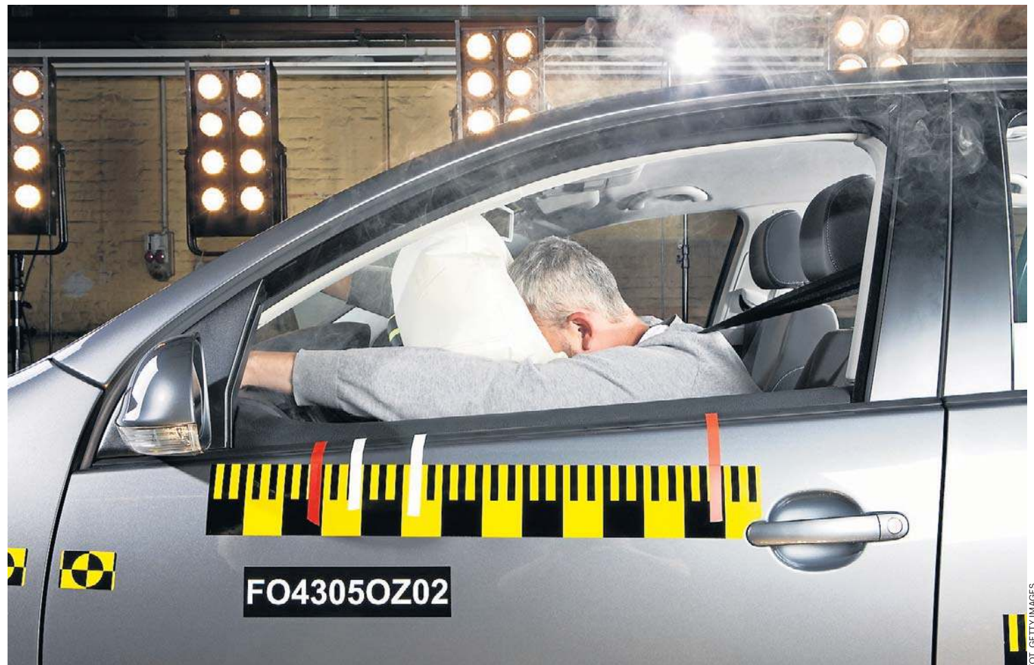
Poduszki, odpowiednio złożone i pokryte talkiem, ukryte są pod cienkimi warstwami tworzywa sztucznego. Oznaczone są skrótami SRS, SRS-Airbag lub Airbag, widocznymi w miejscach montowania. Po wystrzeleniu muszą zostać wymienione na nowe

Idea poduszki powietrznej narodziła się w lotnictwie podczas II wojny światowej. Prace zarzucono, bowiem napełnianie poduszek sprężonym powietrzem nie sprawdziło się. W drugiej połowie lat pięćdziesiątych projektami poduszek powietrznych zajęły się koncerny Ford i General Motors. Pierwsza seryjna czołowa poduszka powietrzna pojawiła się w 1973 r. i chroniła jadącego na prawym przednim fotelu samochodu Oldsmobile Toronado. Rok później w autach Buick, Cadillac i Oldsmobile oferowano już dwie czołowe poduszki, ale nie sprawdziły się one w praktyce. Powodowały obrażenia, a nawet przyczyniały się do śmierci osób, które powinny chronić.