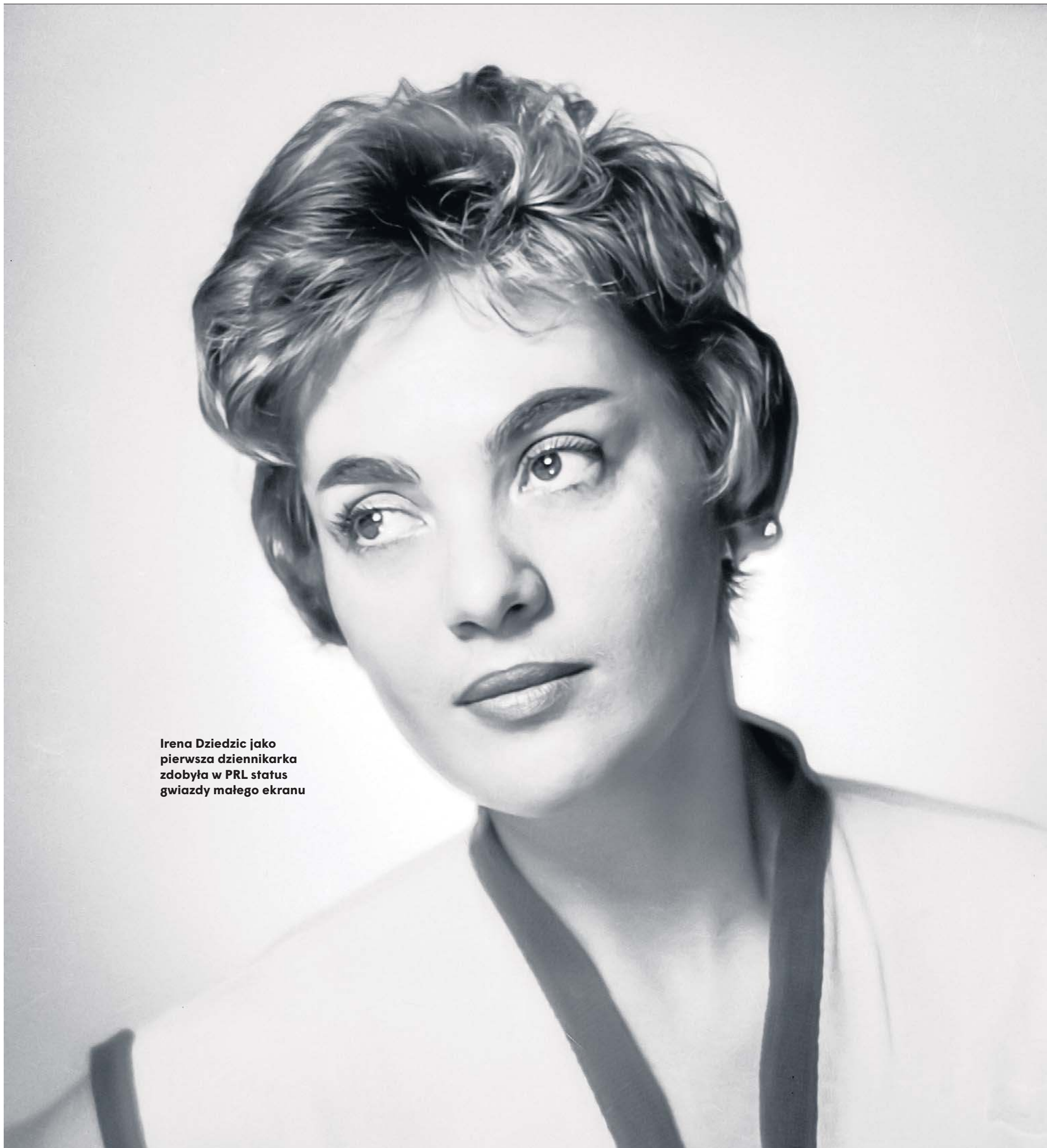
Irena Dziedzic jako pierwsza dziennikarka zdobyła w PRL status gwiazdy małego ekranu