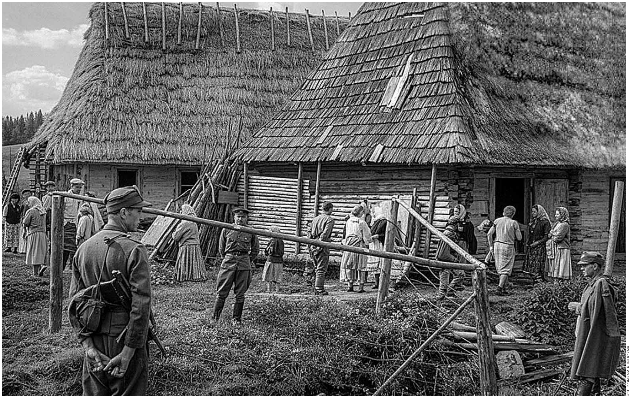
W ramach akcji „Wisła” z 1947 r. wysiedlono ok. 140 tys. osób narodowości ukraińskiej

● W wyniku akcji „Wisła” w ciągu zaledwie trzech miesięcy wysiedlono prawie 150 tys. osób ● Akcja była brutalna, prowadzona siłą, miała wszystkie cechy czystki etnicznej ● Władze PRL-u uznały, że tylko w ten sposób rozwiążą problem działalności UPA na terenie Polski