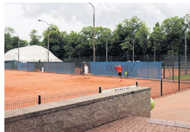
Nowoczesny kort powstanie na obiekcie Miejskiego Klubu Tenisowego w Łodzi

Zamiast dotychczasowego placu gry, zawodnicy otrzymają powiększoną arenę z tradycyjnej mączki ceglanej o wymiarach ponad 18 na 36 metrów. Największe wrażenie zrobi jednak to, co powstanie wokół. Mecze będzie można oglądać z bliska dzięki nowym trybunom, które łącznie z innowacyjną galerią zapewnią wygodne miejsca dla 455 osób. Co niezwykle ważne, zachodnia widownia zyska całkowicie nową pochylnię oraz specjalnie dedykowane miejsca dla kibiców poruszających się na wózkach inwalidzkich. Sportowe