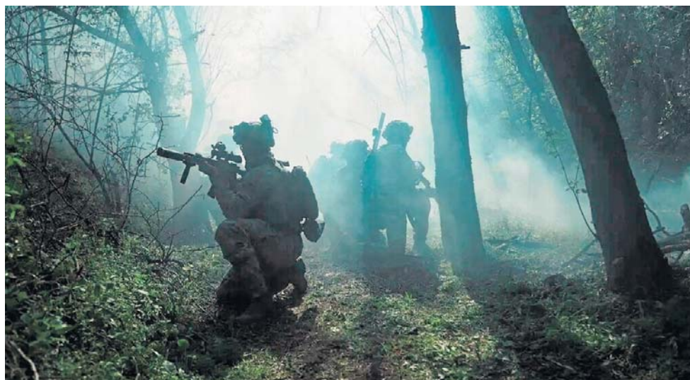
W ostatnich dwóch miesiącach armia ukraińska coraz skuteczniej radzi sobie z Rosjanami

W tej sytuacji eskalacja jest, jej zdaniem, jedynym sposobem na zareagowanie na sytuację, której nie da się kontrolować. Moskwa może wykorzystać groźbę eskalacji konfliktu, aby skłonić USA do wznowienia rozmów pokojowych, w trakcie których, zgodnie z kalkulacją Kremla, administracja Donalda Trumpa wywrze presję na Wołodymyra Zełenskigo, żeby oddał Rosji resztę obwodu donieckiego. Mając pełną kontrolę nad Donbasem Putin mógłby przedstawić Rosjanom koniec wojny jako zwycięski dla Moskwy.