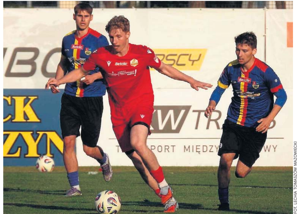
Piłkarze Lechii Tomaszów Mazowiecki (czerwone stroje) zakończyli miniony sezon w grupie pierwszej III ligi na dziewiątym miejscu w tabeli grupy pierwszej

Rosińskim do końca sezonu 2026/2027. W poprzednich rozgrywkach piłkarz wystąpił w 31 meczach, strzelił jednego gola. Wiadomo natomiast, że tomaszowianie zaplanowali pięć meczów kontrolnych. Pierwszy 4 lipca z Wdą Świecie (dziewiąte miejsce w grupie drugiej III ligi w minionym sezonie), 11 lipca ze Starem Starachowice (piąte miejsce w grupie czwar-