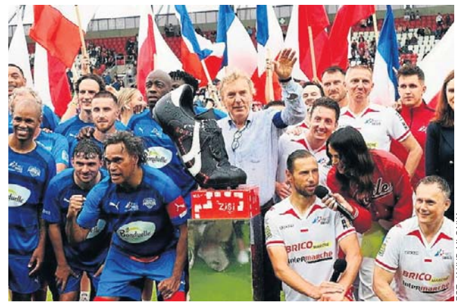
Tak było podczas ubiegłorocznego Mecz Gwiazd na stadionie Widzewa