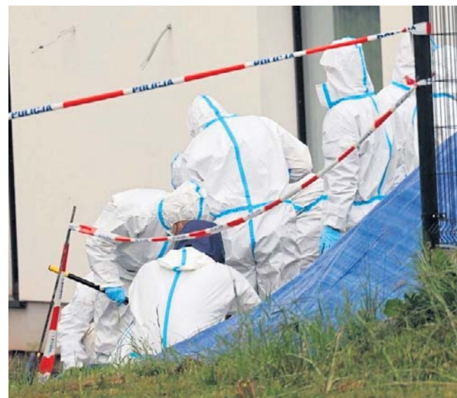
Funkcjonariusze pracowali w specjalnych kombinezonach, a posesja została dokładnie przekopywana

W sobotę prokurator Ciechanowski informował o prze-