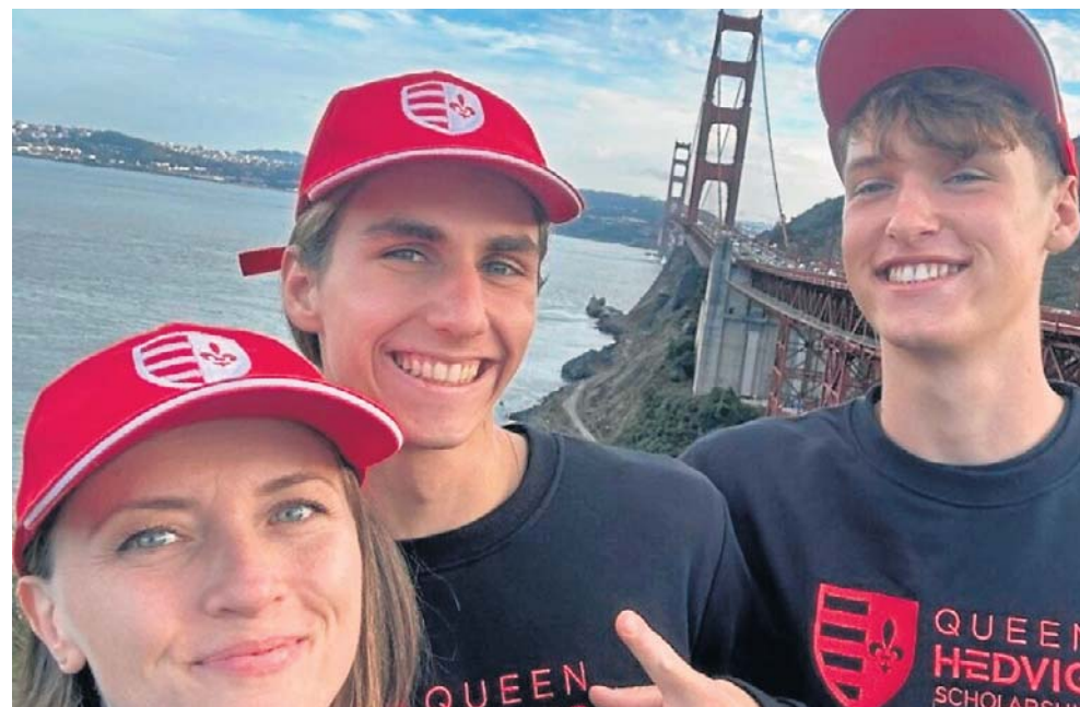
W Dolinie Krzemowej reprezentacja ZSP Kleszczów była też przed rokiem

Wszyscy mają już za sobą rozmowy z komisją konkur-