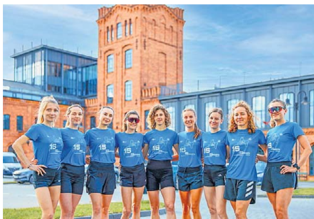
Bieg Fabrykanta to coś więcej niż start na 10 km. To wydarzenie, które łączy sport z atmosferą miasta

Organizatorzy wspólnie z Ambasadorami projektu „Bieg Fabrykanta jest Kobietą” zaprezentowali projekt tegorocznej koszulki, którą otrzy-