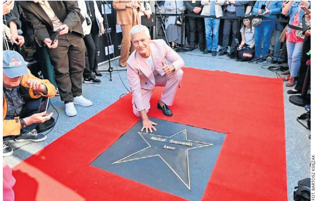
Gwiazda Michała Żebrowskiego jest dokładnie 111. w Łódzkiej Alei Gwiazd

W dorobku Michała Żebrowskiego są też cenione przez widzów kreacje Jana Skrzetuskiego w „Ogniem i mieczem”, Tadeusza Soplicy w „Panu Tadeuszu”, Wojciecha Winklera w „Pręgach”. Publiczność seriali kocha go za rolę profesora Andrzeja Falkowicza w „Na dobre i na złe”,