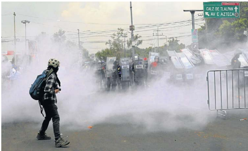
Obrazek w niczym nie przypomina największej radosnej imprezy piłkarskiej świata