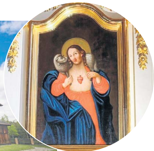
Obraz Najświętszego Serca Pana Jezusa w Milejczycach powstał na przełomie XVII i XVIII wieku

Potwierdzeniem tego kultu będą zaplanowane na piątek uroczystości w Milejczycach związane z ustanowieniem Sanktuarium Najświętszego Serca Pana Jezusa Dobrego Pasterza. Podniesienie kościoła św. Stanisława Biskupa i Męczennika w Milejczycach do rangi diecezjalnego sanktuarium będzie oficjalnym potwierdzeniem szczególnego znaczenia tego miejsca w życiu duchowym diecezji. To wyjątkowe wydarzenie będzie dniem wspólnej modlitwy, wdzięczno-