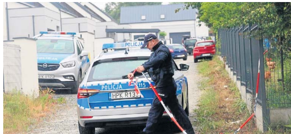
Działkę zabezpieczali licznie przybyli policjanci. Wstrząsające znalezisko znajduje się w środku osiedla przy jednym z budynków