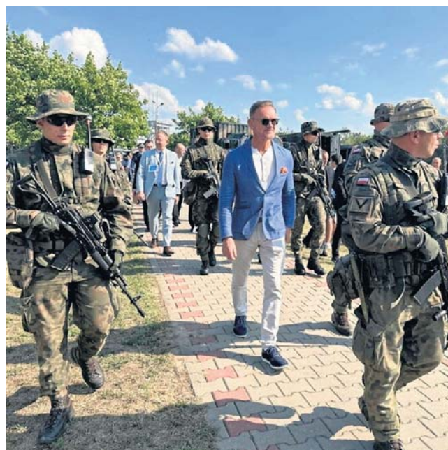
Podczas obchodów 85-lecia Osiedla Niewiadów w lipcu 2023 r. Cezary Pazura pojawił się w asyście wojska

„Cała nasza społeczność życzy Panu 100 lat, dużo zdrowia, niekończącej się energii i kreatywności!” – czytamy ponadto na oficjalnym profilu gminy.