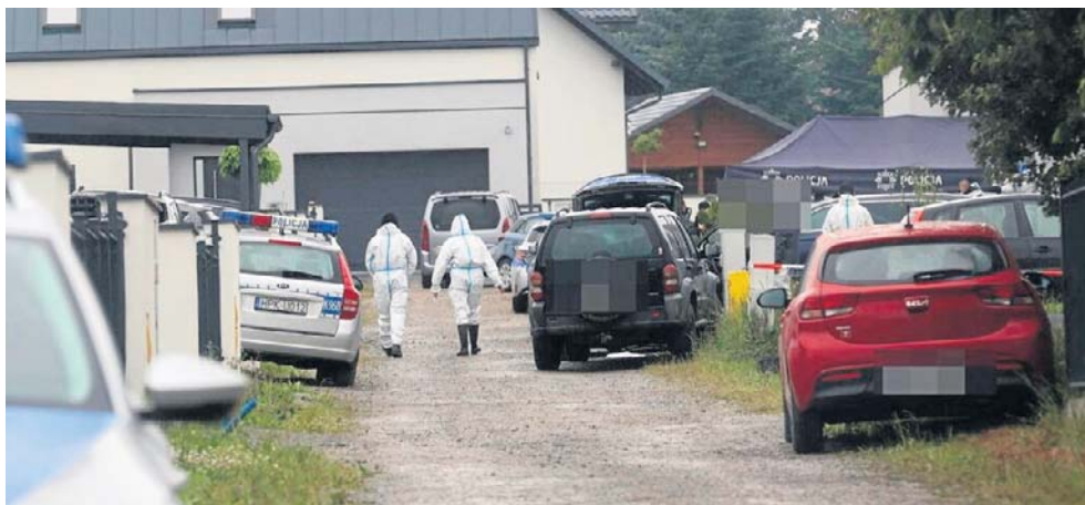
Podrzeszowski Lutoryż znalazł się w centrum jednej z najbardziej wstrząsających spraw ostatnich lat w Polsce