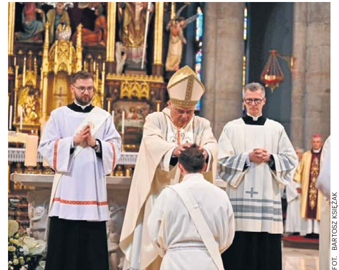
Święceń udzielił kardynał Konrad Krajewski

Święceń udzielił kardynał Konrad Krajewski. Zgodnie z tradycją, przed święceniami kandydaci leżeli krzyżem przed ołtarzem, a następnie kard. Krajewski przez nałożenie rąk udzielił im święceń. Teraz przed nimi tzw. prymicje - czyli pierwsze samodzielnie odprowadzone msza św. w rodzinnej parafii, często połączone ze świętowaniem w gronie rodziny. Potem dostaną przydział - w zależności od seminarium - do parafii lub na misje.