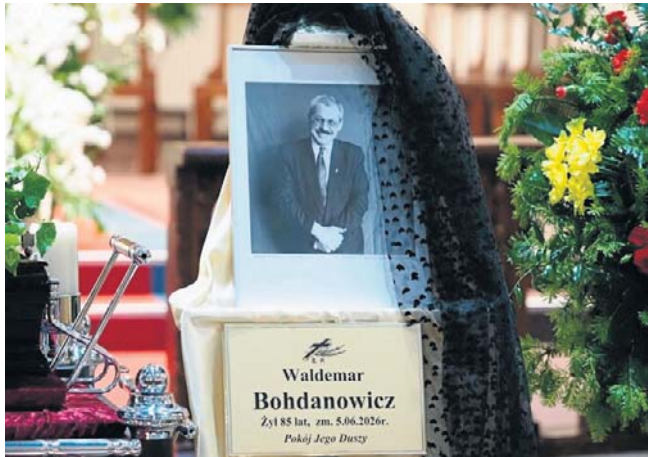
Msza św. pogrzebowa odprowadzona została w kościele oo. jezuitów przy ul. Sienkiewicza

Dziennik Łódzki ☎ 42 715 80 68 bok.prenumerata@polskapress.pl prenumerata.dzienniklodzki.pl