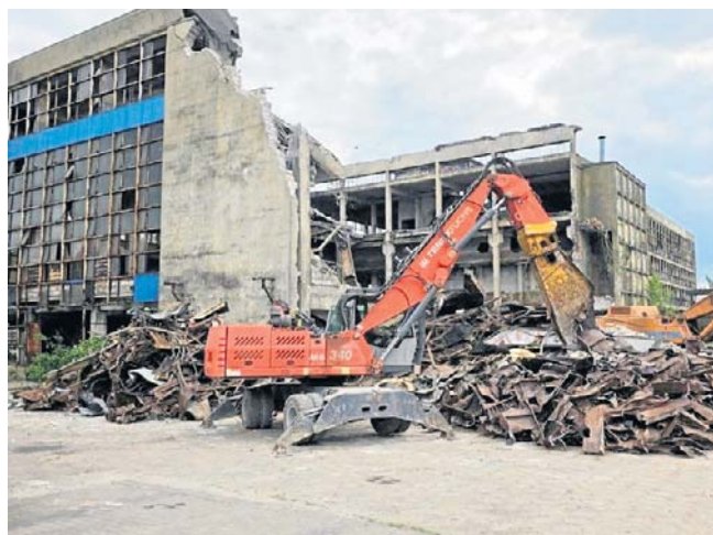
Wyburzanie budynków dawnej Huty Szkła Okiennego Kara w Piotrkowie Trybunalskim