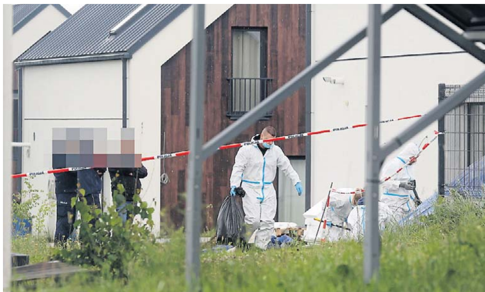
Posesja w Lutoryżu, na której znaleziono zakopane ludzkie szczątki, od kilku dni jest dokładnie przeszukiwana przez ekipy śledcze