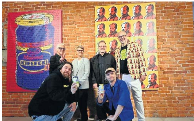
Łódź Kaliska miesza groteskę z elegancją pop-artu, fotografię inscenizowaną z reklamowym przepychem, a narodowy patos z absurdem codzienności

Wystawę w Vienna House by Wyndham Andel's w Łodzi można oglądać do 31 sierpnia.