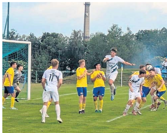
Sokół Aleksandrów (jasne stroje) pokonał na wyjeździe Stal Głowno (żółte koszulki) i będzie walczył o III ligę

Zjednoczeni Stryków - Polonia Piotrków Trybunalski 0:0.