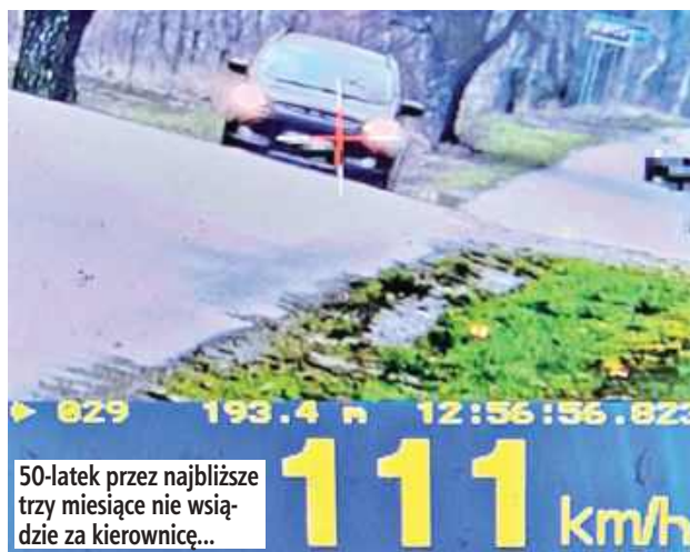
50-latek przez najbliższe trzy miesiące nie wsiaździe za kierownicę...

- Którego prędkość była wyższa niż ta, która obowiązuje na