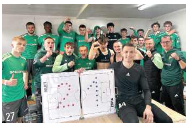
Radość w szatni łączników. Górnik II ograł lidera!