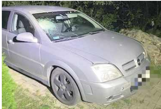
Samochód, który mógł brać udział w wypadku, policjanci odnaleźli w Lublinie

- Kierowca samochodu osobowego (najprawdopodobniej koloru szarego bądź srebrnego), potrącił pieszego znajdującego się na jezdni, a następnie odjechał z miejsca zdarzenia w kierunku ulicy Łąkowej i dalej miejscowości Wola Przybysławska, nie udzielając mu pomocy. Niestety 53-latek zginął na miejscu. Do zdarzenia doszło w obszarze zabudowanym, w miejscu oświetlonym, na prostym odcinku drogi - informowała policja o wypadku.