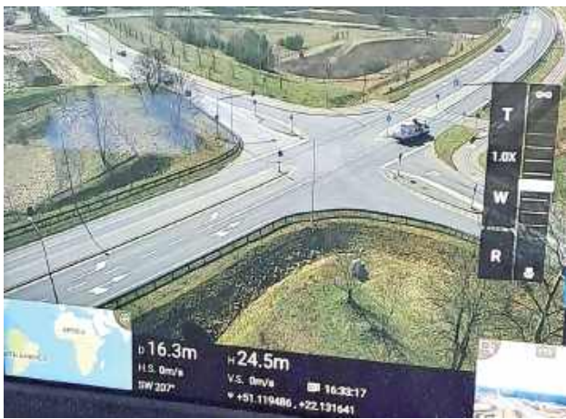
Dzięki użyciu drona policjanci mogą sprawdzać z dużej odległości, ale jednocześnie z dużą precyzją, jak na drogach zachowują się kierowcy i wszystko rejestrują

Dzięki użyciu drona policjanci mogą sprawdzać z dużej odległości, ale jednocześnie z dużą precyzją, jak na drogach zachowują się kierowcy. Dodatkowo zachowania kierujących są rejestrowane, a informacje bezzwłocznie przekazywane do najbliższego patrolu ruchu