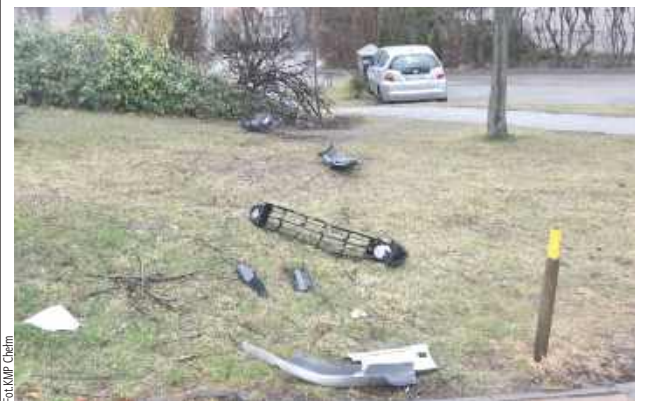
Przejechał na wprost przez rondo, uszkadzając przy tym infrastrukturę drogową

Lublin: Nietrzeźwy 80-latek pijany rajd zakończył, przejeżdżając wprost przez rondo.