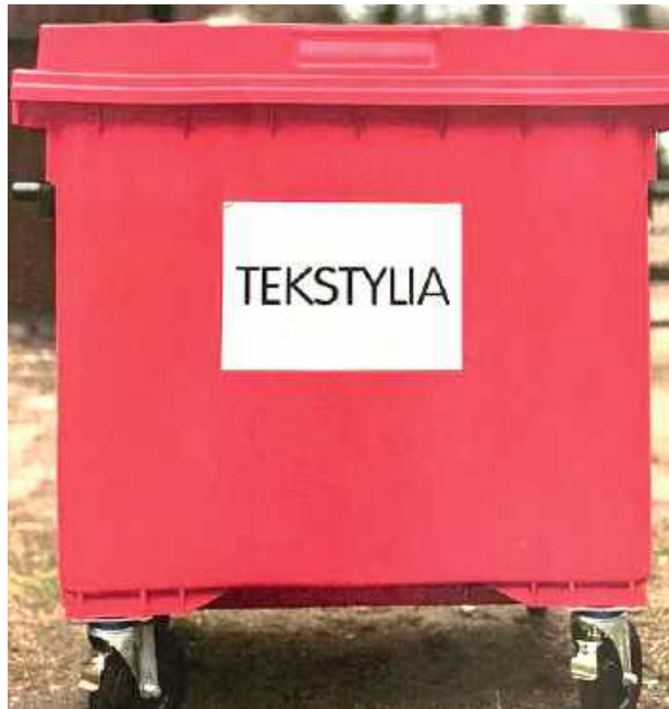
Takie pojemniki pojawiły się w Poniatowej. To prosty i szybki sposób na pozbycie się zużytych tekstyliów

Tekstylia wystawić należy w półprzezroczystych workach,