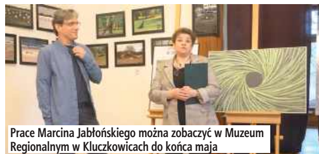
Prace Marcina Jabłońskiego można zobaczyć w Muzeum Regionalnym w Kluczkowicach do końca maja

No i są przywiązane do jednego miejsca, nie da się ich przenieść. - Festiwale land-art są organizowane po to, żeby ludziom pokazać, że można tworzyć, wychodząc w przestrzeń otwartą, wszędzie tam, gdzie się znajdujemy - wyjaśnia nasz bohater. Organizator danego festiwalu wyznacza miejsce, w którym on się odbędzie, z kolei zadaniem uczestników jest wykonanie tam pewnych działań artystycznych zgodnie z wyznaczonymi regulami.