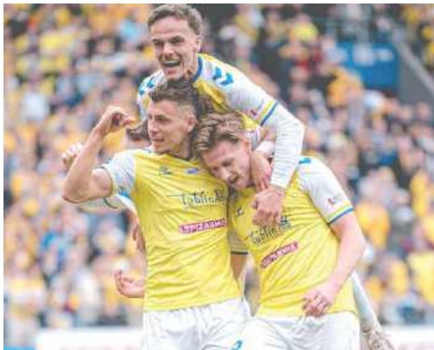
Żółto-biało-niebiescy utrzymali się w PKO BP Ekstraklasie