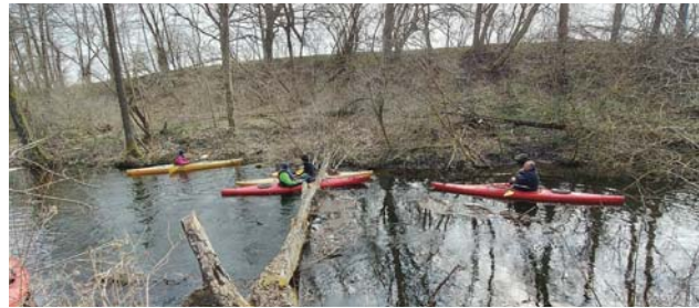
Sptyw Kilwatera rzeką Dajna

Klub to nie tylko kajakarze, ale również żeglarze. Pierwszy klubowy rejs został zorganizowany na przełomie kwietnia i maja 2007 roku. Trasa przebiegała w większości szlakiem jezior mazurskich. Załoga wypłynęła z miejscowości Bystry koło Giżycka i skierowała się na południe, by po kilku dniach, zwiedzając po drodze Mikołajki oraz przepłynąwszy jezioro Śniardwy, dopłynąć do Pizsa. Następnie, płynąc na północ przez Sztynort, jego uczestnicy dotarli do Węgorzewa, by finalnie powrócić do Bystr.