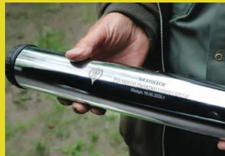
Wmurowanie aktu erekcyjnego pod rzeźbę jelenia szlachetnego