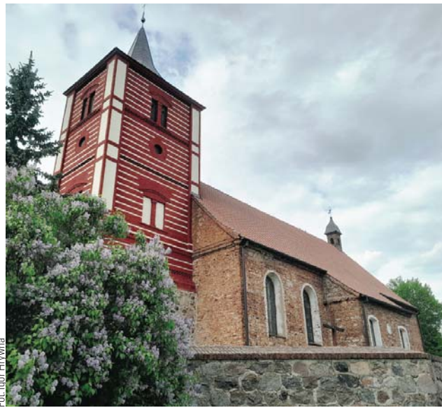
Kościół w Bieniewie z 1798 roku

Najdłuższym szlakiem rowerowym w naszym regionie jest warmińsko-mazurski odcinek liczący około 2000 kilometrów drogi rowerowej Green Velo, która wiedzie przez pięć województw: warmińsko-mazurskie, podlaskie, lubelskie, podkarpackie i świętokrzyskie. U nas liczy sobie ona 384 kilome-