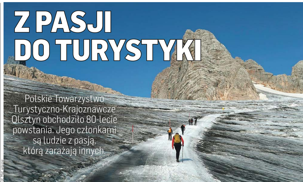
Jedna z zagranicznych wypraw górskich klubu Grań

Polskie Towarzystwo Turystyczno-Krajoznawcze Olsztyn obchodziło 80-lecie powstania. Jego członkami są ludzie z pasją, którą zarazają innych.