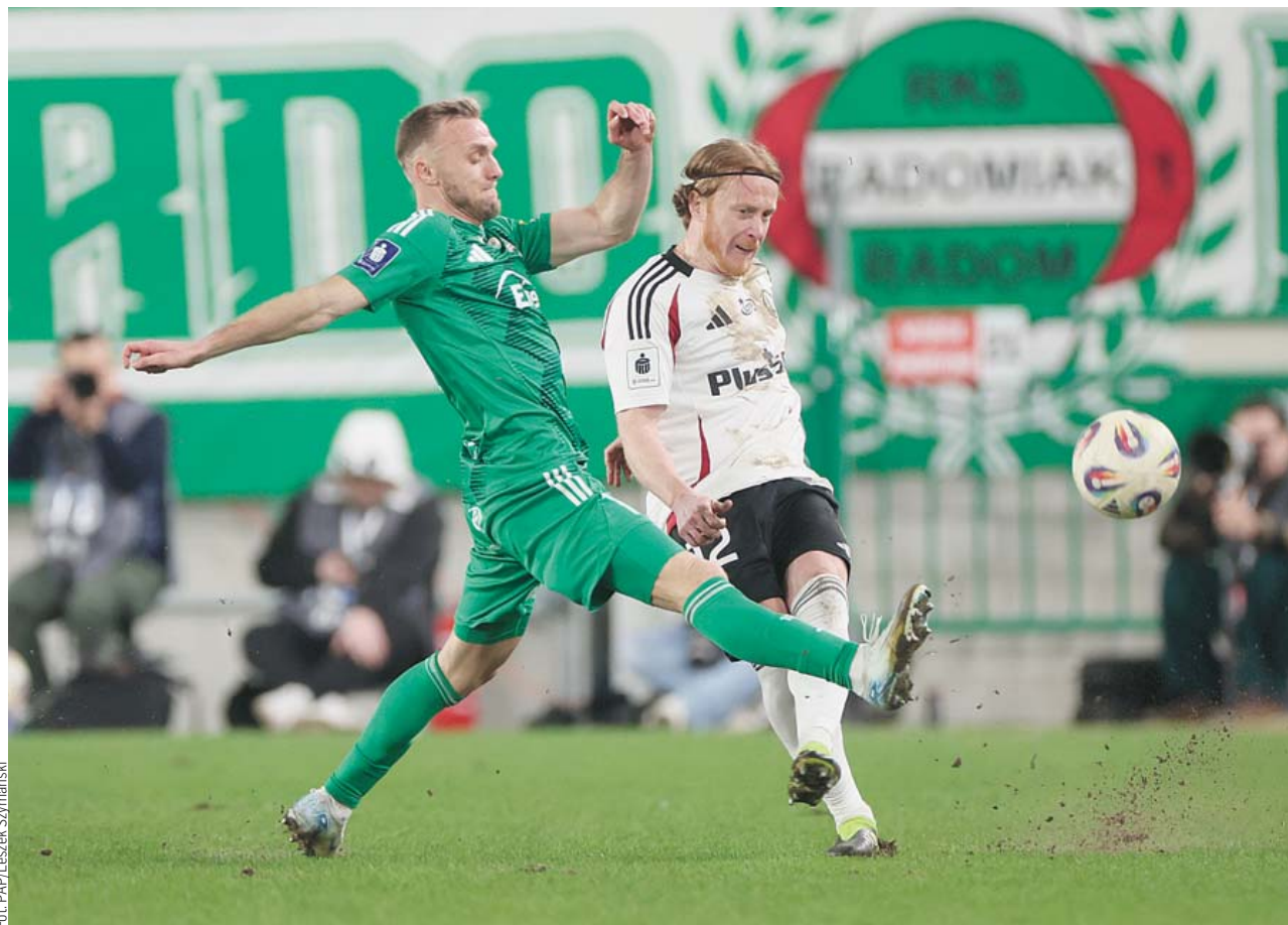
Legia, która jeszcze niedawno była w strefie spadkowej, w sobotę powalczy o udział w eliminacjach Ligi Konferencji

Stołeczny zespół musi pokonać u siebie Motor Lublin oraz liczyć na porażki GKS z Pogonią w Szczecinie i Zagłębia (z którym ma gorszy bilans bezpośrednich meczów) w Białymstoku.