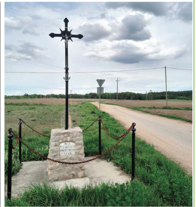
Krzyż postawiony w 1966 roku, na 1000-lecie chrztu Polski

Oczywiście do wyboru jest mnóstwo krótszych tras. Można sobie zresztą samemu jakąś wytyczyć. Ja tak z reguły robię. Wypatruję sobie coś ciekawego, co bym chciał zobaczyć,