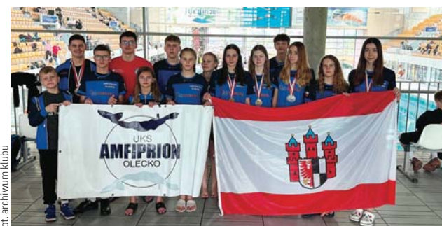
W Szczecinie pływacy z Olecka aż 18 razy stanęli na podium MP