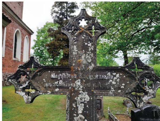
Krzyż na cmentarzu w Opinie

Tym tekstem rozpoczynamy cykl publikacji o trasach rowerowych, ale także ciekawych miejscach, które można zwiedzać pieszo.