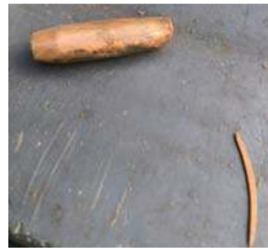
Pocisk który przeszył kobietę na wylot został znaleziony na sąsiedniej posesji w Przyszowie koło Kroczyca

Dopiero później prokuratura zdecydowała się sprawdzić wersję która krążyła po okolicy, że strzelacem mógł być ksiądz z miejscowej parafii, też myśliwy. Po naszych pytaniach o ten wątek sprawy, zdecydowano się zabezpieczyć broń księdza. Ten przesłuchany w sprawie zaprzeczył, aby tego dnia był na polowaniu, aby strzelał. Badania jego broni nie wykazały, aby zabezpieczony pocisk 7,82 znaleziony na posesji obok, został wystrzelony z jego broni. Kobieta została postrzelona w Przybyszowie pociskiem typu „Winchester” o średnicy