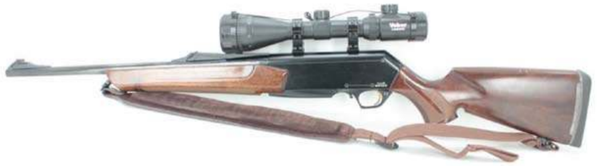
SZTUCER BROWNING BAR 2

W artykule: „Kto postrzelił kobietę w Przybyszowie? Śledztwo w martwym punkcie. Prokuratura sprawdza plotki o strzelajactw