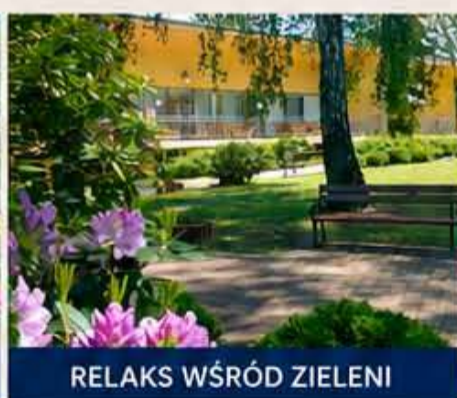
RELAKS WŚRÓD ZIELENI