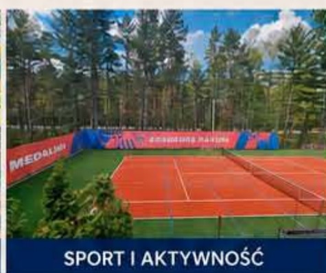
SPORT I AKTYWNOŚĆ