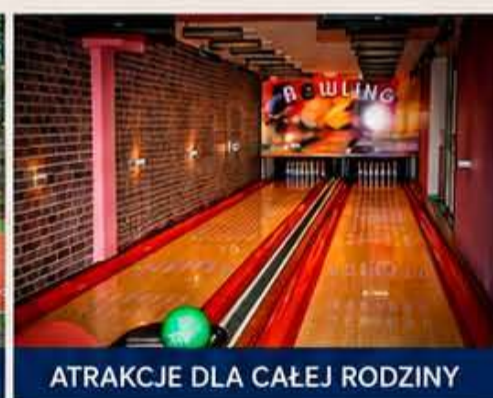
ATRAKCJE DLA CAŁEJ RODZINY