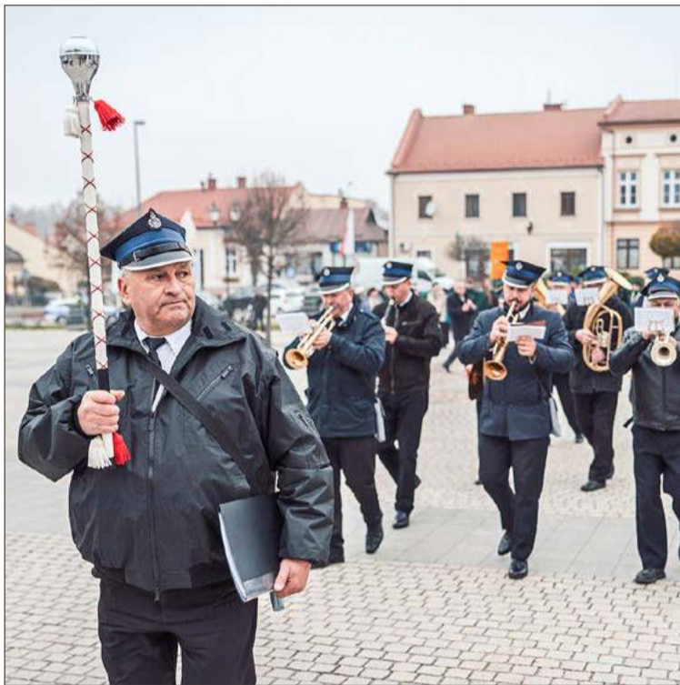
Podczas imprezy wystąpi m.in. Orkiestra Dęta OSP Pilzno.

- A potem będzie część dla dzieci. Będą dmuchańce, ściana wspinaczkowa, zabawy z animatorami, stare wozy strażackie, a nawet dawna sikawka - wymienia Zbigniew Zyznar.