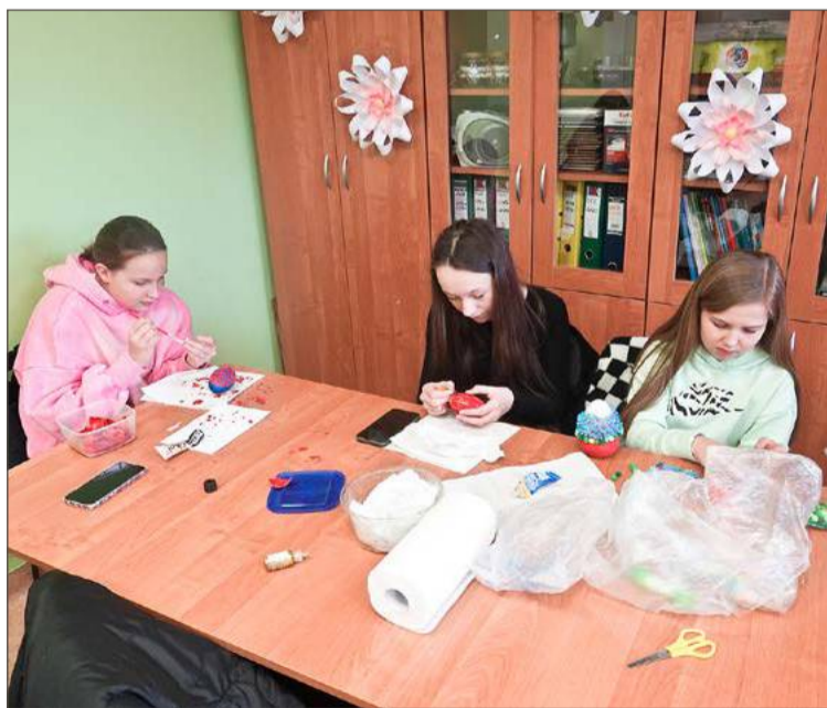
Uczniowie podstawówek w trakcie tworzenia pisanek.

Gminny Konkurs na Pisanek Wielkanocną i Plastykę Obrzędową w kategorii stowarzyszeń (plastyka obrzędowa) zwyciężyło Koło Gospodyń Wiejskich z Jodłowej Górnej, drugie było KGW z Dzwonowej, a trzecie KGW Wisowianie z Wisowej. W kategorii grup nieformalnych (plastyka obrzędowa