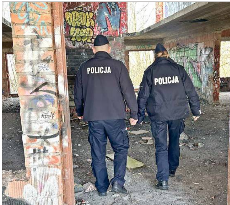
Mundurowi sprawdzają wskazane na mapie miejsca.

I dodają, że do spotkania z młodym człowiekiem, który złamał prawo doszło właśnie w trakcie realizacji zadań związanych z Krajową Mapą Zagrożeń Bezpieczeństwa. Policjanci za jej pośrednictwem dostali informację o tym, że przy ulicy Kwiatkowskiego często gromadzą się młodzi ludzie i biesiadują do późna w nocy, zakłócając ciszę i wywołując w okolicznych mieszkańcach poczucie zagrożenia. We wskazanym miejscu mundurowi zauważyli młodego mężczyznę, który na ich widok zaczął zachowywać się nerwowo. Funkcjonariusze podjęli interwencję. Okazał się nim, 21-letni mieszkaniec Dębicy.