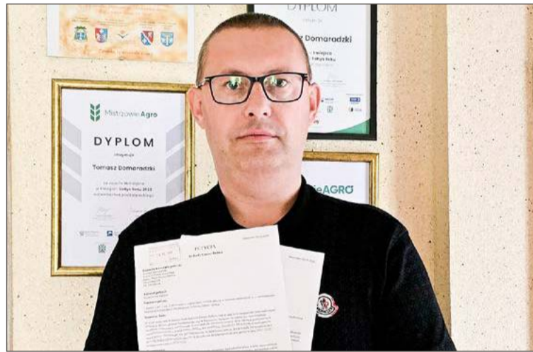
Sołtys i radny ze Stasiówki petycję złożył drugi raz.