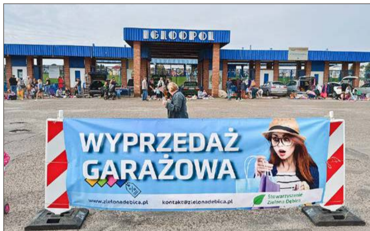
Do czasu rozpoczęcia robót wydarzenie organizowane będzie na parkingu przed Stadionem Miejskim, gdzie mecze rozgrywa Igloopol.

Maciej Małozieć miał jej powiedzieć, że wydarzenie nadal ma być organizowane na parkingu przy MOSiR, a jak ruszą tam roboty budowlane, to będą się zastanawiać, co dalej.