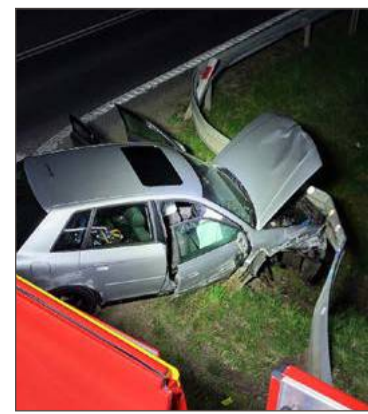
Audi uderzyło w bariery.