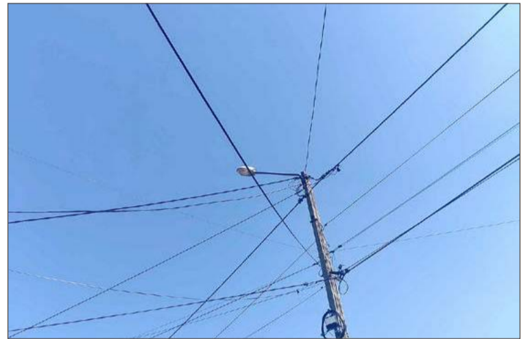
Chodzi o tę jedną lampę, która oświetla ulicę Kraszewskiego.

tłumaczy, że wieczorem na ulicy jest bardzo nieprzyjemnie, robi się z niej zaułek, w który strach wchodzić. To okolica chętnie odwiedzana przez młodzież, by na przykład zapalić papierosa, ale i uraczyć się