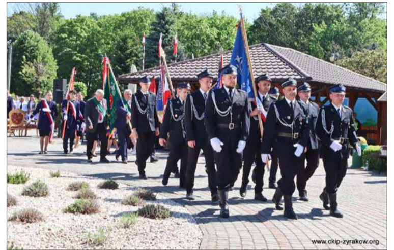
Obchody Dnia Strażaka to w gminie zawsze święto.