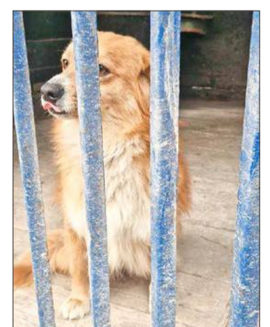
Psy z gminy Żyraków trafiają do schroniska w Bobrowej.

Na realizację programu opieki nad bezdomnymi zwierzętami gmina Żyraków ma zamiar przeznaczyć w tym roku 81 tys. zł, z czego największa część - 60 tys. zł zostanie wydane na opiekę nad zwierzętami umieszczonymi w schronisku w Bobrowej.