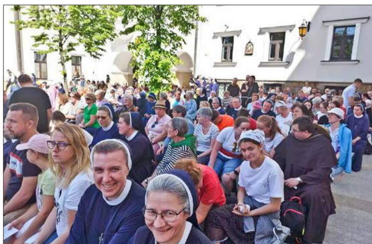
Pielgrzymka kończy się mszą św. w sanktuarium w Tuchowie.