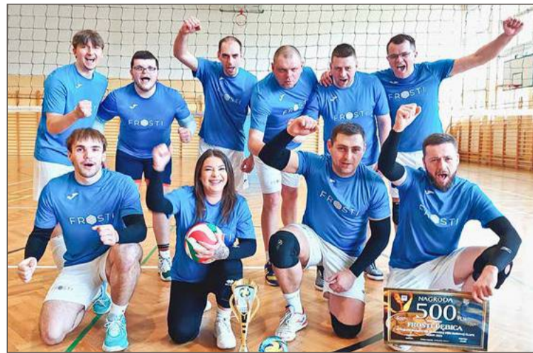
Z wywalzonego tytułu mistrzowskiego cieszyła się ekipa Frosti Dębica.