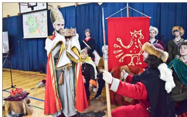
W Mechaniku wystąpiła Wataha Rycerska oraz uczniowie szkoły.