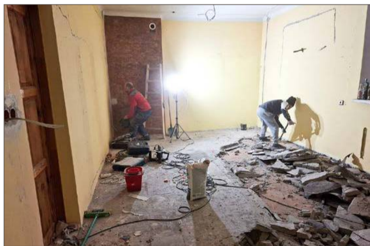
Prace przy remoncie biblioteki trwały około dwóch miesięcy.

Prezes twierdzi zresztą, że to nie pierwszy raz, kiedy ochotnicy z tej jednostki we współpracy z samorządem pracują na rzecz mieszkańców swojej miejscowości. Podpowiada, że wystarczy przejrzeć ich facebookowy profil, by się o tym przekonać.