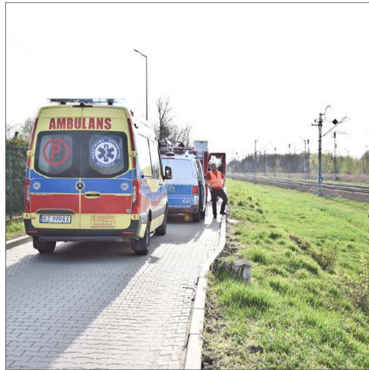
Mężczyzna doznał stosunkowo niegroźnych obrażeń.