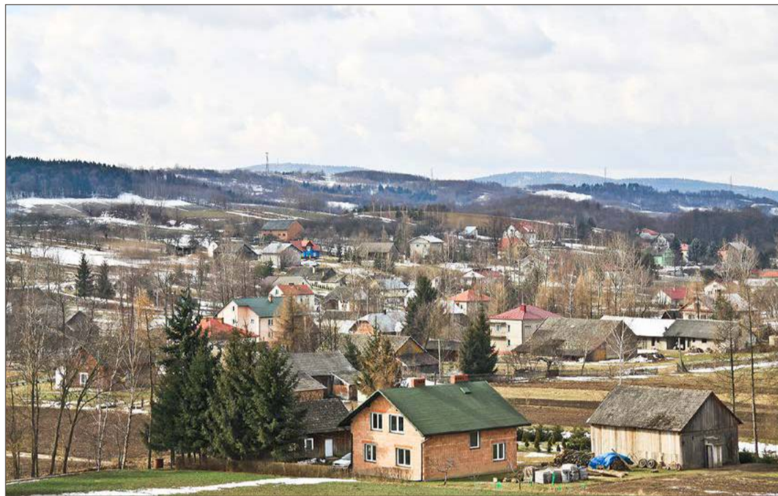
Wieża będzie górowała nad Januszkowicami. Ustawiona zostanie na tzw. Działach.

Zamierzenie jest proste - władze chcą, by w gminie było miejsce, gdzie można wyskoczyć na chwilę po południu, czy w weekend. Być może