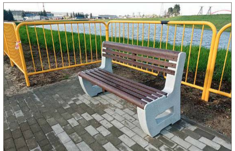
Ławki wykonane z tworzywa z recyklingu mają być odporne na wandalii.

- Nigdy wszystkim nie dogodzimy. Domyślam się, że gdybyśmy je ustawili w drugą stronę, to tyle samo osób narzekałoby pewnie