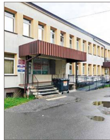
Obecnie budynek nie jest dostępny dla niepełnosprawnych.

Remonty mają poprawić dostępność budynków dla osób starszych i niepełnosprawnych.