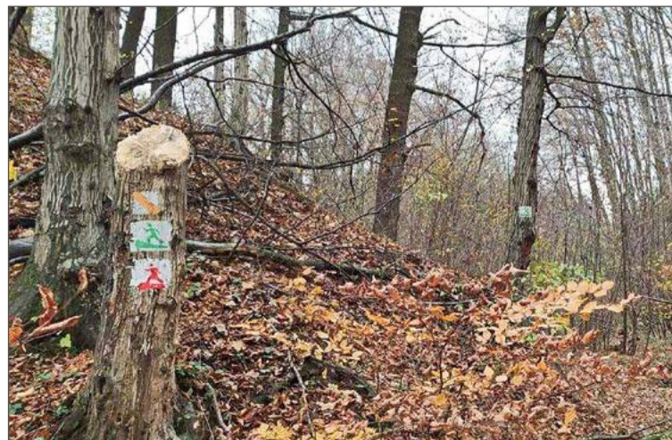
Biegacze nadal czekają na poprawę trasy czerwonej w lesie na Wolicy.