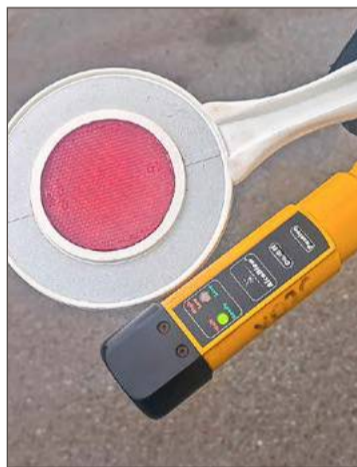
Zielona kontrolka oznacza, że kierowca jest trzeźwy.

Ze świadomością, że z uwagi na swój stan nie może prowadzić samochodu, mężczyzna opuścił komendę. Całą sytuację widział jeden z funkcjonariuszy Wydziału Ruchu Drogowego, który po zakończonej pracy właśnie zdawał służbową broń.