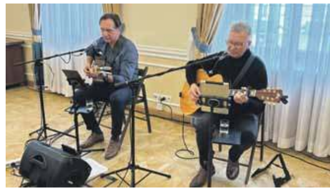
Dobrze, że kolejne pokolenia zapoznają się z twórczością światowego barda - Leonarda Cohena.