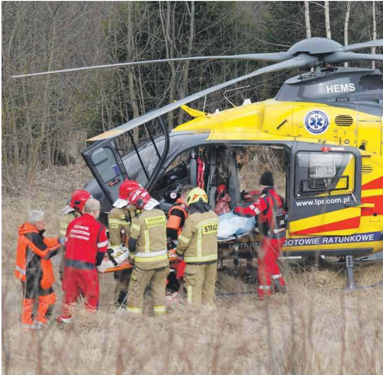
Mimo wysiłków lekarzy, 83-latka zmarła w szpitalu.