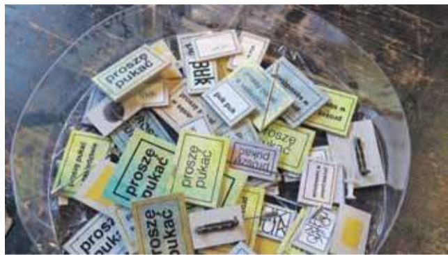
Pukać, czy nie pukać, oto jest pytanie.

Po pierwsze trzeba zachcieć zapukać. Jest opcja zapukania lub niezapukania. Teoretycznie jest możliwość pukania pod przymusem. Są jeszcze drzwi. Czy to my je wybraliśmy, czy to drzwi wybrały nas i nakazują - zapukaj.