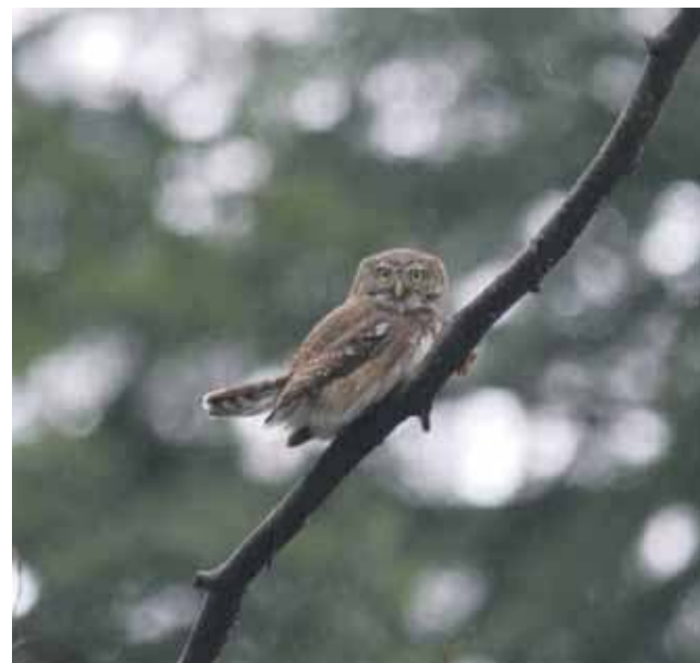
Sówczkę można spotkać w okolicach Rabki.

W Polsce można obserwować niemal wszystkie gatunki sów, które występują w Europie. W naszych lasach gnieździ się też największy przedstawiciel tego rzędu ptaków - puchacz. Choć ten gatunek jest bardzo rzadki, to właśnie w naszym regionie można go obserwować w kilku miejscach. Puchacz zadomowił się w Pieninach. W tym rejonie gnieździ się aż pięć par tych gigantycznych sów. Według Stanisława Brońskiego z Tatrzańskie Parku Narodowego, badającego karpaccie sowy, o tym szczególnie zamilowanemu puchaczowi do Pienin mogła zdecydować bliskość Zbiornika Czorszyńskiego.