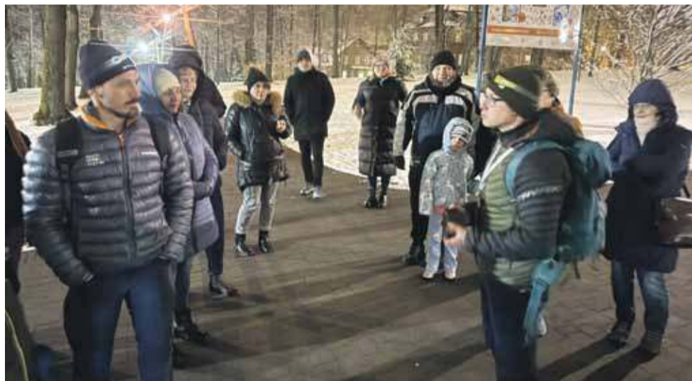
Sobotnia „Noc sów” w Rabce.