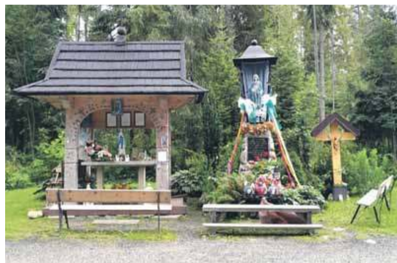
Wokół kapliczki wyrosły ławeczki, ołtarz do nabożeństw, krzyż.