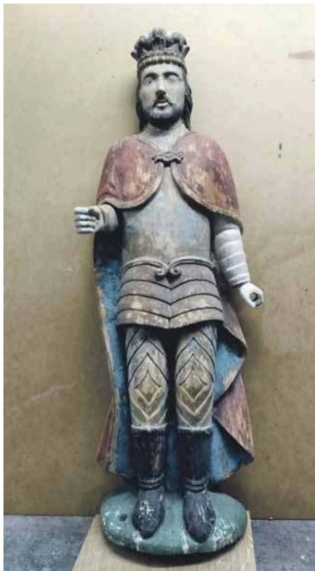
Rzeźba św. Floriana przed renowacją.

- Chłopaki pracowali do 23 godziny, kładąc np. kable elektryczne, ale nie tylko - mówi naczelnik OSP i wyjaśnia, że wśród strażaków są doskonali