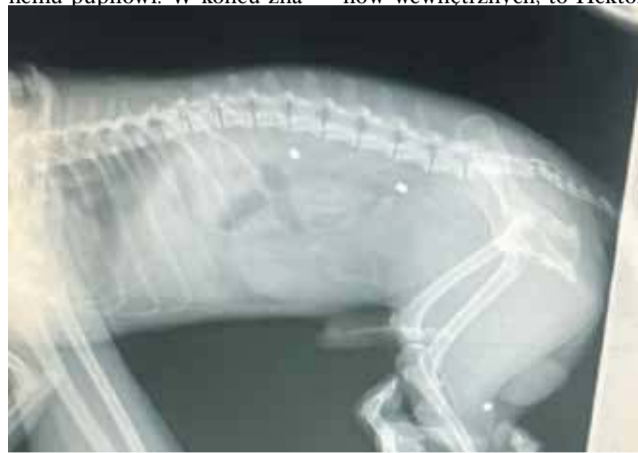
Hektor miał dużo szczęścia - przeżył.

lazły gabinet w Nowym Targu, który zgodził się przyjąć pieska.