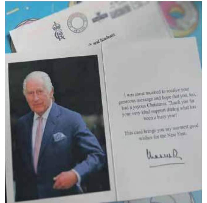
pp Karta z życzeniami od króla Karola III.

Brytyjski monarcha dziękuje za życzenia. Pisze, że był poruszony listem i ma nadzieję, że również zakopiańscy uczniowie mieli wspaniałe święta. Załącza również życzenia wszystkiego dobrego w Nowym Roku.