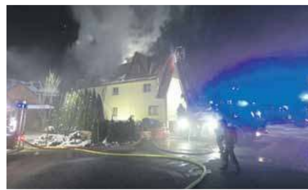
Pożar wybuchł na poddaszu pensjonatu w Białce Tatrzańskiej.