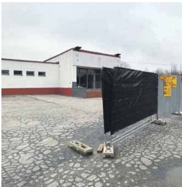
Nowa kaplica będzie gotowa za niespełna dwa lata.

W przetargu startowały trzy firmy. Najkorzystniejsza oferta wykonawcy ze Skawy opiewała