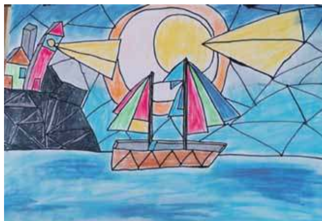
Dzieci i kubistyczna wyobraźnia.