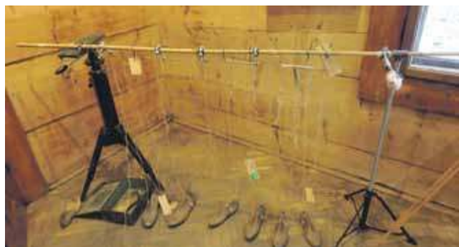
Kto odgadnie co to takiego?