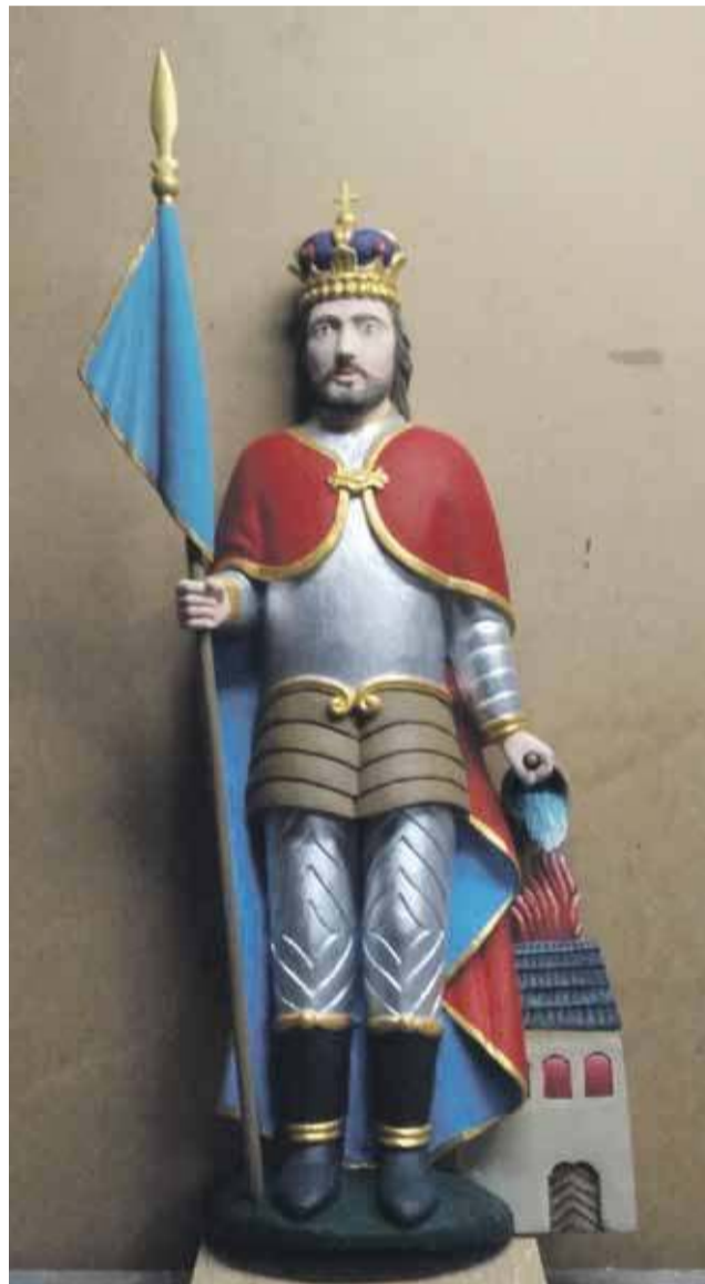
Rzeźba św. Floriana po renowacji.

na podstawie porównania układu kompozycyjnego, identycznie rozwiązanej atrybucji, takiej jak: strój, chorągiew cebrzyk, a także sposobu rzeźbiarskiego, opracowania detali twarzy, dłoni i draperii. - To z tego wszystkiego można było wnioskować o niewątpliwym autorstwie rzeźby.