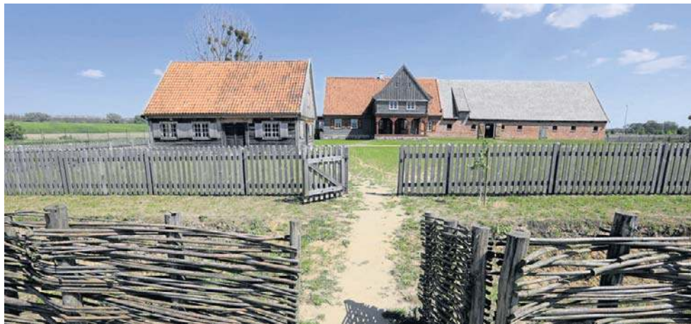
Skansen w Wielkiej Nieszawce znajduje się w najbardziej ludnej części gminy

Na czym polega fenomen Wielkiej Nieszawki? Chodzi przede wszystkim o wielkie połacie lasu, którego znaczną część obejmuje poligon wojskowy.