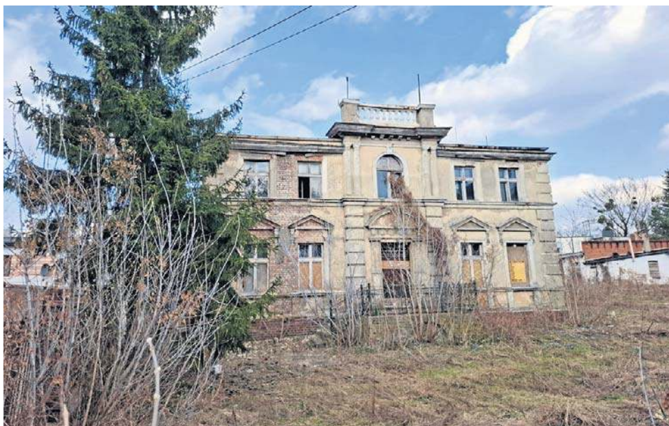
Tak prezentuje się wpisana do rejestru zabytków willa Jaugschów oraz jej otoczenie

Dotarli do nas niepokojące sygnały o tym, że budynek nie jest odpowiednio zabezpieczony i pojawili się w nim bezdomni