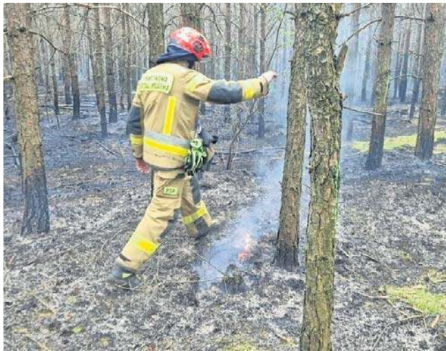
W akcji gaśniczej uczestniczyło 13 zastępów straży pożarnej

opr. Marcin Gołembiewski marcin.golombiewski@polskapress.pl