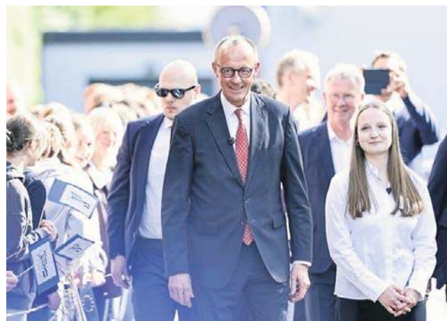
Merz spotkał się z uczniami w Marsbergu. Ostrzegł przed eskalacją na Bliskim Wschodzie i wezwał Unię Europejską do zdecydowanych działań wobec Ukrainy

Zaapelował przy tym do Niemiec o przejęcie wiodącej roli