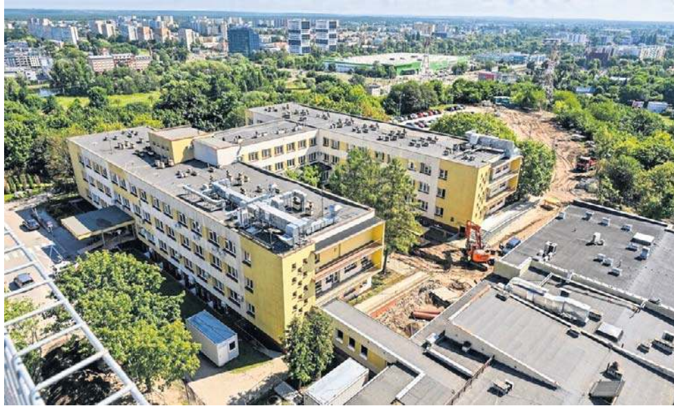
Do czerwca powinna zapadnąć decyzja dotycząca kontynuacji rozbudowy szpitala

Na początku listopada ubiegłego roku w wykazie prac legislacyjnych i programowych Rady Ministrów pojawił się projekt uchwały zmieniającej uchwałę dotyczącą „Wieloletniego programu medycznego-rozbudowa i modernizacja