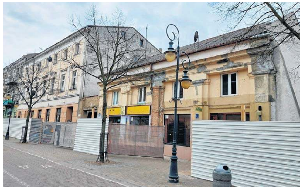
Kamienice przy ul. 3 Maja 4 i 3 Maja 6 są już remontowane

Do zadań wykonawcy należy m. in.: remont, przebudowa, termomodernizacja budynków. Dodajmy, że kamienica przy ul. 3 Maja 4 zostanie nabudowana. Do jego zadań należy też częściowa rozbiorówka oficyny mieszkalnej i zmiana sposobu jej użytkowania na cele gospodarcze oraz budowa i przebudowa zewnętrznej infrastruktury technicznej. Oprócz remontu kamienic, firma wykonująca zadanie, zagospodaruje także tereny zielone: krzewy i trawy ozdobne np. tawuły gęstokwia-