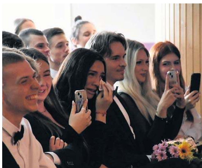
FOT. OLIVIA NOWAK