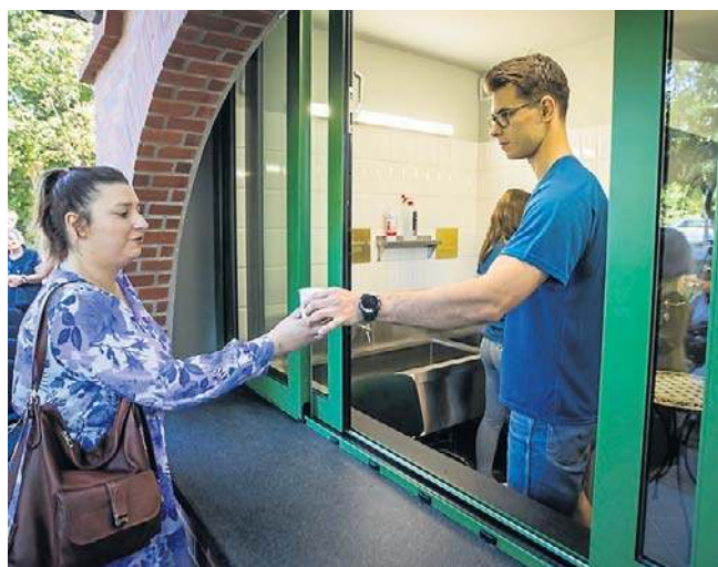
Pijalnię wody w Lesie Gdańskim otwarto we wrześniu 2023 roku