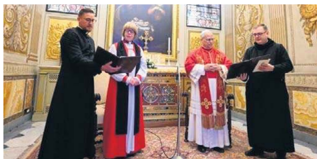
Papież i prymas Kościoła Anglii modlili się razem w kaplicy Urbana VIII w Pałacu Apostolskim

Abp Canterbury powiedziała papieżowi: W dzisiejszym świecie jesteśmy wezwani do życia i głoszenia Ewangelii z nową jasnością. W obliczu nieludzkiej przemocy, głębokich podziałów i gwałtownych przemian społecznych musimy współpracować dla dobra wspólnego, budując zawsze mosty, nigdy mury, pamiętając, że najubożsi spośród nas są najbliżsi sercu Boga. PAP