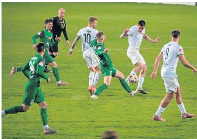
Zawodnicy Olimpii przegrali ważny mecz z Wartą, ale cały czas są w grze o awans do Betclit 1. Ligi

Ta porażka kosztowała grudziądzki zespół spadek na trzecią pozycję w tabeli, ale cały czas są w grze o awans.