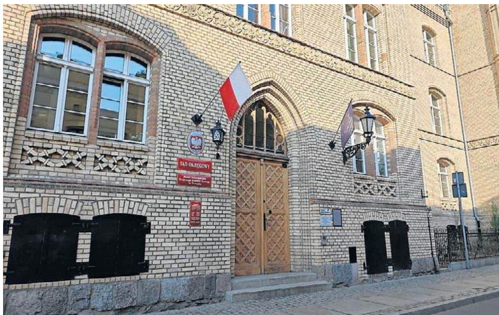
Wyrok w sprawie zabójstwa konkubenta orzekł Sąd Okręgowy w Toruniu. To 12 lat więzienia