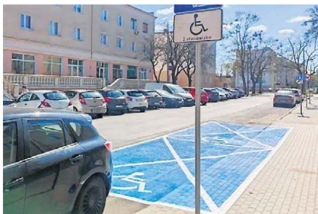
Mieszkańcy Kapuścisk doczekali się parkingu dla osób z orzeczeniem o niepełnosprawności

- Teren wokół bloku, który dzierżawi Wspólnota Mieszkaniowa jest nieuwardzony a sa-