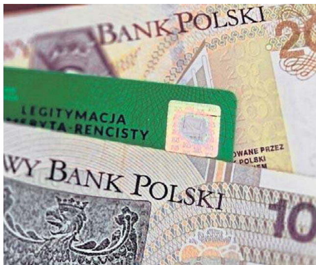
W województwie kujawsko-pomorskim przeliczonych zostało 12,3 tys. emerytur czerwcowych

Zdecydowana większość tzw. emerytów czerwcowych zyskała na ponownym przeliczeniu świadczeń. - Cieszę się bardzo, bo co miesiąc mam o niemal 200 złotych więcej. W końcu sobie o nas przypominano i ZUS nam oddaje to, co nam niesłusznie zabrano. Na emeryturę przeszedłem w czerwcu 2018 roku. Gdybym wiedział, że wtedy to był niekorzystny miesiąc, to bym poczekał do lipca, a nawet do końca 2018 roku. W moim zakładzie