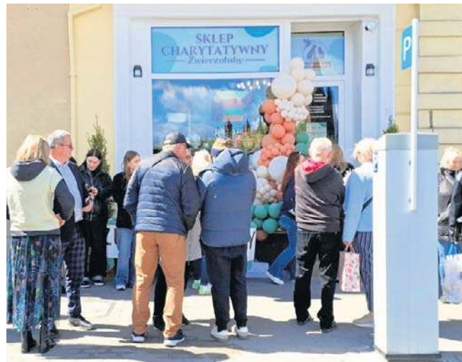
Pierwszy w Inowrocławiu pełnowymiarowy sklep charytatywny mieści się w kamienicy przy ul. Dworcowej 1

Anna Grochowina anna.grochowina@polskapress.pl