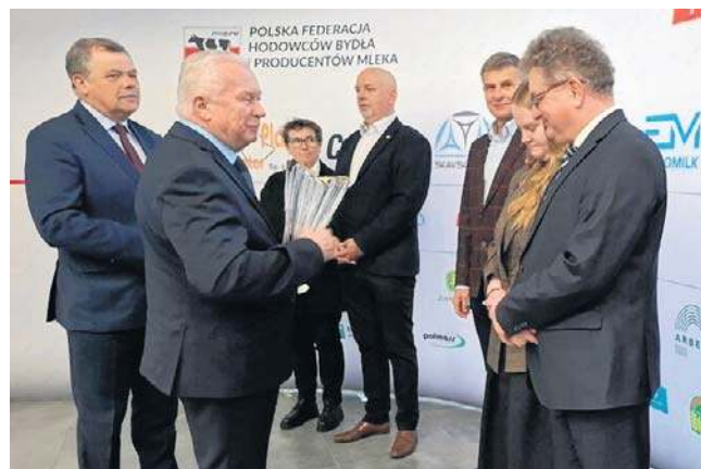
Wręczenie nagród w kategorii najlepsze obory powyżej 500 sztuk w Kujawsko-Pomorskiem

- Jako jedyny kraj zwiększamy produkcję. O dwa - trzy procenty - ale ona stale rośnie - dodał Hądzlik. - Gdy wchodziliśmy do Unii Europejskiej, wielkość naszej produkcji wynosiła ok. 7,5 mld kg mleka, a dziś jest dwa razy większa.