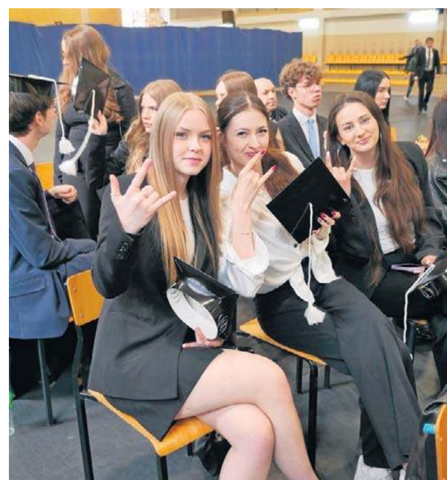
FOT. ZESPÓŁ SZKÓŁ SAMOCHODÓWKICH