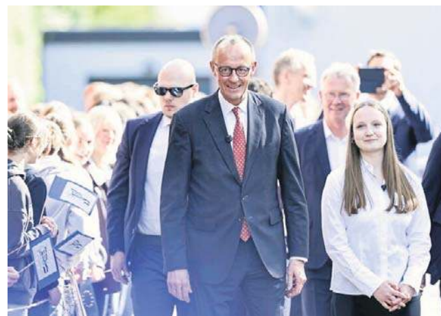
Merz spotkał się z uczniami w Marsbergu. Ostrzegł przed eskalacją na Bliskim Wschodzie i wezwał Unię Europejską do zdecydowanych działań wobec Ukrainy

Zaapelował przy tym do Niemiec o przejęcie wiodącej roli