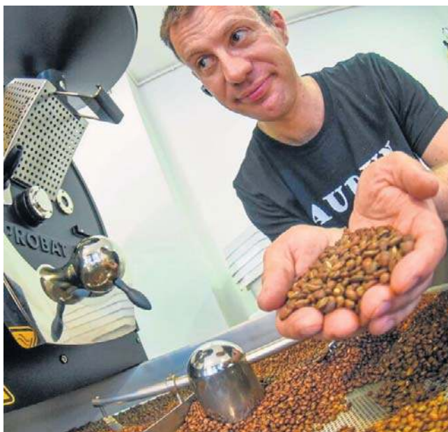
O Audunie pisaliśmy już, gdy w 2015 roku został mistrzem świata w wypalaniu kawy

Niedawno w San Salvador (stolica Salwadoru w Ameryce Środkowej) odbył się prestiżowy konkurs Global Coffee Awards - World Championship Competition. Przysłano w su-