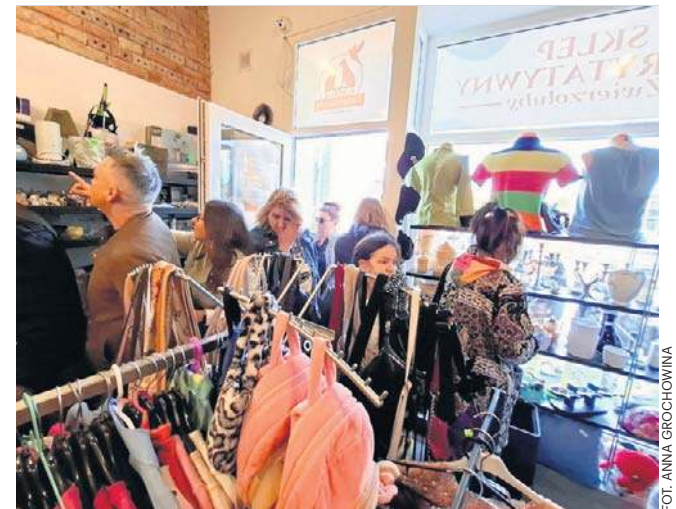
Cały dochód ze sprzedaży zasila działania fundacji na rzecz ratowania zwierząt - leczenia, interwencji i adopcji

- Nasz sklep nie mógłby powstać bez pomocy osób empatycznych, o dobrych sercach,