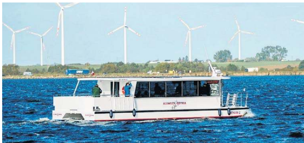
Rejs jednostką pozwoli ominąć zatłoczone trasy lądowe

Dodajmy, tramwaj wodny zbudowała firma Aluminex Gdyń. Tani nie był, bo samorządy powiatu puckiego wyłożyły na niego ok. 3,1 mln zł. Choć niecałość, bo 1,9 mln udało się pozys-