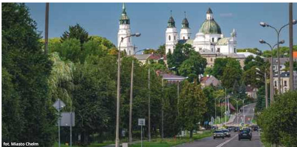
fol. Miasto Chełm

Z odpowiedzi mieszkańców wynika, że ilość zieleni w Chełmie jest oceniana najczęściej jako niewystarczająca lub jedynie dostateczna. Wskazywano przede wszystkim na potrzebę zazielenienia centrum miasta, m.in. Placu Łuczowskiego, deptaka przy ul. Lwowskiej czy