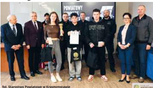
Starostwo Powiatowe w Krasnymstawie

W eliminacjach udział wzięły drużyny ze szkół ponadpodstawowych z terenu powiatu. I Li-