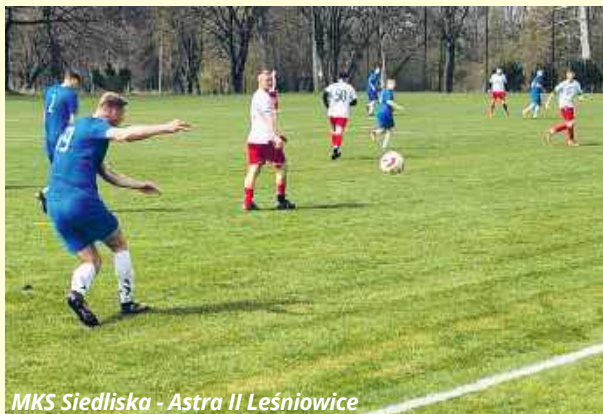
MKS Siedliska - Astra II Leśniowice