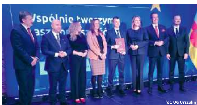
fol. UG Urszulín

Pozyskane fundusze pozwolą na realizację prac budowlanych w dwóch miejscowościach. Zgodnie z założeniami projektu, w samym Urszulínie – na terenach położonych za miejscowym stadionem – wybudowana zostanie nowa sieć wodociągowa o długości 637 metrów oraz infrastruktura kanalizacyjna wraz z prze-