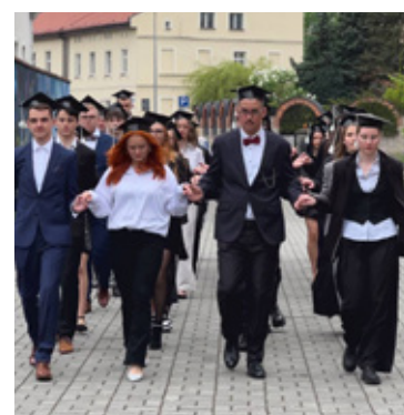
Polonez w wykonaniu uczniów z LO w Wołowie.