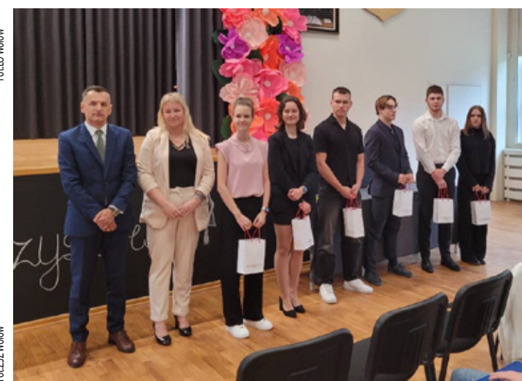
Wyróżnienia dla najlepszych LO w Brzegu Dolnym.