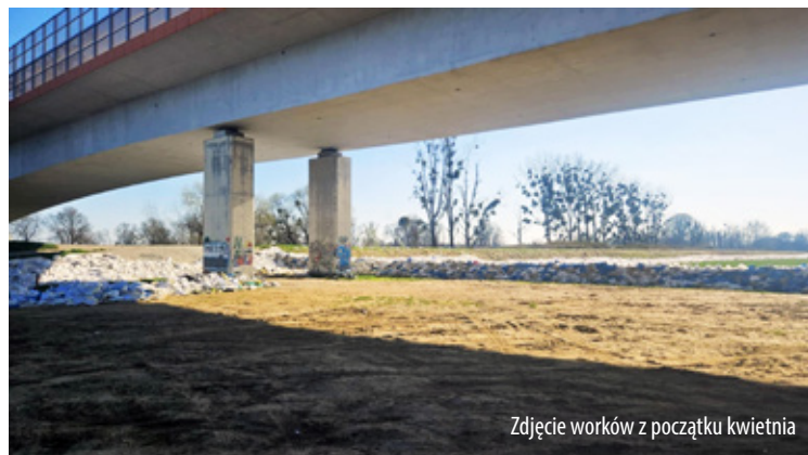
Zdjęcie worków z początku kwietnia

Zaniepokojeni mieszkańcy i lokalne media zaczęli pytać: kto odpowiada za usunięcie tych po-