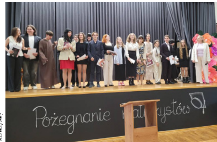
LO w Brzegu Dolnym na uroczystej gali.