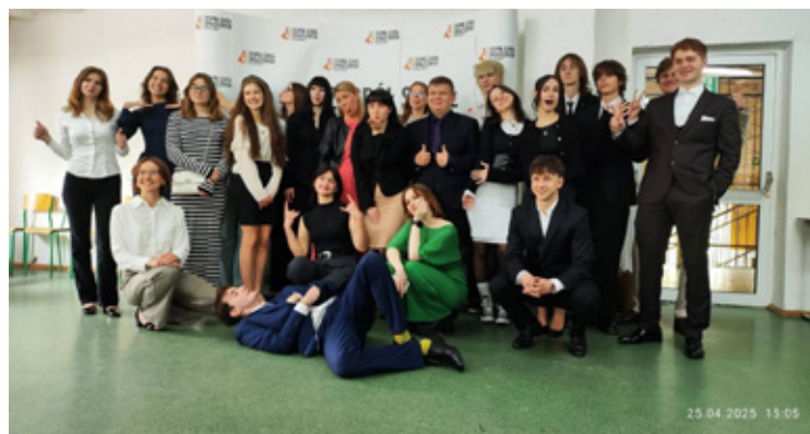
Pamiątkowe zdjęcia na zakończenie nauki w ZSS Wołów.