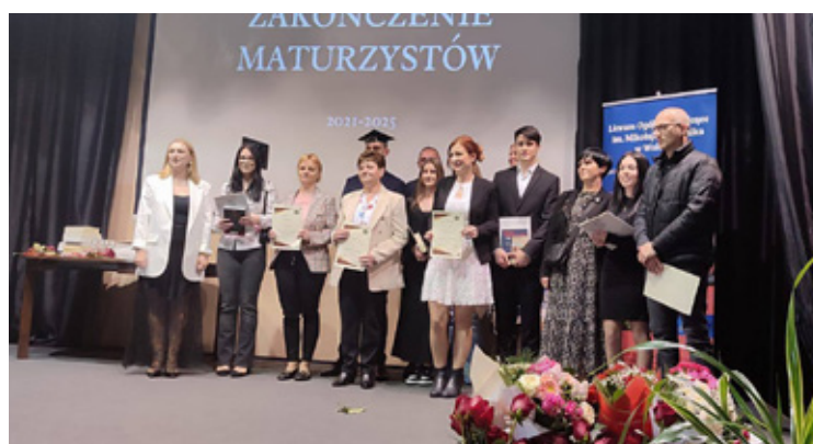
Do najlepszych uczniów powędrowały gratulacje.