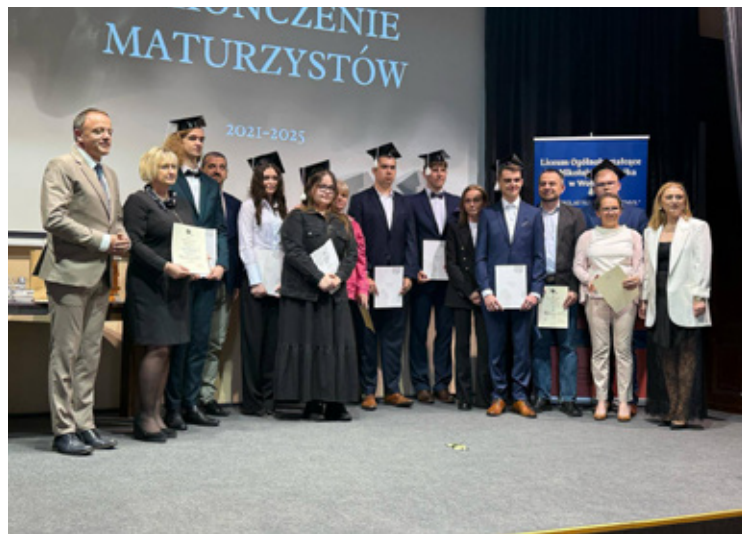
Uroczyste zakończenie roku szkolnego w wołowskim liceum.

W Zespole Szkół Społecznych w Wołowie uroczystość rozpoczęła się tradycyjnie od odśpiewania hymnu państwowego oraz przekazania sztandaru szkoły