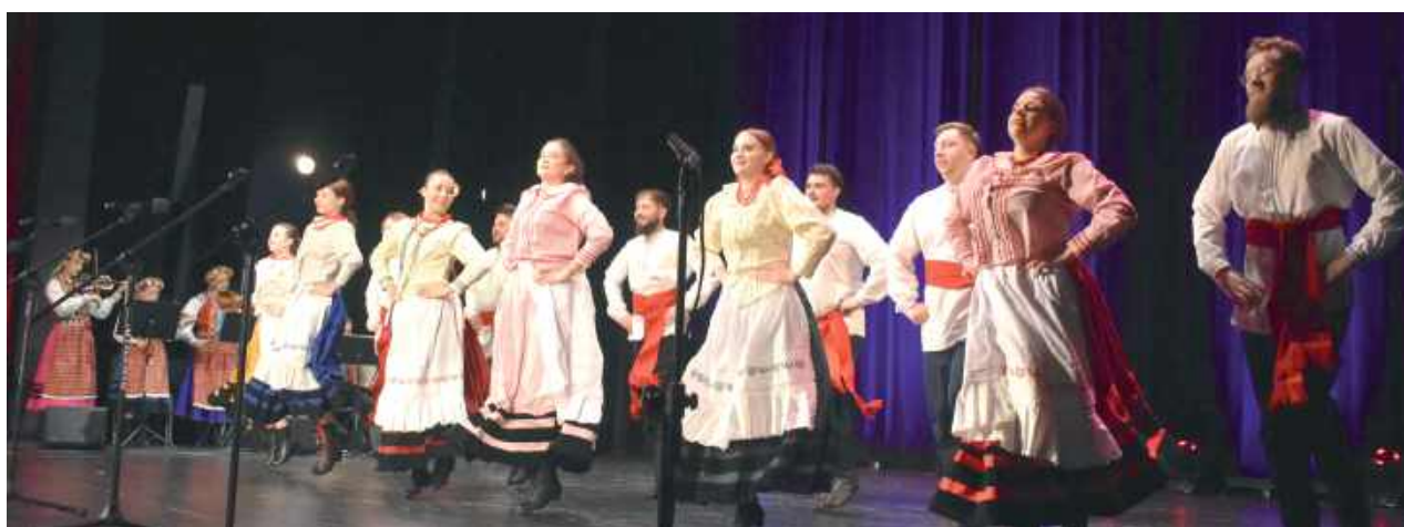
W Puławskim Ośrodku Kultury „Dom Chemika” zorganizowano koncert otwarcia, jak i zamknięcia. Mieszkańcy Puław chętnie podziwiali występ tancerzy z różnych krajów

Impreza, która jest organizowana od 2 lat cieszy się dużym zainteresowaniem mieszkańców. Jej rozpoczęcie tradycyjnie poprzedziła barwna parada zespołów w strojach ludowych, które przeszły ulicami miasta. Pochód wyruszył spod Pałacu Czartoryskich i kierował się w stronę Puławskiego Ośrodka Kultury „Dom Chemika”, gdzie zorga-