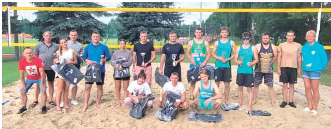
Pamiątkowe zdjęcie uczestników zmagania

W pierwszą sobotę sierpnia kompleks sportowy MOSiR przy al. Jana Pawła II w Parczewie stał się areną zmagania najlepszych plażowych duetów z regionu.