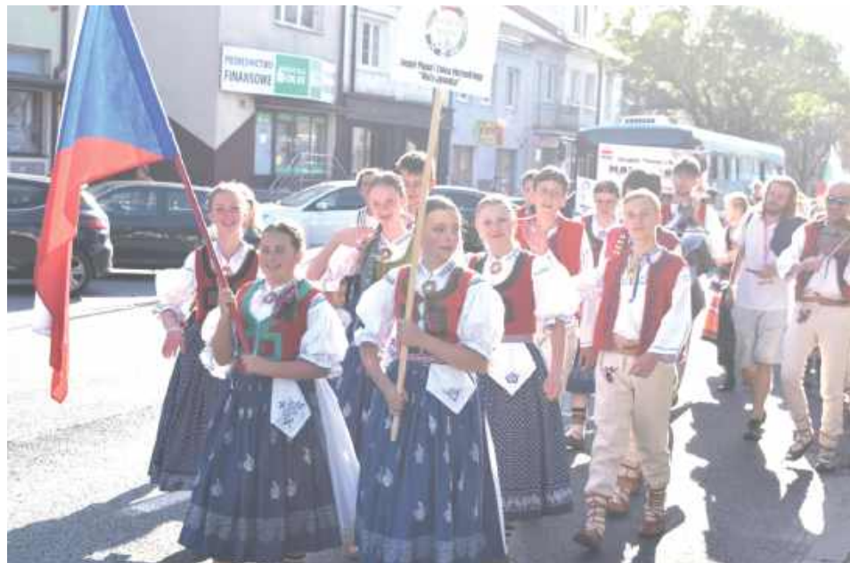
W tym roku do Puław przyjechało 8 zespołów z 2 kontynentów. Zawitali do nas przedstawiciele Czech, Słowacji, Węgier, Ukrainy, Bułgarii, Serbii i Egiptu

Barwna parada, muzyka, taniec i spotkanie wielu kultur – to wszystko można było zobaczyć podczas III edycji Międzynarodowego Dziecięcego Festiwalu Folklorystycznego World Wide Kids. Przez kilka dni zespoły z różnych regionów prezentowały swoje tradycje, zapraszając publiczność na koncerty.