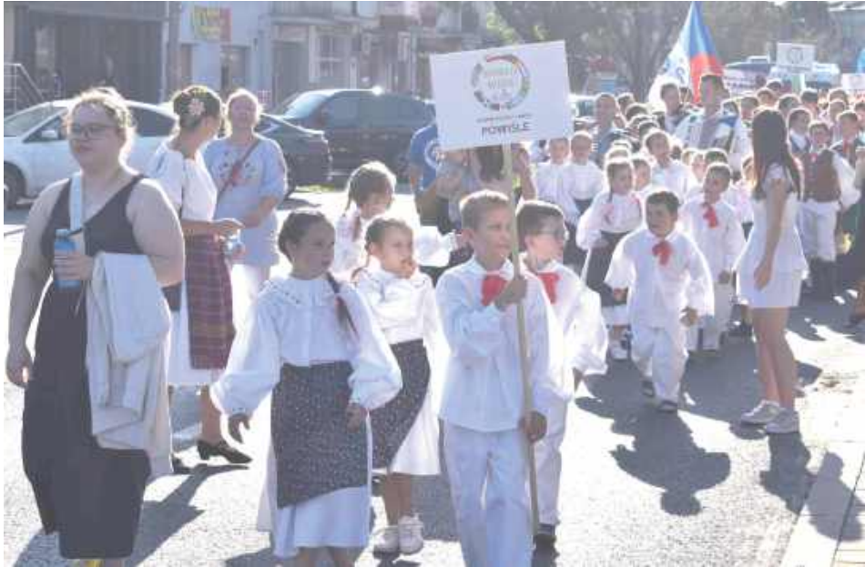
III edycja Międzynarodowego Dziecięcego Festiwalu Folklorystycznego World Wide Kids rozpoczęła się od kolorowego korowodu uczestników, którzy przemierzali puławskie ulice od Pałacu Czartoryskich ul. Czartoryskich, Piłsudskiego i Lubelską aż do POK Dom Chemika. Wśród nich byli członkowie Zespołu Pieśni i Tańca „Powiśle” im. Kazimierza Walczak „Mamci”