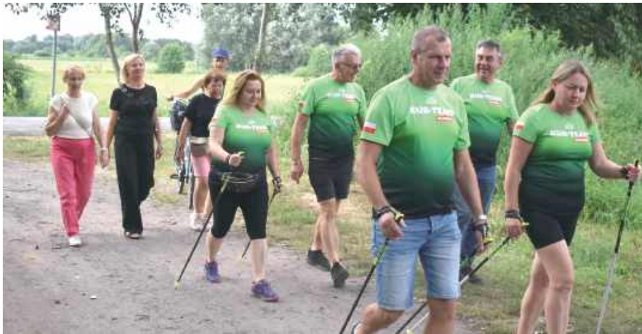
Sierpień to miesiąc trzeźwości. Nie ma więc lepszego czasu, by promować modę na trzeźwość

„Wiem, że wygrywam, bo nie nadużywam” – pod takim hasłem w pierwszą niedzielę sierpnia odbył się drugi Marsz Trzeźwości w Olesinie, który już na stałe wpisał się w kalendarz lokalnych inicjatyw społecznych. Wydarzenie promujące zdrowy i trzeźwy styl życia połączone było z aktywnością fizyczną, edukacją i integracją mieszkańców.