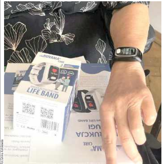
Na razie opaski dostało 15 starszych mieszkańców gminy. Ale w planach jest zakup kolejnych urządzeń

W miniony piątek 1 sierpnia w Gminnym Ośrodku Kultury w Końskowoli seniorzy z terenu gminy odebrali nowoczesne opaski bezpieczeństwa. Dzięki nim starsi mieszkańcy będą mogli czuć się bezpieczniej i w razie złego samopoczucia lub zagrożenia życia powiadomić odpowiednie służby, które ruszą z pomocą. Do seniorów trafiło 15 urządzeń.