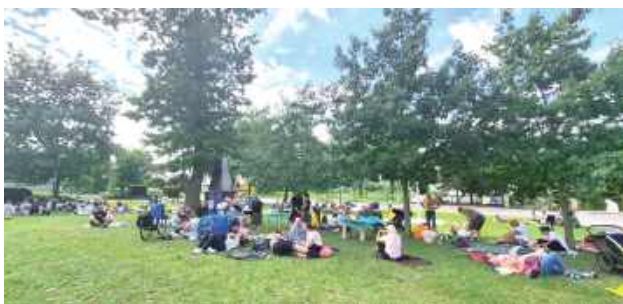
Pątnicy skorzystali z gościnności mieszkańców Baranowa i odsapnęli przed dalszą drogą

Pielgrzymi z kolumny podlaskiej mogli się posilić i odpocząć przed dalszą drogą na Jasną Górę. Wcześniej, jeszcze w lipcu gościli uczestników rowerowej pielgrzymki z Mazowsza.