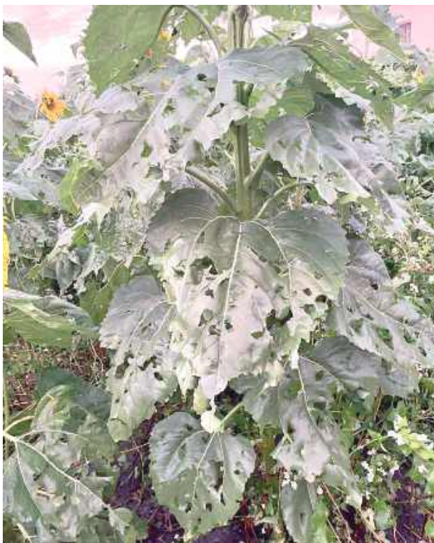
Takie szkody grad wyrządził np. na plantacji słonecznika

W tym roku wakacyjna pogoda nas nie rozpieszcza. W niedzielę 3 sierpnia nad powiatem znów przeszła burza. Choć poranek przywitał nas pięknym słońcem i isticie letnią temperaturą, sięgającą w późniejszych godzinach blisko 30 stopni Celsjusza, to po południu nad regionem zaczęły zbierać się ciemne chmury. Tym razem obyło się bez wiatru, który najczęściej