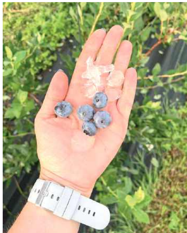
Takiej wielkości gradziny leżały na plantacji borówki