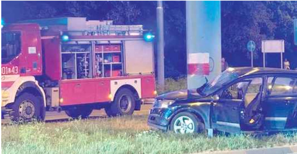
Kierujący samochodem marki Opel stracił panowanie nad pojazdem, zjechał na lewą stronę jezdni, a następnie na pas rozdzielający jezdnię, po czym prawym bokiem pojazdu uderzył w filar kładki dla pieszych

- Ze wstępnych ustaleń policjantów wynikało, iż kierujący samochodem marki Opel stracił panowanie nad pojazdem, zjechał na lewą stronę jezdni, a następnie na pas rozdzielający jezdnię, po czym prawym bokiem pojazdu uderzył w filar kładki dla pieszych. W wyniku zdarzenia z poważnymi obrażeniami ciała do szpitala trafiła 40-letnia pasażerka Opla. Jak się okazało, 39-letni kierowca był kompletnie pijany. Badanie alkomatem wykazało ponad 2 promile alkoholu w organizmie. Dodatkowo mężczyzna posiadał dożywotni zakaz kierowania pojazdami. Od razu został przez policjantów zatrzymany - informuje podinspektor Kamil Gołębiowski z KMP w Lublinie.