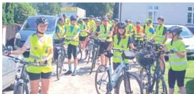
Jeszcze w lipcu do Baranowa zawitała rowerowa pielgrzymka z Mazowsza

uczestnicy Pieszej Pielgrzymki Podlaskiej na Jasną Górę. Pielgrzymi z północnych powiatów naszego województwa wyruszyli w drogę w czwartek 31 lipca i w piątek 1 sierpnia. Do Baranowa doszli w poniedziałkowe wczesne popołudnie. Przy budynku tamtejszego Gminnego Centrum Kultury zameldowali się około godz. 13:00. Tam czekali na nich już seniorzy z ciepłym posiłkiem