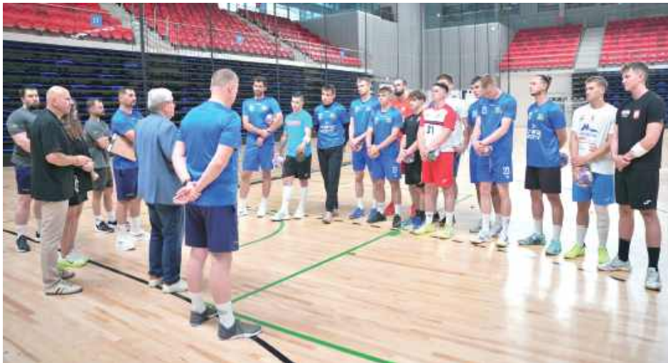
Znamy kadre Azotów Puławy, która powalczy o punkty w Orlen Superlidze